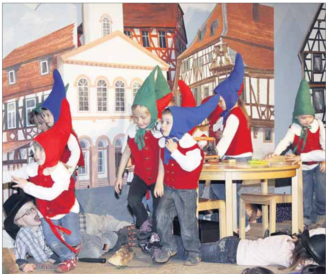
Der TGM-Sängerchor ist mit den „Heinzelmännchen“ auf Erfolgskurs.

Singspiel „Die Heinzelmännchen von Köln“ der TGM-Kinderchorgruppen: