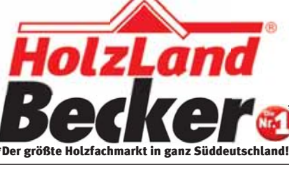
*Der größte Holzfachmarkt in ganz Süddeutschland!