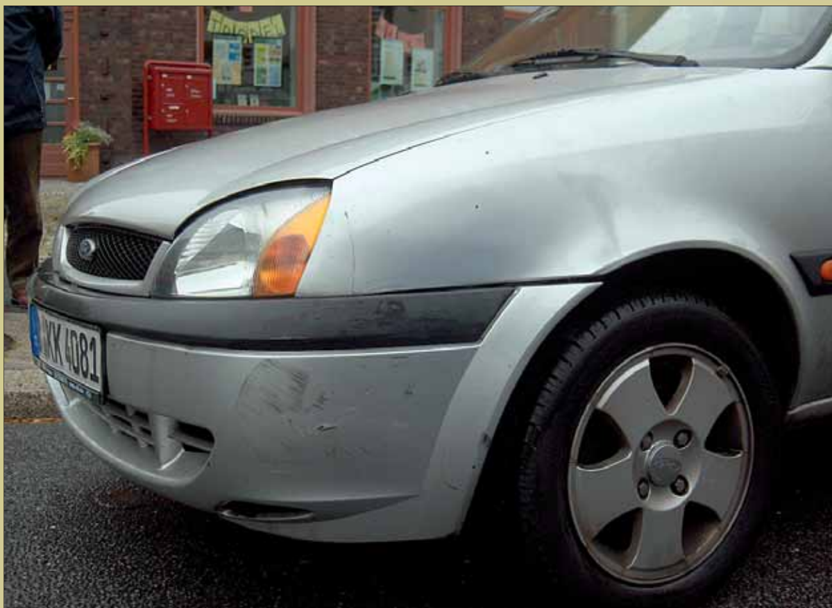
ips/Cb. Kann zur Anwaltssache werden: Unfallschaden

ips/Cb. Durch die Inanspruchnahme rechtsanwaltlicher Dienste werden Gebühren fällig. In Deutschland sind die Anwaltsgebühren durch das Rechtsanwaltsvergütungsgesetz (RVG) gesetzlich geregelt. Je nach betroffenem