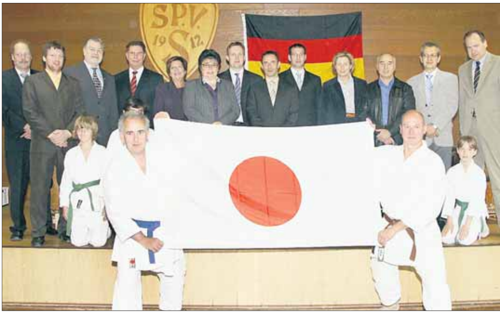
Jubilare und Gratulanten freuten sich über die gelungene Feier der Karateabteilung.

Seligenstadt - Fernöstliche Trommelklänge leiteten am Sonntag im Vereinsheim der Sportvereine die Feierstunde ein: Die Karateabteilung des traditionsreichen Vereines beging ihr 30-jähriges Bestehen mit einer akademischen Feier,