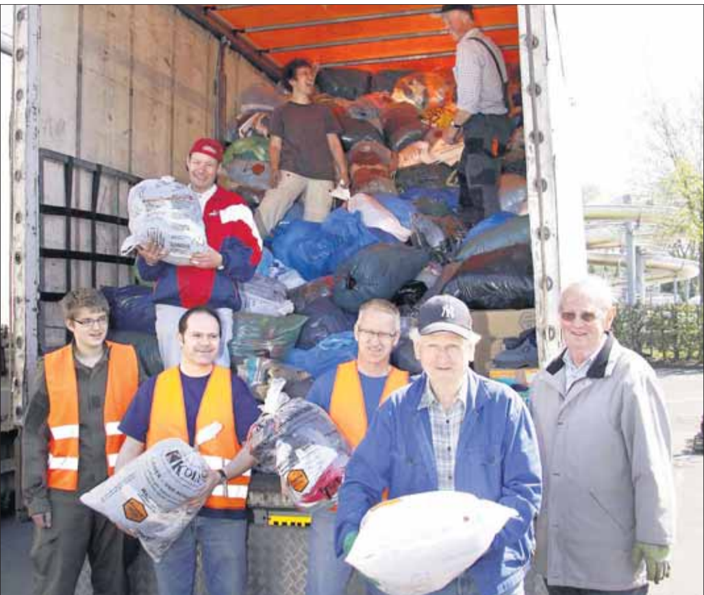
Die Kolpingfamilien aus Froschhausen, Klein Krotzenburg, Klein Welsheim und Seligenstadt bedanken sich sehr herzlich bei der Bevölkerung des Ostkreises, für den überragenden Zuspruch unserer Gebrauchtkleidersammlung vom Samstag, 24. April 2010. Über 22 Tonnen Altkleider wurden gesammelt. Ein besonderer Dank gilt auch den Firmen, welche die Sammelfahrzeuge zur Verfügung gestellt haben.