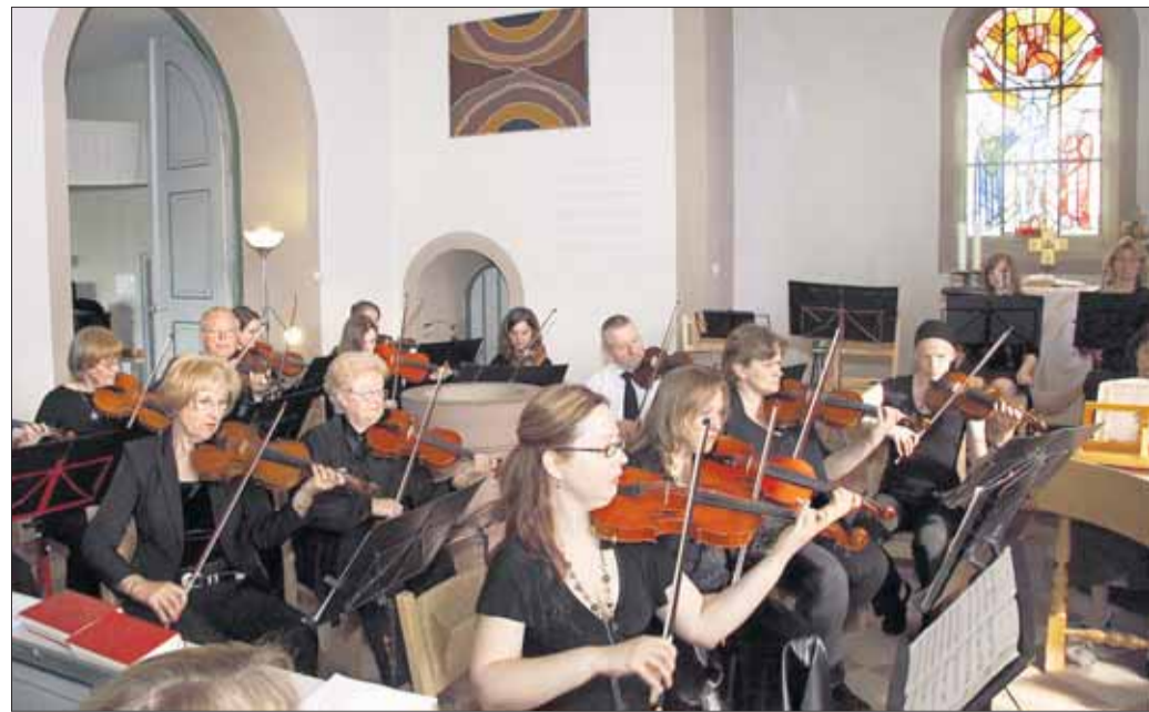
Festliche Tafelmusik in der evangelischen Kirche - das Kammerorchester der Stadtkapelle traf auf begeisterte Musikfreunde.

Festliche Tafelmusik des Kammerorchesters auf hohem Niveau: