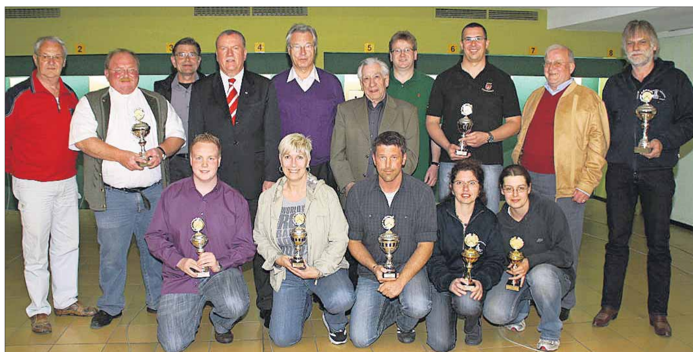
Siegerehrung im großen Vereinsring-Pokal-Turnier mit dem Verein IG Hund und Mensch an der Spitze.

Hotel „Weßner Hof“, 2 x 3 Gänge-Menü am Abend, Eintritt zur Landeshortschau in Rosenheim, Schnaps-Probe, Chiemsee-Schiffahrt zur Herren- und Fraueninsel mit Aufenthalt, Abschlußabend Preis 195 Euro. Anmeldungen nimmt Joschi Burghardt Tel: 67231 entgegen.