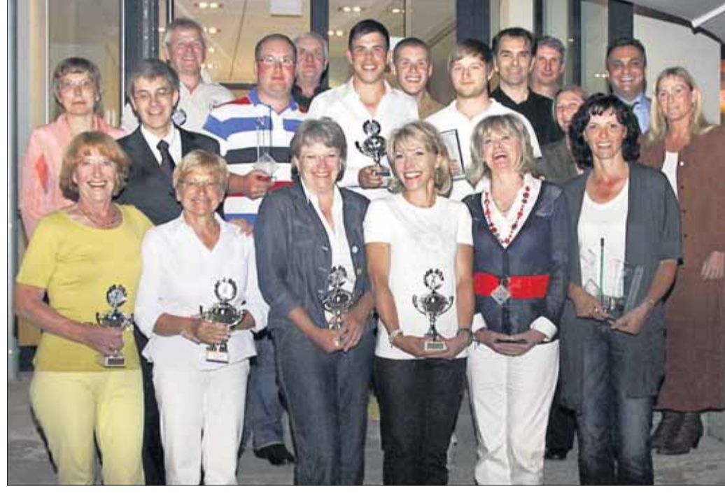
Zahlreiche Mitglieder des Golfclubs Seligenstadt am Kortenbach und Gäste der Asklepios Klinik Seligenstadt traten an zum 5. Golf Cup der Asklepios Kliniken. Nach spannenden Runden auf dem weitläufigen Gelände kamen überraschende Ergebnisse zu Tage, die im clubeigenen Restaurant gebührend gefeiert wurden. Unser Bild zeigt die strahlenden Sieger nach der Pokal-Ehrung.