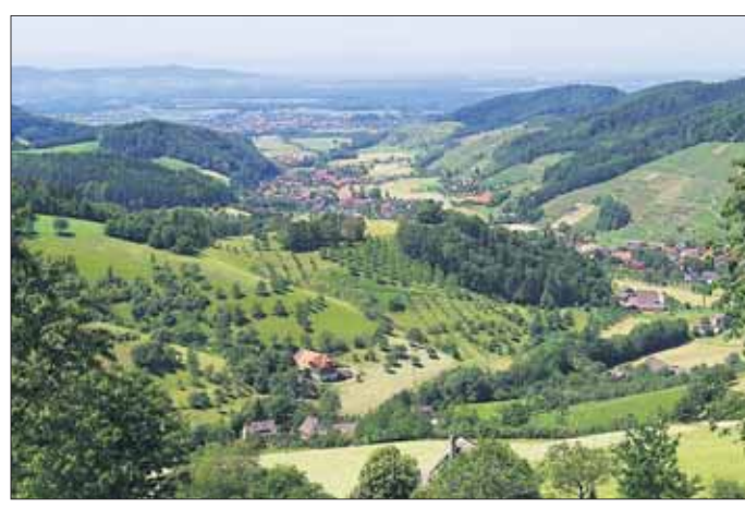
Der Blick über das Glottertal nach Westen.

Das Glottertal verbindet den Breisgau mit dem Hochschwarzwald zu einer Urlaubslandschaft besonderer Art. Auf fast 1000 Höhenmeter erstreckt sich die Gemarkung der Gemeinde vom Rande des Breisgaus bis hinauf zu den Schwarzwaldgipfeln und bietet damit eine enorme landschaftliche Vielfalt. Unten im sonnenverwöhnten Tal finden sich Weinberge und bunte Streuobstwiesen. Wälder und Höhen gibt es rund um den sagenumwobenen Kandelgipfel. Naturfreunde und Wanderer kommen dort auf ihre Kosten.