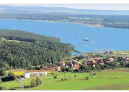
Der Blick über den Großen Brombachsee.

Sterne-Bereich deutschlandweit den 1. Platz. Die Zimmer und Appartements sind im Landhausstil mit viel Liebe zum Detail eingerichtet. Die Panoramakönigin“ in ruhiger Südhänglage. Das familiär geführte Hotel wurde mit dem 1. Platz in der Kategorie Urlaubs- und Ferienhotel beim „Gastronomiepreis Franken 2007, 2008 und 2009“ ausgezeichnet. Seiner persönlichen Atmosphäre und dem All-Suiten-Charakter verdankt das Haus zahlreiche Auszeichnungen beim EHF-Hotelwettbewerb „Von Gästen empfohlen – die Beliebtesten Hotels“. Hier erreichte das Landhotel in den Jahren 2007 bis 2009 im Vier-