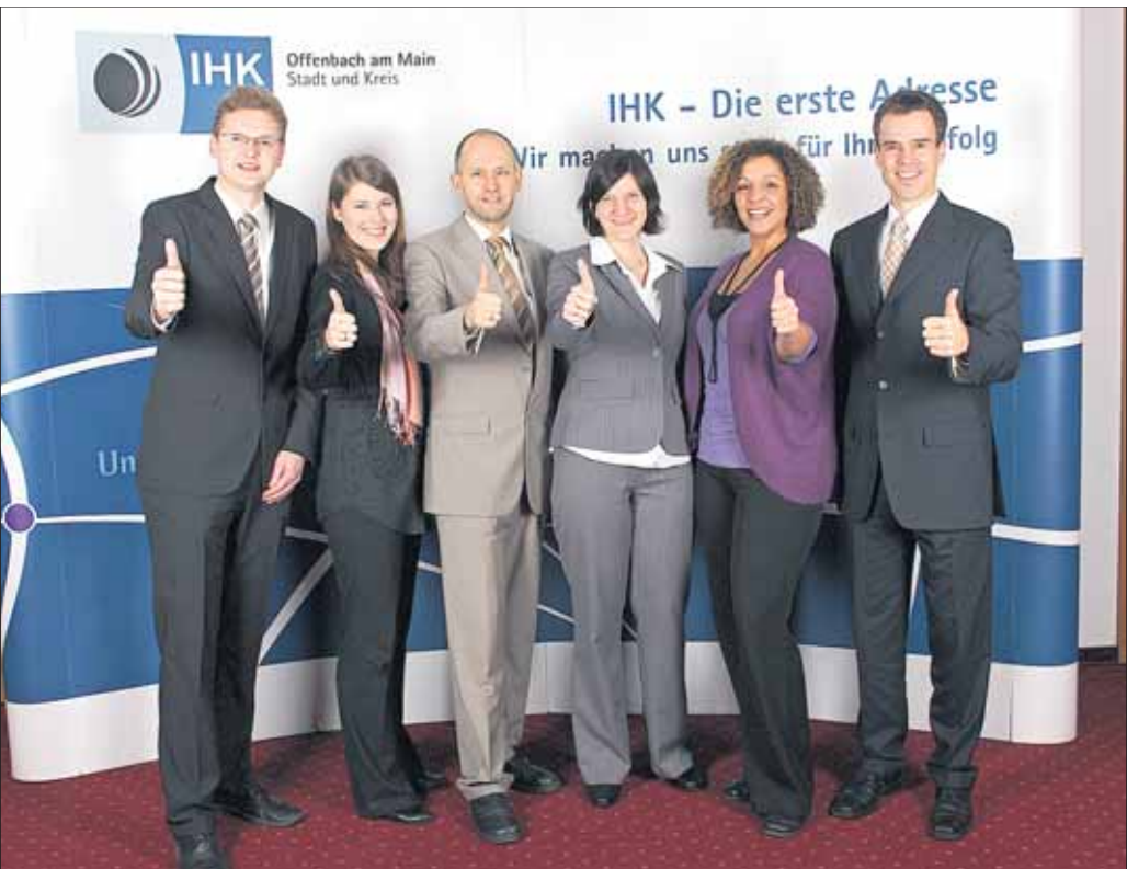
Das Team der Starhilfe und Unternehmensförderung der IHK Offenbach versorgt Gründer mit allen notwendigen Informationen und hilft bei der Erstellung eines Unternehmenskonzeptes.

IHK Offenbach versorgt Gründer mit den nötigen Informationen