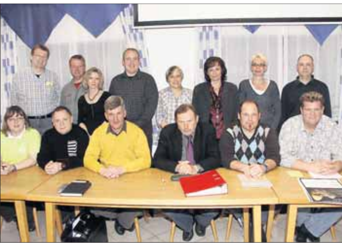
Der Vorstand der Mainflingerer Hundesportler bedankte sich bei der Versammlung für das Vertrauen.