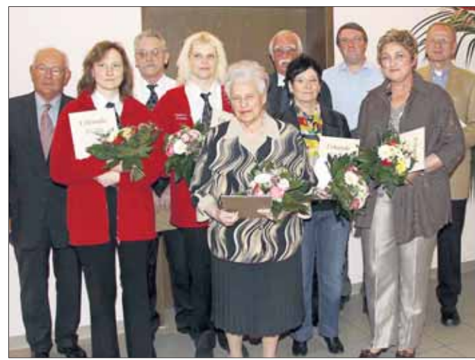
Die Jubilare der Freien Turner auf einen Blick.