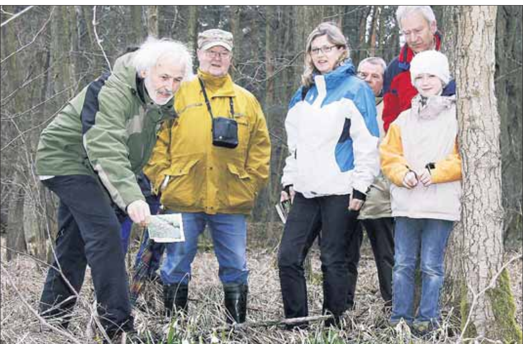
Der Märzenbecherbestand im Erlbruch des Hainstädter Waldes im Naturschutzgebiet „Langhorst“ hat in den letzten Jahren erheblich zugenommen. Davon konnten sich die Teilnehmer des Frühblüherrundgangs zu dem der Bund für Umwelt- und Naturschutz Deutschland (BUND) und die Arbeitsgemeinschaft „Mensch und Umwelt“ (AMU) eingeladen hatten, am vergangenen Sonntag überzeugen. Der hohe Wasserstand und die Sonneneinstrahlung in dem lichten Bruchwald begünstigen die Ausbreitung der Frühlingsknotenblume, wie der Märzenbecher auch genannt wird. Buschwindröschen und Scharbockskraut haben nach dem langen Winter ihre Blüten noch nicht voll entfaltet und der Aronstab lässt bislang nur seine Blätter erkennen.