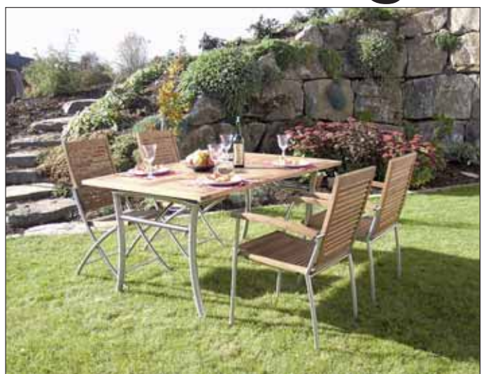
Die innovativsten Kollektionen für alle Garten- und Wohnfreunde sind in die neue Ausstellung eingezogen. Ob Gartenmöbel, Terrassenbelag, Sichtschutz oder Spielgeräte – das gesamte Sortiment wurde „messefrisch“ eingelagert.

Auch in der kommenden Saison boomen – da sind sich die Fachberater im HolzLand Becker sicher – Outdoordielen. Hier bietet HolzLand Becker seit Jahren das größte Terrassenboden- und Konstruktionsholzsoriment der Region an. Alle lieferbaren Holzarten aber auch Newcomer, wie die aktuellsten WPC-Dielen sind jetzt schon ab Lager Obertshausen verfügbar. Hier warten 150.000 laufende Meter Dielen auf ihren neuen Einsatzort. Mengen, die kein anderer der Region auf Lager hat. Neben Kesseldruckimprägnierten Nadelhölzern wie Fichte und Kiefer, Douglasie und Lärche, zählen astfreie Hartholzarten wie z.B. Bangkirai und Garapa und natürlich damit auch FSC-zertifizierte Terrassendielen zu dem umfassenden Angebot aus Obertshausen. Hit der Saison 2009 waren nicht zuletzt Terrassendecks mit „Click-Technik“ und Terrassendecks aus heimischen Hölzern, die z. B. wärmebehandelt wurden und so in Bezug auf Festigkeit und Dauerhaftigkeit absolute Spitzenwerte zeigen und in Bezug auf den Schutz von Tropenwäldern und Regionalität der Produkte eine sinnvolle Alternative bieten. „Worauf muss ich bei der Gestaltung von Terrasse und Weg achten?“ – Diese Frage beantworten regelmäßig Verlege-Seminare im HolzLand Becker, die den Gartenfans zeigen, wie schnell der Traum von einer stimmungsvollen Holzterrasse Wirklichkeit werden kann – und auch natürlich hier gelten ab sofort noch bis 17. April die unschlagbaren HolzLand Becker-Saison-Eröffnungs-Rabatte.