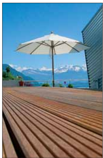
Auch in dieser Saison boomen Outdoordielen – 150.000 laufende Meter warten auf ihren Einsatzort. Mengen, die kein anderer der Region auf Lager hat.

HolzLand Becker Albrecht-Dürer-Straße 25 (direkt an der B 448) 63179 Obertshausen Telefon 0 61 04 / 95 04 - 0 www.holzlandbecker.de