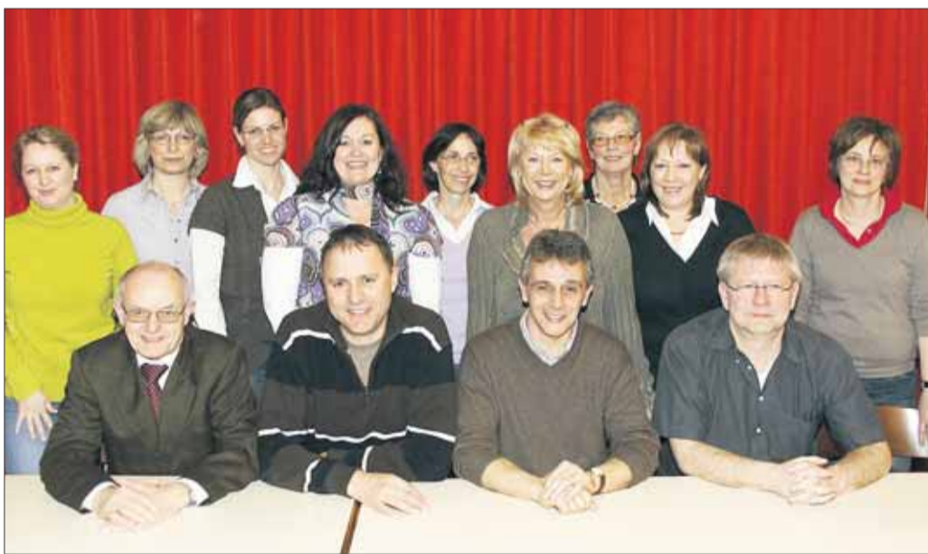
Viel vorgenommen hat sich der Vorstand des Chores an der Basilika.