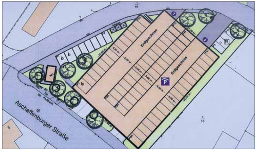
Der Neubau des Parkdecks wird an der südlichen Stadteinfahrt am Friedhof gebaut. Das Gelände wurde mittlerweile von Bäumen und Sträuchern geräumt.

„Schon bei der Planung der neuen WC-Anlage am Friedhof wurde in der Stadtverordnetenversammlung im November 2006 ein Grundrissplan mit genauer Aufteilung des zukünftigen Parkhauses vorgelegt, welcher zustimmend zur Kenntnis genommen wurde“, erläutert die Rathauschefin. Aus Geldmangel wurde seinerzeit nur die WC-Anlage gebaut. Für das Parkdeck konnten weder Planungs- noch Baukosten in Haushalt der Stadt etatisiert werden. Erst durch das Konjunkturförderprogramm von Bund und Land konnte die Maßnahme nach Stadtverordnetenbeschluss Ende April