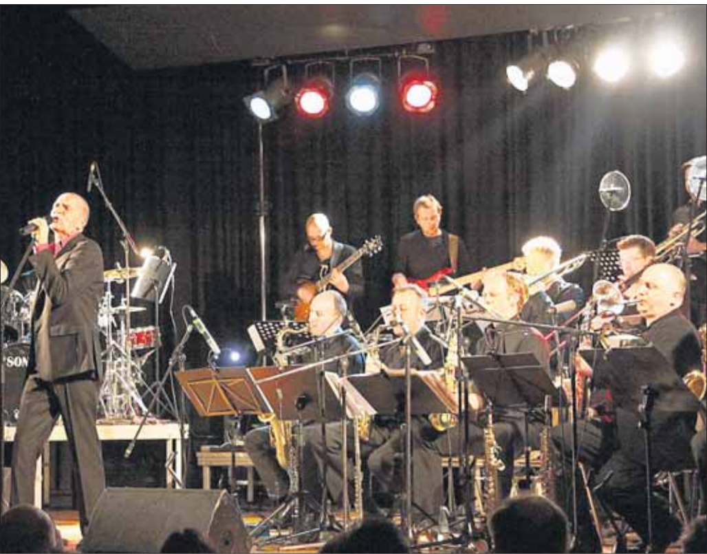
Der komplett ausverkaufte Riesen-Saal bebte: Was die Bigband East 17 um Stefan Weilmünster, Norbert Zabolitzki und Mathias Neubauer auf die Beine gestellt hatte, ließ niemanden ruhig auf seinem Stuhl sitzen. Sicherlich ein Hauptgrund für die sensationelle Stimmung: Sänger Michael Sadler, kanadische Rockmusik-Legende, Frontmann der Pop-Rock-Gruppe Saga. Dazu der druckvolle Sound der Bläser und die perfekt auf einander abgestimmte Rhythmus-Sektion - Klasse, einfach Wahnsinn. Superlative sind uneingeschränkt bei diesem Musik-Ereignis angebracht. Geheimnis des Konzerts: Die Grundstrukturen der Pop- und Rockklassiker, unter anderem Phil Collins-Nummern, aber auch VanHalen und AC/DC-Stücke, blieben nahezu unangetastet, die Songs wurden aber dem Sound und Swing einer Bigband angepasst. Als nach zwei Stunden das Konzert beendet war, gab es nur glückliche und zufriedene Gesichter. th