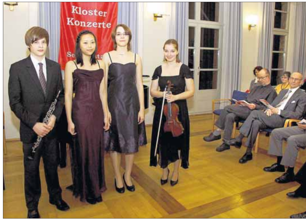
Die jungen Elite-Musiker faszinierten das Publikum der Klosterkonzerte mit bemerkenswert interpretierten Meisterwerken.