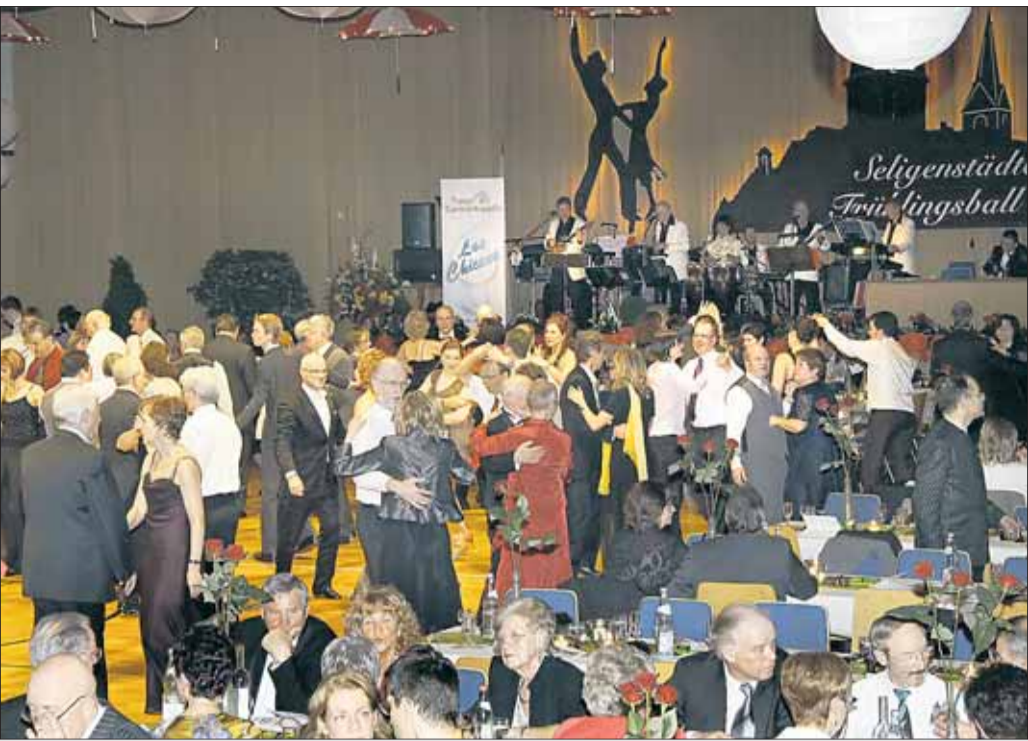
Es war wieder einmal ein gelungener Frühlingsball der Tanzsportabteilung Rot-Weiss der TGS Seligenstadt. Die Tanzturnierkapelle „Los Chiccos“ eröffnete den Abend mit einem schwungvollen Wiener Walzer. Das Publikum stürmte dankbar das Parkett bevor die Paare des Senioren 51 Standardturniers vorgestellt wurden. Nach der namentlichen Vorstellung der Paare und der ersten Tanzrunde stellte es sich heraus, dass es sich diesmal um ein sehr hochwertiges Turnier handelte. Als Termin für den Frühlingsball 2011 können sich Interessierte schon den 19. März 2011, vormerken.