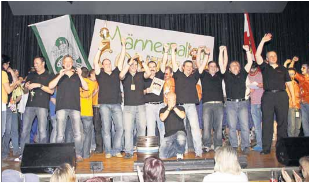
Die bestens trainierten Männer der Klein-Krotzenburger Turnerschaft gingen als strahlende Sieger des Männerbalett-Contests hervor.