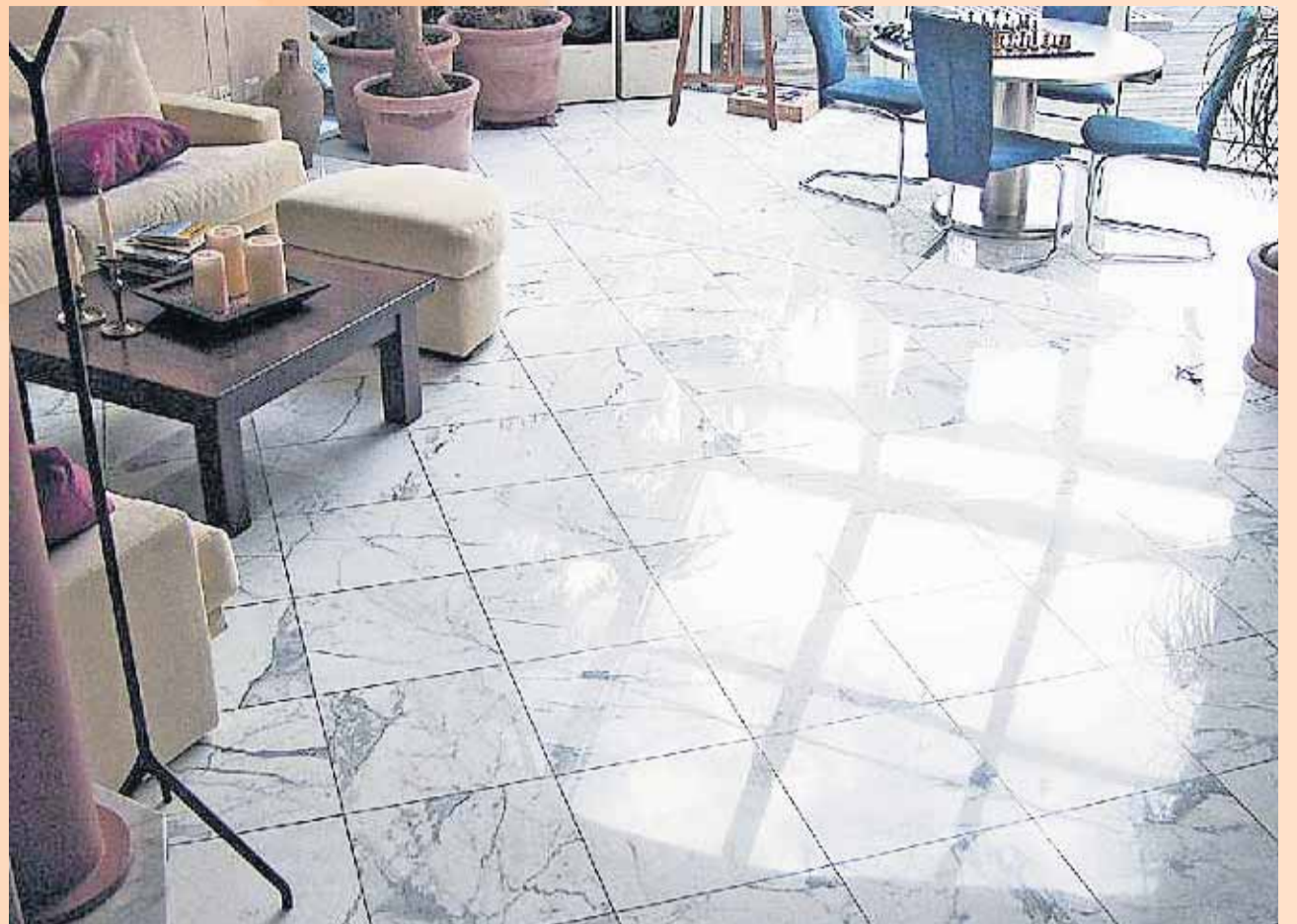
lps/Du. Naturstein hält nach der Kristallisierung auch bei Sonnenlicht jeder optischen Prüfung stand.