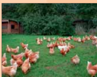
lps/Bo. Eier aus Freilandhaltung bieten Vorteile für Tier und Mensch.

und bei Eiern und Ostereierfarbe auf das Biosiegel zu achten. In Deutschland werden nach wie vor zu wenige Bio-Eier produziert. Der Bund für Umwelt und Naturschutz Deutschland (BUND) weist darauf hin, dass 2007 rund ein Viertel aller in Deutschland verkauften Bio-Eier importiert werden mussten, überwiegend aus den EU-Nachbarländern und der