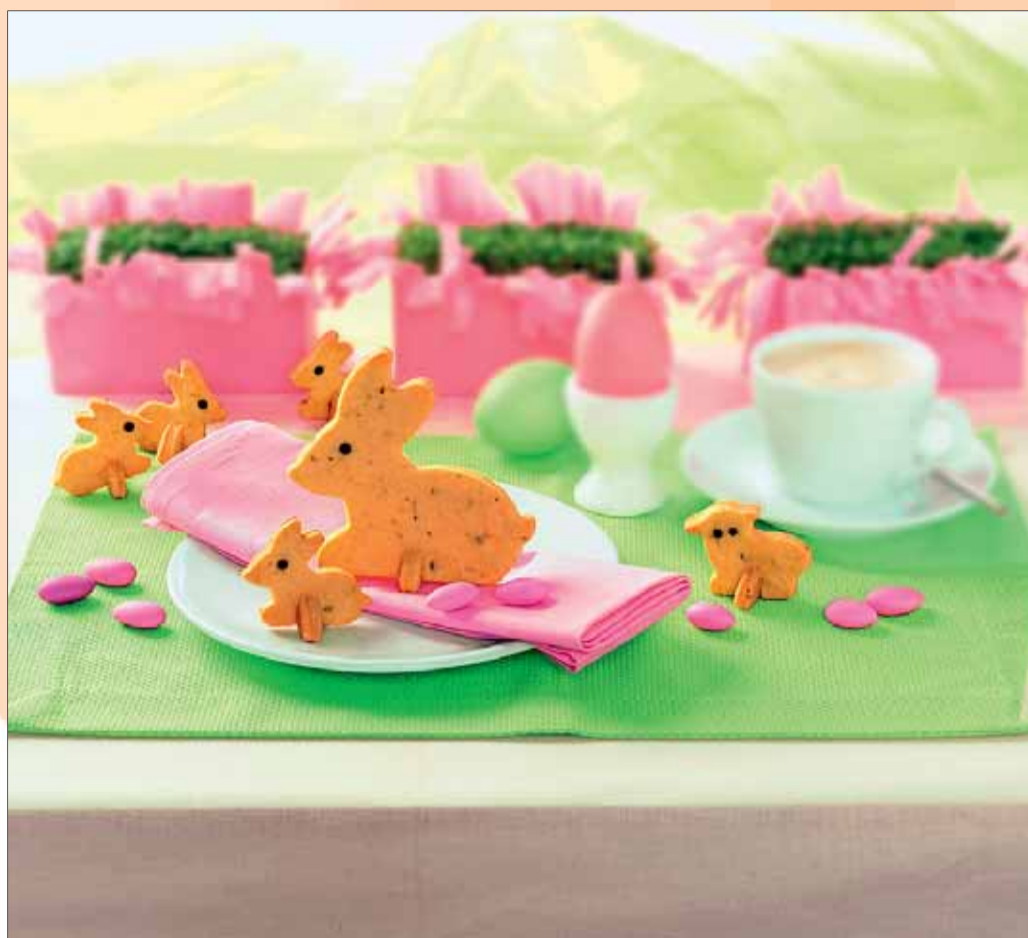
Ips/Bo. Diese Osterhasen sind zum Anbeißen.