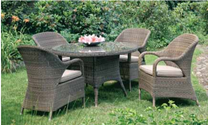
Sessel Kunstfasergeflecht, olive-braun 329,- Euro, Tisch (Ø 120 cm) mit Glasplatte 569,- Euro

auf 500 m 2 hochwertige Gartenmöbel in Geflecht, Teak, Kunststoff und Metall