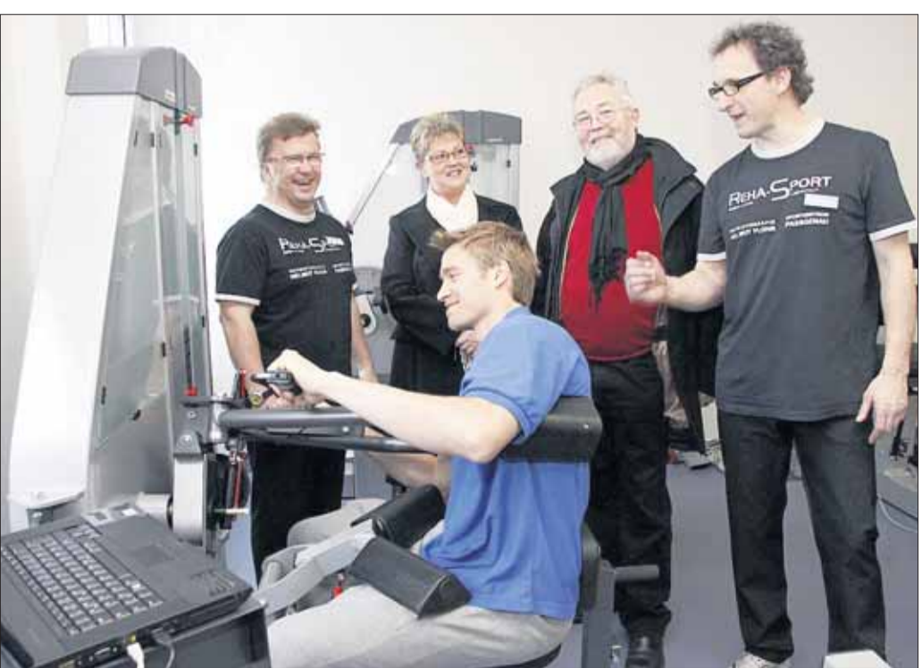
REHA-SPORT Seligenstadt (im Hause Emma-Klinik) hatte seine Türen am vergangenen Sonntag weit geöffnet und zahlreiche Besucher rund um die Qualifizierung zum FPZ-Rückenzentrum informiert. Das REHA-SPORT Seligenstadt ist seit Anfang März autorisiert, an „proxomed Premiumgeräten“ der „tergumed Linie“ eine „Integrierte Funktionelle Rückenschmerztherapie“ durchzuführen. Diese kann über einen Facharzt verschrieben und somit auch über bestimmte Krankenkassen (BKK's und GEK) abgerechnet werden. Im Kreis Offenbach und am Untermain ist diese Qualitätssicherung des Rückentrainings bislang einmalig. Außerdem konnten die Besucher den renovierten und erweiterten Gerätepark anschauen und ausprobieren.