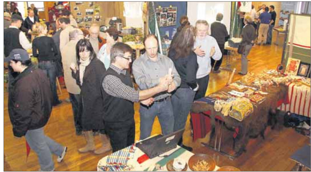
Die siebente Froschhausener Vereinsbörse präsentierte sich als eindrucksvoller Leistungsnachweis der Vereinsfamilie. 25 Vereine, Verbände und Organisationen gaben im großen Saal, Foyer und Nebenräume sowie vor dem Bürgerhaus, Einblicke in ihre Arbeit.