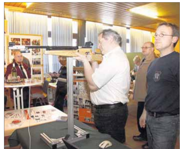
Reges Interesse am Stand der „Tell“-Schützen.