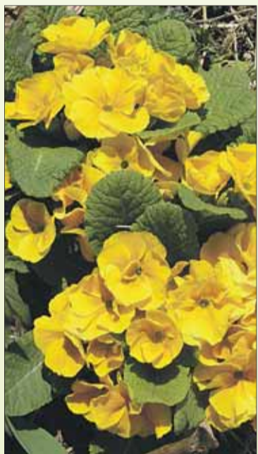
Erste Frühlingsboten.