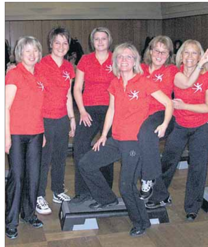
1910 wurde die Abteilung Gymnastik der Seligenstädter Turngesellschaft gegründet. In diesem Jubiläumsjahr haben die Gymnastikdamen einiges vor. Mit rund 350 Mitgliedern ist die Abteilung Gymnastik die größte Abteilung des größten Vereins. Im Jubiläumsjahr 2010 hat sich die Abteilung Gymnastik zahlreiche Highlights auf die Fahnen geschrieben. Wir berichten darüber ausführlich auf Seite 3.

ne Mannschaft einer JSG pro Altersklasse am Spielbetrieb teilnehmen kann. In Verhandlungen konnte erreicht werden, dass der Spielbetrieb in der geplanten Form nochmals durchgeführt werden kann. Der HFV machte die Auflage, ab der Saison 2010/11 zu einem JFV zu fusionieren - da eine JSG in ähnlicher Konstellation abgelehnt würde. Dies war ein Schock für die Verantwortlichen der „rot-blauen“ Jugendleitungen, da alle Modalitäten für den Spiel- und Trainingsbetrieb einschließlich Trainer sowie der zu nutzenden Sportstätten für den Sportbetrieb abgesprochen und koordiniert waren. ● Seite 2.