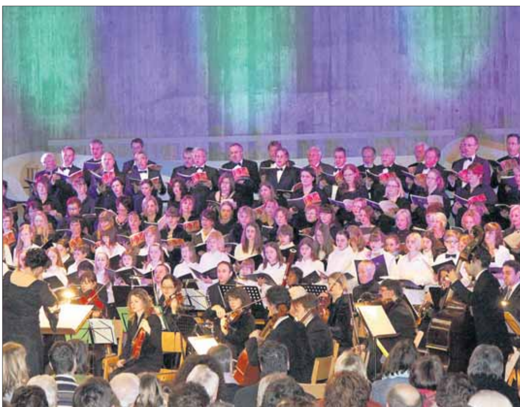
Stimmgewaltiges Erlebnis in St. Marien.