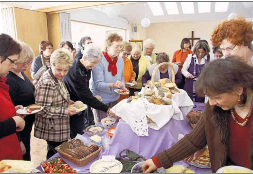
Grenzenlos gemeinsam - unter diesem Motto stand der gut besuchte Internationale Frauentag am vergangenen Montag in Hainburg. Er begann mit einem Frühstück im evangelischen Gemeindehaus Hainstadt. Zu sehen gab es die Wanderausstellung „Trotz allem - ich lebe. Kunststücke von Flüchtlingsfrauen.“ F. Mertins erzählte ihre Geschichte über „Fluchtwege - Lebenswege“.