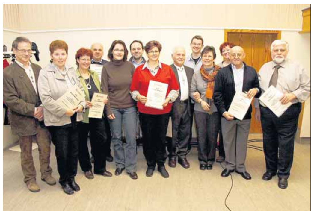
Großprojekt bei Edelweiß: Seine Jahresversammlung veranstaltete der Wandercub Edelweiß in Seligenstadt am vergangenen Freitag im Vereinsheim an der Steinheimer Straße. Auf dem Programm standen umfassende Berichte aus dem Vorstand und Vorstandswahlen, außerdem wurden langjährige Vereinsmitglieder geehrt. Unser Foto zeigt Vorstand und Jubilare des Edelweiß auf einen Blick. In diesem Jahr richtet der Seligenstädter Wanderverein das große Spessartbundfest aus, welches parallel zum Hüttenfest stattfindet. Die Vorbereitungen dazu laufen bereits auf Hochtouren.

Seligenstadt - Der Sängerkhor der Turngemeinde 1848 Seligenstadt lädt seine Mitglieder zur Jahresversammlung am Samstag, 20. März, um 20 Uhr, ins Vereinsheim, Steinheimer Straße ein.