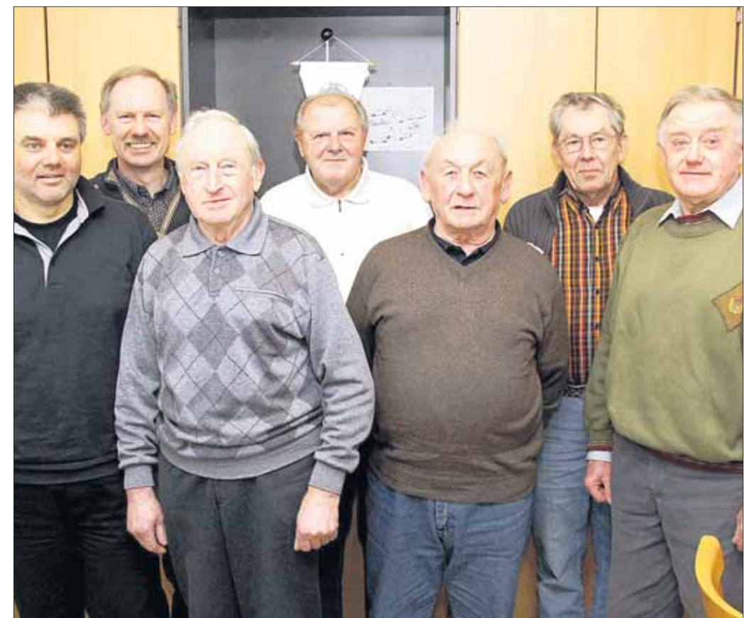
Eine gut besuchte Jahresversammlung hatte der Motorsportclub Hainstadt (ADAC Hessen-Thüringen) am vergangenen Freitag. Auf der Tagesordnung standen die Jahresberichte und Vorstandswahlen. Unser Bild zeigt das bewährte Führungsteam, mit dem der MSC ins neue Vereinsjahr geht.

Man hat meine Mutter im Simeonstift trotz ihrer Lage ein Umfeld geschaffen, in dem sie sich wohl fühlte. Sie hat bis zum Schluss betont, wie froh sie sei, dass sie noch leben dürfe und dass sie deshalb auch noch ihre Urenkel erleben durfte. Ich weiß auch, dass es auch im Simeonstift sicher Anlass zu Kritik geben wird, meine Mutter und auch ich haben diesen Anlass zu haben und auch immer alles mit dem Pfl egeteam,