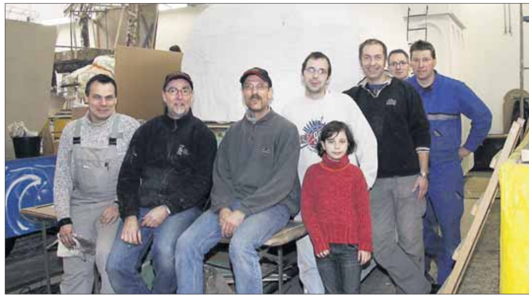
Wenn man sie zum Wagenbau ruft, dann sind sie da, die Einhardwiwwel.

Für die Fußgruppen und Wagenbauer am Rosenmontagszug geht der Spaß jetzt wieder richtig los!