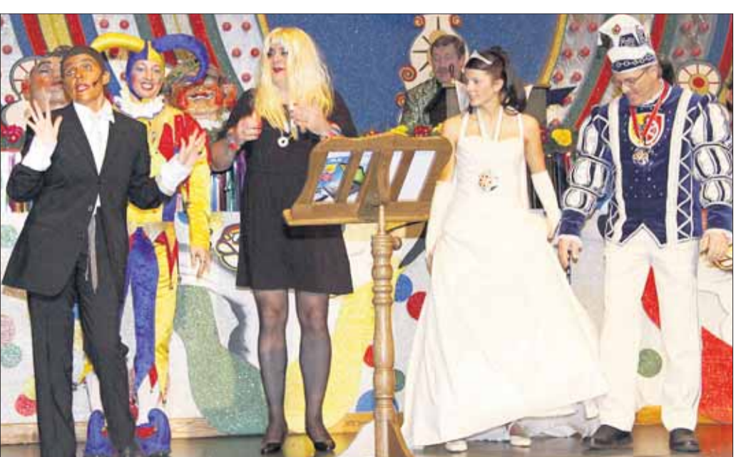
Das „Spiel mit dem Prinzenpaar“ ist bei den „Freunden“ gute Tradition.