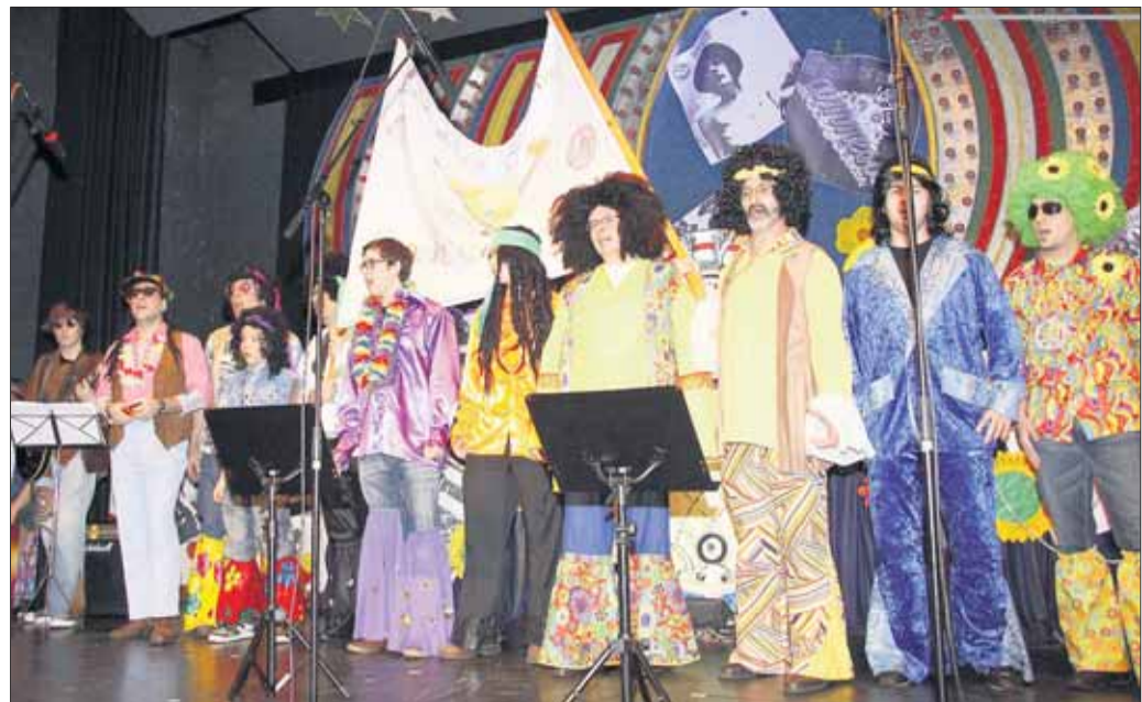
Gelungene Gaudi: Der Vater und Sohn-Chor hatte eine gefeierte Premiere.