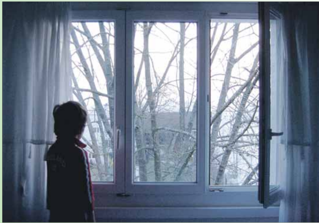
ips/Du. Wer effektiv lüften will, sollte das Fenster mehrmals täglich ganz öffnen

haltung einer bestimmten Temperatur. Entsprechend sollte auch bei wenigen Tagen Abwesenheit weiter geheizt werden.