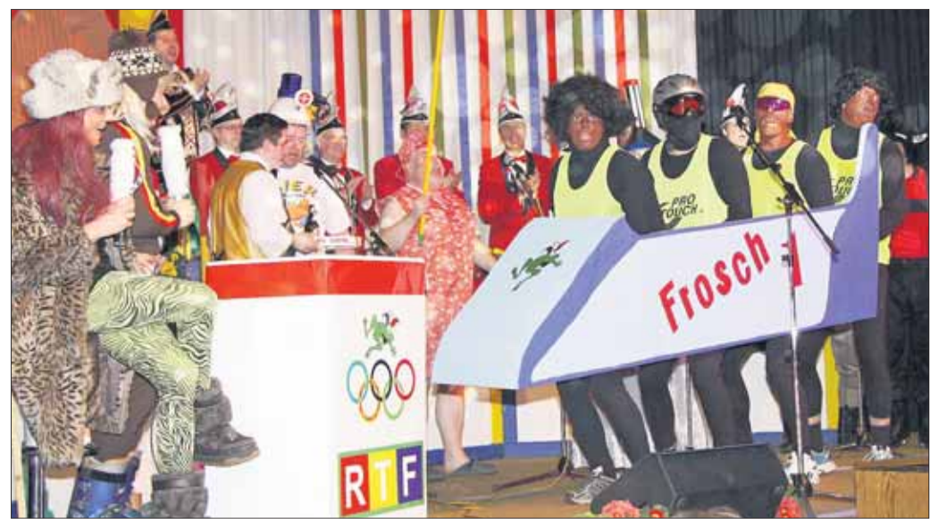
Die Super-Athleten der Harmonisten präsentierten eine gigantische „Winter-Olympiade“.