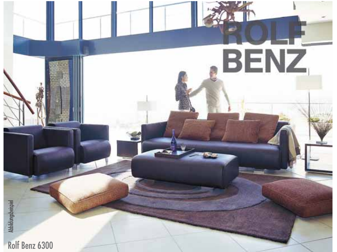
Rolf Benz 6300

ANNO DOM Bücherwand Sesssion, Kirschbaum, ca. 300 cm anstatt 8.490,- Inventur-Verkaufs- Preis 1.980,-