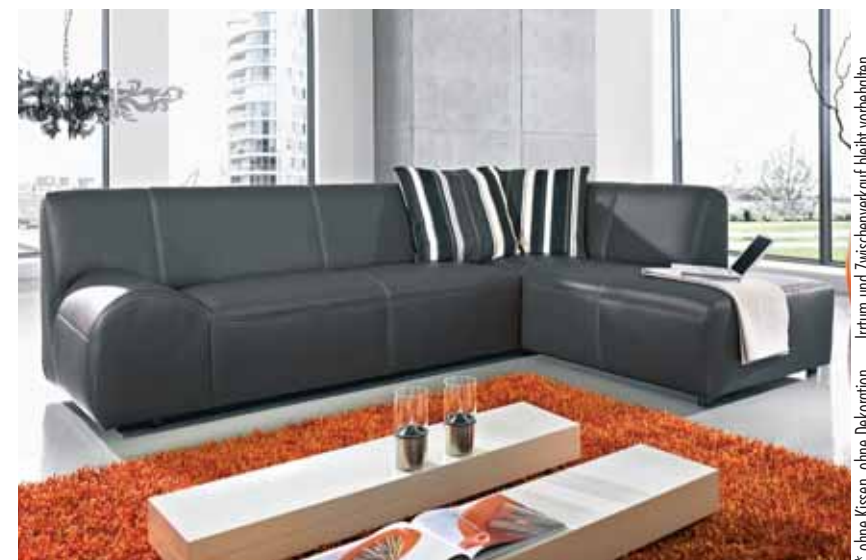
Ecksofa Classico mio wie abgebildet*, verfügbar in Leder braun oder schwarz

SCHOLTISSEK Anrichte Quintum, Kirschbaum, 240 cm, Glasfront anstatt 4.998,- Inventur-Verkaufs- Preis 1.998,-