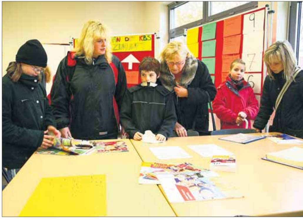
Fit in die Zukunft mit dem Förderkonzept der Hauptschularbeit an der Kreuzburgschule in Hainburg. Auch darüber wurde während der Veranstaltung „Offene KBS“ informiert.