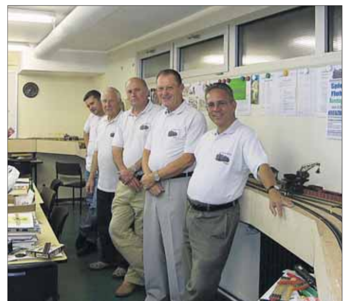
Die Baugruppe der Eisenbahnfreunde bereitet wieder eine sehenswerte Ausstellung vor und lädt herzlich ein.

Im laufenden Jahr wurde außerdem ein Schwerpunkt innerhalb der Vereinsarbeit auf die Erweiterung der Vereinsanlage gesetzt. Dank des eifrigen Einsatzes der Dienstags-Baugruppe wurden die Rohbauarbeiten an den einzelnen Trassenmodulen frühzeitig abgeschlossen und auch die Bestückung des neuen Anlagenteils mit Gleisen, Modellgebäuden und Landschaftselementen ist schon gut vorangekommen.