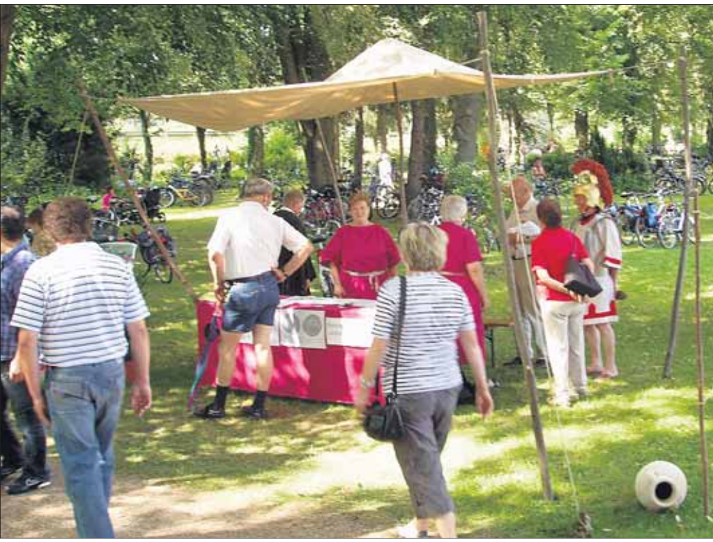
Münznachprägungen und historische Schriften aus Hainburg waren beim Römerfest in Obernburg gefragt.

Römerfest für Geschichtsverein großer Erfolg: