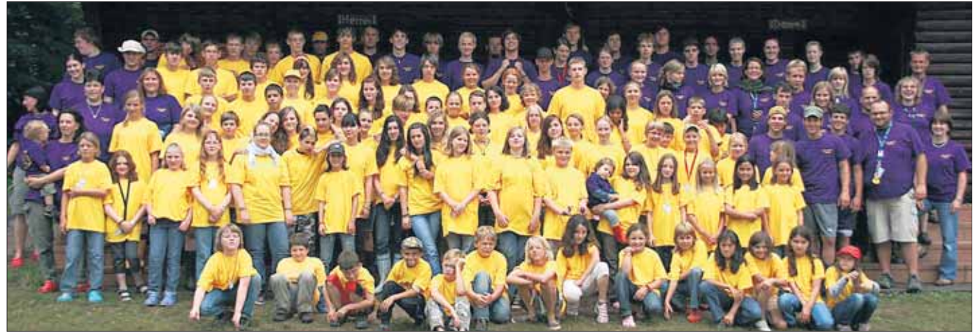
87 Urlauber zwischen 9 und 14 Jahren machten Breitenbrunn im Spessart zum schonsten Strandclub Deutschlands.

Seligenstadt - „Club!“ - „Urlaub!!“; Schon der Schlachtruf lie erkennen, dass das Motto des diesjahrigen Zeltlagers der Basilika-Pfarrei ganz im Zeichen von Sommer, Sonne und guter Laune stand. Vom 13. bis 23. Juli machten 87 Urlauber zwischen 9 und 14 Jahren Breitenbrunn im Spessart und Umgebung zum schonsten und buntesten Strandclub Deutschlands. Schon bei der Ankunft der Kinder am Montag wurden sie stilgerecht mit Begruungscocktails auf dem liebevoll dekorierten Zeltplatz vom 5-Sterne-Kuchenteam und den Animatoren, die naturlich nicht fehlen durften, in Empfang genommen und augenblicklich stellte sich der Erholungsfaktor ein. Fur langes Durchatmen blieb aber keine Zeit, denn schon ging das Unterhaltungsprogramm los: Was darf in keinem richtigen Eventurlaub fehlen? Spa, Spiele, gutes Essen und...??? Richtig!! Das Maskottchen! An Bewerbern fur diesen beliebten Job mangelte es nicht, sodass die Urlauber sich zwischen der Kuh Elsa, dem Kobold Paddy O'Keggy, Skippy, dem Buschkanguru und Kermit, dem Frosch, entscheiden mussten. Mit ausge-