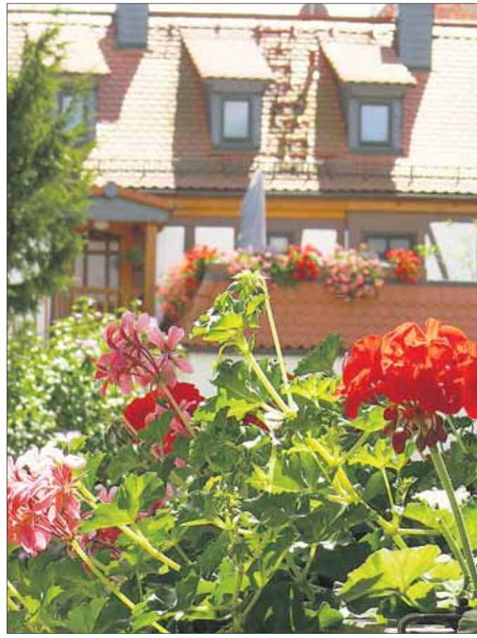
Seligenstadt blüht auf! Üppiger Blumenschmuck in der Altstadt erfreut Anwohner und Gäste. Im August wird die Blumenjury des Heimatbundes unterwegs sein, um die schönsten Blumenarrangements zu ermitteln, welche dann in November bei einem Ehrenabend ausgezeichnet werden sollen.

ein Harmonie Froschhausen werden die Feierstunde musikalisch umrahmen, hiernach wird der Musikverein Weiskirchen die Besucher noch unterhalten. Die Verantwortlichen des Liederfreund freuen sich über eine rege Beteiligung an diesem Abend, es ergeht daher herzliche Einladung an alle Mitglieder und Freunde des Liederfreund. An diesem Abend wird auch die traditionelle Kerb am Sandborn eingeläutet, von Samstag, 8. August bis Montag, 10. August geht es wieder rund am Sängerheim. Auch an diesen Tagen wird sich der Verein, die Dienstleute und die Schausteller über einen regen Besuch freuen.