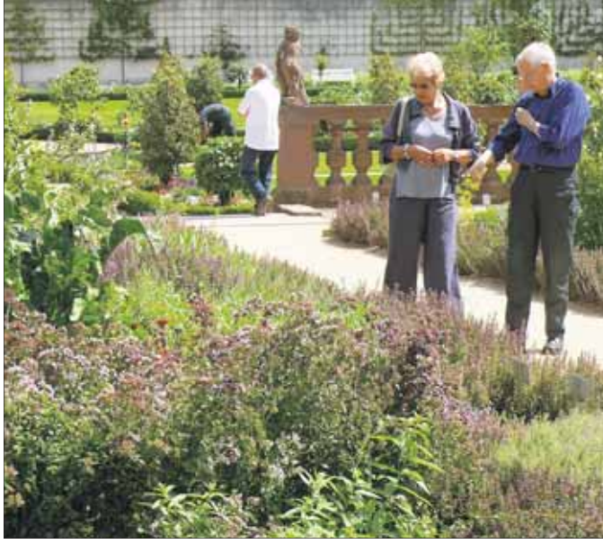
Heilpflanzen haben nichts von ihrer Faszination verloren.