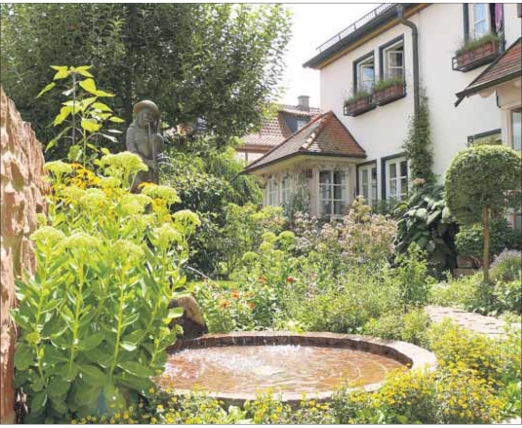
Gartenidylle mitten in der Seligenstädter Altstadt. Mit Phantasie und „grünem Händchen“ wurde diese zauberhafte Oase geschaffen - ein beschaulicher Ort der zum Entspannen einlädt.

Verein Wohnikum erstellt ein Mehrfamilienhaus: