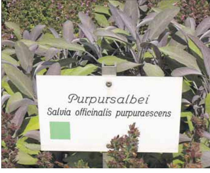
Heilpflanze mit Bezeichnung und Anwendungsgebiet.

im Mittelalter, welche die „Signatur“, die Wirkung der Pflanze zum Ausdruck bringt, zurück zur naturalistischen Abbildung, die schließlich in die ersten, von der Wissenschaft der symbolischen Darstellung des Mittelalters und den naturnahen Pflanzenbildern der Renaissance stehen. Ebenso wird die historische und aktuelle medizinische Bedeutung der Pflanzen behandelt. Der Eintritt beträgt sechs Euro. Treffpunkt ist an der Museumskasse. Um Voranmeldung wird gebeten unter 06182/2 26-40 oder E-Mail: marcus.paschold@schloesser-hessen.com.