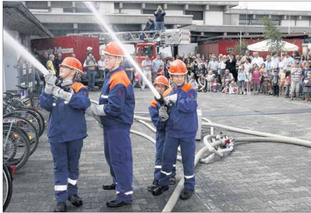
Feuerwehrest war an Pfingsten in Zellhausen bei der Freiwilligen Wehr. Mit im Programm stand auch eine Schauübung der Jugendfeuerwehr mit einem Schaumangriff am Sonntag. beko/Foto: Hampe

des Kreises Offenbach in Mühlheim überreicht. In dieser Einrichtung werden Kinder vorübergehend betreut, die z.B. aus für sie gefährlichen Familiensituationen herausgenommen werden müssen oder die von der Polizei auf der Straße aufgegriffen werden, bis eine geeignete Maßnahme für diese Kinder gefunden wird. Die Einrichtung hat sich sehr über die Spenden gefreut. Der nächste Flohmarkt „Rund ums Kind“ findet am Sonntag, 18. Oktober 2009, im Kilianushaus in Mainhausen-Mainflingen statt.