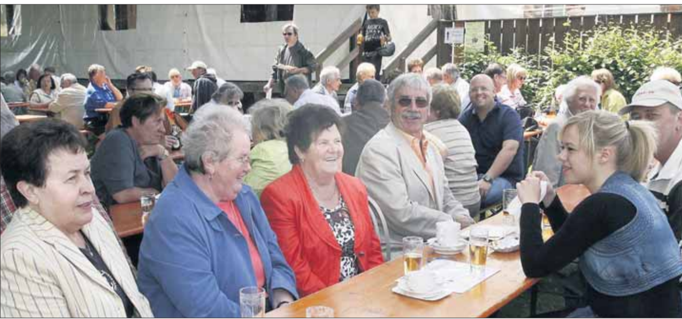
Pfingstfest war beim Sängerbund in Mainflingen am Vereinsheim am Main mit Auftritten am Sonntag des Chores der Sängervereinigung Mainflingen und dem Liederkranz Klein-Welzheim. Am Montag zeigte der Männerchor der Harmonie Zellhausen sein Können.