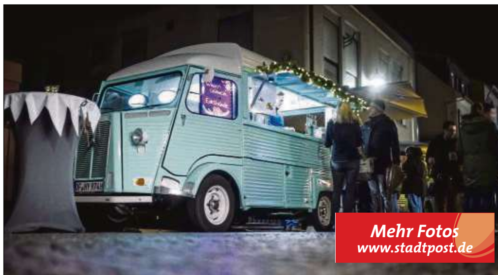
Auch das Team von „Petit Camion“ ist vertreten, diesmal an Wochenenden auch mit dem neuen Food-Truck an der Bahnhofstraße.