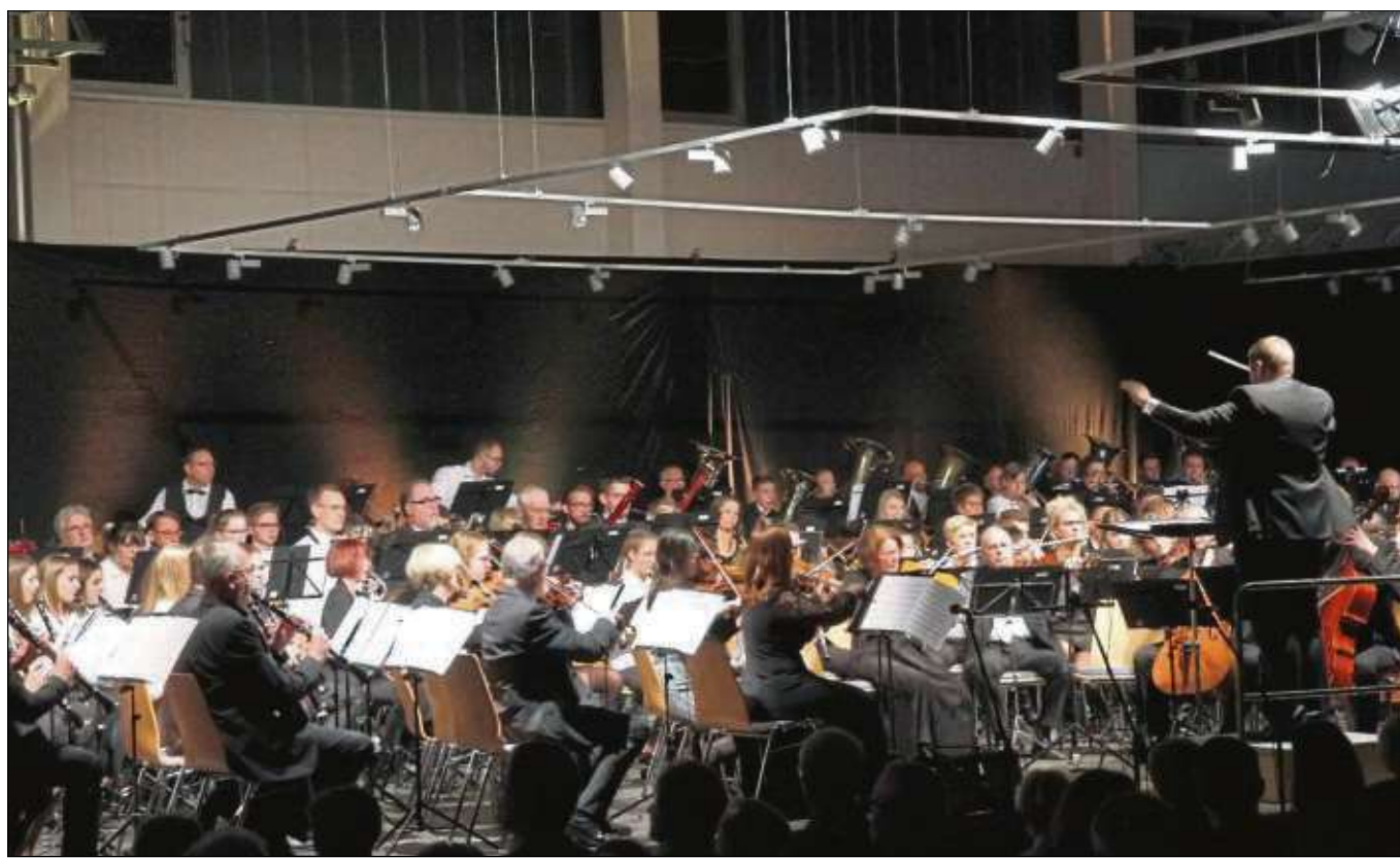
Das Herbstkonzert der Stadtkapelle Seligenstadt, welches anlässlich des 110-jährigen Bestehens besonders groß ausfiel, dürfte einen besonderen Platz in der Vereinschronik einnehmen. Zeitweilig bildeten alle 160 Vereinsmusiker ein großes Orchester.