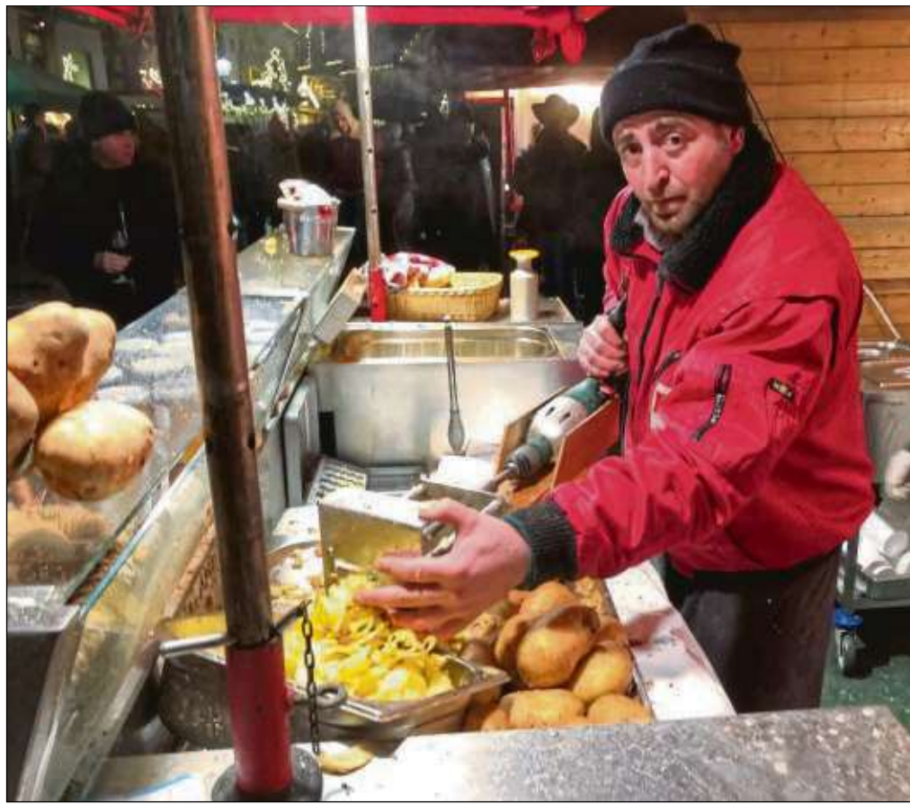
Kartoffel-Chips frisch hergestellt - einer der Renner beim Adventsmarkt auf dem Seligenstädter Marktplatz noch bis 16. Dezember.

Vom erlebnisreichen Marktplatz grüßt euch herzlich euer Turmmännchen