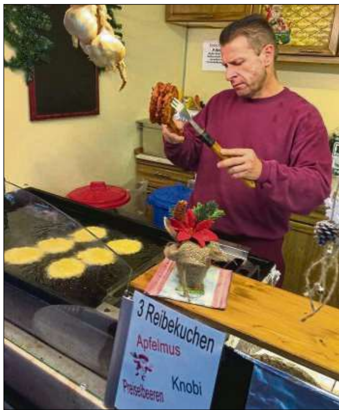
Und natürlich gehört auch der Stand mit den Reibekuchen seit vielen Jahren zum Treffpunkt.