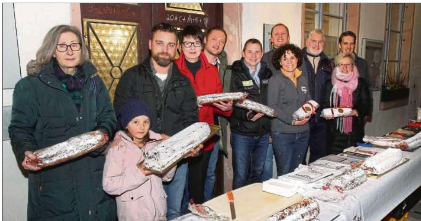
Einen zehn Meter langen Christstollen stifteten die Seligenstädter Bäckereien Haas, Löwer, Mayer, Nitschke und Wolz zur Eröffnung des Adventsmarkts für einen guten Zweck. Gemeinsam mit dem Gewerbeverein soll der Erlös aus dem Verkauf in Form von Büchergutscheinen an die beiden Grundschulen in Klein-Welzheim und Froschhausen weitergegeben werden.

Seligenstadt (beko) – Widriger Wetterbedingungen zum Start des Adventsmarktes in Seligenstadt, aber gestern konnten die Schirme daheim gelassen werden. Geöffnet ist täglich von 16 bis 20 Uhr auf Marktplatz und Freihofplatz. Am Wochenende auch an der Bahnhofstraße.