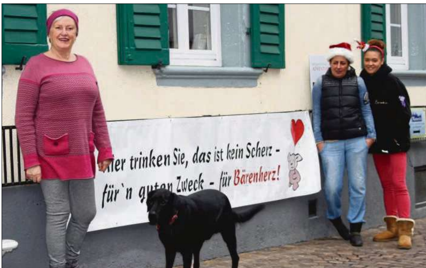
Der Bärenherzhof in der Kleinen Maingasse 2 in Seligenstadt ist in seinem 15. Jahr an jedem Adventswochenende geöffnet: freitags ab 16 Uhr, samstags ab elf Uhr und sonntags ab 13 Uhr immer bis zum Feierabend – für Gruppen auch gerne zu anderen Zeiten nach Voranmeldung. Es wird der Pfälzer Glühwein vom Weingut Anselmann verkauft, dazu gibt es hausgemachte Plätzchen und Brote mit Kräuter-Schmalz und besonderen Aufstrichen. Der Erlös wird für schwerkranke Kinder und deren Familien an die Bärenherzstiftung in Wiesbaden gespendet.