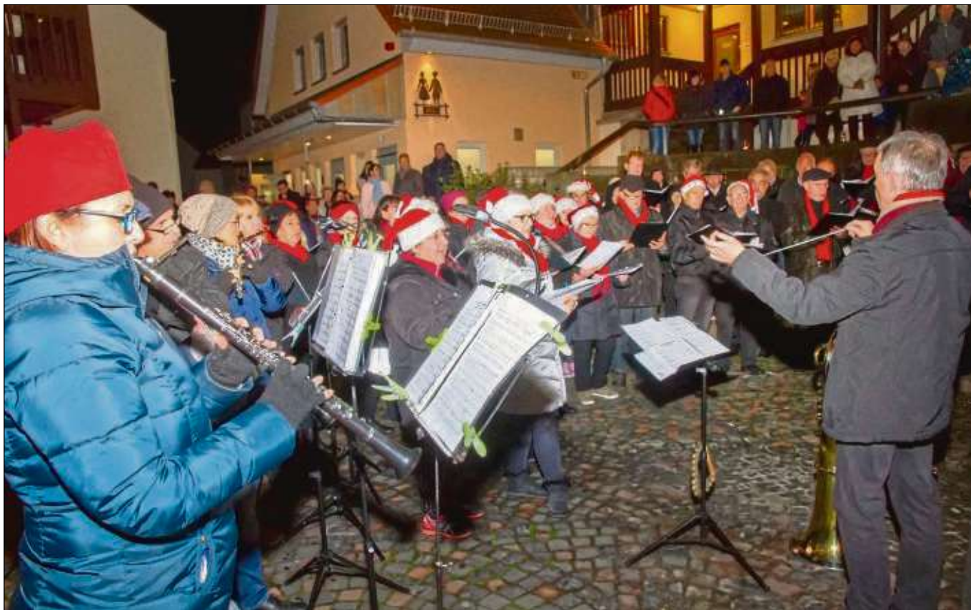
Zum Mitsingkonzert trafen sich Besucher des Adventsmarktes im Rathaus-Innenhof. Dort spielten der Chor TG Mix und das Refreshed-Orchester der Stadtkapelle auf. Texte der Lieder zum Mitsingen wurden so projiziert, dass jeder Besucher kräftig mitsingen konnte.