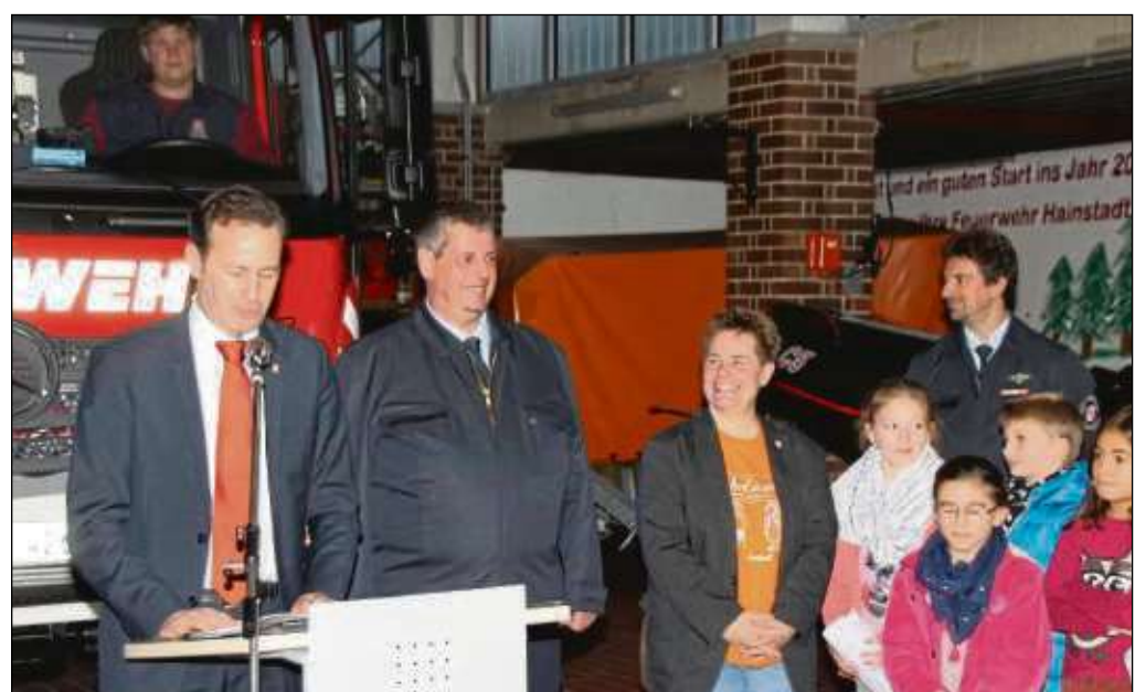
Die neuen Fahrzeuge der Feuerwehr in Hainstadt übergab Bürgermeister Alexander Böhm. Vorher brachten Kinder auf den Punkt: „Wenn das Fahrzeug veraltet ist braucht man ein neues, sonst kann die Feuerwehr nicht mehr helfen“.

von Gerätschaften vorgesehen, welche nicht ständig auf Einsatzfahrzeugen verlastet sind und nur situationsbedingt bei Einsätzen benötigt werden. Die Anschaffungskosten belaufen sich auf 175.000 Euro. Die Freiwillige Feuerwehr Hainstadt beteiligte sich an den Kosten mit 7.500 Euro aus der Vereinskasse. Beide Fahrzeuge sind ab sofort im Feuerwehrgerätehaus der Ortsteilfeuerwehr Hainstadt stationiert.