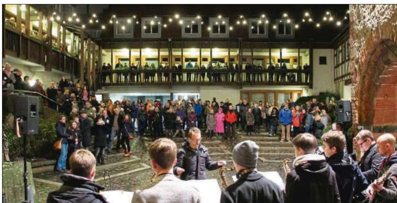
Meteorologisch zwar nicht im „Winter Wonderland“, hat es die Bigband der Einhardsschule beim ersten Adventskonzert im Rathausinnenhof musikalisch beeindruckend geschafft, die trotz ungemütlichen Wetters zahlreichen Zuhörer mit jeder Menge Swing und alten Klassikern auch von „White Christmas“ träumen zu lassen. Am nächsten Sonntag ist dann im Rahmen der vom Heimatbund veranstalteten Konzertserie im Advent ab 17 Uhr das Große Blasorchester der Stadtkapelle Seligenstadt an der Reihe.

beserklärung an Seligenstadt in Noten zu fassen. Die Umsetzung dieses Wunsches fand Widerhall in einer Ouvertüre, als gewaltige Eröffnung, in einem Drei-Kaiser-Marsch als Anlehnung an die kaiserliche Historie der Stadt, in einer Humoresque als Spiegel der Fastnacht, endend mit einer Gänsehaut-Hymne, textlich von Udo Sommer lokal koloriert. Jeder hatte ein seines Könnens entsprechendes Notenbild, um das große Ganze zu dem zu machen, was es sein soll: ein Gesamtkunstwerk. Alle anderen vier Dirigenten des Abends griffen für die Suite zu ihren Instrumenten und reiheten sich ein. Dieser musikalische Gang durch die Seligenstädter Geschichte wurde vom Publikum mit lang anhaltenden stehenden Ovationen gewürdigt. Der heimatverbundenen Kapelle der Stadt, die auf mehr als ein Jahrhundert Musik für die Region zurückblicken kann, ist es gelungen, der Seligenstädter Bürgerschaft mit der „Seligenstädter Suite“ ein besonders Geschenk zu machen.