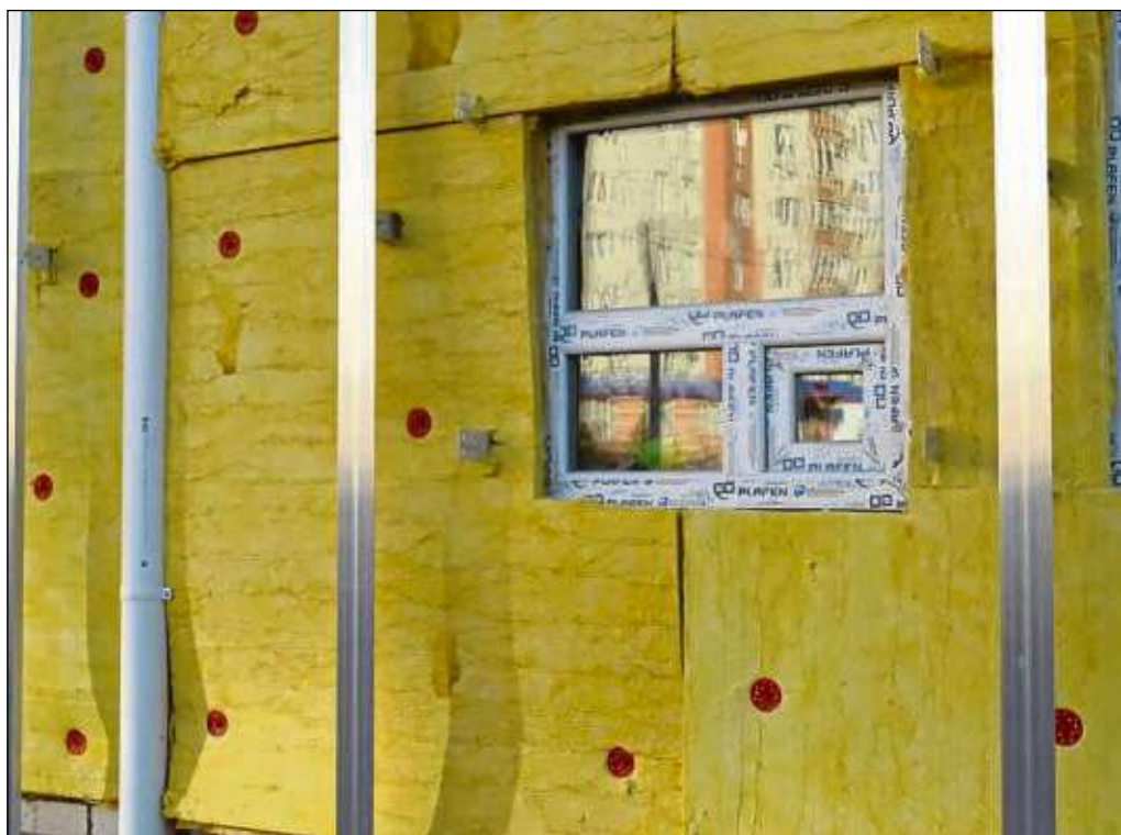
Lohnt sich Fassadendämmung?

Die Antwort auf die Frage ist JA. Die Fassade ist die größte Fläche des Hauses und somit ein entscheidender Faktor für den Energiehaushalt. Bei schlechter Wärmedämmung kann eine Fassade für bis zu dreißig Prozent des Wärmeverlustes verantwortlich sein. Es gibt verschiedene Möglichkeiten für eine solide Dämmung. Bei Neubauten ist sie heutzutage mittlerweile Standard. Bei einem Altbau wird eine Fassaden-