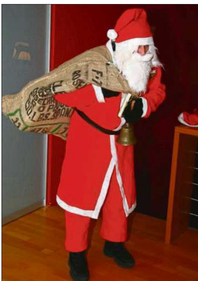
Ganz ehrlich, kennen Sie eigentlich den Unterschied zwischen Weihnachtsmann und Nikolaus? Diejenigen, die jetzt mit den Schultern zucken, aufgepasst. Der Nikolaus ist der Dienstältere der beiden Männer im roten Gewand. Den Nikolaus, den wir heute kennen, kommt aus der heutigen Türkei und wurde für seinen gütigen Charakter bekannt. Um ihn ranken sich verschiedenste Mythen, die von guten Taten und Wundern berichten. Der Weihnachtsmann hingegen ist eine populäre Märchengestalt aus Amerika, die von einem weltweit bekannten Softdrink-Hersteller zu Werbezwecken genutzt wird.