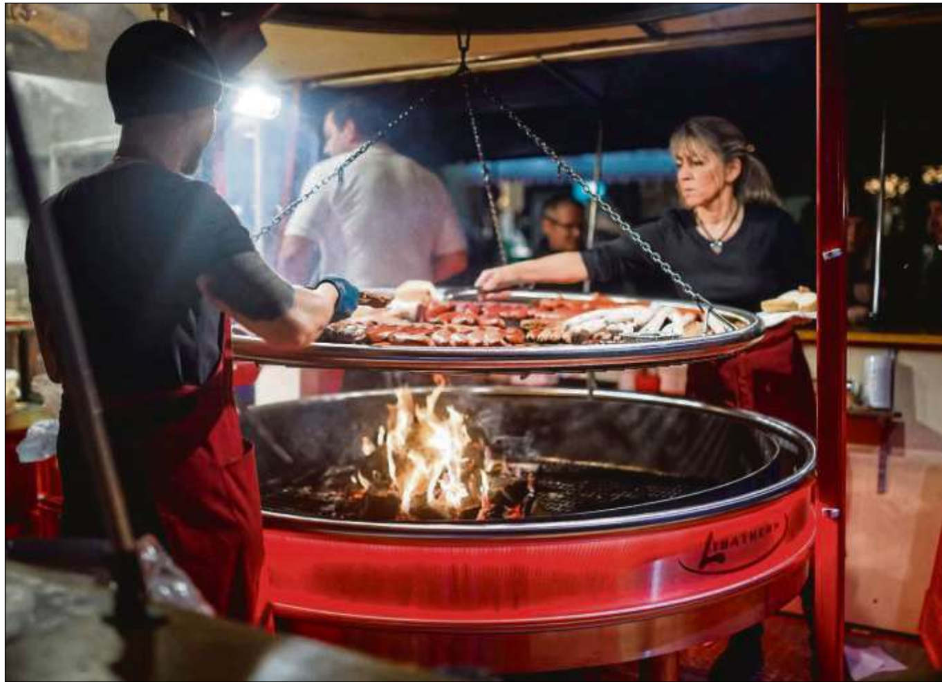
Würstchen vom Grill, Waffeln, Burger, Crêpes, Kartoffel-Chips und -Puffer, Pizza - garantiert haben wir in der Aufzählung irgendetwas Essbares vergessen, was es derzeit auf dem Adventsmarkt in Seligenstadt gibt. „Lichterglanz und Budenzauber für die ganze Familie“ heißt das Thema und trotz widriger Wetterbedingungen ist der Markt täglich von 15 bis 20 Uhr Treffpunkt. Samstags geht's bereits um 10, sonntags um 12 Uhr los. Mehr auf Seite 3.