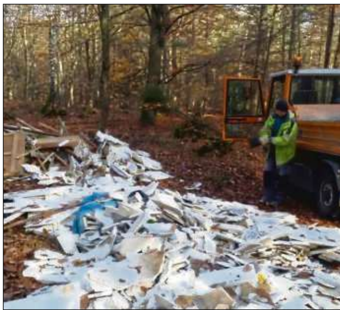
Ein aufmerksamer Spaziergänger informierte die Stadt über die drei LKW-Ladungen Renovierungsmüll im Stadtwald.