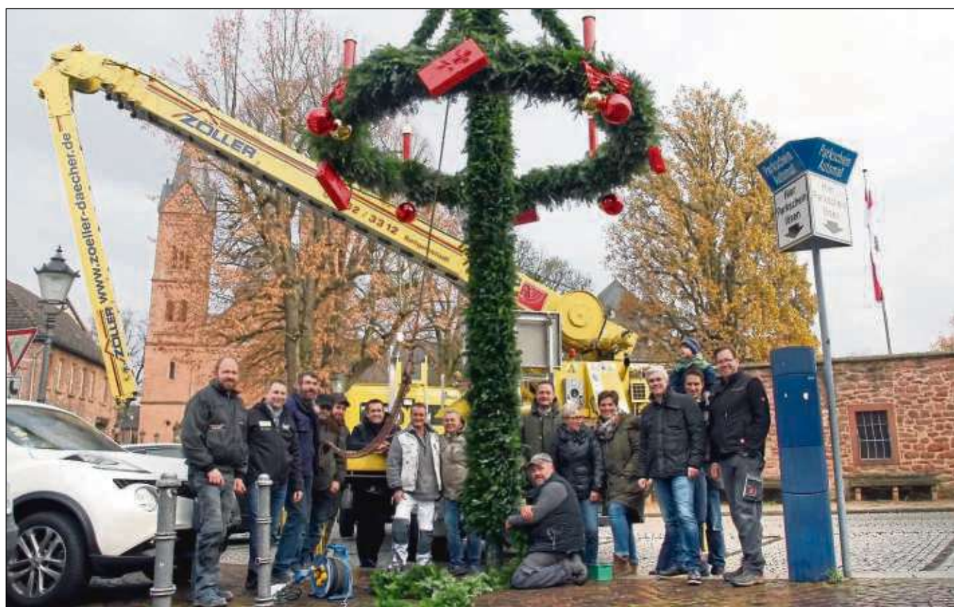
Adventsmarktköffnung am Donnerstag, 29. November/ lange Einkaufsnacht bis 22 Uhr und Stollenaktion