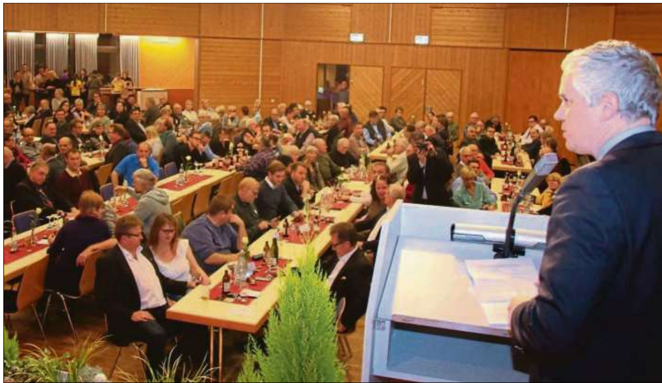
Ins Froschhäuser Bürgerhaus hatte die Stadt Seligenstadt um Bürgermeister Dr. Daniell Bastian eingeladen, um mit dem traditionellen Vereinsabend all jenen zu danken, die sich in ihrer Heimatstadt auf vielfältige Weise betätigen.

Die Führung kostet 8,50 Euro pro Person inklusive Getränk und Gebäck und dauert rund eineinhalb Stunden. Eine Anmeldung ist erforderlich unter ☎ 06182 87177.