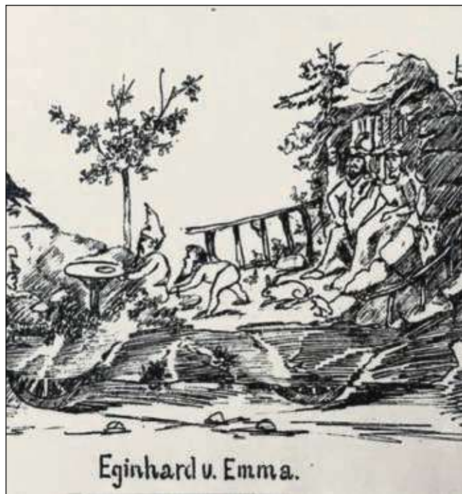
Einhard und Emma auf einem Prunkwagen beim Fastnachtsumzug 1897 in Seligenstadt. Der ganze Fastnachtzug ist in einem Leporello überliefert worden.

dung auszufüllen,“ erläutert Bürgermeisterin Ruth Disser die Möglichkeiten vor Ort und verweist für persönliche Schadensmeldungen an das Baubüro der Deutschen Glasfaser in Mainflingen. Das Baubüro befindet sich in der Lessingstraße 13 im Ortsteil Mainflingen und ist dienstags von 9.30 bis 13 Uhr und von 14 bis 17 Uhr geöffnet. Für Schadensmeldungen an der gemeindeeigenen Straßenbeleuchtung, wie angerissene Kabel oder beschädigte Masten, stehen die Mitarbeiter des Fachbereichs Infrastruktur unter ☎ 06182 8900-25 oder -27 und während der Öffnungszeiten der Rathäuser gerne zur Verfügung.