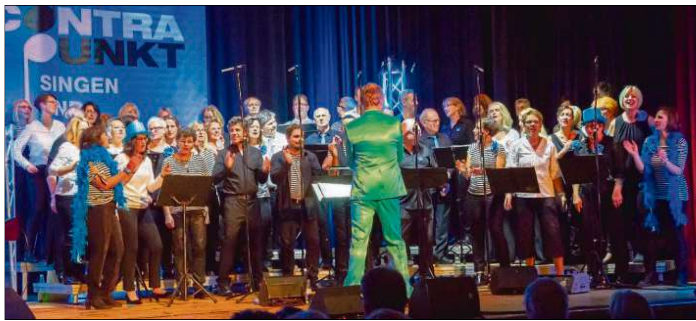
Ansteckend war die Freude, die die Sängerinnen und Sänger des Chors Contrapunkt während ihres Konzertes im Riesenaal beim Singen zeigten. Das Publikum jedenfalls hielt es schließlich nicht mehr auf den Sitzen.

Die Initiative in Seligenstadt plant außerdem an den ersten drei Adventswochenenden einen Stand auf dem Seligenstädter Adventsmarkt, wo sich Interessierte treffen und informieren können.