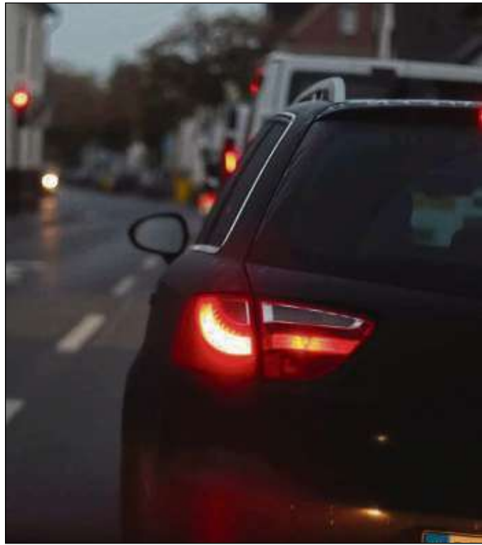
Mehr als die Hälfte der von der Polizei kontrollierten Fahrzeuge wiesen Mängel an der Beleuchtung auf.