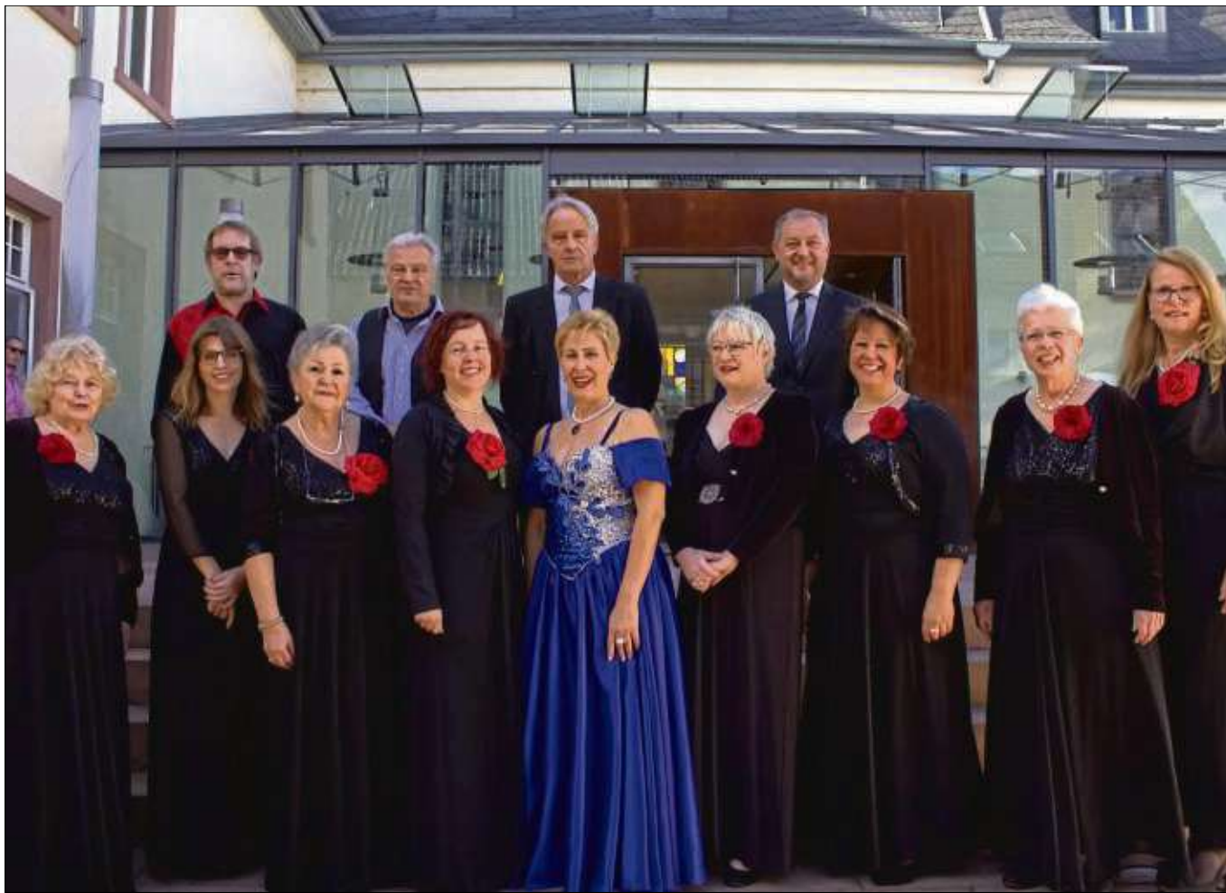
Das Gesangsensemble Con piacere gastiert mit seinem neuen Programm am Sonntag, 28. Oktober, um 17 Uhr im Edith-Stein-Saal, Jakobstraße 5, in Seligenstadt. Unter dem Motto „An der schönen blauen Donau“ werden Evergreens sowie Lieder aus Musical und Operette dargeboten.

Seligenstadt (red) – Der Kaninchenzuchtverein H 103 Seligenstadt veranstaltet am Samstag und Sonntag, 10. und 11. November, in der Zuchtanlage des Geflügelzuchtvereins an der Pfingstweide seine Lokalschau. Am Samstag um 15 Uhr wird die Schau eröffnet. Im Anschluss werden die ausgestellten Tiere während eines Rundgangs präsentiert und verschiedene Kaninchenrassen vorgestellt, selbstverständlich werden auch Fragen zu den Tieren gerne beantwortet. Nach dem Rundgang können sich die Gäste (auch am Sonntag) mit kühlen Getränken erfrischen oder auch Kaffee und Kuchen genießen. Öffnungszeiten der Lokalschau: Samstag von 14.30 Uhr bis 17 Uhr und am Sonntag von 10 bis 17 Uhr. Der Verein lädt zudem für Montag, 5. November, 18.30 Uhr, zu seiner Monatsversammlung mit Besprechung der Lokalschau in sein Vereinsheim an der Pfingstweide ein.