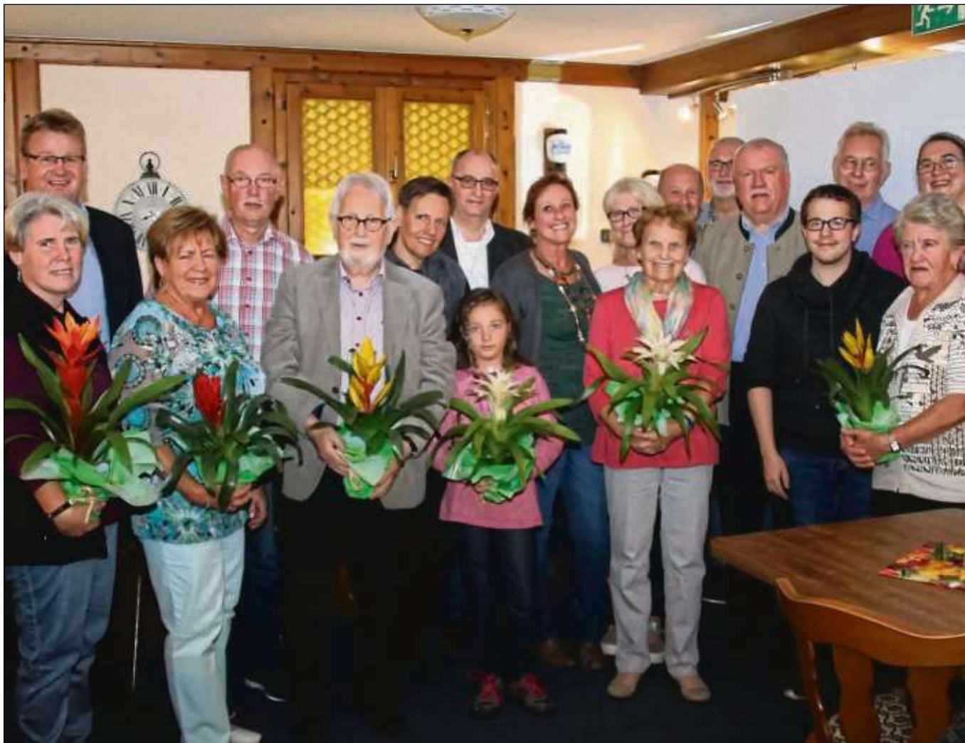
Die Preisträger des diesjährigen Blumenwettbewerbs in Froschhausen zeichnete dieser Tage der Vereinsring Froschhausen in einer Feierstunde aus.