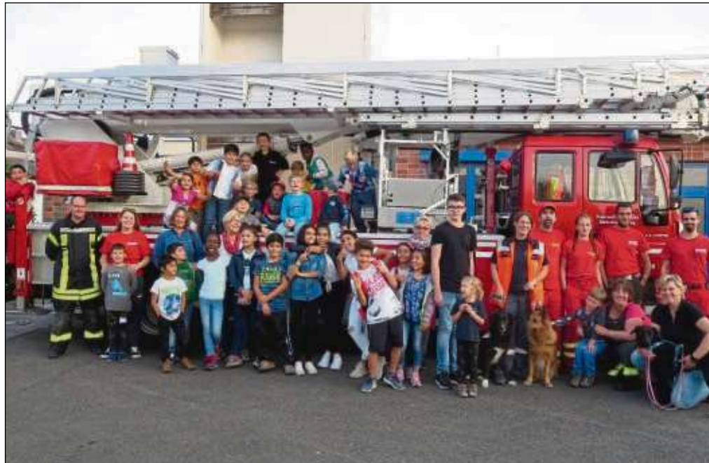
Vor einem Einsatzwagen versammelten sich die jungen Besucher und die Mitglieder der Kinderfeuerwehr, die den „Rettertag“ organisiert hatten, für ein Erinnerungsfoto.

Klein-Krotzenburg (red) – Wofür ist die Feuerwehr da? Welche Aufgaben hat die DLRG oder die Rettungshundestaffel des DRK? Fragen, die für viele einfach zu beantworten sind. Nicht aber für Personen und insbesondere für Kinder, die aus ihrem Heimatland fliehen mussten und nun in Deutschland ein neues zu Hause mit viel Neuem gefunden haben. Mit diesem Hintergrund veranstaltete die Kinderfeuerwehr der Freiwilligen Feuerwehr Klein-Krotzenburg den sogenannten „Rettertag“, dazu hatte sie die Flüchtlingskinder des Arbeitskreises Pro Asyl in das Feuerwehrhaus eingeladen. An der Veranstaltung nahmen außerdem die DLRG Hainburg und die Rettungshundestaffel des DRK OV Hainstadt teil. Den Kindern und Jugendlichen wurde an verschiedenen Stationen Wissenswertes rund um das Thema „Retten“ näher gebracht. Ziel der Kinderfeuerwehr war es, ihnen die Aufgabengebiete der drei Orga-