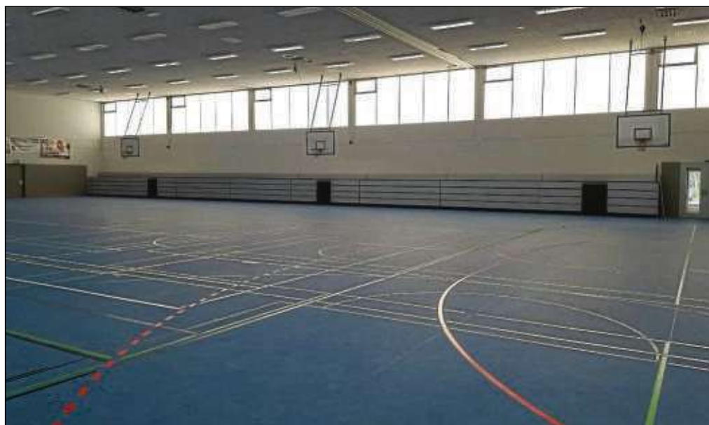
Hallenboden und Tribüne in der Großsporthalle wurden saniert.