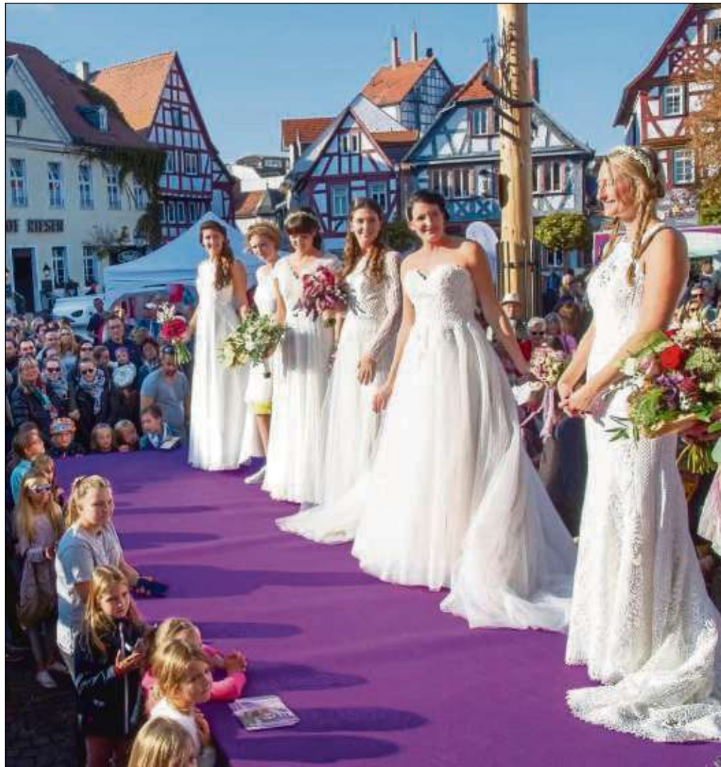
Klassisch mit Spitze und Schleppe oder auch mal ganz lässig mit gelbem Unterrock und flachen Schuhen: Wer am Sonntag in die Altstadt kam, sah eine Braut nach der anderen über den lila Laufsteg vor dem Rathaus schreiten – freilich alles Models, die die neueste Brautmode präsentierten. Die Schau bildete den Höhepunkt des „Seligenstädter Hochzeitsfesttags“ mit verkauffrohem Sonntag. Im Riesensaal ließen indes Experten vom Fotografen bis zum Floristen rund um Hochzeit- und Eventplanung keine Fragen offen.