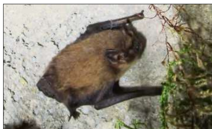
Die heimischen Fledermausarten stehen wieder im Fokus der NABU-Wanderung am Katzenbuckel.

Hainstadt (red) – Der Naturschutzbund Hainburg lädt ein zur Fledermauswanderung am Samstag, 27. Oktober. Treffpunkt ist um 18 Uhr der Parkplatz am Katzenbuckel in Hainstadt. Fledermäuse fliegen mit den Händen und sehen mit den Ohren. Nach den Nagetieren sind sie die zweitgrößte Säugetierordnung im Tierreich. Die ältesten Fledermausfossilien sind mehr als 50 Millionen Jahre alt. In den Fünfzigerjahren gingen ihre Bestände stark zurück. Einige Arten verschwanden ganz