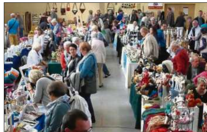
Der erste Künstlermarkt in der Radsporthalle lockte zahlreiche Besucher an.

kunst an. Die Aktion des Rotary Clubs Obernburg „Deckel drauf“, läuft übrigens weiter. Interessierte Sammler können sich auf der Seite des Clubs nach Sammelstellen erkundigen.