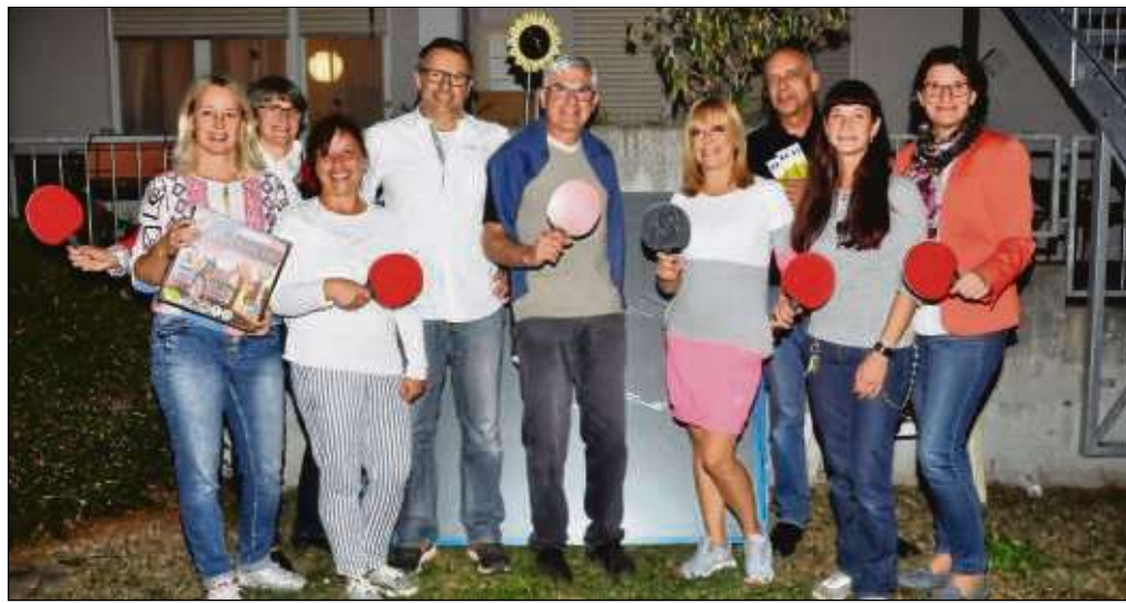
Eine Tischtennisplatte hatten sich die Jugendlichen der Theresien-Wohngruppe gewünscht. Diese hatten die Ausrichter des Spessartstraßenfests bei ihrem Besuch nun mit im Gepäck.

Tischtennisplatte für Wohngruppe des Theresien Hilfezentrums