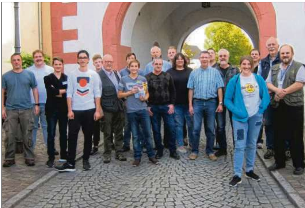
Mit großem Engagement dabei waren Teilnehmer, Ausbilder und Referenten des Vollzeitkurses zur Vorbereitung auf die Amateurfunklizenz im Steinheimer Turm.

Seligenstadt (red) – Ferien sollen der Erholung vom (Schul-)Alltag dienen, geben aber auch Gelegenheit, sich intensiv mit Hobbys zu beschäftigen. Die Jugendarbeit der Seligenstädter Funkamateure ist dabei in eine neue Phase getreten: Aus den beiden Jugendgruppen nahmen einige die Gelegenheit wahr, konkret mit der Vorbereitung zum Erwerb der Amateurfunklizenz der Klasse E („Einsteiger“) zu beginnen. In der letzten Woche der Herbstferien bot der hiesige Ortsverband im DARC (Deutscher Amateur Radio Club e.V.) in Zusammenarbeit mit dem Ausbildersteam des Museums für Kommunikation Frankfurt (DL0DPM) einen entsprechenden Vollzeitkurs an. Solche Kurse sind bundesweit sehr begehrt, erleichtern sie doch die Vorbereitung auf die amtliche Prüfung bei der Bundesnetzagentur in erheblichem Maß. 14 Teilnehmer, knapp die Hälfte davon aus der eigenen Jugendgruppe des Ortsvereins, stellten sich