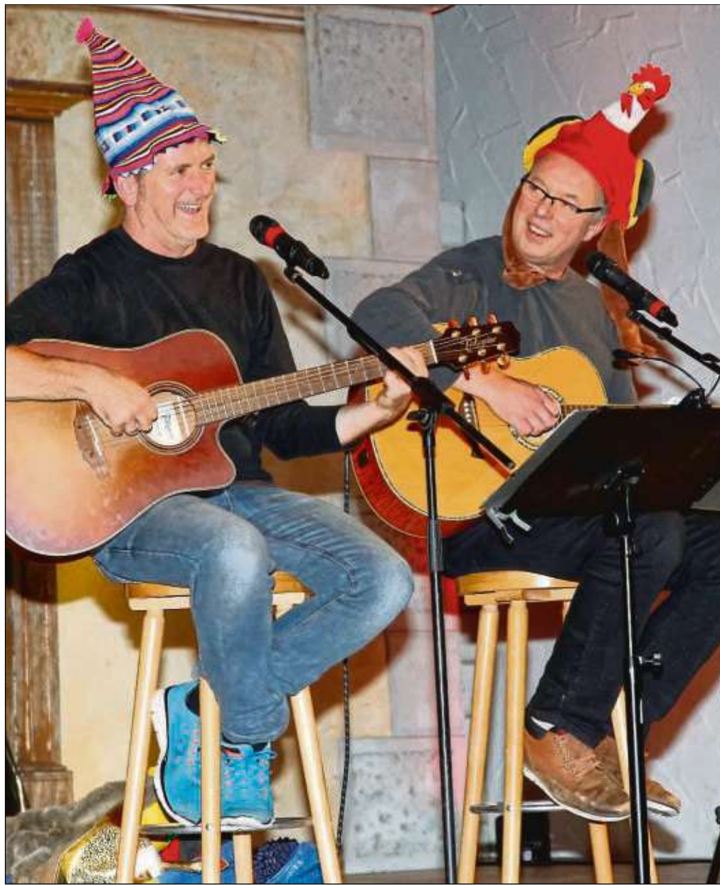
„Wie immer mussten die Lämmerspieler besonders leiden“ betitelt Heimatblatt-Fotograf Axel Hampe sein Foto, das das Duo Ohrenschmaus während seines Konzertes bei der Gesellschaft der Freunde 1856 Seligenstadt in der Heimathalle zeigt. Die beiden Mülheimer mit den lustigen Hüten stehen mittlerweile seit 25 Jahren gemeinsam auf der Bühne und präsentierten ein Silberhochzeitsprogramm mit neuen Songs und alten Klassikern.

herantreten: Es geht um Fragen des Zusammenlebens, des Zweifels und Glaubens, um das, was im Alltag trägt und Halt gibt. Bei seinen Lesereisen tritt Schießler mit den Teilnehmern in die Diskussion ein, er möchte dabei Anregungen geben zum gemeinsamen Glauben der Kirchen untereinander. Eintrittskarten zu zwölf Euro sind in der Buchhandlung „der Buchladen“, Bahnhofstraße 18, Seligenstadt, in der Gemeindebücherei St. Marien oder an der Abendkasse erhältlich.