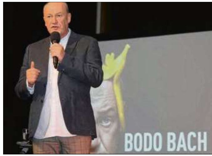
Standup-Comedian Bodo Bach (alias Robert Treutel) trat nun auf Einladung des Gesangsvereins Harmonie Zellhausen im voll besetzten Bürgerhaus mit seinem Programm „Pech gehabt“ auf und präsentierte in humorvoller Form seine Erlebnisberichte vielseitig, vielschichtig und vielosophisch.