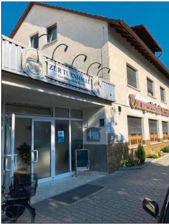
Eine Annahme von privaten Anzeigen für unsere Zeitung ist ab Montag, 8. Oktober, bei der TGS möglich.