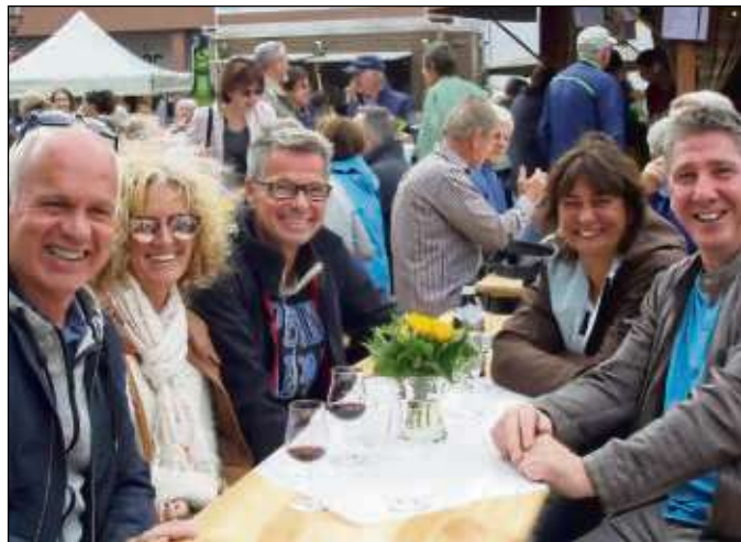
Tausende Besucher genossen den Aufenthalt auf dem Seligenstädter Weinmarkt von morgens bis abends.