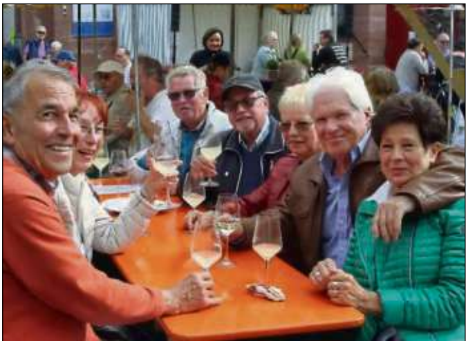
Die Verköstigung mit Weinen und das Beisammensitzen ließ die Besucher die kühlen Temperaturen vergessen.

Dann war da noch jene erste Begegnung in der neuen Wohngemeinde Zellhausen. Freitag, es regnet Bindfäden, die Küche wird angeliefert, schwere Kartons sind in den ersten Stock zu tragen und auf der Straße unten hält ein Fahrradfahrer, stellt fest „Ihr braucht doch sicher Hilfe!“, stellt Fahrrad und Kinderanhänger beiseite und greift beherzt zu, hilft und verschwindet wieder. Nicht nur der Tag war für das junge Ehepaar gerettet, ein Pluspunkt mehr für Zellhausen wird notiert. Wenn's dort nur solche Menschen gibt, dann war die Ortswahl richtig. (beko)