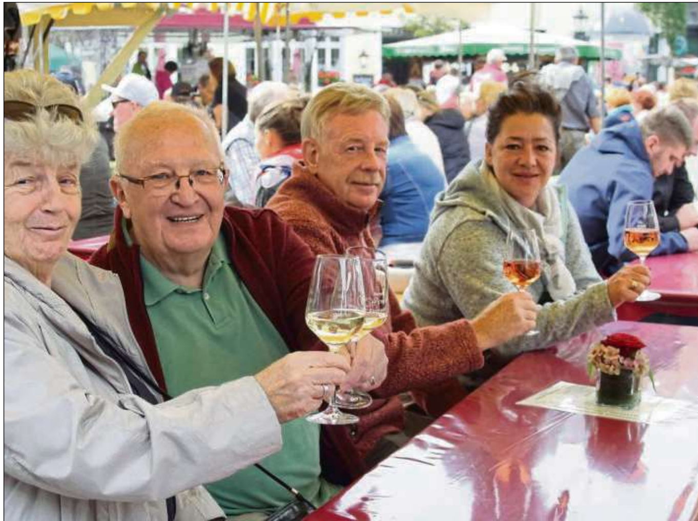
Wein, Crêpes, Flammkuchen und Live-Musik: Der Seligenstädter war trotz der herbstlichen Temperaturen von 13 Grad gut besucht und die Gäste nutzten das Angebot des Gewerbevereins, trafen sich auf dem Marktplatz, aber auch in den zahlreichen Geschäften der Stadt. Mehr heute auf Seite 16.

Bus oder dem eigenen PKW an. Mit Präsentationen und Ausstellungen in der Innenstadt Triels entlang des Seineufers beeindruckten Vereine und Gewerbe die Gäste. Während die einen das besondere Flair des Marktes genossen, trafen sich die Vertreter der beiden Tischtennis- und Badmintonclubs beim gemeinsamen Sport. Zudem verwöhnten die Gastfamilien ihre Gäste mit typisch französischen Speisen. Das und vieles mehr machte den Besuch in Frankreich zu einer außergewöhnlichen Erfahrung. Zum Schluss enthielt Bürgermeister Bastian noch gemeinsam mit seinem Amtskollegen Joël Mancel am Seineufer das Gastgeschenk Seligenstadts: eine original Seligenstädter „Bambelbank“.