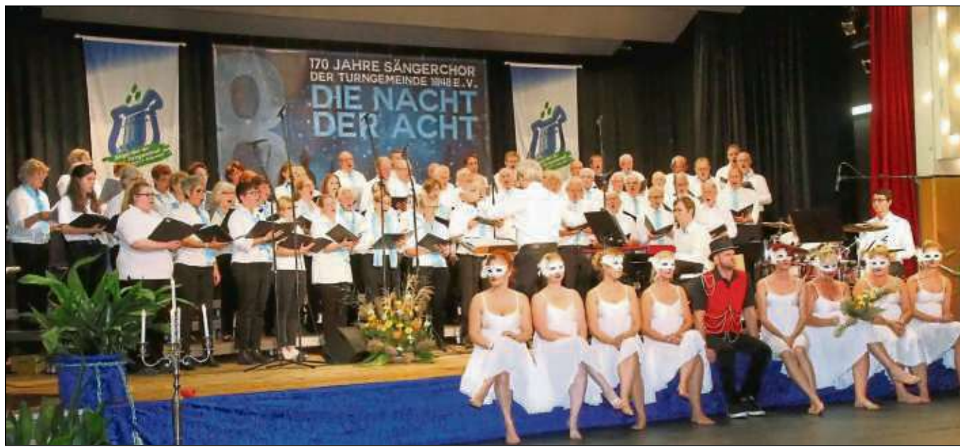
Chöre und Tanzformationen des Sängerkhors der Turngemeinde Seligenstadt gestalteten ein anspruchsvolles Konzertprogramm im 170. Jahr des Vereinsbestehens.