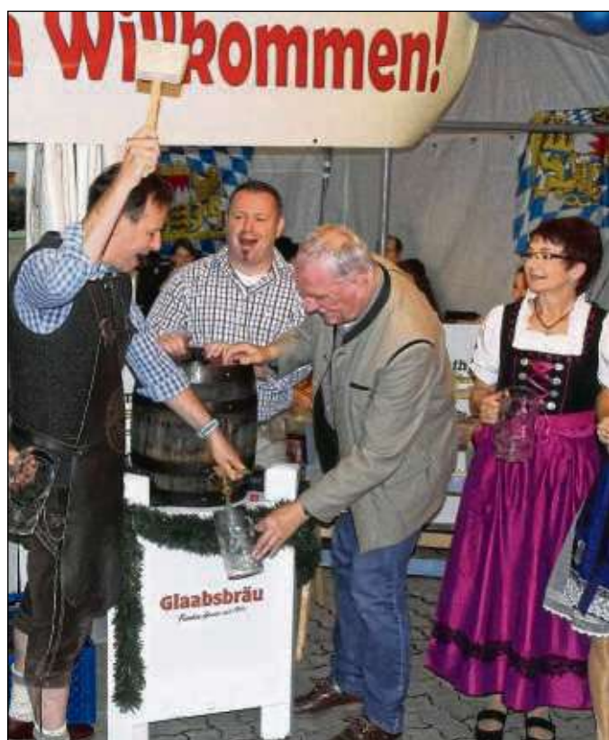
„O'zapft iss!“ heißt es bald wieder in Hainburg, wo Oktoberfeste ebenso anstehen wie die Kerb.

zenburg. Dazu gibt es zahlreiche Tanzeinlagen, unter anderem der Tanzgruppe Diamonds. Auch das Männerballett der Turnerschaft wird wie in den Jahren zuvor auftreten. Für das leibliche Wohl ist mit bayrischen Spezialitäten wie Schweinshaxen mit Kraut, Leberkäse und ähnlichem bestens gesorgt. Sitzplatzreservierungen besitzen nur bis 20.30 Uhr Gültigkeit. Karten gibt es bei Waldemar Fischer, der unter ☎ 0172 8712394 zu erreichen ist, und in der Buchhandlung Vielseitig. Parkplätze gibt es im Industriegebiet.