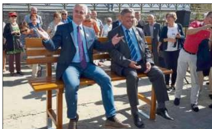
Eine Seligenstädter „Bambelbank“ gab's nun bei der Rückverschwisterungsfeier in Triel an der Seine.