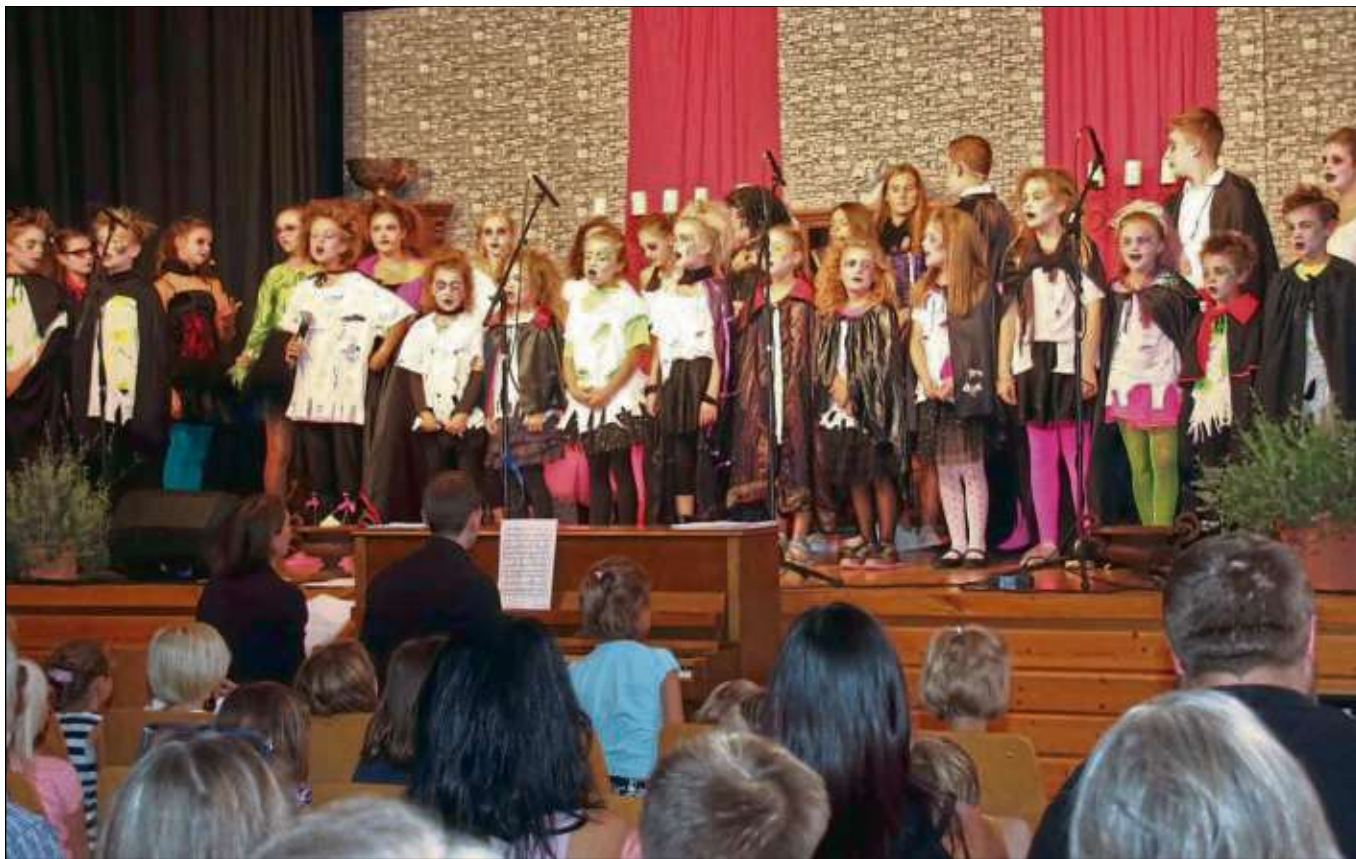
Der Kinder- und Jugendchor des Gesangvereins Liederfreund Froschhausen, „Happy Next Voices“, ist hervorragend aufgestellt und zeigte sein Können wieder beim Kindermusical im Bürgerhaus Froschhausen.