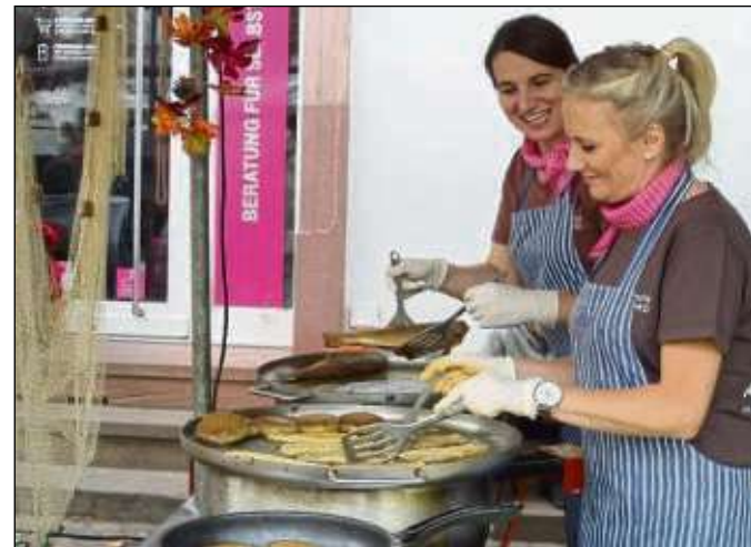
Unter anderem sorgten verschiedenste Fischsorten von Forellen Burkard für das leibliche Wohl der Gäste.