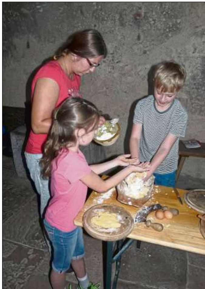
Es wird gedruckt, gebacken, Seife hergestellt und gekocht in der historischen Klosterküche.

Seligenstadt (zfk) – Die Ferienwerkstatt „Drucken - Kunst auf Papier!“ inklusive Klosterführung bietet die ehemalige Benediktinerabtei Seligenstadt für Kinder ab sieben Jahren am Dienstag, 2. Oktober, an. Hier lernen die Kids, wie zu Zeiten ohne Computer, Drucker und Kopiergeräten Bücher gedruckt wurden. Die Kosten liegen bei 20 Euro pro Kind. Am Mittwoch, 3. Oktober, wird dann ein Kochkurs in der historischen Klosterküche ange-