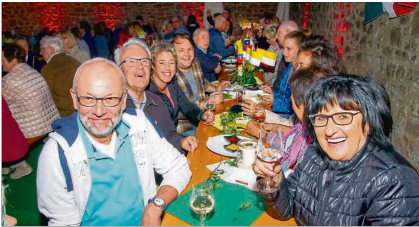
Gemütlich im Basilikagärtchen an der Klostermauer feierten die Seligenstädter die Kirchweih und der Besuch war grandios. In diesem Jahr feierte die Patenschaft Lateinamerika das 30-jährige Bestehen mit. Samstags gab es einen Weinabend mit südamerikanischen Akzenten. Zum Frühschoppen am Sonntag nach der Prozession gab es frisch gezapftes Weizenbier.

E-Mail an die Redaktion shb@stadtpost.de