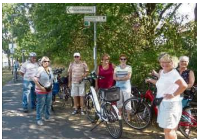
Auf eine gelungene Radtour kann der Vorstand des Europäischen Freundeskreises Hainburg (EFH) zurückschauen. Mit normalen Fahrrädern sowie E-Bikes trafen sich die Radler an der Klein-Krotzenburger Schleuse und radelten am Main entlang auf dem idyllischen Radweg bis zur Kahlmündung. An der Kahl entlang führte der Weg nach Wasserlos über Wiesen und Auen bis an eine Steigung, die den Radlern einiges abverlangte. Auf dem Weingut Klaus Simon folgte dann die verdiente Ruhe und es gab eine Abkühlung für die Sportler. Nach einem ausgiebigen Nachmittagsessen traten alle gegen Nachmittag die Rücktour an. Zuletzt genossen einige Teilnehmer noch einen „Eisbaker“ in Eisdielen.