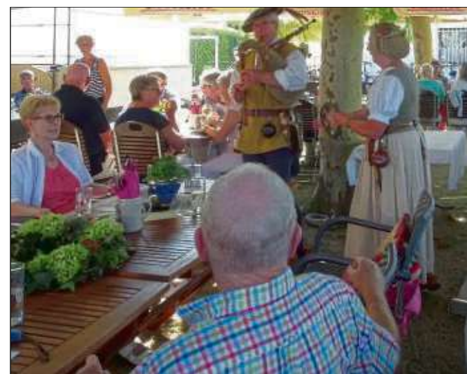
Ein Sommerfest feierten viele Vereine und Organisationen in Seligenstadt mit dem Verein „Hilfe füreinander“. Strahlender Sonnenschein, ein angenehm schattiger Platz unter den Platanen in der „Gärtnerhuh“ am Eichwald, trugen dazu bei, dass 100 Mitglieder und Freunde des Senioren-Vereins einen schönen Nachmittag und Abend verbringen konnten. Mittelalterliche Musik der bekannten „Spilleute auf der Schanz“ und ein spannendes Quiz zu Besonderheiten von Seligenstadt sorgten für Unterhaltung. Ein Essen von der Gaststätte „Gärtnerhuh“ sorgte für das leibliche Wohl der Gäste.

Seligenstadt (beko) – 2018 ist das große Jubiläumsjahr des Sängerkhore der Turngemeinde. Der Verein wird stolze 170 Jahre alt. Das wird gebührend gefeiert. Verschiedene Veranstaltungen sind dafür geplant. Höhepunkt des Festjahres ist das Jubiläumskonzert „Die Nacht der Acht“, am Samstag, 22. September, im Riesensaal. Alle acht Gruppierungen des Vereins werden auftreten und ihre Vielseitigkeit präsentieren. Über die Geschichte des TGM-Sängerkhore berichtet das Heimatblatt noch ausführlich in Wort und Bild.