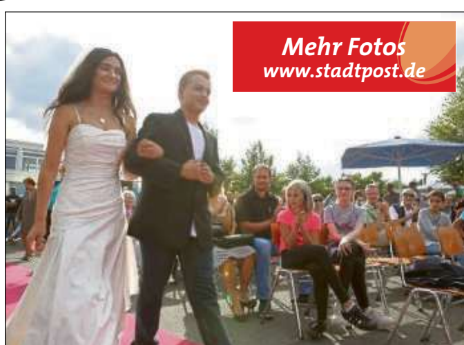
Mit einer Modenschau begeisterten die Kreuzburgschüler beim Schulfest.