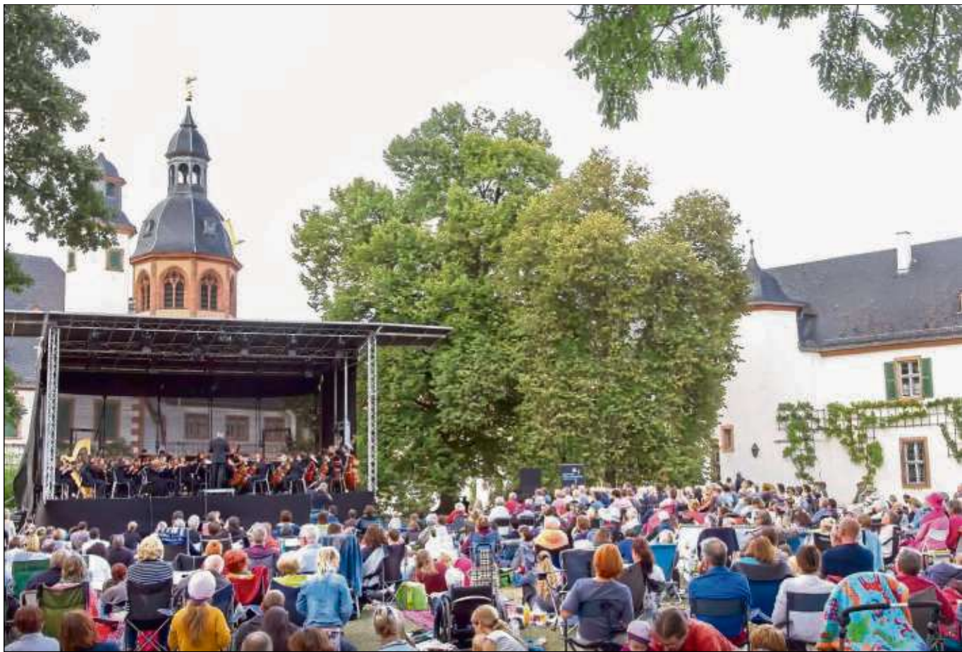
Die Seligenstädter Kammerphilharmonie lud ein zum zweiten Klassik-Picknick im Klosterhof, der sich mit Picknickdecken und Liegestühlen in einen sommerlichen Konzertsaal verwandelte.