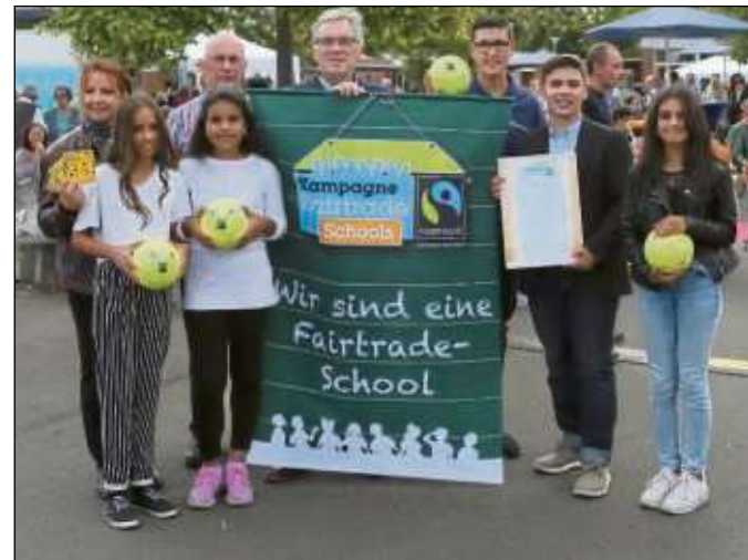
Freude bei den Verantwortlichen über die Auszeichnung als erste Fair-Trade-Schule im Kreis Offenbach.