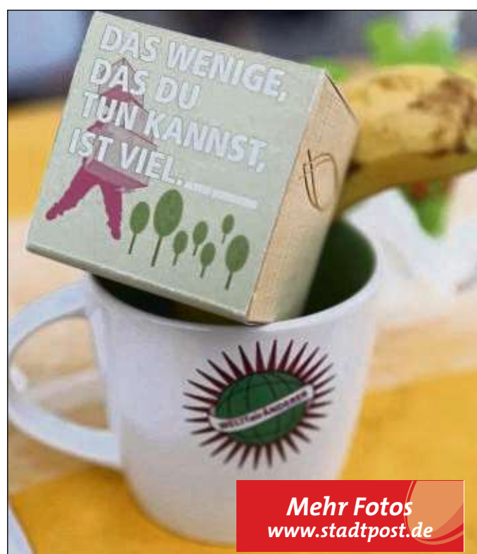
„Das Wenige, was Du tun kannst, ist viel.“ – Ein Motto der Weltfairänderer, das Jugendlichen einleuchtete.

Hainstadt (zfk) – Die Jahresversammlung des Vdk Ortsverbandes Hainstadt ist am Samstag, 1. September, um 16 Uhr in der Tischtennishalle, Lessingstraße. An diesem Tag wird der gesamte Vorstand neu gewählt, daher wird um zahlreiches Erscheinen gebeten. Zudem geht es darum, den Vorstand bei seinem Ehrenamt zu unterstützen und seine Arbeit zu würdigen.