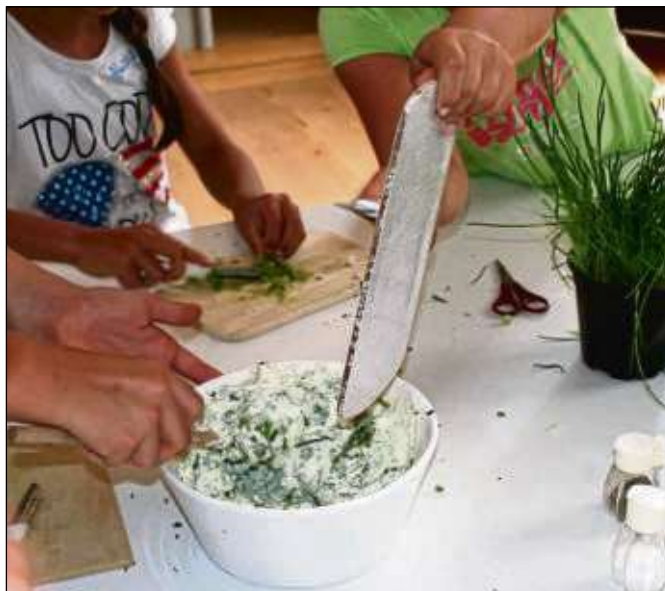
Ein spannendes Ferienprogramm gibt es in den Herbstferien im Kloster Seligenstadt.