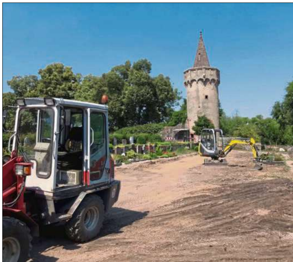
54 Reihengräber auf dem alten Friedhof in Seligenstadt wurden in den vergangenen Wochen entfernt. Diese wurden 1989 bis 1993 für eine Nutzungszeit von jeweils 25 Jahren angelegt. Im Gegensatz zu den Wahlgräbern ist eine Verlängerung der Nutzungsdauer bei den Reihengräbern nicht vorgesehen. Auch in Froschhausen entfernte man fünf Reihengräber. zfk/Foto: Stadt/privat

Festgottesdienst mit Prozession. Im Anschluss werden zum Frühschoppen mit dem Musikverein Mittagsmenüs serviert. Parallel gibt es ab 13 Uhr auch Kaffee und Kuchen. Das Nachmittagsprogramm bietet Unterhaltung für Kinder mit Spielmöglichkeiten und Bilderbuchkino der Gemeindebücherei. Um 19 Uhr startet die Verlosung der Tombola-Gewinne.