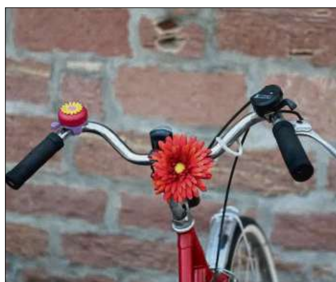
„Farbtupfer“ in der Einhardstadt. Wenn man aufmerksam durchs Städtche geht, findet man viele.

Frochhausen (red) – Der Geflügelzuchtverein Frochhausen feiert am Samstag, 4. August, sein 13. Gickel-Lampion-Fest auf seiner Zuchtanlage am Sandborn 36 in Frochhausen. Festbeginn ist um 14 Uhr bei Kaffee und Kuchen. Ab 17 Uhr werden prominente Freunde und Gäste begrüßt und mit deftigen Grillspezialitäten sowie erfrischenden Getränken bewirtet.