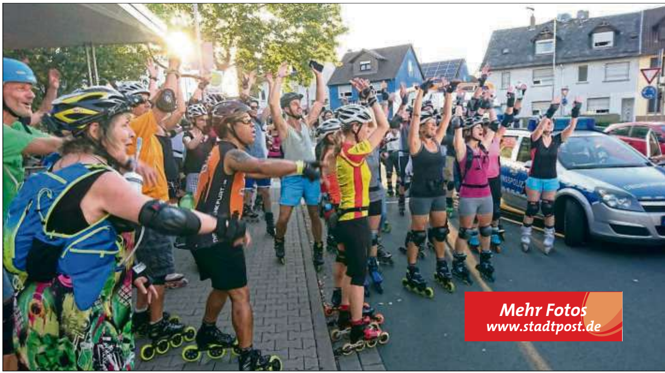
Mehr Fotos www.stadtpost.de

Auch nach Klein-Krotzenburg führte diesmal die jüngste Seligenstädter Skate-Night, die wieder am Kapellenplatz startet mit begeisterten Skatern, denen die hochsommerlichen Temperaturen kaum etwas anhaben konnten. „Inliner schnappen und den Sommer auf dem glatten Asphalt genießen“ lautete denn auch wieder das Motto. Die „Skate-Night“ ist kein Wettbewerb, sondern ein im Konvoi geführtes, gemeinsames lockeres Miteinander auf den für die Skater verkehrsfrei gehaltenen Straßen. Bei der Skating-Tour sorgen die Polizei und die Ordnungspolizei sowie das Rote Kreuz und freiwillige Ordner für die Sicherheit der Beteiligten. Die nächste Tour startet bereits am Donnerstag, 16. August, um 20 Uhr am Kapellenplatz. Lesen Sie auch Seite 2 „Angemerkt“. Text/Foto: zmb