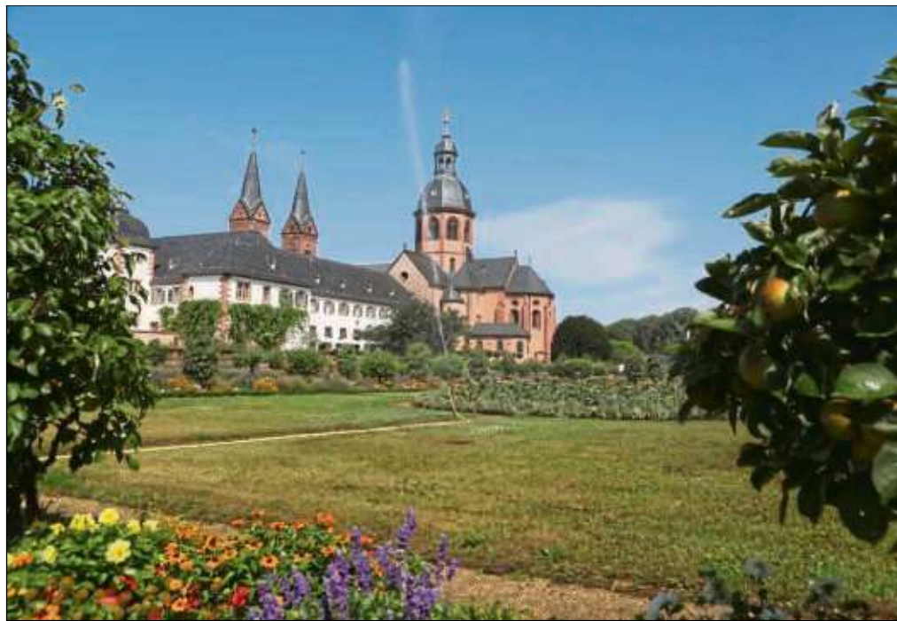
Nein, es sieht nur danach aus. Nicht die Basilika muss gewässert werden, sondern der Klostergarten, damit alles möglichst im grünen Bereich ist.

Städtischer Bauhof am Gießen / Auch Bürger helfen mit