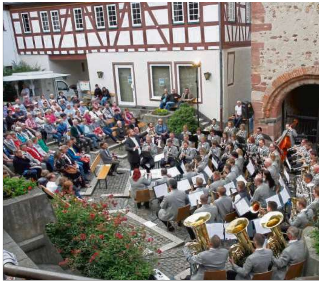
Mit einem Serenadenkonzert im Rathausinnenhof hat die Stadtkapelle Seligenstadt vor beeindruckender Kulisse ihr Jubiläumsjahr zum 110-jährigen Bestehen eröffnet.