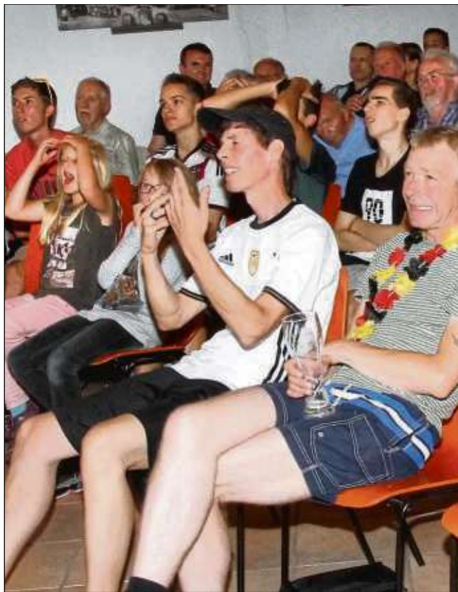
Ein Blick in die Gesichter zeigt's: Nicht gut, was Deutschland da im ersten Spiel fabrizierte.

> Live auch bei der Feuerwehr in Froschhausen. > Weitere Infos lagen bei Redaktionsschluss nicht vor.