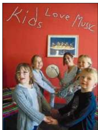
Musikkurse gibt's für Kinder in Mainhausen.

Mainhausen (red) – Nach den Sommerferien bietet die Musikwerkstatt Mainhausen wieder Musikalische Früherziehungskurse für Kinder von vier bis sechs Jahren an. Der Unterricht findet sowohl in der Geschäftsstelle in Mainhausen, sowie in den Kitas „Panama“ und „Klecksehaus“ statt. Da die Teilnehmerzahl begrenzt ist, wird um rechtzeitige Anmeldung gebeten. Informationen hierzu unter ☎ 06182 897577.