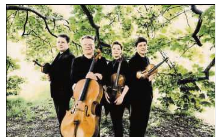
Das Henschel-Quartett gibt Werke von Ludwig van Beethoven zum Besten beim Klosterkonzert in Seligenstadt.

val im Kreuzgang der ehemaligen Benediktinerabtei oder bei schlechter Witterung in der Einhardbasilika um jeweils 20.30 Uhr statt. Tickets gibt es für 20 Euro, beziehungsweise 45 Euro für alle drei Tage, oder ermäßigt (Schüler, Lehrlinge, Studenten, Schwerbehinderte) für 13 Euro, beziehungsweise für 30 Euro für drei Tage. Karten können per E-Mail an info@klosterkonzerte-seligenstadt.de oder unter ☎ 06182 25323 bestellt werden. Zudem können Karten in der Tourist-Info am Markt und in den Buchhandlungen „der buchladen“, „geschichten*reich“ sowie der Bücherstube Klingler und an der Abendkasse erworben werden.