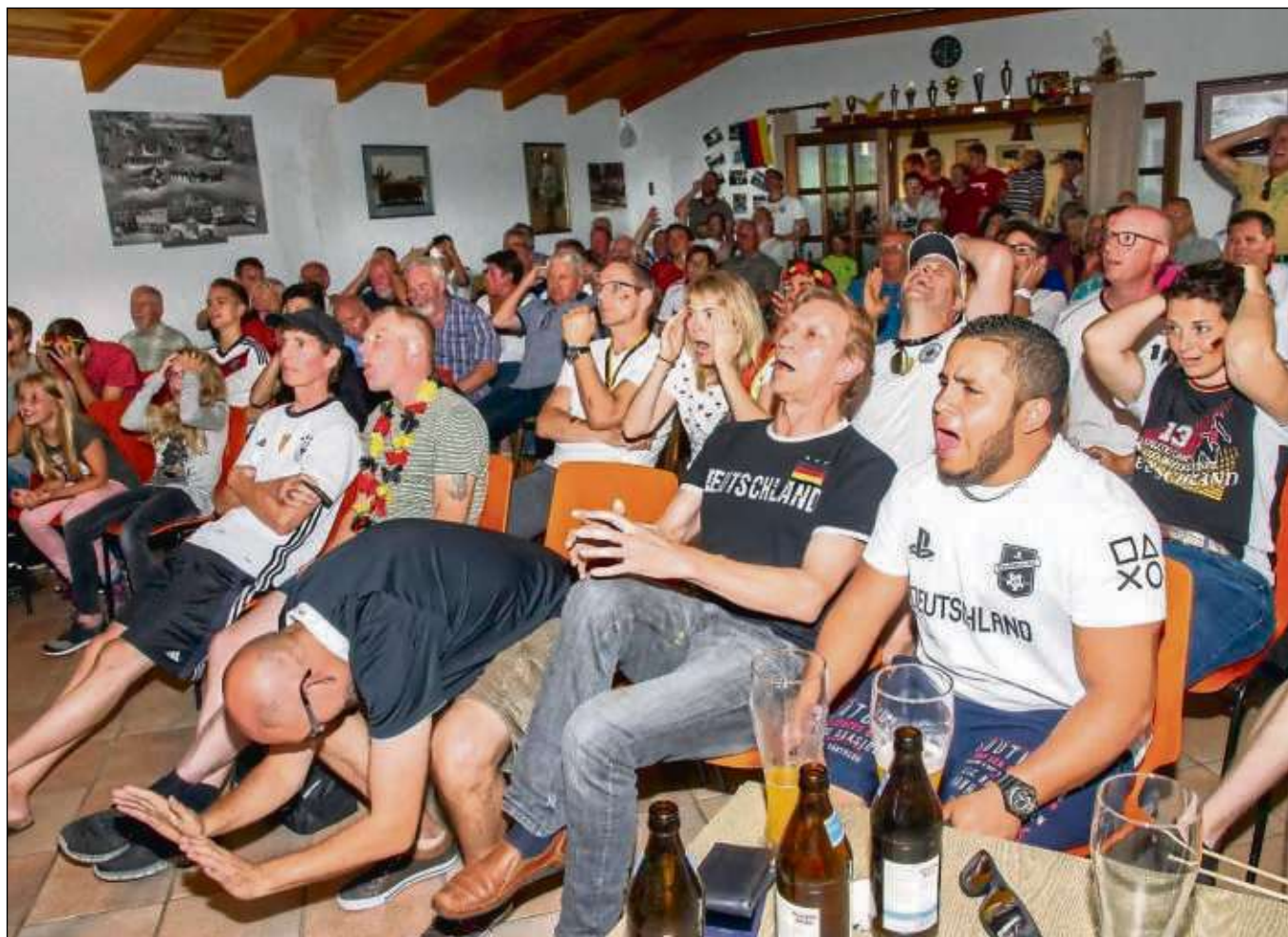
Verzweiflung statt Jubel war angesagt beim Public-Viewing des Sängerkors der TGM Seligenstadt, das bestätigen wohl alle Gesichter. Das erste Gruppenspiel verlor die Deutsche Fußball-Nationalmannschaft bei der Weltmeisterschaft in Russland gegen Mexiko. Was bleibt? Hoffnung auf das Schwedenspiel am Samstag und dann meldet sich die SHB-Redaktion wieder vor dem Südkorea-Spiel. beko/Foto: ha