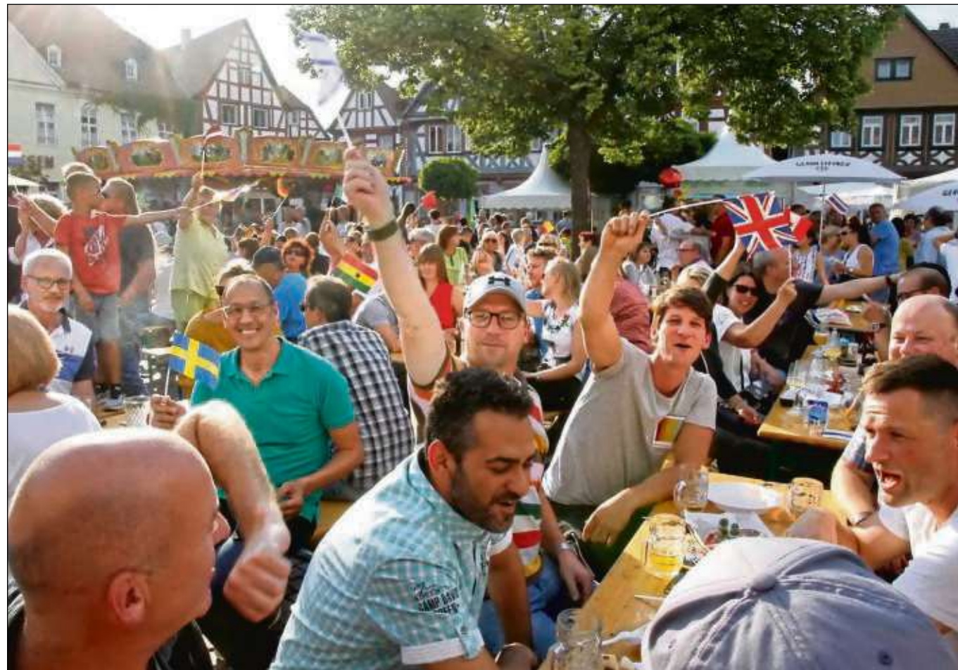
Kulinarische Meile, Livemusik, verkaufsoffener Sonntag und natürlich ein Superwetter sorgten am Wochenende dafür, dass Seligenstadt wieder Treffpunkt für Tausende Besucher aus der ganzen Region war.

gebackene Forelle. Täglich gibt es darüber hinaus noch Würste vom Grill, Pommes Frites und Salat. Weizenbier und Helles von Fass. Eine Auswahl an Weinen, weiteren Bieren und Softdrinks. Der Biergarten ist am Sonntag von 10.30 bis 21.30 Uhr geöffnet. Von Montag bis Freitag von 17 bis 21.30 Uhr.