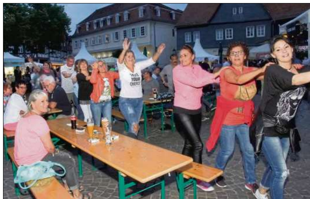
Polonaise üben Marktplatz, das sieht man auch nicht alle Tage. Aber zum „Sommer in der Stadt“ wird so einiges geboten im Städtche.