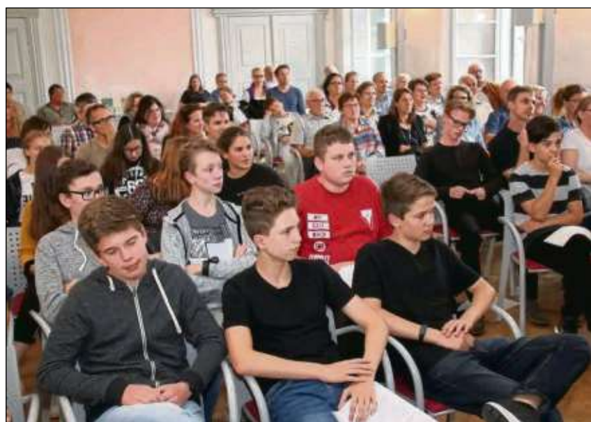
Schüler der Klasse 8a der Einhardschule vertonen mit Hilfe von Radiojournalisten Geschichten über Einhard.

Seligenstadt (zfk) - Ihr 35-jähriges Bestehen feiert der Verein Eltern-Kind-Initiative mit einem großen „Trucks! Trucks! Trucks!“-Fest am Samstag, 22. September, ab 14 Uhr rund um die Kita der Wilden 13. Im Jahr 1983 gründeten damals elf Elternteile den Verein, um ihren Kindern von klein auf die Möglichkeit zu geben, mit Gleichaltrigen zu spielen und sie gut betreut zu wissen, denn es gab keine Betreuung zwischen der Krabbelgruppe und dem Kindergarten. Anfangs fanden sich sieben Kinder ab einem Alter von zwei Jahren ein, 1986 entstand aber schon ein Ganztags-Betreuungsangebot für Kids zwischen zwei und zwölf Jahren. Aktuell tummeln sich täglich 40 Kinder in Krippe und Tagesstätte. Beim Fest stehen ein Spieltruck, ein Foodtruck, ein Eistruck sowie ein Hüpftruck bereit. Mit Live-Musik der W13-Ehemaligen „Head up high“, einem Auftritt der „Freien Schule“ sowie weiteren Aktionen ist für beste Unterhaltung gesorgt.