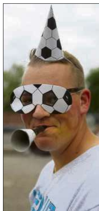
Die Fans sind bereit für die WM. Mehr Seite 4.

Am Sonntag, 24. Juni, ist ab zehn Uhr Festbetrieb. Es werden die Ehrungen der Mitglieder mit Vereinsjubiläum vorgenommen. Eine musikalische Begleitung erhält der Sonntag durch den Musikverein Klein-Welzheim 1966 sowie Tanzeinlagen der Gruppen Little Giants, No Limits und Tanzbienenchen.