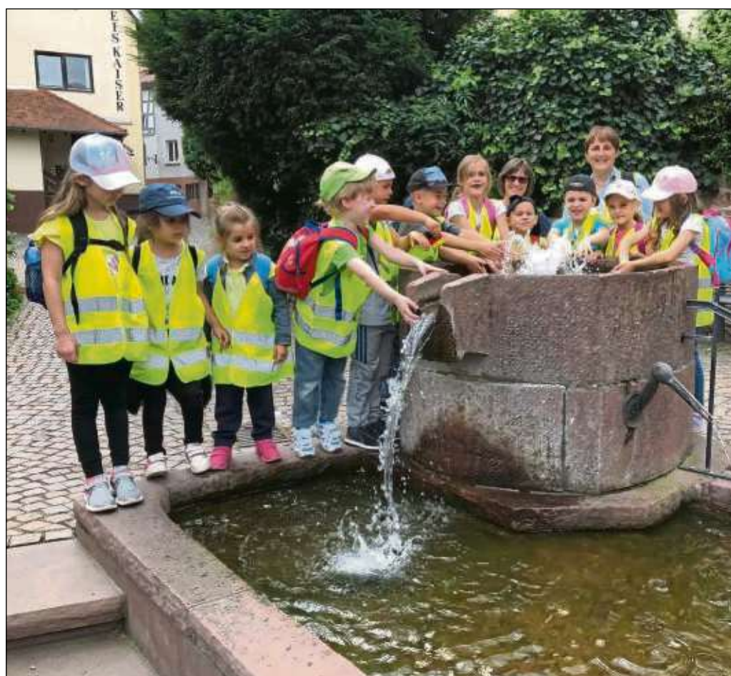
Treffpunkt „Roter Brunnen“ in Seligenstadt, gerade an den sonnigen Tagen heiß begehrt. Am Montag traf unser Redakteur diese Kita-Gruppe aus Klein-Auheim, die einen Ausflug per Zug in die Einhardstadt unternahm.

bis 16 Uhr sowie sonntags und feiertags von 12 bis 16 Uhr. Wer das SHB im eigenen Briefkasten nicht erhält, kann sich in Verbindung setzen mit dem Vertrieb unter ☎ 069 85008476 oder per E-Mail an vertrieb@stadtpost.de