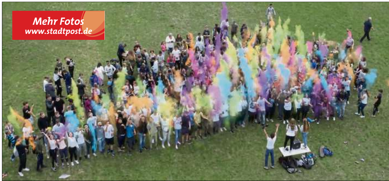
Mehr Fotos www.stadtpost.de

Preis enthalten) gibt es noch die Möglichkeit zwei Stunden zu trainieren. Bei einem Abschlussturnier können die neu erlernten Fähigkeiten gleich angewendet werden. Verschiedene Bausteine können gewählt werden. Mehr dazu auf der Homepage des Clubs. Teilnehmen können alle Mitglieder des TC Hainstadt, aber auch Gäste sind willkommen. Anmeldung per E-Mail an trainer.charlene@TC-Hainstadt.de . www.tc-hainstadt.de