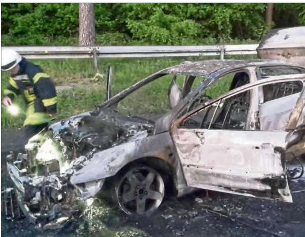
Gleich zweimal mussten die Einsatzkräfte der Seligenstädter Feuerwehr am Wochenende ausrücken. Am Freitagnachmittag alarmierte es zu einer ausgelösten Brandmeldeanlage in der Asklepios-Klinik. Ursache hierfür war ein angebranntes Essen in der Mikrowelle. Nach einer Kontrolle mit einer Wärmebildkamera konnte die Feuerwehr schnell Entwarnung geben. Spektakulärer verlief ein PKW-Brand auf der Bundesautobahn A3 auf dem Parkplatz Mainhausen. Dieser stand beim Eintreffen der Feuerwehr im Vollbrand. Mit einem Wasser- und Schaumrohr mussten zwei Trupps unter Atemschutz den PKW ablöschen. Verletzt wurde bei diesem Einsatz zum Glück niemand.