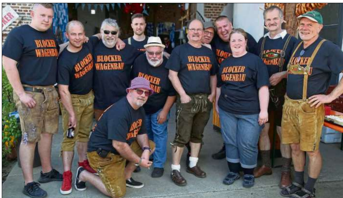
Die Wagenbauer der Blocker in Seligenstadt feierten auf dem Gelände der Anton-Bauer-Scheune an der Abt-Peter-Straße ihr 40-jähriges Bestehen. Weitere Fotos online auf www.seligenstaedter-heimatblatt.de

Seligenstadt (beko) – Ihr 40-Jähriges feiern die Wagenbauer des Seligenstädter Blockhausclubs in diesem Jahr. Nicht nur in der Fastnachtszeit sind die Mitglieder aktiv, auch während des Jahres gibt es die eine oder andere Aktion. Wie beispielsweise die Feier am Samstag auf dem Gelände der Anton-Bauer-Scheune an der Abt-Peter-Straße. Und da gab's jede Menge Spaß und natürlich wurde viel in Erinnerungen geschwelgt.