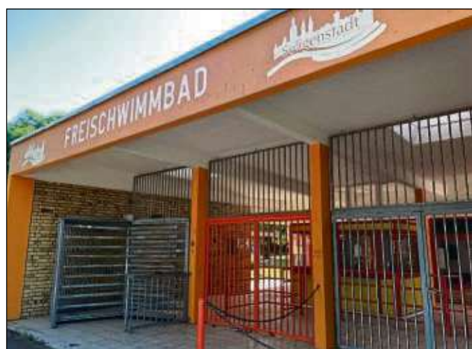
Noch ist alles dicht am Freischwimmbad Seligenstadt. Am Montag, 14. Mai, öffnen die Pforten.

Alle Veranstaltungen und Aktionen in Orten, Städten, Landkreisen und Regionen und alles Wissenswerte zum Museumstag finden Interessierte auf www.museumstag.de