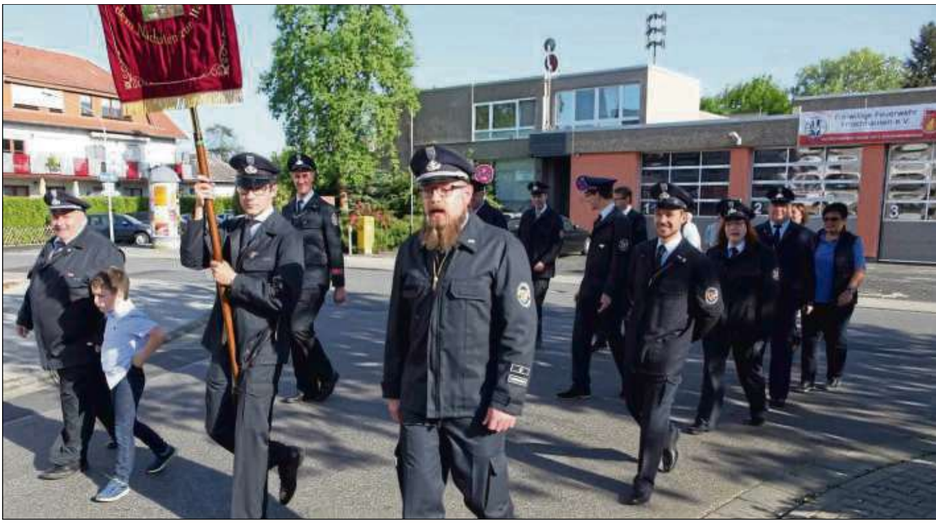
Mit einem Umzug zur Kirche, Gottesdienst, Friedhofsgang und anschließenden Umtrunk hat die Freiwillige Feuerwehr Froshausen ihren Florianstag begangen. 115-jähriges Bestehen feiert die Feuerwehr am heutigen Mittwoch ab 18 Uhr und am morgigen „Vatertag“ ab zehn Uhr. Mehr dazu auf Seite 4.