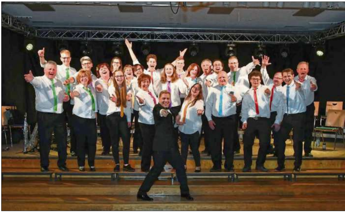
Überaus begeistert zeigten sich die Akteure der Kapelle der Freiwilligen Feuerwehr Mainflingen bei ihrem Jahreskonzert unter dem Motto „Flower Power - einmal Woodstock und zurück“. Weitere Fotos online.

Mainflingen (red) – Das weit über Mainflingen hinausbekannte Weinfest Wein am Main findet künftig nicht mehr am Wochenende nach Himmelfahrt statt. Ab sofort heißt es „Wein am Main - Sommertime“. Unter diesem Motto wird am Samstag, 21. Juli, in Mainflingen ein Sommerfest auf der Festwiese am Main gefeiert. Die Planungen sind in vollem Gange. Mit neuem Konzept und Angebot an ausgesuchten Weinen und kulinarischen Schmanckerln setzt der Verein Gude Sache seine gemeinnützige Arbeit fort. Mehr zur Jahresversammlung online auf www.seli-gaestaedter-heimatblatt.de