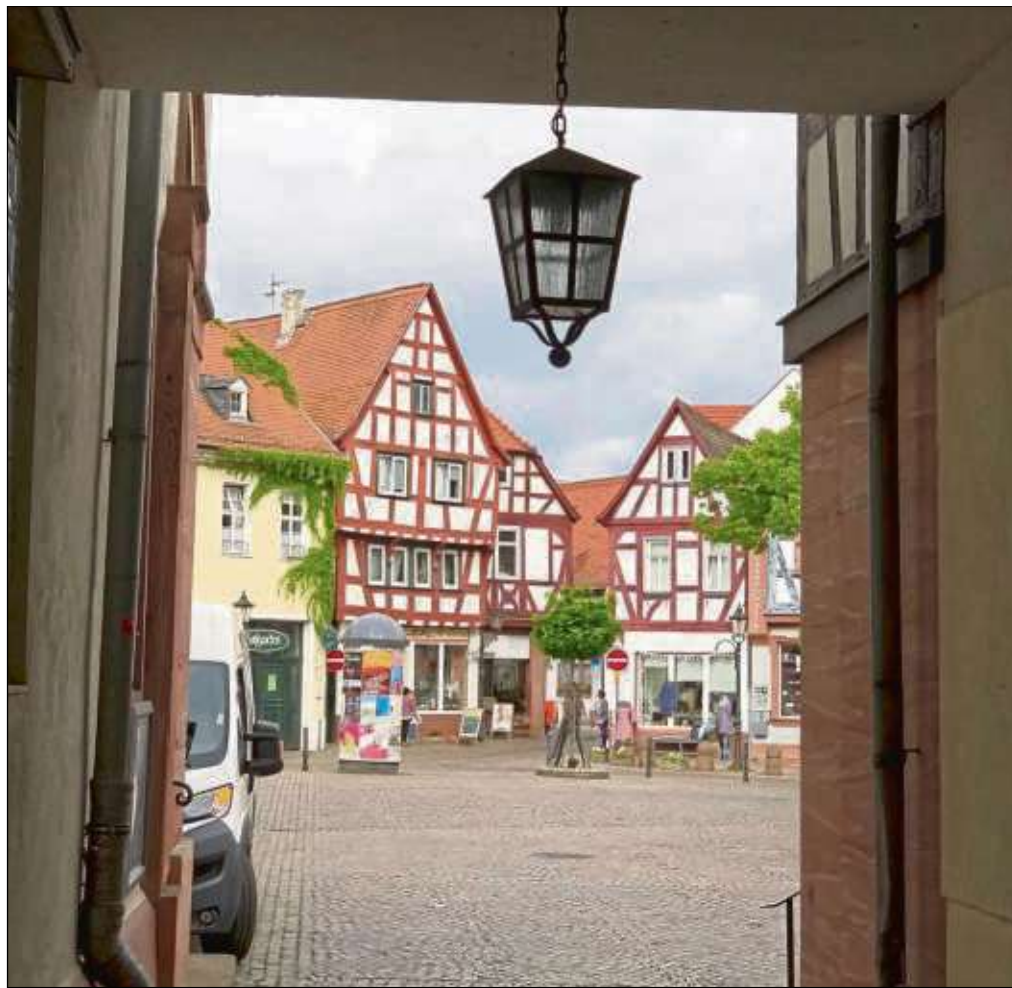
Den Durchblick muss man schon behalten dieser Tage, beim Blick auf das Fachwerk am Marktplatz, allerdings auch bei den hunderten Mails, die in die Redaktion flattern. Nicht alles kann berücksichtigt werden, vieles ist dann auch online zu finden. Wie sagt man so schön? „Da beißt die Maus keinen Faden ab!“.

Es grüßt euch herzlich, euer Turmmännche