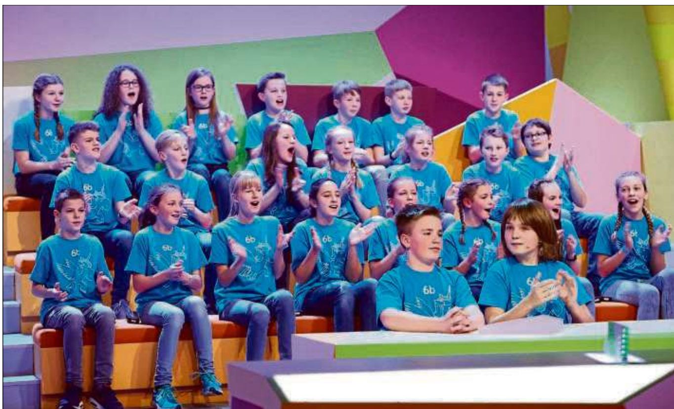
Die Klasse 6b der Einhardsschule Seligenstadt nimmt bei der bekannten Quizshow „Beste Klasse Deutschlands 2018“ auf Kika teil. Dort wird sich zeigen, ob die Vorbereitungen die Klasse zum Erfolg führen.

Die Einhardsschule stellt ihr Wissen unter Beweis/ Geht es bald nach Edinburgh?