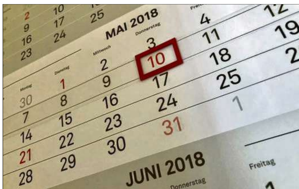
Feiertag am 10. Mai wegen Christi Himmelfahrt (und „Brückentag“ am Freitag). Aber vielleicht ist er ja bald verschwunden, wenn nur noch der „Vatertag“ dominiert.

auf ihren lokalen Seligenstadt-Seiten. Vereine, die ihre Informationen in Kurzform mit Fotos an die Heimatblatt-Redaktion geliefert haben, sind bereits berücksichtigt worden oder finden die Informationen in den nächsten Tagen online auf der Seite www.seligenstaedter-heimatblatt.de