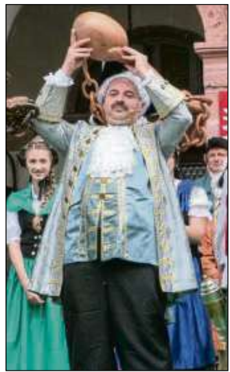
Johann Lafer kommt wieder nach Seligenstadt.