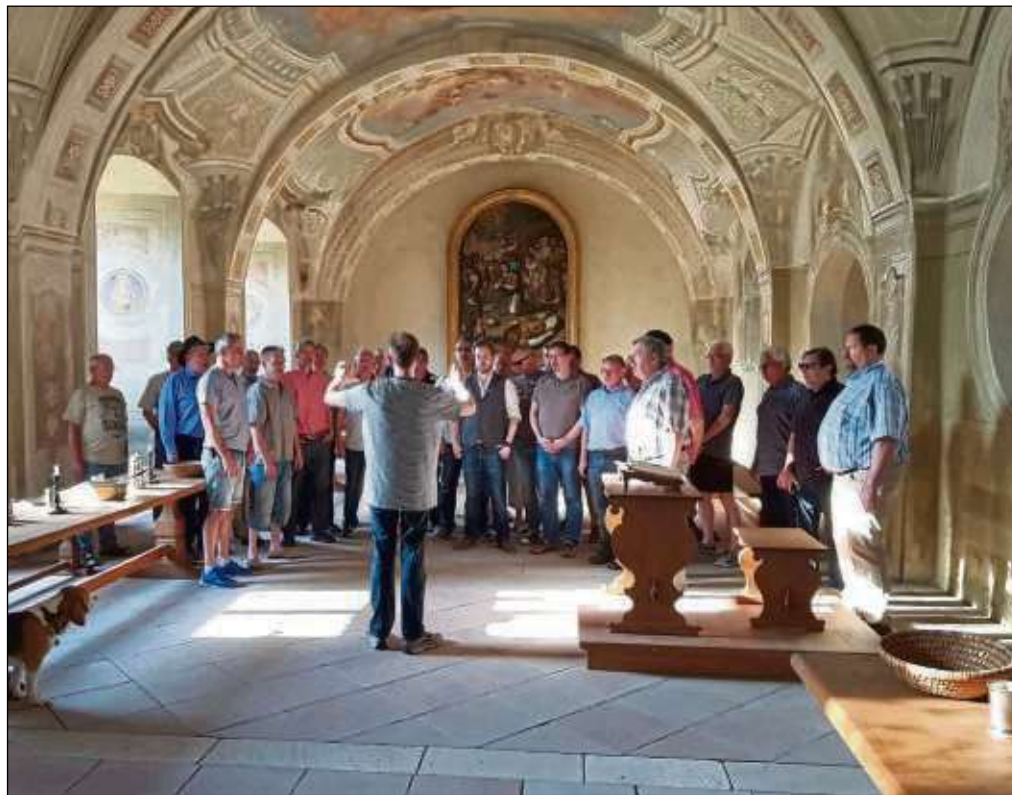
Besichtigung der Prälatur: Anstatt wie üblich eine Frühjahrswanderung zu unternehmen, besichtigten die Mitglieder der „Gesellschaft der Freunde“ in diesem Jahr die Prälatur im Seligenstädter Kloster. Nach einem klanggewaltigen Ständchen im Sommerrefektorium ließen die Freunde bei schönem Wetter den Tag gemütlich ausklingen.