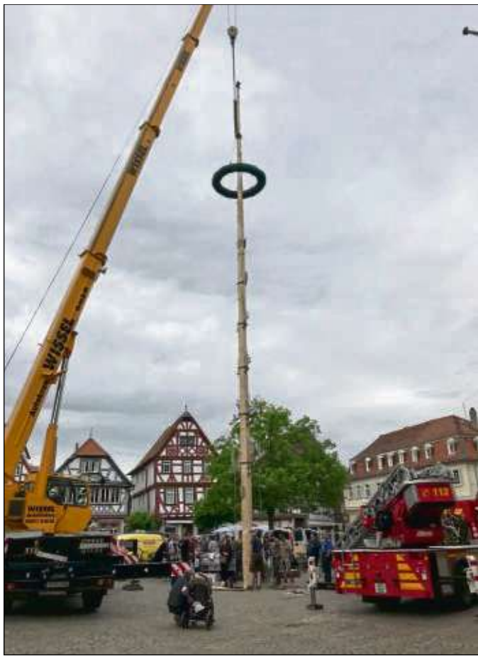
Er steht wieder auf dem Marktplatz, der Maibaum als Symbol der Seligenstädter Bauhandwerkerschaft, und er ragt fast 25 Meter in die Luft. Mit einem schweren Autokran wurde der Baum aufgestellt, an der Spitze der „Till“.

Seligenstadt (zfk) – Die nächste Theaterfahrt zu den Brüder-Grimm-Festspielen in Hanau des Kulturrings Seligenstadt ist am Mittwoch, 27. Juni, mit Abfahrt an den bekannten Zustiegsstellen, zum Beispiel um 19 Uhr an der Feuerwehr in Seligenstadt. Hier besuchen die Teilnehmer das Musical. Aufwendige Kostüme sowie tolle Live-Musik sorgen für einen eindrucksvollen Theaterabend für Zuschauer jeden Alters. Die Kosten betragen 32 Euro pro Person in der Sitzplatzkategorie eins (überdacht). Anmeldeschluss ist am Dienstag, 15. Mai. Anmeldung nimmt Katrin Schmidt, welche unter ☎ 06023 5070047 oder per E-Mail an elk.w.schmidt@t-online.de zu erreichen ist, entgegen.