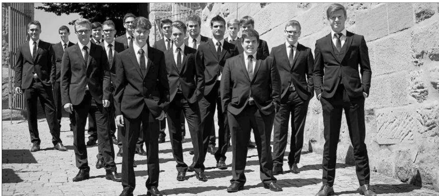
25 junge Männer sind dem Windsbacher Knabenchor entwachsen und singen auf allerhöchstem Niveau. Auf dem Weg zum Deutschen Chorwettbewerb verbringt der Chor „Sonat Vox“ ein Wochenende in St. Gabriel und gestaltet den Gottesdienst mit. Bereits samstags ist ein Konzert in Mainflingen.

„Menschenbild“ heißt die neue Ausstellung in der Galerie Kunstforum Vokalensemble in Mainflingen und Hainstadt