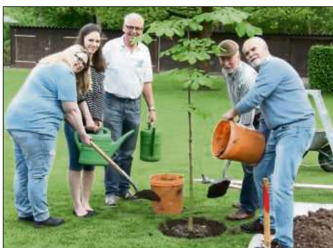
Eine junge Kastanie pflanzte nun der Sängerkhor der Turngemeinde Seligenstadt auf seinem Vereinsgelände an der Zellhäuser Straße. Die Patenschaft für den Jubiläumsbaum, welcher auf den Namen Gustav getauft wurde, wurde stellvertretend für den gesamten Jugendchor von zwei seiner Vertreterinnen übernommen. Zuletzt wurde anlässlich des 150. Vereinsjubiläums im Jahr 1998 eine Kastanie gepflanzt.

Wallfahrtsfeierlichkeiten im Juni 2004 mit Gottesdienst, Vesper, Prozession durch die Stadt sowie das darauffolgende Pfarrfest. Im Anschluss sind alle Besucher noch zu einem Umtrunk im St. Josefshaus eingeladen. Karten gibt es im Vorverkauf für fünf Euro in der Buchhandlung geschichten*reich, der Blumenwerkstatt Schließmann und im der buchladen. Der Erlös des Abends ist für die Messdienerwallfahrt nach Rom bestimmt.