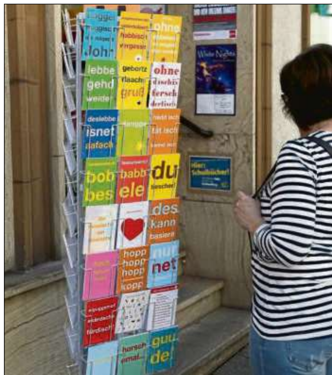
Eiguggemol ekärdsche fürdisch! Okay, net humnertprozendisch, awwer es iss aach net leicht, de hessische Dialekt uff sellestädterisch ohne Fehler riwwer zu bringe. Awwer die viele Karte, die unsern Redakteur (oder mit ö?) beim Friehlingsmarkt im Städtische beim „buchlade“ entdeckt hoat, sinn schun moal wesentlich besser als bisher gesehene. Heeß? Isch muss mer gleich moal e poar Kärdscher hole, aach wenn moin „hessische Daach“ annerst aussieht als uff de Kard beschriwwene.