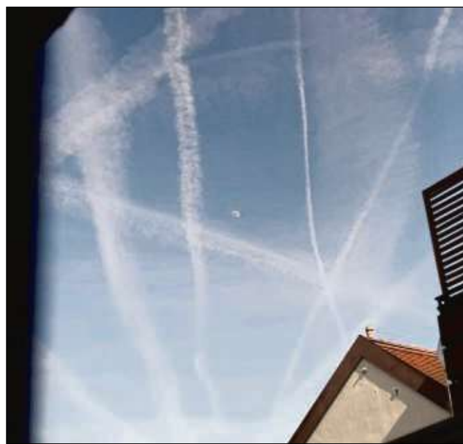
Der Blick aus dem Redaktionsfenster zeigt dieser Tage „Spuren am Himmel rund um den Mond“.

wird. Um 11 Uhr läutet das Blasorchester des TFC Steinheim den Frühschoppen musikalisch mit zwei Stunden Schlager, Swing und Evergreens ein. Das Schülerorchester nimmt im Anschluss auf der Bühne Platz und unterhält die Besucher mit einem kleinen Konzert. Danach feiert die Tanzband „Sunshine“ in gewohnter Weise mit allen Gästen zum Dämmer-schoppen mit Schlager, Oldies und Partyhits bis in die Abendstunden. Am Eingang gibt es wieder Taschen- und Alkoholkontrollen geben. Für die vielen Fahrräder gibt es ausreichend Parkmöglichkeiten. Ende des Festes ist um 21 Uhr. www.mge1888.de