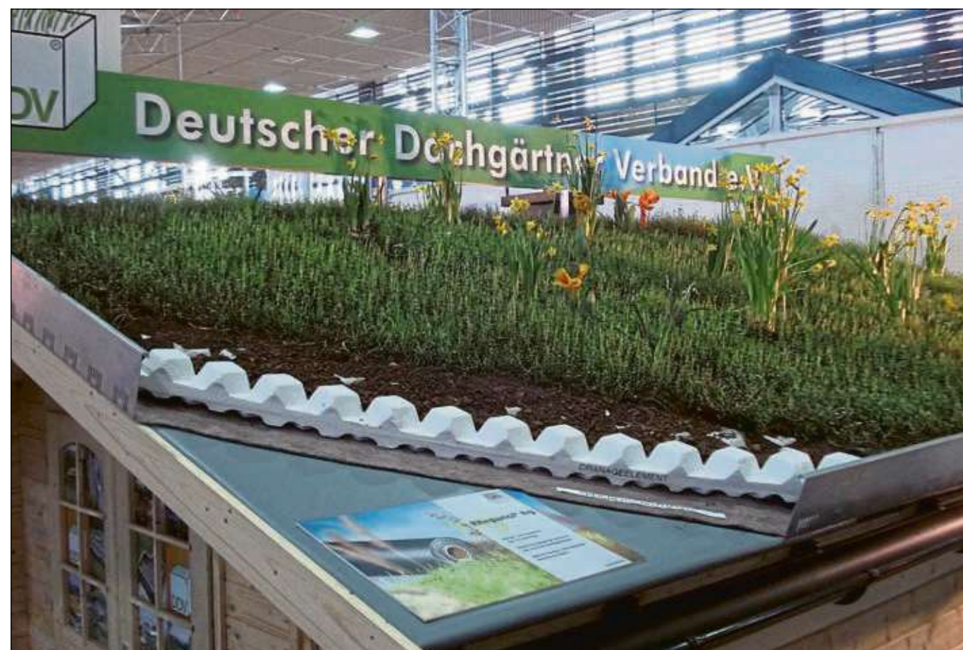
Muster-Dachbegrünung auf der Baumesse

oder „nur“ ein grünes Dach gewünscht wird. Außer den erforderlichen Genehmigungen sind dann Fachleute gefragt, denn eine solche Aufgabe kann kaum in Eigenleistung gelöst werden. Statiker und Architekten sind ebenso gefragt wie Landschaftsgärtner. lps/Cb.