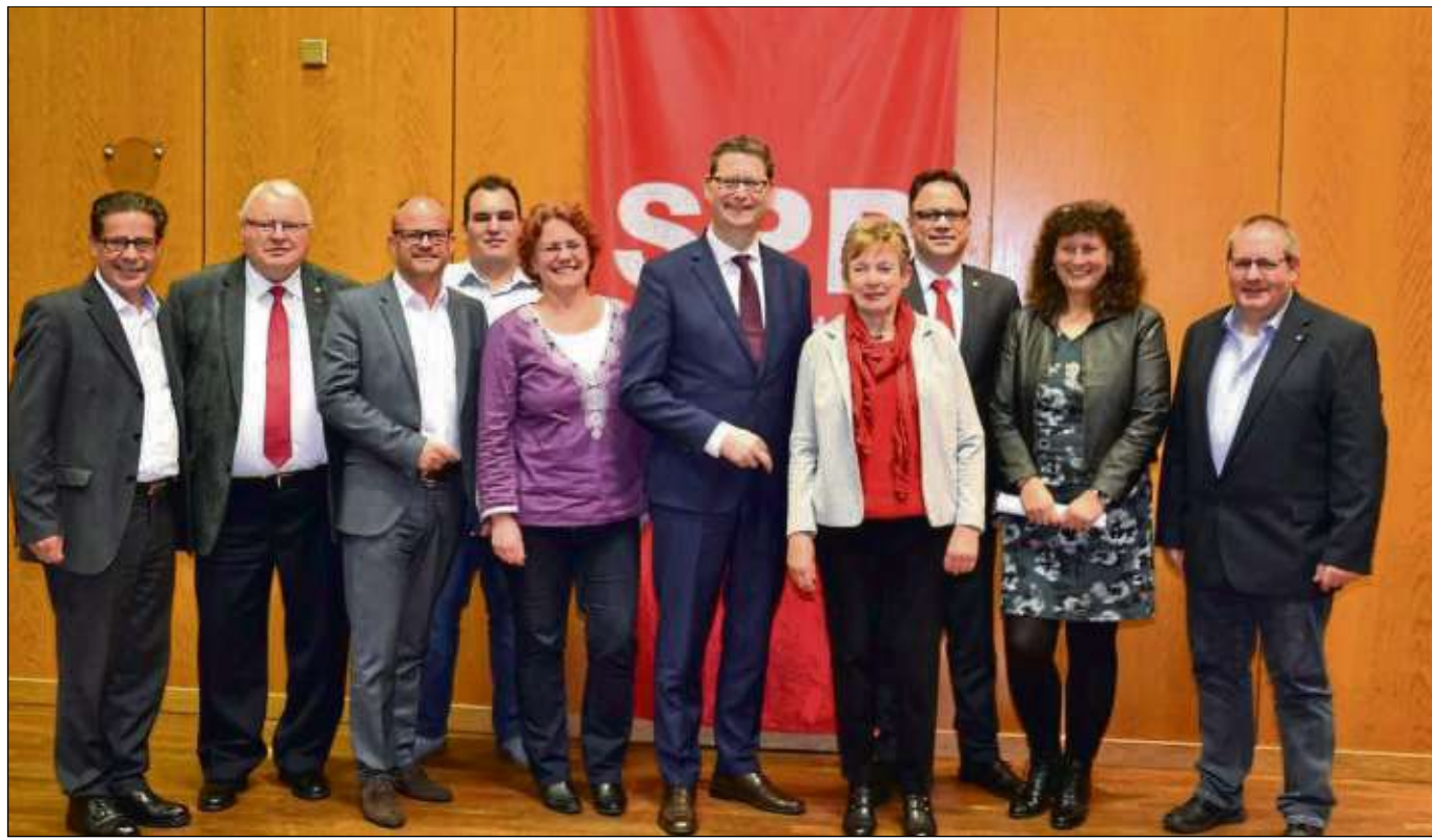
Der hessische SPD Partei- und Fraktionschef Thorsten Schäfer-Gümbel (Mitte) sprach vor rund 70 Zuhörern im Bürgerhaus Zellhausen anlässlich des Frühjahrsempfangs der SPD Mainhausen über die aktuellen Themen Arbeitswelt und Digitalisierung sowie Bildung.

triebs Campingplatz und Badeseen, unterstützen die DLRG-Ortsgruppen Mainflingen und Babenhausen das Personal des Eigenbetriebes auch in dieser Saison wieder professionell. Die Eintrittspreise sind stabil geblieben: Tageskarte drei Euro für Erwachsene, 1,80 Euro für Kinder und junge Erwachsene; Familienkarte: acht Euro (zwei Erwachsene, bis zu drei Kindern); Zehnerkarten: 14 Euro für Kinder und junge Erwachsene, 25 Euro für Erwachsene. Die Dauerkarte kostet 50 Euro für Erwachsene und 25 Euro für Kinder und junge Erwachsene.