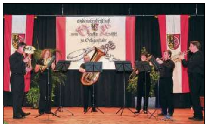
Der Bläserkreis der Stadtkapelle Seligenstadt untermalt das Geleitsmahl am Samstag musikalisch.

Seligenstadt (beko) – „Mascha und der Bär“ lautet der Titel des Bilderbuchtheaters, eine Geschichte basierend auf einem alten russischen Märchen. Das Figurentheater tritt auf am Donnerstag, 3. Mai, ab 16 Uhr im Riesensaal. Kinder ab drei Jahren sind eingeladen.