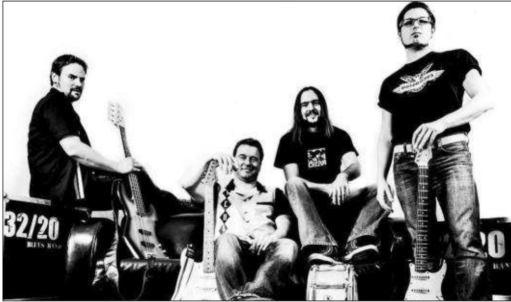
Die „32/20 Blues Band“ gastiert am Freitag, 4. Mai, in Kleins Brauhaus an der Bahnhofstraße 55 in Seligenstadt. Konzertbeginn ist um 20.30 Uhr. Die Band ist seit 18 Jahren „on the road“ und begeisterte in ihren mehr als 600 Konzerten nicht nur Fans des traditionellen Blues.

Seligenstadt (zfk) – Zu ihrem Tag der offenen Stalltür „Komm zum Pferd“ lädt der Reit- und Fahrverein (RuF) Seligenstadt, Aschaffenburger Straße 102, zum sechsten Mal für Sonntag, 6. Mai, von 11 bis 16 Uhr ein. Die Besucher erwartet ein vielseitiges Programm rund ums Pferd. Neben Ponyreiten, einer Stallrallye, verschiedenen Spielstationen und Kinderschminken werden zudem umfangreiche Vorführungen zum Thema Reitschule angeboten. Darüber hinaus ist auch für das leibliche Wohl gesorgt.