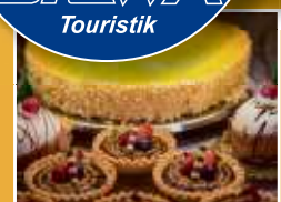
Bistro Café Zimt Genießen Sie unsere Frühstücks-, Kaffee- und Kuchenspezialitäten