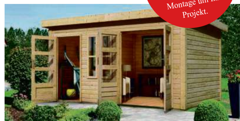
Ob Gartenhaus oder Spielhaus für die Kinder: Für die Montage vermittelt Ihnen HolzLand Becker gerne kompetente Profis.

Von allen Terrassendielen hat sich HolzLand Becker im Einkauf große Mengen zu günstigen Konditionen gesichert, erläutert Roland Nietsch, Teamleiter Bodenbeläge im HolzLand Becker: „Vom niedrigen Einkaufspreis profitieren Kunden