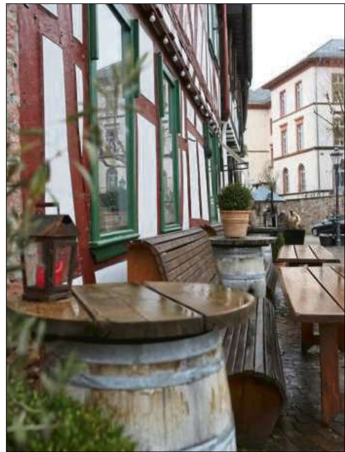
Geraten die Ideen für ein HMS-Bildungs- und Kulturzentrum in den Hintergrund? Aktuelle Meldung auf dieser Seite.