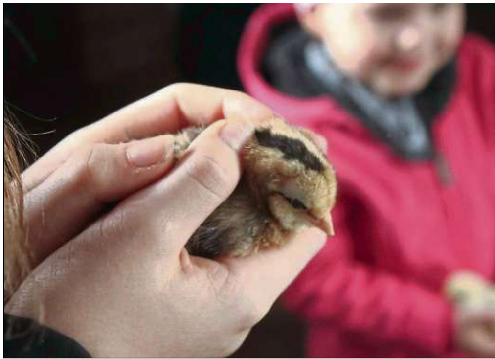
Gäste können am Ostermontag beim Geflügelzuchtverein auf dem Zuchtgelände Am Eichwald mit etwas Glück wieder live Küken schlüpfen sehen.

„Bist du ein Sportler im Alter zwischen 9 und 15 Jahren und willst dich olympischen Herausforderungen stellen, dann erlebe mit uns zehn abenteuerliche Tage in Aub.“ heißt es in der Ausschreibung. Dort erwarten die Teilnehmer vom 25. Juni bis zum 5. Juli mitreißende Abenteuer, super Spiele, herausfordernde Situationen und viele nette Menschen. Anmelden können sich Interessierte über die Onlineanmeldung: http://anmeldung.basilika-zeltlager.de