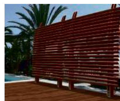
Es muss nicht jeder wissen, wie toll die neue Terrasse geworden ist – mehr als hundert verschiedene Sichtschutz-Wände gibt's im HolzLand Becker.