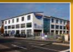
STEWA Touristik Reisezentrum Lindigstraße 2 63801 Kleinostheim