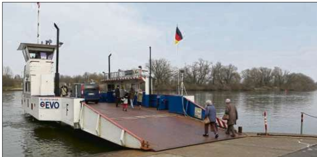
Der Frühling ist kalendarisch eingeläutet, die Tage werden länger, und die Sonne nimmt merklich an Kraft zu. „Grund genug, abends länger in Seligenstadt zu bleiben und die Attraktivität der Stadt zu genießen“, frohlockt die Stadtverwaltung. Um dem gerecht zu werden, stellt die Fähre ab Ostersonntag, 1. April, auf den Sommerfahrplan um und fährt bis zum 31. Oktober täglich von 9.45 bis 19.10 Uhr (statt bis 17 Uhr). Der Betrieb ruht in der Mittagspause von 13.15 bis 14.15 Uhr.

Ostkreis (red) – Kein übertragener Sinn vom Ostermorgen“, schreibt Pfarrer Martin Franke, der diesen frühen Gottesdienst seit Kindertagen besonders schätzt. Zusätzlich wird Leonie Krauß-Buck noch im Festgottesdienst auch taufen. Der Ostermorgen ist schon seit der frühen Christenheit eine besondere Zeit, um Gott zu loben und sich neu des Glaubens zu vergewissern. Es ist auch der traditionellste Tauftermin. Kein Dunkeln ins Licht führt. Auferstehung wird körperlich erlebbar, wenn die Gottesdienstbesucher sich mit Pfarrerin Leonie Krauß-Buck noch im Dunkeln versammeln und über Ostergesängen, Gebeten, Gemeinschaft und Predigt die Sonne aufgeht. Spätestens beim Abendmahl leuchtet allen das Licht eines neuen Tages entgegen. „Selten bin ich so froh und konzentriert wach wie am Ostermorgen“, schreibt Pfarrer Martin Franke, der diesen frühen Gottesdienst seit Kindertagen besonders schätzt. Zusätzlich wird Leonie Krauß-Buck noch im Festgottesdienst auch taufen. Der Ostermorgen ist schon seit der frühen Christenheit eine besondere Zeit, um Gott zu loben und sich neu des Glaubens zu vergewissern. Es ist auch der traditionellste Tauftermin.