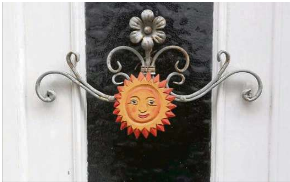
Neue Kraft und Hoffnung birgt der Frühling. Die ersten Sonnenstrahlen erleuchten beim Frühgottesdienst die Besucher und bringen die Auferstehung Jesu näher.

Frühgottesdienst am Ostersonntag um sechs Uhr