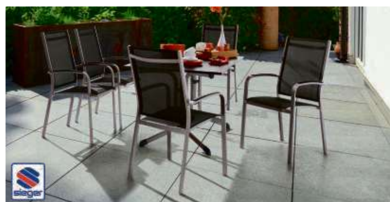
Bei Gartenmöbeln sind dezente Töne angesagt – schöne Farbtupfer liefert die Natur dazu.

miniert Teak, oft in Kombination mit Aluminium oder Edelstahl. So entsteht eine Einheit von Eleganz und perfekter Funktionalität – mal im coolen Look, mal mit sehr viel Wärme. Die Materialien für die Sessel reichen von edler Textilbespannung bis zum Kunststoffgeflecht in Rattan-Optik: Schöne Struktur fürs Auge, dabei absolut witterungsbeständig. Farblich herrschen dezentes Anthrazit, Silber und eine Variation angesagter Grautöne vor.