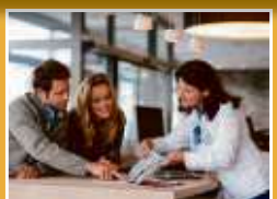
Reisebüro 360° 11 Beratungsplätze für Flug-, Bus- und Seereisen