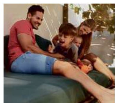
Nicht nur im Wohnzimmer kann man Spaß auf der Sofa-Landschaft haben.

In Obertshausen präsentiert HolzLand Becker seinen Kunden in diesem Frühjahr erstmals in einer neuen, großen, lichtdurchfluteten Halle eine riesige Ausstellung an hochwertigen Gartenmöbeln, die ihresgleichen sucht: Von der superbequemen Lounge-Sofalandschaft über praktische Stapelsessel bis zur klassischen