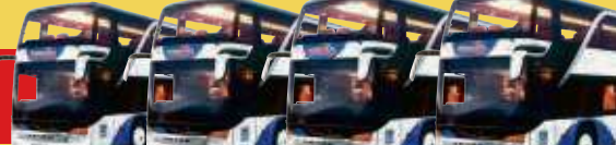
Die größte Bistabus-Flotte Deutschlands: 25 Fahrzeuge im STEWA-Fuhrpark

Bitte geben Sie bei Buchung Ihrer Reise die Glückslos-Nr. an (siehe oben links) und nehmen Sie an der monatlichen Verlosung einer Reise teil.