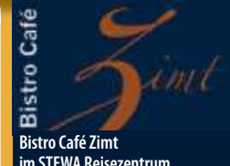
Bistro Café Zimt im STEWA Reisezentrum Lindigstr. 2 | 63801 Kleinostheim Tel. 06027 40972 390 Kostenfreie Parkmöglichkeit www.cafe-zimt.de

THEMENWOCHE: GROSSBRITANNIEN IRLAND Cornwall Di 03.04.18 15 & 19 Uhr Irland Mi 04.04.18 15 Uhr Schottland Mi 04.04.18 19 Uhr