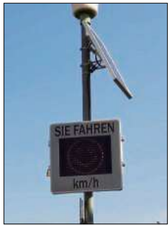
Smileys loben die Autofahrer bei gutem Verhalten.