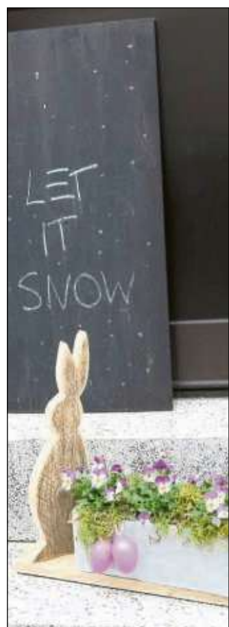
Dieses Jahr haben Schneeflocken den Frühling angestimmt. Stellt sich nun die Frage, ob die Ostereier dieses Jahr im Schnee gesucht werden.

Vereine können ihre Berichte und honorarfreie Fotos senden an shb@stadtpost.de . Ausführliche Berichte bitte an die OP-Redaktion.