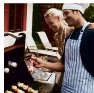
Papa hat's voll drauf. Den Profi-Grill dazu gibt's bei HolzLand Becker.

Und wer sich ums Montieren von Terrassendielen, Sichtschutz oder des neuen Gartenhauses nicht selbst kümmern möchte, kann von HolzLand Becker ganz unkompliziert die geeigneten Handwerker vermittelt bekommen.