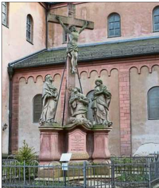
Die am Palmsonntag begonnene Karwoche dauert bis Karfreitag und Karsamstag tagsüber.

schein verfügen (Pkw, Mofa, Moped oder Motorrad). Das zulässige Körpergewicht für die Segways liegt zwischen 45 und 118 Kilogramm. Bequeme, flache Schuhe, eine windfeste Jacke und bei Bedarf Sonnenbrille und Sonnenschutz sind zu empfehlen. Bei Regen entscheidet der Veranstalter, ob die Führung stattfinden kann. Die maximale Gruppengröße liegt bei zehn Personen. Die weiteren Termine bis Juni: 8., 21. und 29. April, 6., 12., 20. und 26. Mai, 3., 9., 16., 24. und 30. Juni. Die Teilnahme kostet 69 Euro pro Person. Weitere Informationen erteilt die Tourist-Info unter ☎ 06182 87177. Buchungen unter www.cityfloater.de .