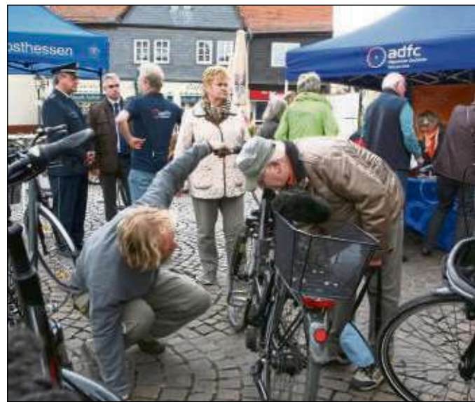
Eine Fahrradcodierung bietet der ADFC des Ostkreises wieder an am 14. und 15. April in Seligenstadt.

Seligenstadt (zfk) – Eine Fahrradcodierung bietet der Allgemeine Deutsche Fahrrad-Club (ADFC) Seligenstadt Hainburg Mainhausen am Samstag, 14. April, von 10 bis 17 Uhr und Sonntag, 15. April, von 13 bis 17 Uhr auf dem Frühlingsmarkt in Seligenstadt an. Im Kampf