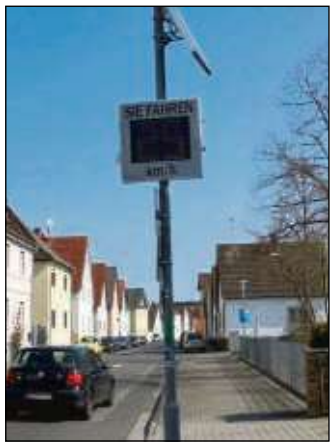
Neue Geschwindigkeitstafeln in Zellhausen.

„Im Anschluss werden die Messprotokolle ausgewertet und festgelegt, ob und welche weiteren Maßnahmen notwendig sind, um mehr Sicherheit für unsere Kinder zu schaffen“, sagt Bürgermeisterin Ruth Disser.