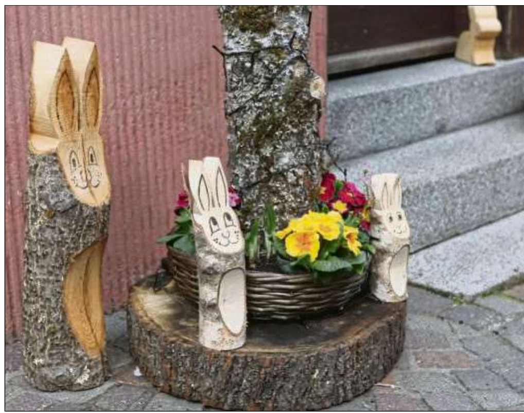
Fast überall trifft man auf Figuren des Hasen. Das Fest ohne Langohr und Ostereier ist heutzutage undenkbar. Deshalb schmücken viele ihre Häuser mit Figuren des Kulttieres.

Festes wurde? Ein Mythos besagt, dass an Ostern ein Brot in Form eines Lammes gebacken wurde. Dieses ist aber so missglückt, dass es einem Hasen zum verwechseln ähnlich sah. Somit wurde das neue Symbol geboren. Seither ist das Langohr, welches die Eier bringt, zum Status geworden.