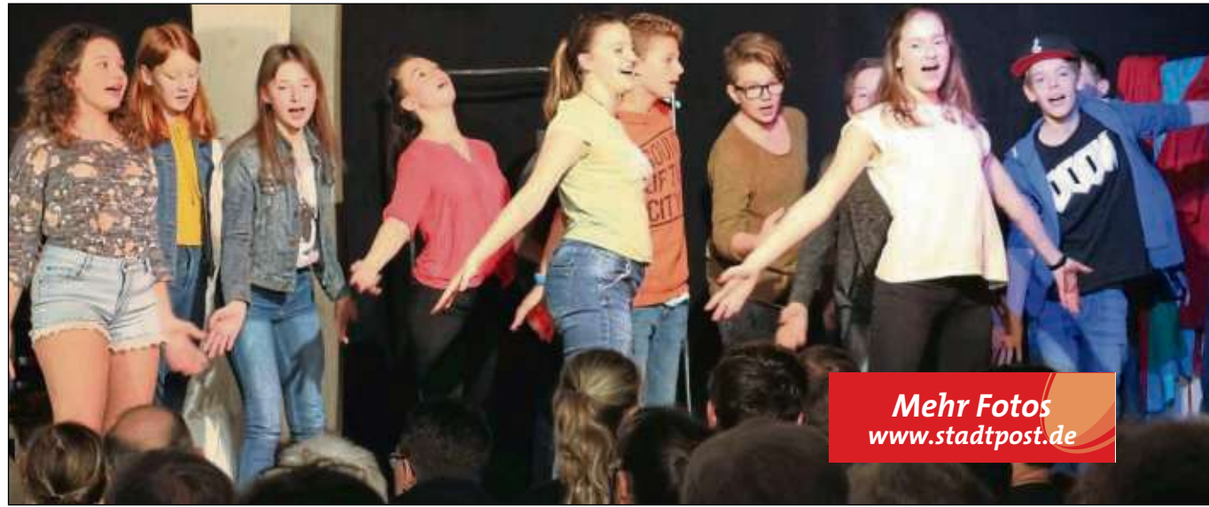
Mehr Fotos www.stadtpost.de