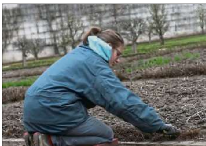
Fleißige Helfer kümmern sich um die Saat neuer Blumen. Der Klostersgarten soll ein Schmaus für das Auge werden.

Fußball-Stadion in Miniaturausstattung wartet auf die fleißigen NachwuchsgärtnerInnen. Ziel ist, dass die GrundschülerInnen durch die gute Pflege verschiedener Pflanzen ihr Löwer-Fußballstadion erschaffen und nach ihren eigenen Vorstellungen gestalten. Die Anmeldephase für die Grundschulaktion „Löwer vor, noch ein Tor!“ läuft bis zum Mittwoch, 11. April. Die Aktionsflyer liegen ab sofort in den Löwer-Gärtnereibetrieben für interessierte Grundschulen aus. Eine Anmeldung ist online über die Löwer-Webseite www.gaertnerei-loewer.de möglich.