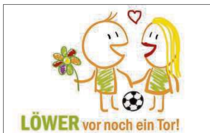
Mit diesem Logo wirbt die Gärtnerei Löwer für die Grundschulaktion in diesem Jahr.

M. SCHNEIDER Offenbach GmbH & Co. KG Frankfurter Straße 7 | 63065 Offenbach | Tel.: 069 80081155 | www.m-schneider-offenbach.de