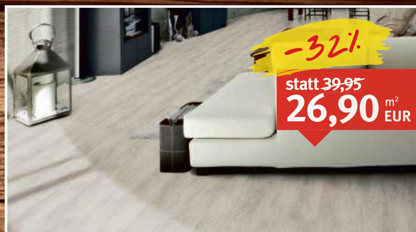
Vinylboden Anna Eiche Landhausdielen (1-Stab), Klicksystem, 4-seitig gefast, Nutzungsklasse 42, Maße: 4 x 270 x 1.220 mm