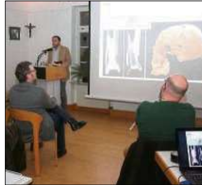
Großes Interesse bei der Analyse der Funde von Zellhausen.

carbonmethode) zur Ermittlung der Sterbedaten und mit der Strontium-Isotopen-Analyse, die über die Herkunft der frühen Bewohner Auskunft geben kann, kamen zur Sprache.