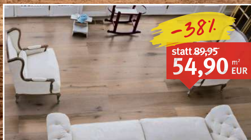
Parkettboden Stockholm Eiche Schlossdielen (1-Stab), Klicksystem, gebürstet, weiß geölt, gefast, Maße: 15 x 260 x 2.200 mm