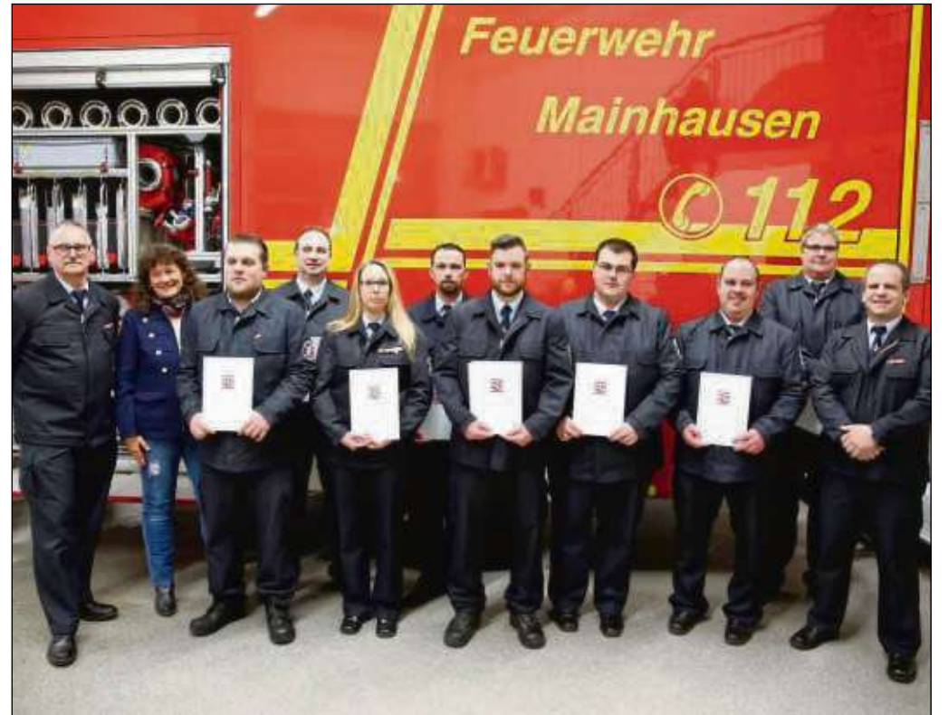
Die Feuerwehren ziehen Bilanz. Sowohl bei der Feuerwehr in Seligenstadt (Bericht folgt in der kommenden Ausgabe) als auch bei der Wehr in Mainhausen wird Bilanz gezogen. Bei den Brandeinsätzen gibt es eine Steigerung von 15 auf 19. Bemerkenswert ist dabei der Großbrand im Oktober im einem Gewerbebetrieb und die nachbarliche Löschhilfe bei einem Dachstuhlbrand in Klein Welzheim. Wie groß der Einsatz ist zeigt diese Berechnung: Addiert man alle erbrachten Leistungen der Mitglieder der Feuerwehr Mainhausen in Stunden kommen über 10000 Stunden für die Allgemeinheit zusammen. Bei mittleren Kosten für einen Facharbeiter von 33,40 Euro pro Stunde (statistisches Bundesamt) wären das zirka 350.000 im Jahr. Darüber hinaus wurden einige Feuerwehrleute befördert (siehe Foto) und ein neues Feuerwehrauto in Dienst gestellt. Mehr im Innenteil auf Seite 11.