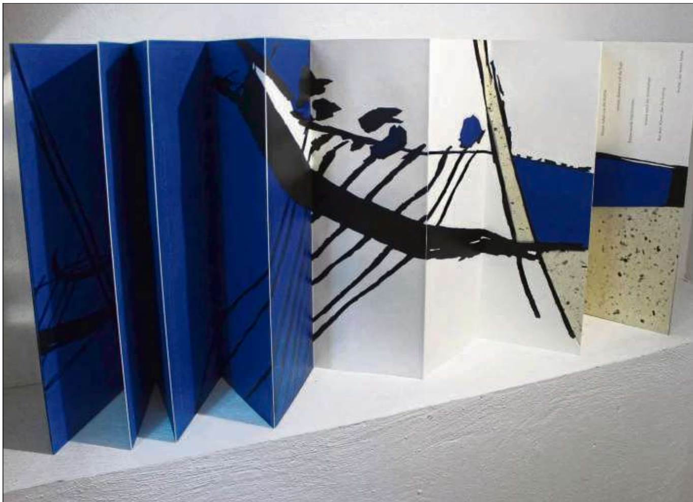
Mit einer Lesung aus dem finnischen Nationalepos „Kalevala“ lädt das Kunstforum Seligenstadt zu einer Reise in die Mythen- und Sagenwelt Finnlands ein. Sie findet am Sonntag, 18. März, um 16 Uhr in der Galerie des Kunstforums in der Frankfurter Straße 13 im Rahmen der Ausstellung „Flügelnd im Liederwind“ statt. Das aus zahlreichen Überlieferungen der finnischen Mythologie zusammengestellte und 1835 veröffentlichte Epos erzählt von den Abenteuern und Taten der großen finnischen Helden. Die Ausstellung dauert noch bis zum 2. April. Öffnungszeiten: Jeweils Freitag, Samstag, Sonntag und feiertags von 15 bis 18 Uhr und nach Absprache: ☎ 06182 924451.