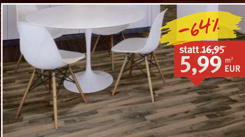
Laminat Nussbaum Naturale Schiffsboden (3-Stab), Klicksystem, Nutzungsklasse 31, Maße: 7 x 193 x 1.282 mm