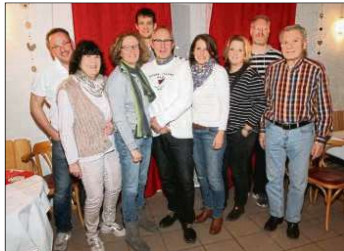
Der Vorstand des TC Hainstadt wurde wieder gewählt. Über 200 Tennisspieler sind aktiv.