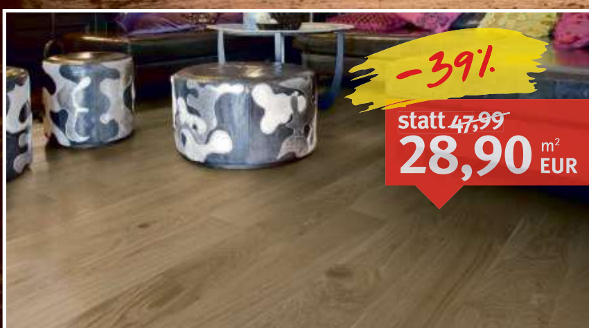
Masivholzdielen Eiche Markant Nut & Feder, natur geölt, 4-seitig gefast, Maße: 16 x 120 mm, Systemlängen: 600 – 1.200 mm