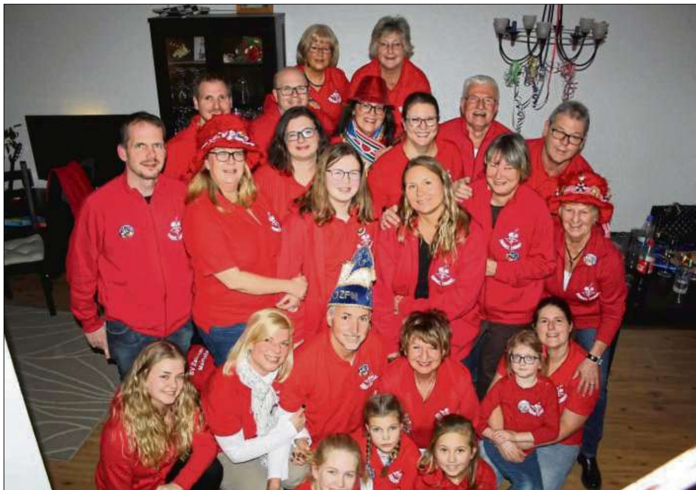
Einige Mitglieder der Gruppe Ribbel Dibbel mit Prinz Dieter III. aus Zellhausen. 30 aktive und 30 passive Mitglieder gehören zur Bruchkatzen-Truppe aus Zellhausen.