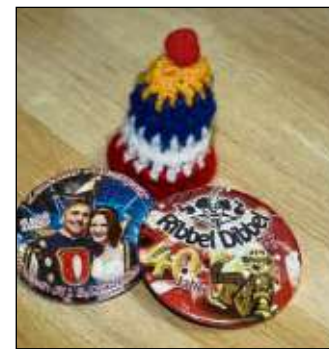
Fastnachtsmützchen und Buttons der Ribbel Dibbel.

nisation meistern sie den Rosenmontag, den sie beim Umziehen und Schminken, in der Zellhäuser Turnhalle beginnen. Essen und Trinken darf natürlich nicht fehlen und wenn alle gestärkt sind, ziehen die Ribbel Dibbel zum Umzug nach Seligenstadt. B. Wurzel