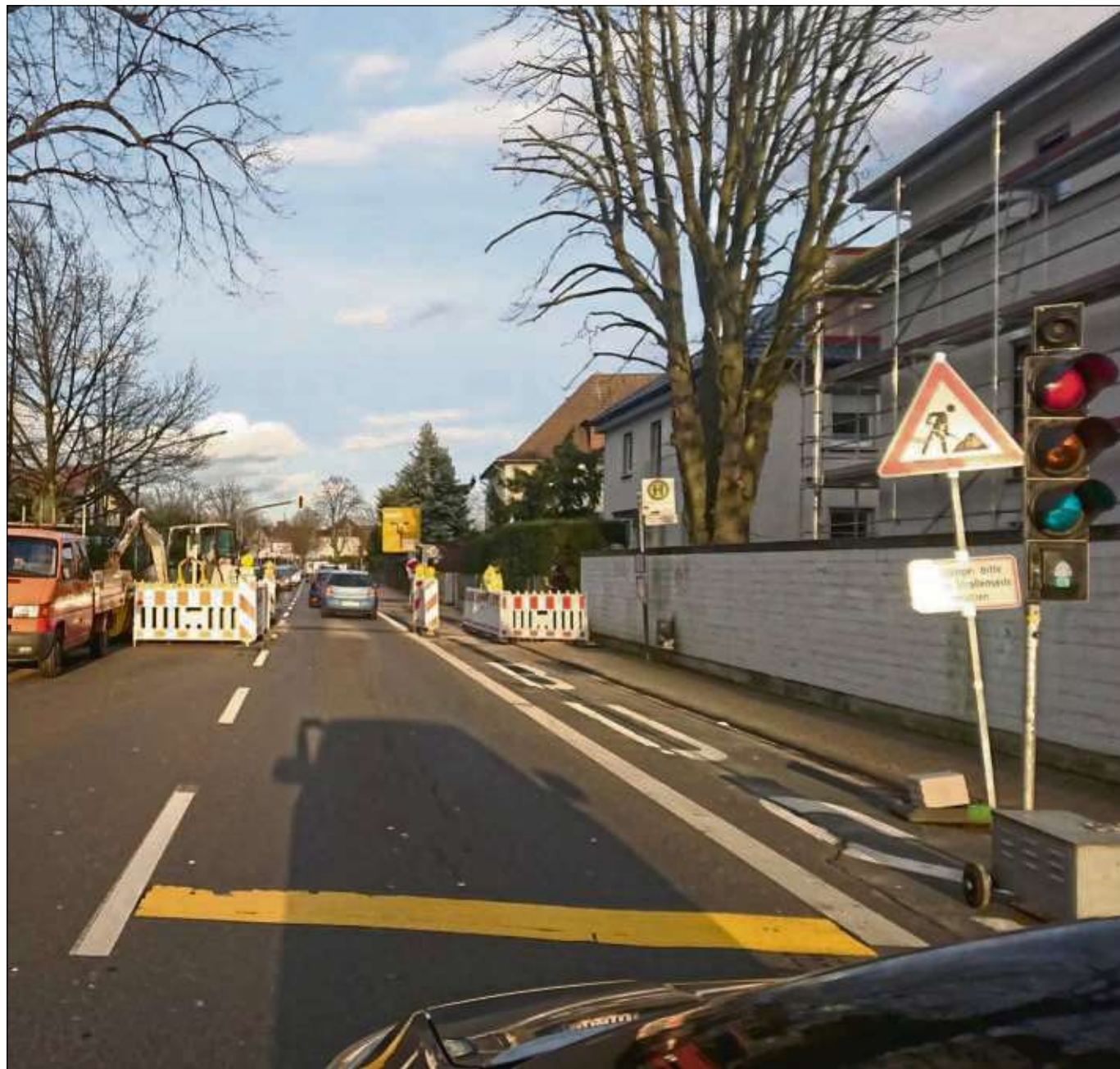
Wegen Kanalanschlussarbeiten ist die Dudenhöfer Straße ab Hausnummer 10a/Ecke Mittelbeune (gegenüber der Asklepiosklinik) derzeit gesperrt. Die Verkehrsführung wird durch mobile Ampeln gesteuert. Es kommt dadurch auch zu Behinderungen und Staus.

Seligenstadt (red) – Die Verwaltungsstellen in den Seligenstädter Stadtteilen Froschhausen und Klein-Welzheim bleiben am heutigen Mittwoch, 31. Januar, geschlossen, da kein Vertretungspersonal zur Verfügung steht. Darüber informiert Bürgermeister Daniell Bastian.