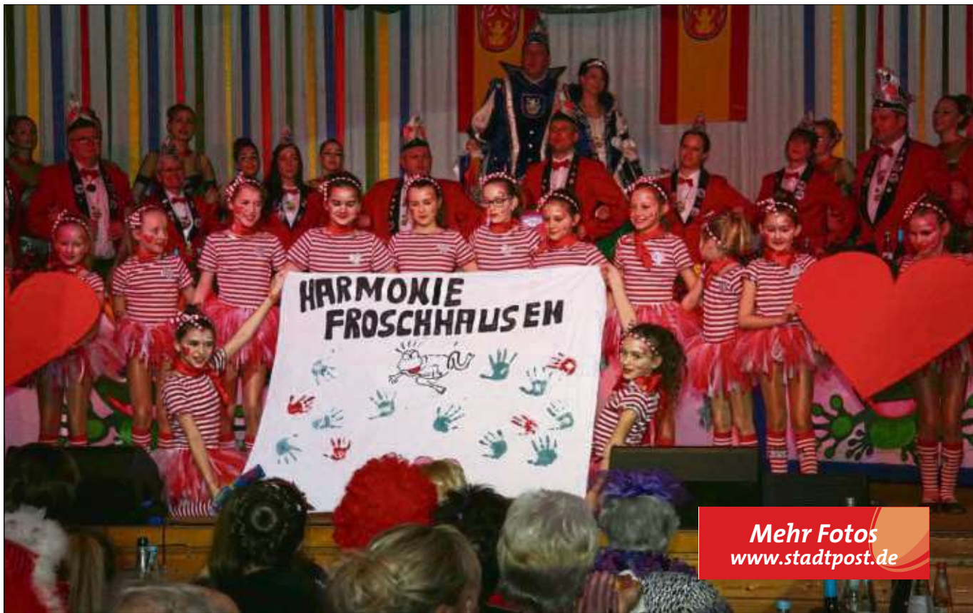
Mehr Fotos www.stadtpost.de