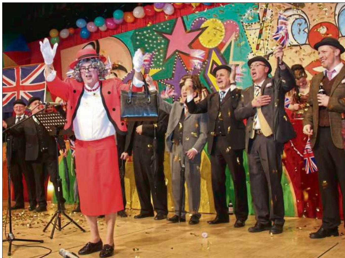
Hoher Besuch bei „Harmonie-Sitzung meets KJG Kappabend“ in Zellhausen: Queen „Lizabeth II.“ freut sich schon auf den Besuch der Sänger beim großen Chorfestival in Wales im kommenden Juli.

Kartenverkauf für die Veranstaltung der Gruppe „Die Jungen Alten“