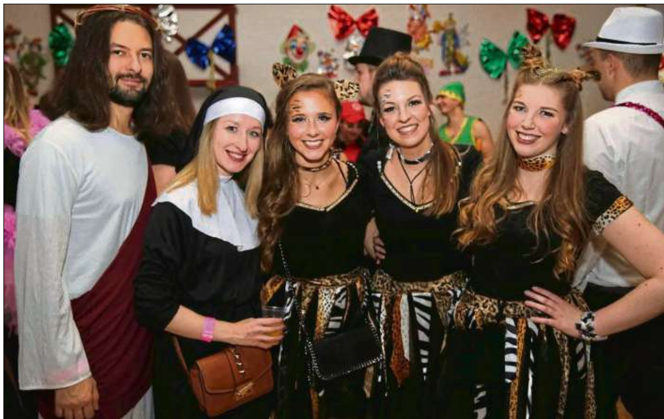
„Prinzenball reloaded“ hieß es am Freitag im Riesenaal beim Seligenstädter Heimatbund mit der „Lieblingsband“ und DJ Alex Beer. Sie heizten den Partygästen so richtig ein. Nun stehen die Hexenrummel bevor und auch der Hexenball mit „Doctor Blond“ am Faschnachtsamstag.

Seligenstadt (red) – Mit einer Plakataktion zur Unterstützung der Flüchtlinge, die eine Wohnung suchen, startet der Arbeitskreis (AK) Willkommen in dieser Woche. Plakate in verschiedenen Größen werden an den Kultursäulen und den Aushängen der Stadt Seligenstadt angebracht. Ziel ist, die Aufmerksamkeit der Bevölkerung auf das ungelöste Problem der Unterbringung anerkannter Flüchtlinge zu lenken. Das Plakat verweist auch auf das Video, das im Auftrag des AK Willkommen erstellt wurde und über YouTube abrufbar ist. Stichwort Wohnungssuche: Die Gesamtsituation wird immer dringender. Immer mehr Asylbewerber erhalten ihre Anerkennung. Bedingt durch die Arbeitsmarktsituation in Seligenstadt und Umgebung, aber auch aufgrund der qualifizierten Sprachausbildung haben Flüchtlinge an Relevanz für den Arbeitsmarkt gewonnen. Mehr als 70 Arbeitsplätze und 15 Ausbildungsplätze konnten bereits an Unternehmen und Arbeitgeber vermittelt werden.