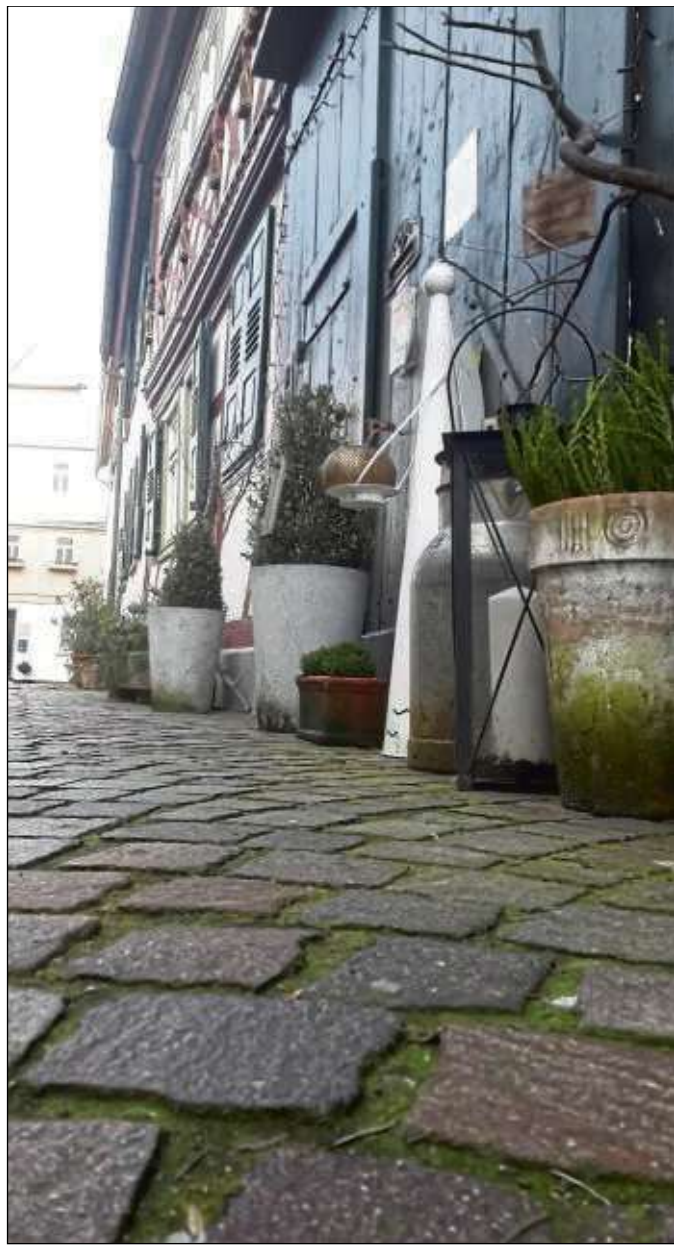
Für Seligenstadts Altstadt eigentlich sehr typisch: Kopfsteinpflaster und Fachwerk.