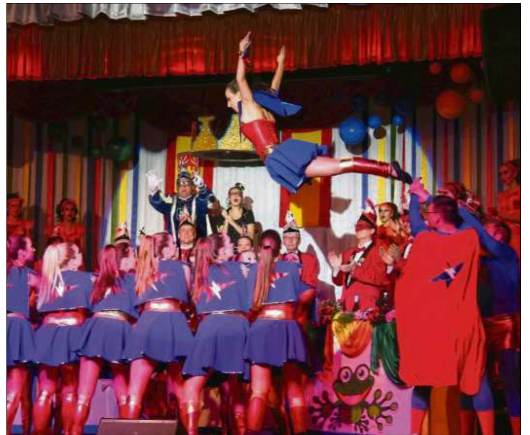
Schunkelrunden, Tänze, Vorträge - Froschhausens Harmonie präsentierte den Narren im Bürgerhaus-Saal hervorragende Galasitzungen und auch der Nachwuchs trug unter den Augen des Prinzenpaares seinen Teil dazu bei.