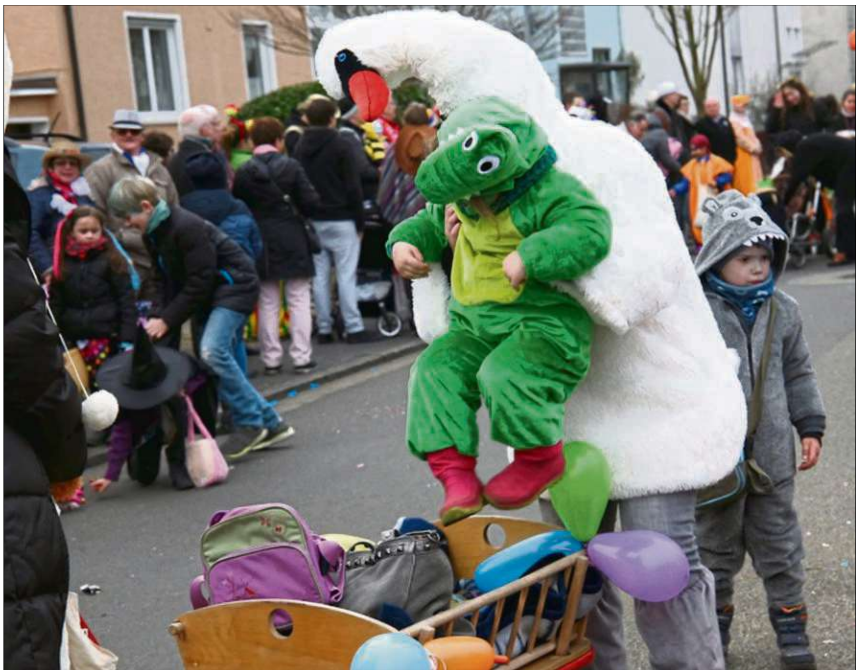
So, schon mal eingepackt und gleich geht's los. Viele hundert kleine und große Narren werden wieder unterwegs sein beim 44. Kinderfastnachtszug, der sich am Sonntag ab 14.11 Uhr durch Hainstadt schlängelt.