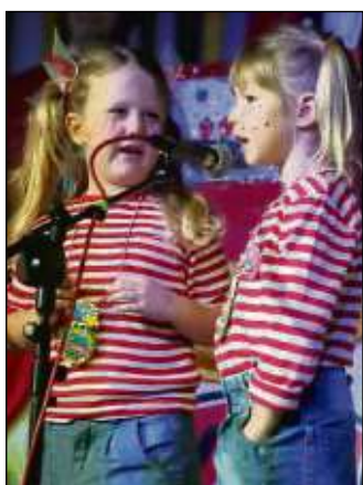
Überzeugten allemal: Die Knackfrösche.