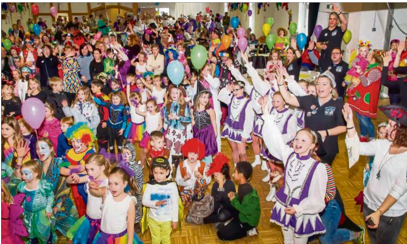
Kinderfaschnacht bei den Seligenstädter Faschnachtsfreunden in der Heimatbundhalle. Das TGS-Kinderprinzenpaar war ebenso zu Gast wie das „große“ Seligenstädter Prinzenpaar. Und auch die Gardien ließen es sich nicht nehmen, Auftritte beizusteuern.