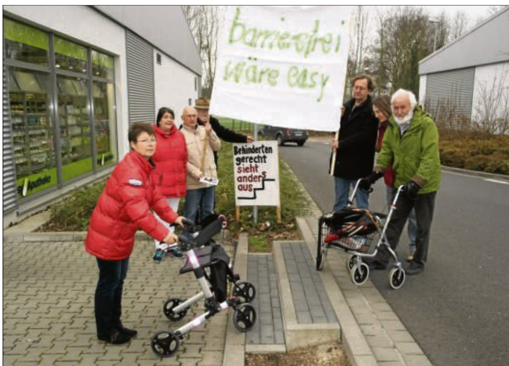
Für einen behindertengerechter Umbau der kleinen Treppe zwischen der easy Apotheke und Rossmann, demonstrierten die Hainburger Mandatsträger in den Fasanerie-Arkaden in Klein-Krotzenburg. Der Vermieter des Einkaufsareals soll so zu einer Änderung aufgefordert werden. Die Treppenstufen sollen nicht weiter ein Hindernis für Kinderwagen, Rollatoren und Rollstühle sein.