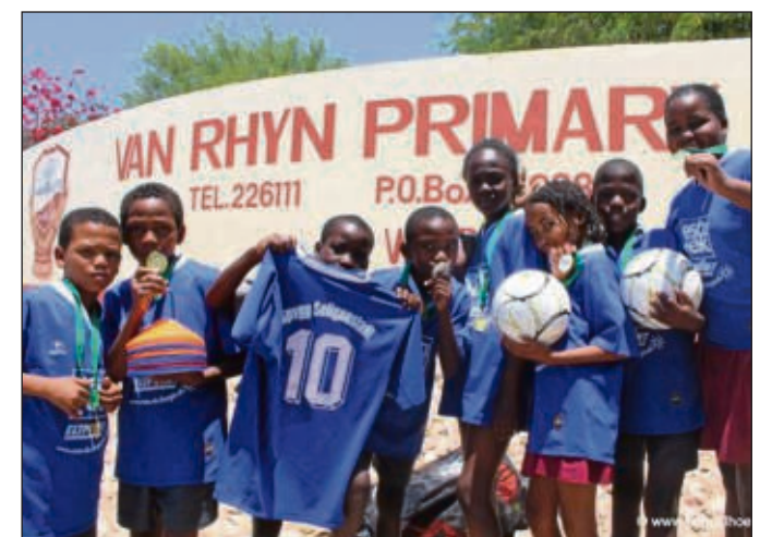
Trikots der Spvgg. Seligenstadt im afrikanischen Namibia bei jungen Menschen absolut gefragt.