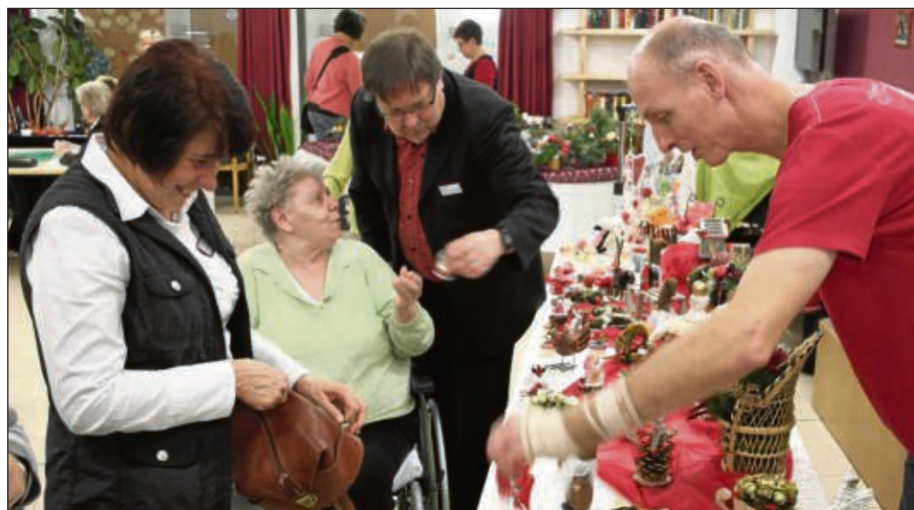
Zum Adventsmarkt mit dem Motto „Stimmungsvoll in den Advent“ lud der Agaplesion Simeonstift in Klein-Krotzenburg ein. Etliche Hobbykünstler lockten mit ihren Ständen, zahlreiche Bewohner des Hauses und Besucher an. Es wurden Adventsgestecke, selbstgemachter Schmuck, viele kleine Weihnachtsdekorationen, Filz-Hausschuhe, einige weihnachtliche Leckereien und vieles mehr angeboten. Auch die Bewohner haben Einiges aus Holz und Ton für den Basar hergestellt. Für das leibliche Wohl gab es Kaffee und Kuchen, frisch gebackene Waffeln, Glühwein und Punsch.