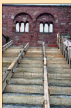
Treppe an der Kaiserpfalz.