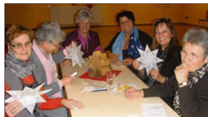
50 Frauen der Pfarrei St. Nikolaus verbrachten einen Abend der Begegnung zum Thema „Sternstunden“, um sich so auf die Adventszeit vorzubereiten. Sie dachten über persönliche Sternstunden nach und bastelten für zu Hause Sterne.