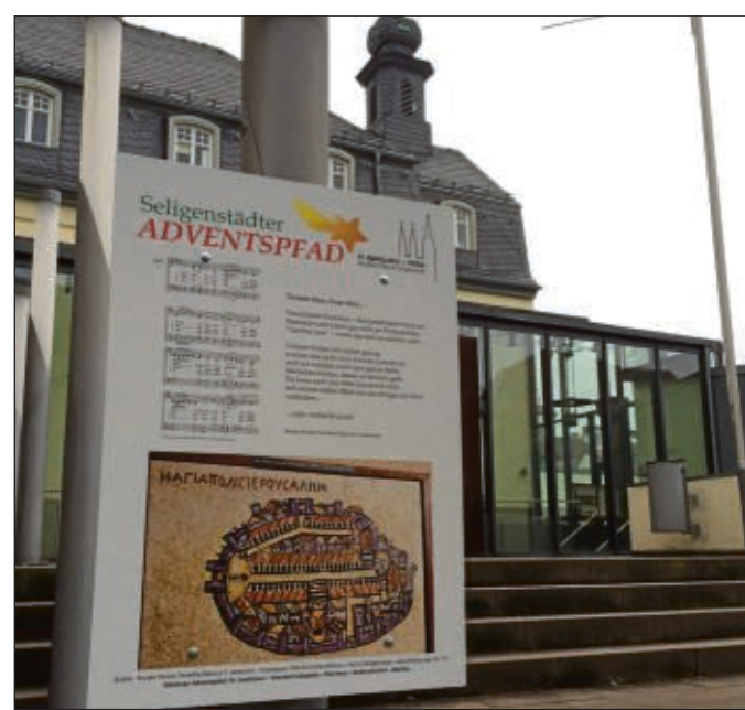
An sechs verschiedenen Stellen in der Basilika-Pfarrei ist der Advents-Pfad zu begehen.

Insgesamt 107 Abbildungen und Porträts führen das Brauchtum um Löffeltrunk und Geleit dem Leser auch bildlich vor Augen. Das Buch ist beim örtlichen Buchhandel und im Tourist-Büro am Marktplatz zum Preis von 21,80 Euro erhältlich.