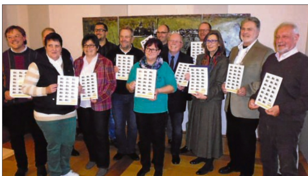
Ein ganzer Briefmarkenblock, hübsch gerahmt, ist zu Weihnachten und im Jubiläumsjahr überdies ein ganz besonderes Geschenk, das Kunden in der Tourist-Info erwerben können.

Ein Geschenk-Tipp für Weihnachten: die Gilde bietet individuelle Gutscheine an.