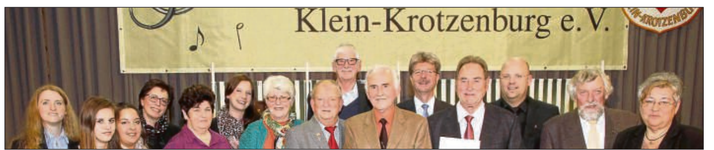
Familienabend war beim Volkschor Klein-Krotzenburg mit Ehrungen.

Redaktions-Mail: shb@stadtpost.de ☎ 06182 929829