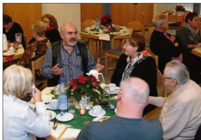
In das evangelische Gemeindehaus lud der VdK Ortsverband Zellhausen seine Mitglieder zum gemütlichen Adventskaffee ein. Bei Kaffee und selbstgebackenem Kuchen gönnten sich die Anwesenden einen entspannten Nachmittag und tauschten sich über die im nächsten Jahr geplante Frühlingfahrt an den Bodensee aus. Text/Foto: ega