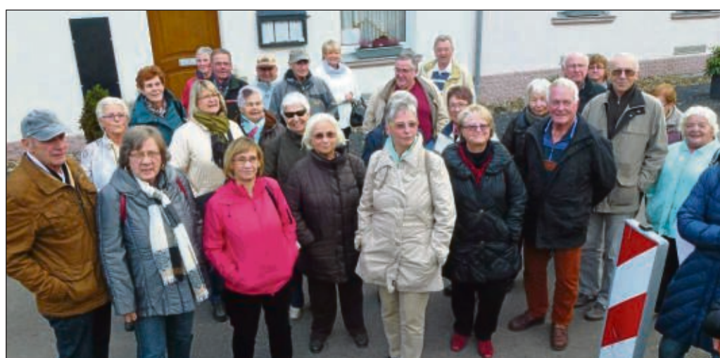
25 Jahre nach dem Fall der Mauer, dem Ende der DDR-Gewaltherrschaft, besuchte der VdK Ortsverband Seligenstadt die Gedenkstätte, Point Alpha, Haus auf der Grenze, bei Geisa. Eindrucksvoll wird dort die Deutsche Geschichte präsentiert. Beginnend mit der Aufteilung Deutschlands durch die Siegermächte. Entwicklung der Grenze und der Grenzanlagen, dem Bau der Mauer um West-Berlin, bis hin zu den kaum noch zu überwindenden Sperranlagen entlang der Deutsch-Deutschen Grenze. Bedrückend die Bilder und Aussagen von Betroffenen aus dem Grenzbereich. Der Führer aus Geisa berichtete von den Einschränkungen, denen die Bewohner in unmittelbarer Nähe der Grenze ausgesetzt waren. Den Zwangsumsiedlungen, zu Anfang mit Ankündigung, später standen die LKW's plötzlich auf der Straße um die Menschen abzuholen. Nach diesen vielen und ergreifenden Eindrücken wurde die Heimfahrt angetreten. sofa