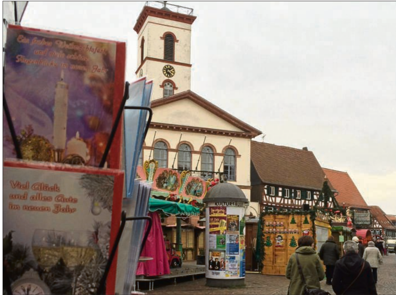
Noch sind die Buden dicht heute früh, aber spätestens gegen 15 Uhr erwacht der Markt zu adventlichen Leben, die Stände haben geöffnet und noch bis Sonntag ist beim Adventsmarkt besonders in den Abendstunden viel los. Geöffnet ist von 15 bis 20 Uhr, Samstag von 10 bis 20 Uhr und am Sonntag von 12 bis 20 Uhr. Der „Kleine Budenzauber“ auf dem Freihofplatz ist dann von 15. bis 21. Dezember. Mehr auf www.seligenstadt.de

Eintrittskarten für das Jahreskonzert können bei den Vorverkaufsstellen, Tourist-Info Seligenstadt und der Postdienststelle Klein-Welheim sowie bei allen aktiven Musikern, zum Vorverkaufspreis von zwölf Euro oder an der Abendkasse für 14 Euro erworben werden. Der Eintritt für Kinder bis 13 Jahren ist frei.