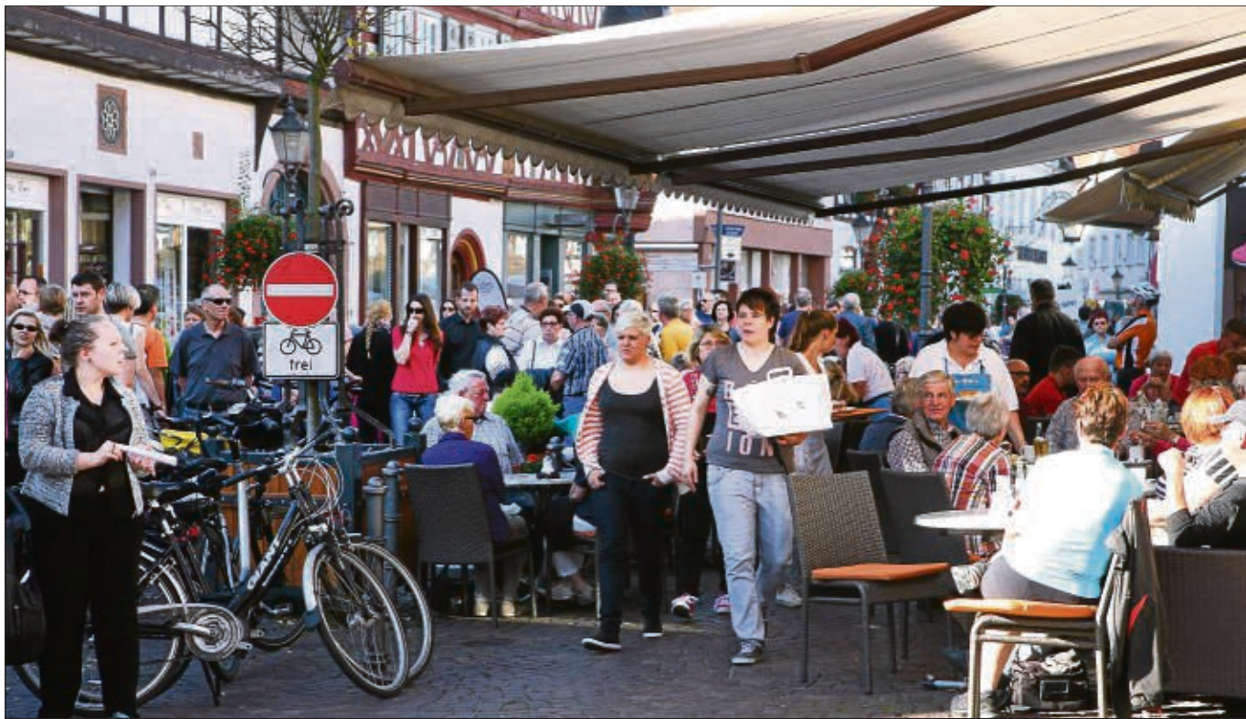
Natürlich hatten auch die Café und Restaurants im Einhardstädtchen viel Zulauf beim Hochzeits- und Shoppingtag in Seligenstadt und der Gewerbeverein durfte zufrieden sein mit dem Besuch aus nah und fern.