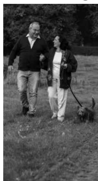
Kontinuierliche Bewegung wirkt sich positiv auf Vorhofflimmern aus.

Im Normalzustand schlägt das Herz rund 70 Mal in der Minute. Beim Vorhofflimmern schlagen die Vorhöfe unkontrolliert. Durch das Flimmern wird der regelmäßige Blutfluss gestört – Blut kann sich in den Vorhöfen stauen, verklumpen und Gerinnsel bilden. Problematisch wird es, wenn sich eines der Gerinnsel löst und über die Blutbahn ins Gehirn wandert. Hier droht der Verschluss von Gefäßen, was zu einem Schlaganfall führt.