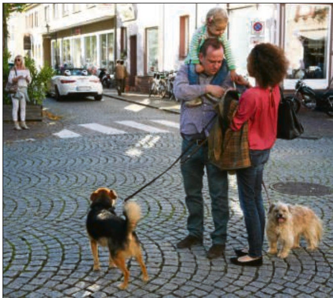
Die letzten (?) Sonnenstrahlen am Wochenende nutzten viele Gäste in der Stadt zum Bummeln.