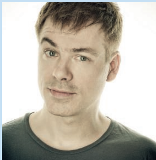
Michael Mittermeier