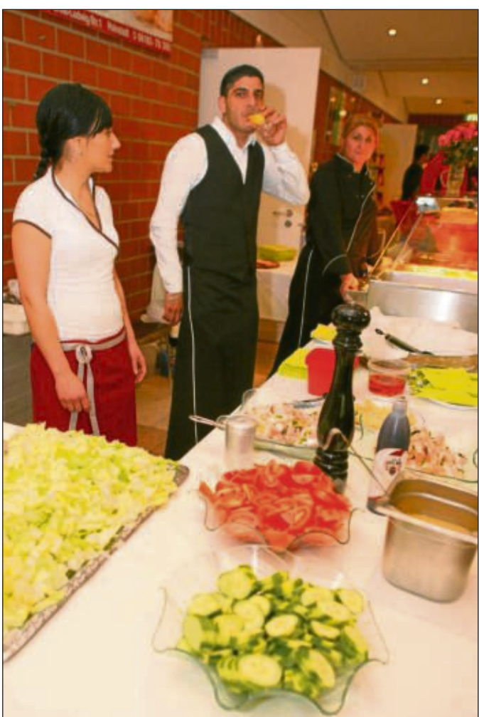
Internationale Gerichte und viel Gesundes gab's im Foyer.

die Arbeitslosigkeit und Jugendarbeitslosigkeit im Kreis Offenbach so gering sei, dass sie „faktisch einer Vollbesetzung“ entspreche. DAS „Offizielle“ war abgehakt, das Band zum Markt von Franz Kemmerer durchschnitten, die Aussteller, die draußen vor der Kreuzburghalle und im Foyer längst alle Hände voll zu tun hatten, konnten starten und erfreuten sich vieler Besucher. An rund 50 Ständen durften die Besucher testen, probieren, anschauen, Probe liegen, sich schon das eine oder andere Weihnachtsgeschenk organisieren oder sich rundum informieren lassen über die Angebote, die es in Hainburg und Umgebung so gibt. Tänzerische Einlagen auf der Bühne, eine kostenlose Haarschneide-Aktion, Kinderschminken und die Verlosung von Martinsgänsen rundeten das Wochenend-Angebot beim Martinsmarkt ab.