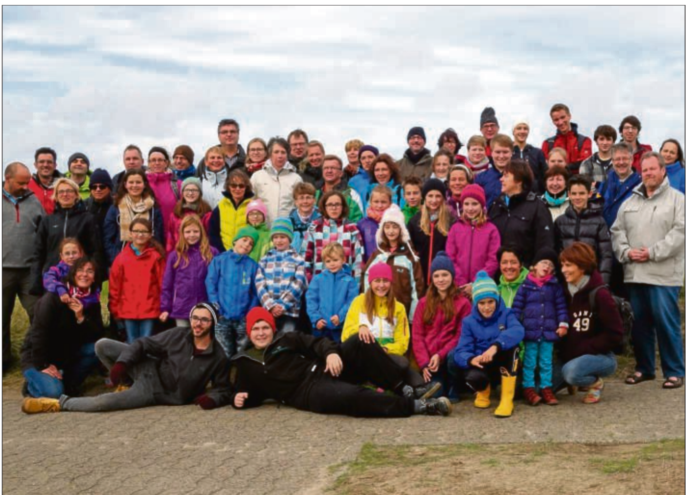
An einer Freizeit auf der Insel Wangerooge nahmen nun 62 kleine und große Leute aus der Gemeinde St. Marien teil. Dort erlebten sie im wahrsten Sinne des Wortes stürmische Tage. Mit einer Wanderung durch das Watt, einer Leuchtturmbesichtigung, dem Basteln und Steigenlassen eines Drachens, einem Besuch in der Sternwarte und dem Meerwasserbad wurden die Teilnehmer um viele Erlebnisse bereichert. Natürlich wurde auch viel gesungen und miteinander Glaube gelebt.

Auch aufgrund des reichhaltigen Kuchenbuffets im Schulcafé lohnt sich ein Besuch. Alle Erlöse aus Standgebühr und Kuchenverkauf kommen den Kindern der Konrad-Adenauer-Schule zugute. Infos für Verkäufer erhalten Interessenten unter ☎ 200570 bei zum Beispiel: Matthias Kallenberg oder im Sekretariat der Schule unter ☎ 21554 bei Olivia Beinenz. Anmeldeschluss ist 5. November.