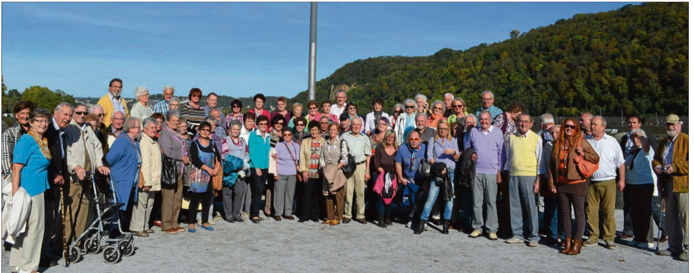
Bei schönem, herbstlichem Wetter fand nun der Ausflug des Sängerbundes Mainflingen statt. Mit zwei Bussen ging die Fahrt von Mainflingen zur Wallfahrtskirche Kloster Bornhofen, in der der Singkreis einige Lieder sang. Nach dem Mittagessen ging die Fahrt weiter nach Koblenz zum Deutschen Eck. Die Teilnehmer nutzen das vielfältige örtliche Angebot, wie mit der Seilbahn über den Rhein zur Festung Ehrenbreitstein zu fahren, eine Rhein-Mosel-Schiffahrt mitzumachen oder die Altstadt zu erkunden. Nach einem gemütlichen Abschluss in Bad Kreuznach ging ein wunderschöner Tag zu Ende. sofa/Foto: privat