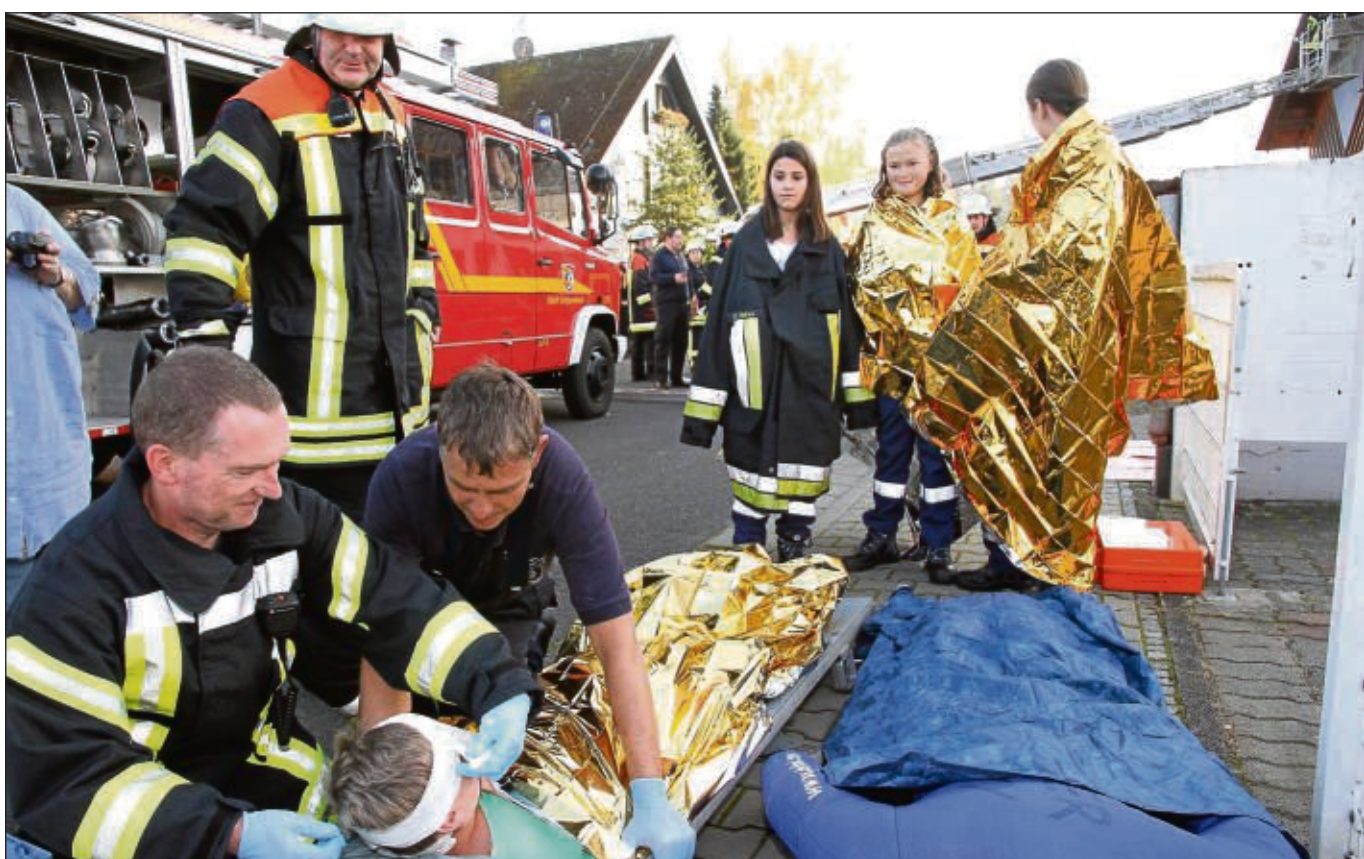
Brand in den Büroräumen im ersten Stock der Schreinerei Kemmerer in Klein-Welzheim. Einige Personen mussten gerettet werden, drei von ihnen hatten Brandverletzungen, konnten aber noch laufen. Zwei wurden über die Drehleiter der Freiwilligen Feuerwehr Seligenstadt geborgen und die Erstversorgung erfolgte gleich vor Ort und es wurde dafür gesorgt, dass der Brand nicht auf andere Gebäude übergriff. Das Szenario bei der Abschlussübung der Welzheimer Wehr.