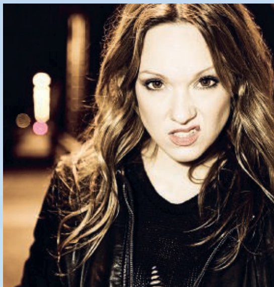
Carolin Kebekus