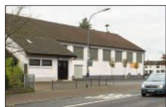
Brandschutztechnische Probleme in der Sporthalle Hainstadt zwangen die Musikgesellschaft Eintracht Hainstadt zur Absage ihres für Samstag geplanten Konzertes. Mehr auf Seite 15.

Neu gegründete Initiative in Seligenstadt