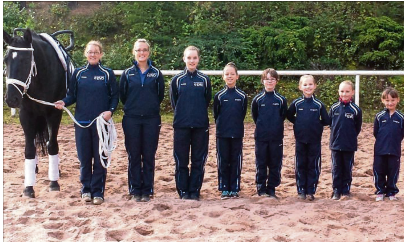
Das Voltiteam Klein-Krotzenburg der Interessengemeinschaft für Pony- und Pferdesport (IPPF) ist stolz auf einen krönenden Saisonabschluss.

beim Sommerfest entführte in das Land der Phantasie. Und die Phantasie spielte natürlich auch im kreativen Bereich eine große Rolle. So können die Besucher der Ausstellung am Samstag, 8. November, und Sonntag, 9. November, auf die Umsetzung des Themas gespannt sein. Zur Stärkung gibt es in der Cafeteria neben selbstgebackenem Kuchen auch ein Stück vom Lebkuchenhaus, das die Kinder mit viel Mühe gebacken und mit reichlich Naschereien verziert haben.