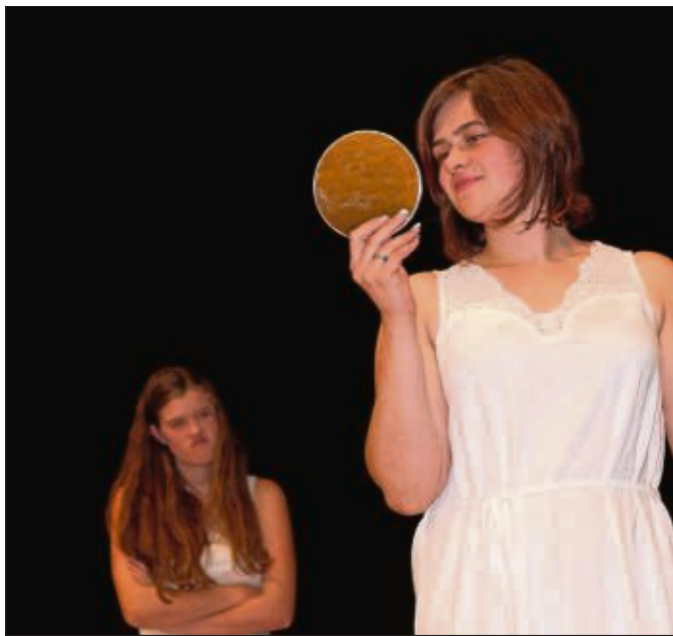
Die Harmonie der Zweisamkeit ist zerstört. Ein neues Jugendstück gibt's am 15. November.