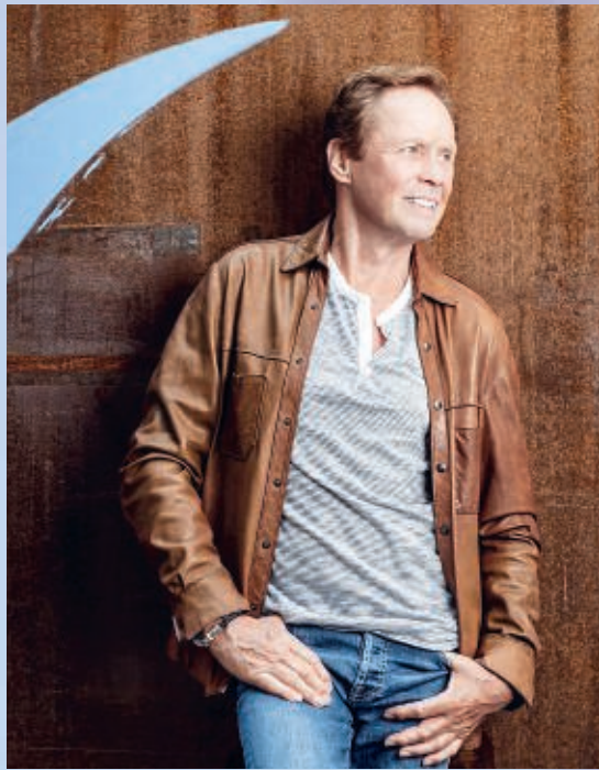
Peter Kraus