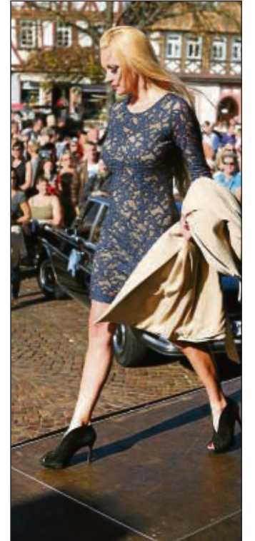
Brautkleider - nicht nur in weiß.