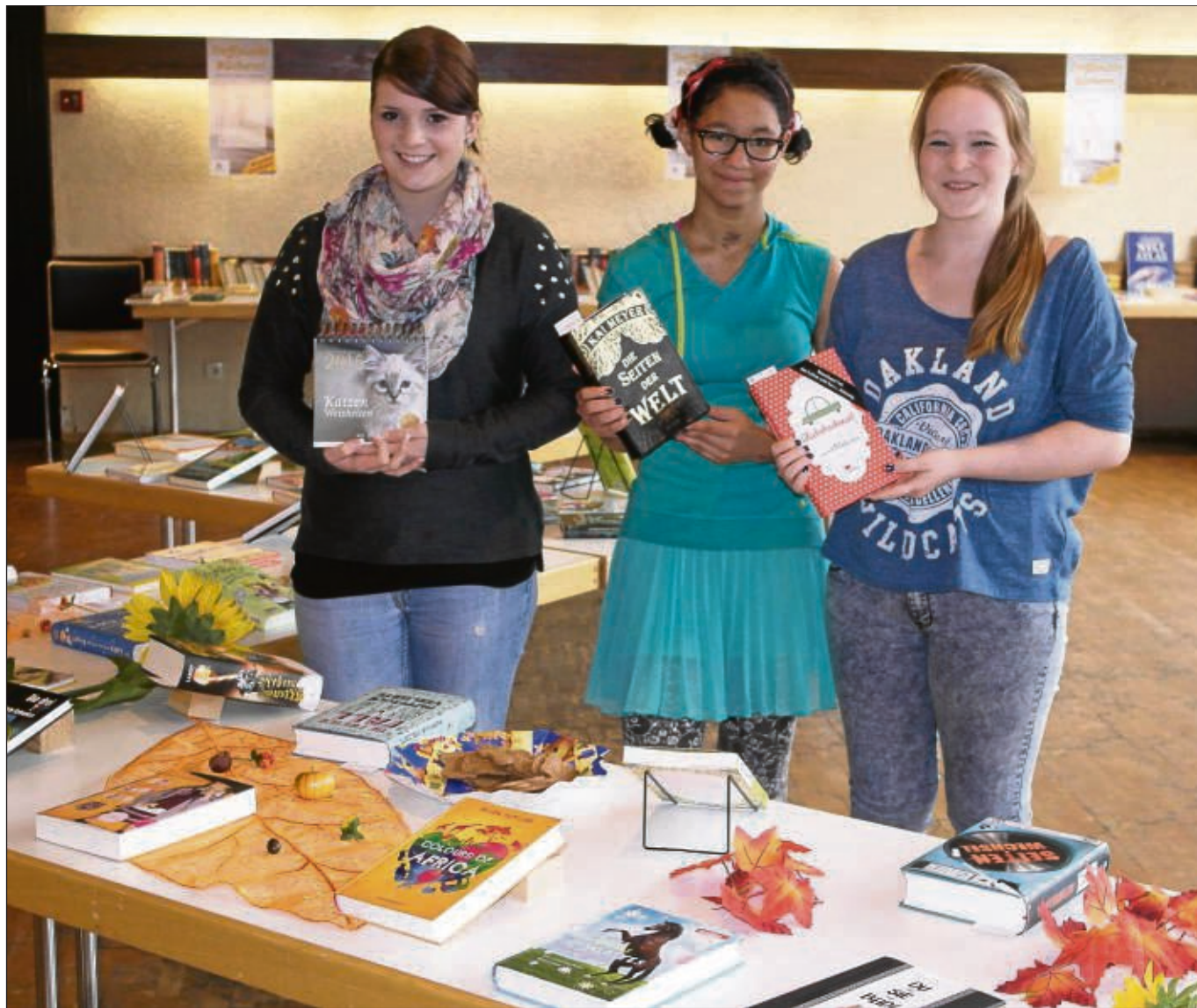
Zur Buch- und Medienausstellung lud die Katholische Öffentliche Bücherei St. Wendelinus in Hainstadt in den Pfarrsaal des Pfarrzentrums am Kirchplatz ein. Hier konnte man sich über die Buchneuerscheinungen informieren und die ausgestellten Medien und verschiedene Weihnachts- und Jahreskalender erwerben. Außerdem fand ein Flohmarkt mit aussortierten Büchern und CDs aus der Bücherei statt.

Emma-Schoppen und der Krawall-Schoppen auf der Karte stehen. Die Eintrittskarten für den Eröffnungabend (mit Probe und Imbiss) sind für sieben Euro in der Buchhandlung vielseitig sowie in der Bücherei erhältlich. Am Sonntag, 9. November, bietet das Literaturcafé ab 14 Uhr eine Vielfalt hausgemachter Apfelkuchen an. Ein Bilderbuchkino entführt um 15 Uhr in den Garten von Petterson und Findus. Die Buchschau lädt samstags von 15 bis 18 Uhr und sonntags von 11 bis 18 Uhr ein zum Blättern, Stöbern und Entdecken. Neben Neuerscheinungen und Medien zum Weihnachtsfest hält das Büchereiteam auch eine große Auswahl an Büchern rund um den Apfel bereit.