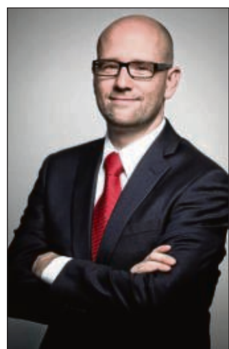
CDU-Generalsekretär Dr. Peter Tauber ist am Samstag zu Gast in Froschhausen bei der CDU. Mehr Seite 5.

fon 06182.23970 www.albero-immobilien.de