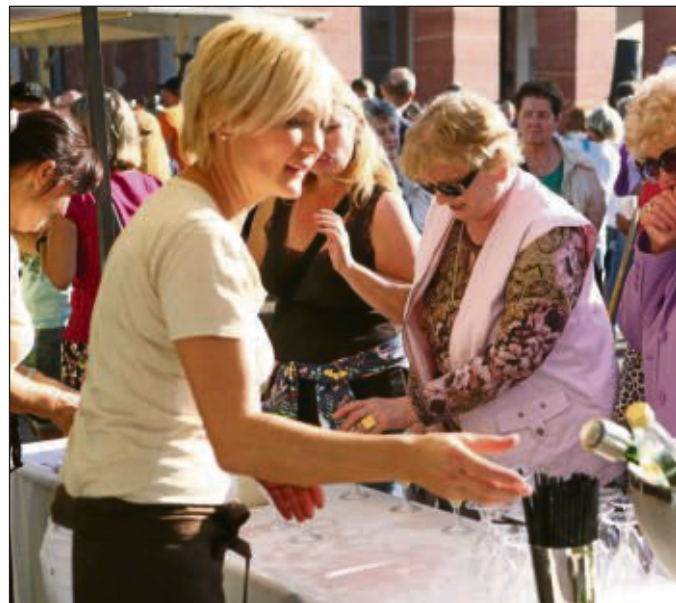
Etliche Angebote gab's an verschiedenen Ständen auf dem Marktplatz.