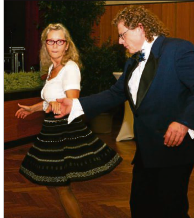
Auch manch tänzerische Einlagen wurden geboten im Riesensaal.