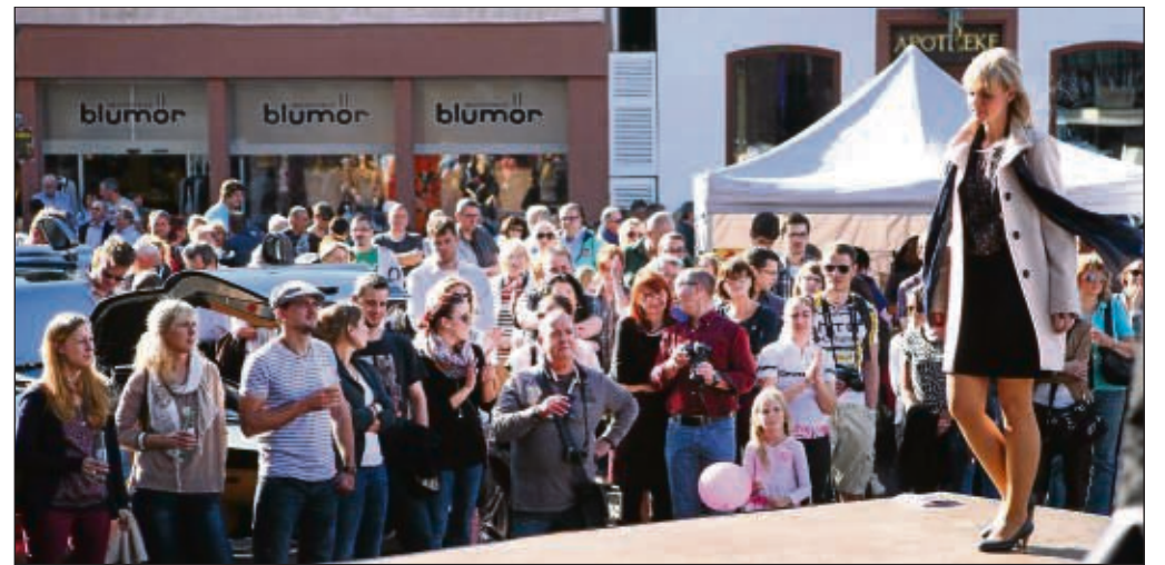
Modenschauen in Sachen Brautkleider gab's auf dem Seligenstädter Marktplatz und die Zuschauer waren begeistert von den tollen Angeboten.