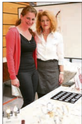
Zehnter Martinsmarkt war in Hainburg. Mehr auf Seite 19.

Klein-Welzheim (beko) – Der Vereinsring Klein-Welzheim sagt „Danke für die Blumen“. In einer Feierstunde ehrt der Vereinsring Klein-Welzheim, die Dachorganisation der Vereine und Verbände, am Sonntag, 9. November, um 18 Uhr in der Gaststätte „Zum Wiesegiggel“ im Wintergarten/Bürgerhaus die Preisträger des diesjährigen Blumenwettbewerbs.