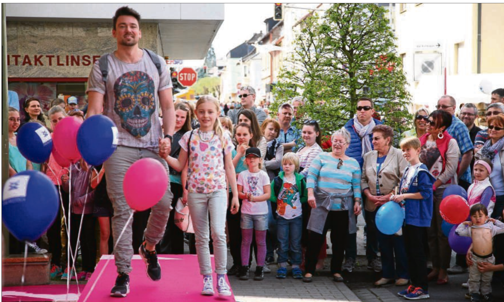
Frühlingsmarkt war in Seligenstadt und auch Modenschauen lockten das Publikum. Schauen, kaufen und vor allem das sonnige Wochenende in der Einhardstadt genießen, die Besucher waren ebenso zufrieden wie der Gewerbeverein als Ausrichter.

Klein-Krotzenburg (sofa) – Mit der Eschenroder Stauseetour bei Schotten beginnt die Kolpingfamilie Klein-Krotzenburg den „Emmausgang“ am Ostermontag, 21. April, mit Treffpunkt um 9.30 Uhr mit dem PKW am Feuerwehrhaus. Gemeinsam geht die Fahrt nach Eschenrod im Vogelsberg zum Parkplatz am Sportplatz. Hier beginnt die Rundwanderung über 15 Kilometer. Am Ende der Tour ist eine Kaffee- beziehungsweise Vesperpause geplant. Gäste sind willkommen. Informationen hierzu erteilt Joachim Mickler unter ☎ 4486.