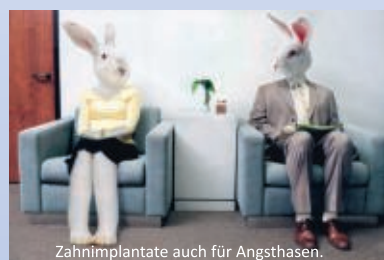
Zahnimplantate auch für Angsthasen.

Die Implantation der künstlichen Zahnwurzel wird mit modernen Anästhesieverfahren wie Lokalanästhesie, Vollnarkose, Tiefschlaf und Dämmer schlaf durchgeführt und ermöglicht so eine sanfte Implantation. Besonders ängstliche Patienten gewinnen so Vertrauen in die Implantologie und müssen sich nicht aus Angst vor einem operativen Eingriff für die konventionelle Brückenversorgung oder einen herausnehmbaren Zahnersatz entscheiden.