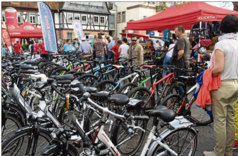
Von A wie Auto bis Z wie Zweirad war eigentlich alles vertreten beim Frühlingsmarkt am Wochenende und verkaufsoffenem Sonntag in Seligenstadt. Auch Radsport König war mit von der Partie auf dem Marktplatz.