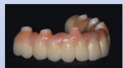
Festsitzende Oberkiefer- und Unterkieferbrücke