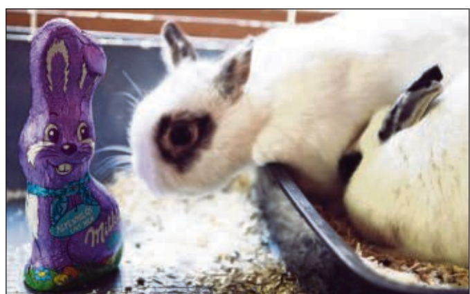
Schnuppern erlaubt, aber noch nicht auspacken. Die Osterzeit beginnt mit der Feier der Osternacht.