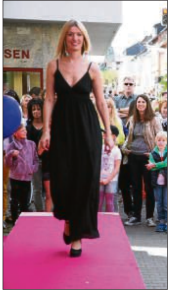
Modenschauen zum Frühlingmarkt: Seligenstadt blühte am Wochenende so richtig auf.