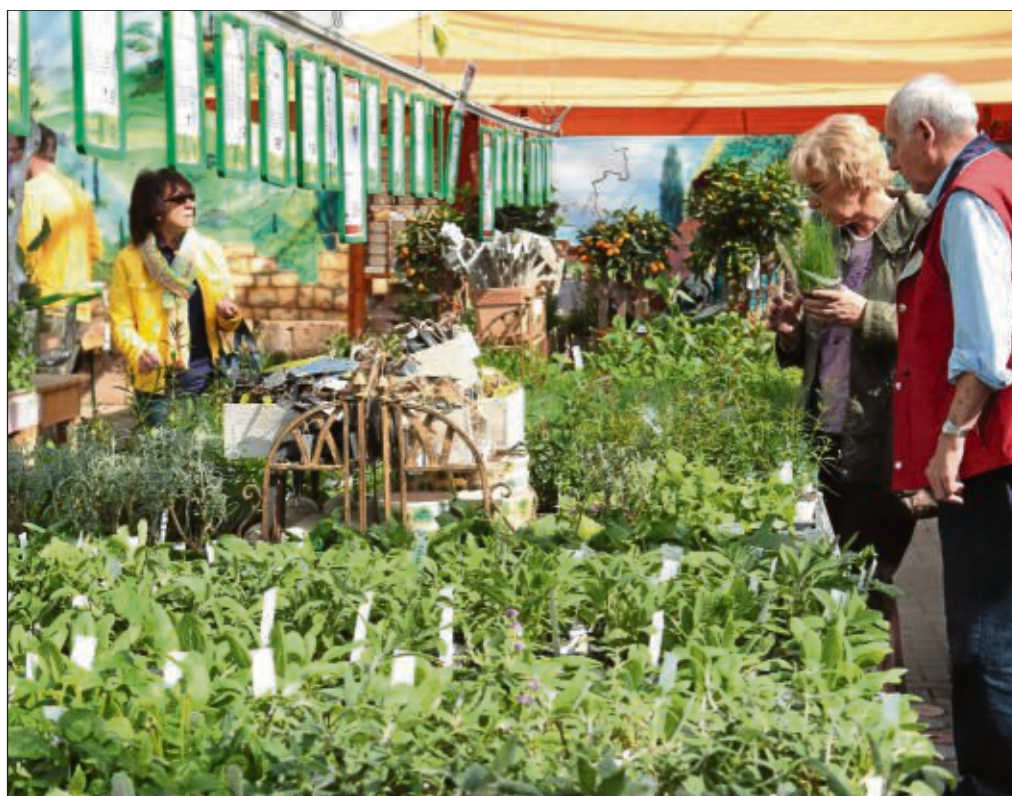
Das Kräuterfest lockte viele Besucher in die Gärtnerei Löwer. Insgesamt 501 verschiedene Arten von Gewürz-, Heil- und Duftkräutern, von „A“ wie Ananassalbei bis „Z“ wie Zitronenmelisse, gab es beim Kräuterfest der Gärtnerei Löwer zu bewundern. Zwei Tage lang drehte sich alles um das gesunde Kraut und so manch einer steckte seine Nase in das duftende Grün. Mit Vorträgen, einer Kräuterverkostung für Kinder und Rezepten zum Ausprobieren rundete die Gärtnerei Löwer das Aktionswochenende mit verkaufsoffenem Sonntag ab.