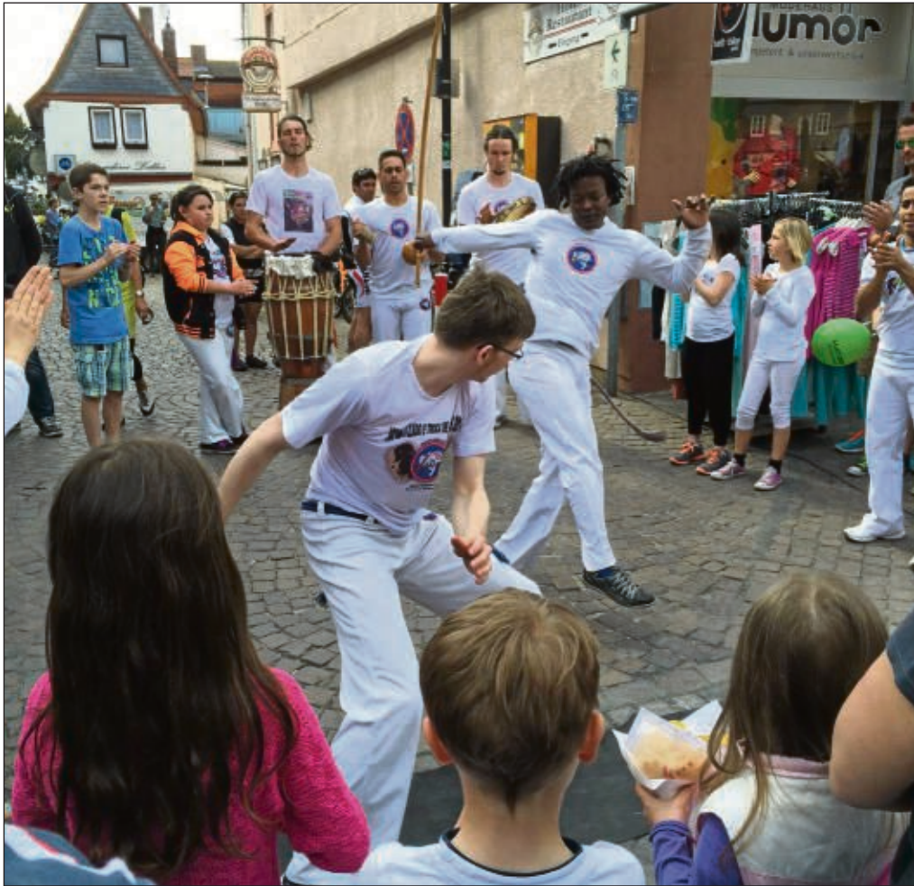
Die Sportart Capoeira, ein brasilianischer Kampftanz sorgte am Marktplatz ebenso für begeisterte Zuschauer wie die angebotenen Modenschauen, die mobilen Drahtesel und vieles mehr. Seligenstadt feierte seinen Frühlingmarkt mit jeder Menge Infos und Publikum. Mehr auf Seite 12.