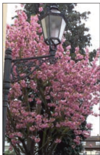
Seligenstadt blüht, auch mitten in der Altstadt.

Seligenstadt (red) – Erste Stadträtin Claudia Bichler teilt mit, dass der reguläre Abfuhrturnus der Hausmülltonnen, Papiertonnen und der Gelben Säcke wegen der Osterfeiertage verschoben wird. Die Papiertonnen werden wie folgt abgeholt: Bezirk 1 und 2 am Montag, 14. April, Bezirk 3 am Dienstag, 15. April, Bezirk 4 am Mittwoch, 16. April, Bezirk 5 am Donnerstag, 17. April. Die Gelben Säcke werden wie folgt abgefahren: Bezirk 1 und 5 unverändert am Donnerstag, 17. April. Bezirk 1, 2 und 3 am Samstag, 19. April. Die Entleerung der Restmülltonnen erfolgt an folgenden Tagen: Bezirk 1 am Dienstag, 22. April, Bezirk 2 am Mittwoch, 23. April, Bezirk 3 am Donnerstag, 24. April, Bezirk 4 und 5 am Freitag, 25. April.