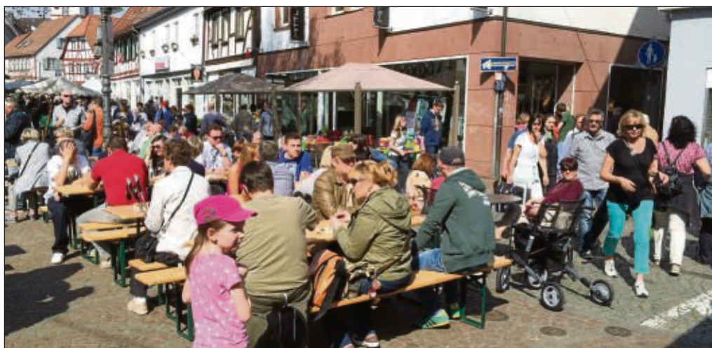
Treffpunkt vor der Metzgerei Fecher an der Aschaffenburger Straße am Löffelrinkerplatz und dort bei gastronomischem Angebot und Musik die Sonne genießen.