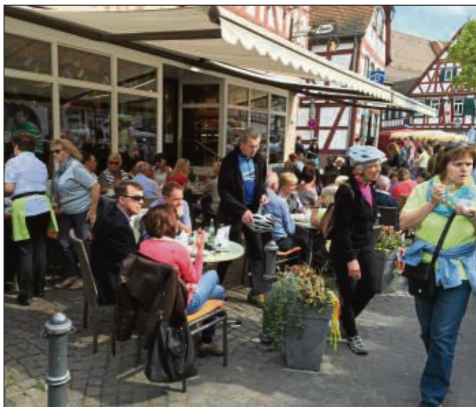
Zwischendurch mal einen Platz ergatterten im Café, das war am Sonntag nicht ganz so einfach.