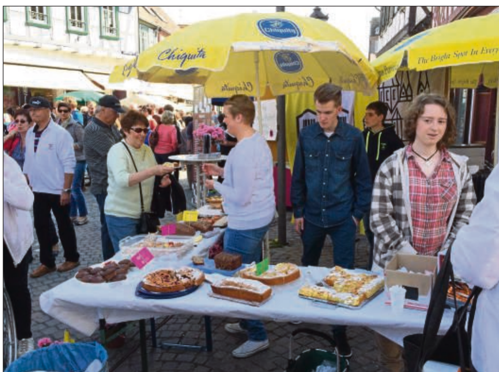
Auch etliche Gruppen beteiligten sich am Frühlingsmarkt in Seligenstadt, wie die Ministranten der Basilikapfarrei, die Kuchen verkauften und somit wenigstens einen Teil ihrer geplanten Rom-Wallfahrt im August finanzieren können. Mehr rund um den Frühlingsmarkt in Seligenstadt auch in den kommenden Ausgaben des SHB.