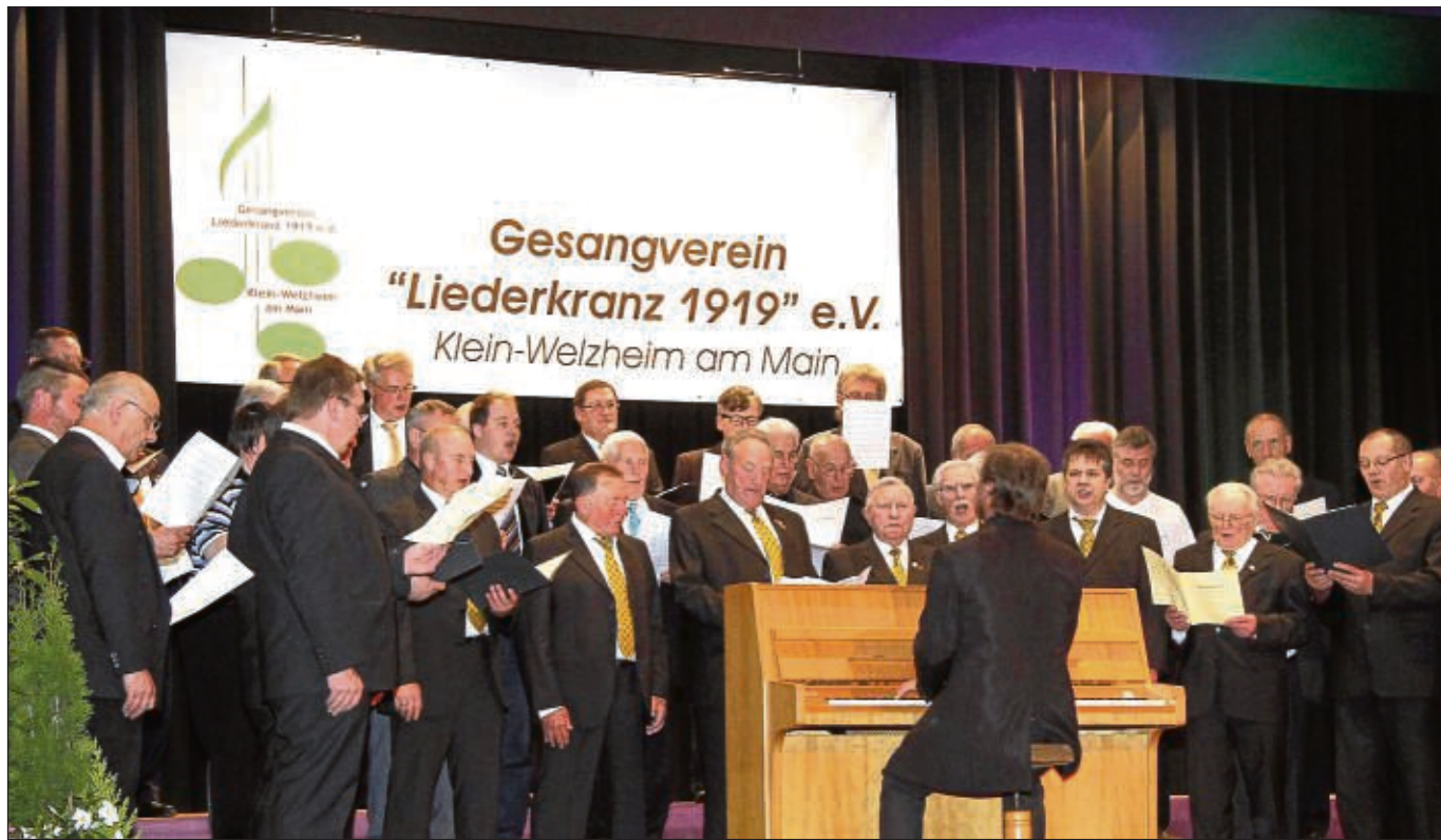
Zu einem Konzert mit befreundeten Chören (Gesangverein Harmonie Hainstadt, Belcanto Großwallstadt, Frohsinn Bad Soden, Germania Dudenhofen, Concordia Gelnhaar, Männergesangverein Großwallstadt, Mixed Generations Dudenhofen) lud der Gesangverein Liederkrantz Klein-Welzheim ein. Unser Foto zeigt den Männerchor Concordia Gelnhaar zusammen mit der gastgebenden Germania und dem Männerchor der Germania Dudenhofen.