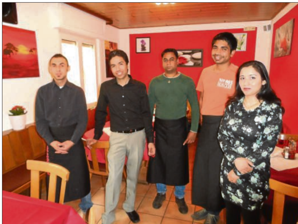
Das Restaurant Pizzeria „Aman“ (ehemals „Zur Rose“) bietet Spezialitäten, unter anderem aus der indischen und chinesischen Küche an und eröffnete Anfang März in der Erzbergerstraße 20 in Klein-Krotzenburg. Zum Anlass der Neueröffnung gibt es am 19. und 20. April 20 Prozent Preisnachlass auf alles. Das Restaurant hat täglich bis 22 Uhr geöffnet. Lieferservice wird angeboten und Selbstabholer erhalten 20 Prozent Preisnachlass.