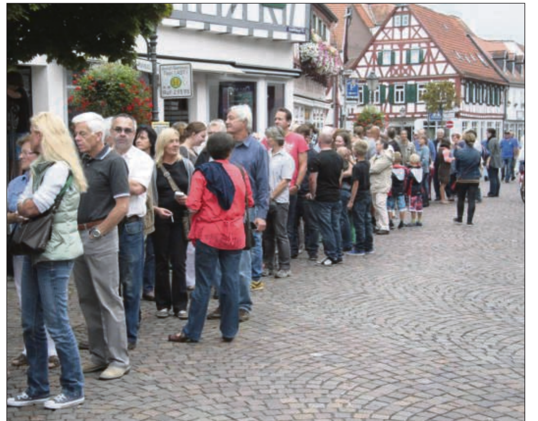
Lange Menschengruppen bildeten sich am Sonntag vor dem Eingang zum Luftschutzbunker unter dem Marktplatz. Bis zur Bahnhofstraße standen Interessierte mitunter.