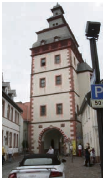
Der Steinheimer Torturm in der Stadtmauer.