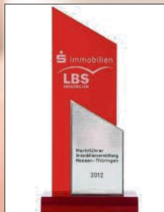
Auszeichnungen gibt es zuhauf, wie diesen Award von 2012.