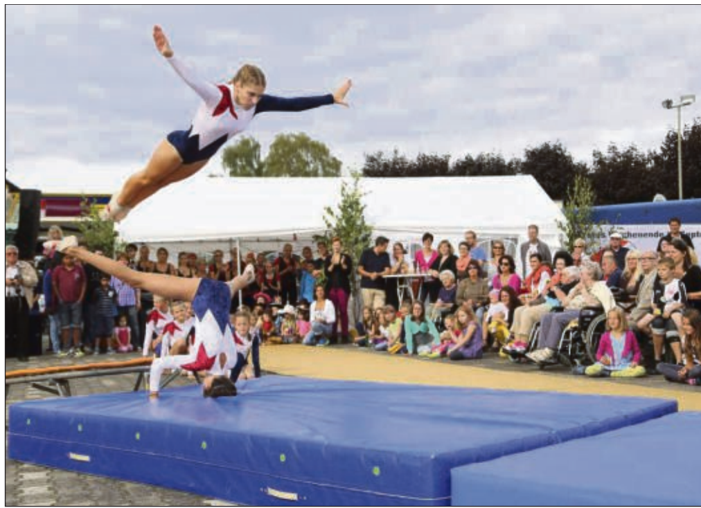
Die Turnerinnen der TG Zellhausen begeisterten die Besucher der Zellhäuser Kerb mit ihren akrobatischen Vorführungen und ernteten jede Menge Beifall. Mehr rund um die Kerb kommende SHB-Ausgabe auf den Seiten „Lebenswertes Mainhausen“.