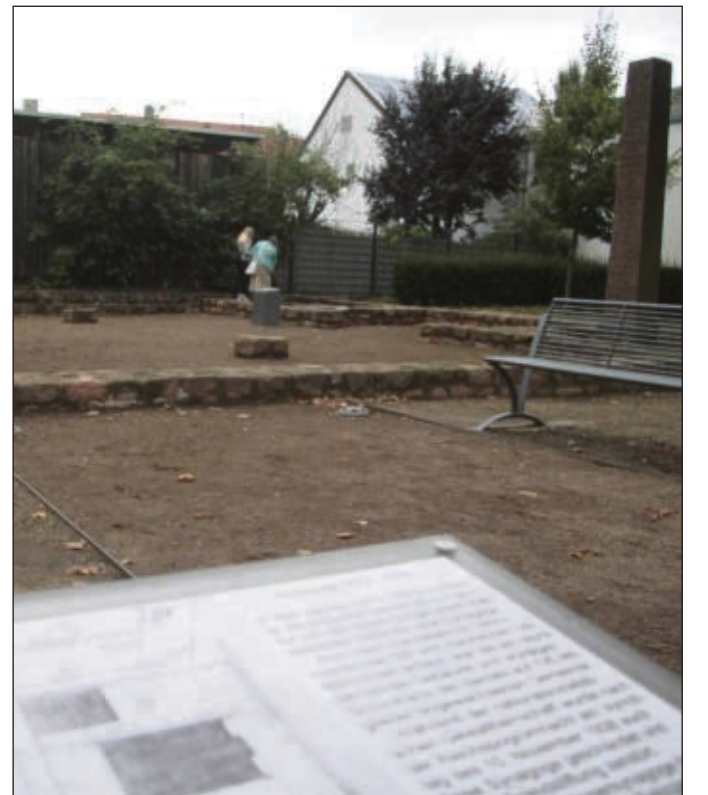
Mitunter auch von einigen Gästen besucht war der hergerichtete jüdische Synagogenplatz an der Frankfurter Straße.

im Rathaus zu besichtigen. Informationen über Geschichte, Wiederherstellung und Funktionsweise der Uhr wurden von den Glockenfreunden anschaulich vermittelt und hingewiesen auf das Glocken- und Orgelkonzert am 28. September um 20 Uhr vor der Basilika. Im Steinheimer Torturm trafen sich zudem Amateurfunken und Interessierte, die das Morsen oder Funken einmal ausprobieren wollten.