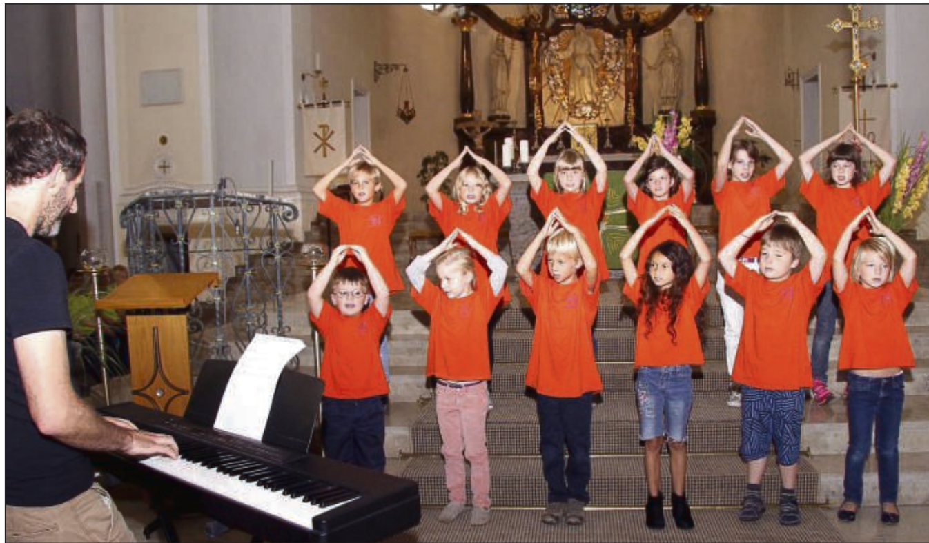
Pfarrfest in Hainstadt und das bedeutete auch musikalische Darbietungen beim Kinderprogramm, wo neben dem Jugendorchester der Eintracht und der Kinder- und Jugendchor der Germania zu Gast war.