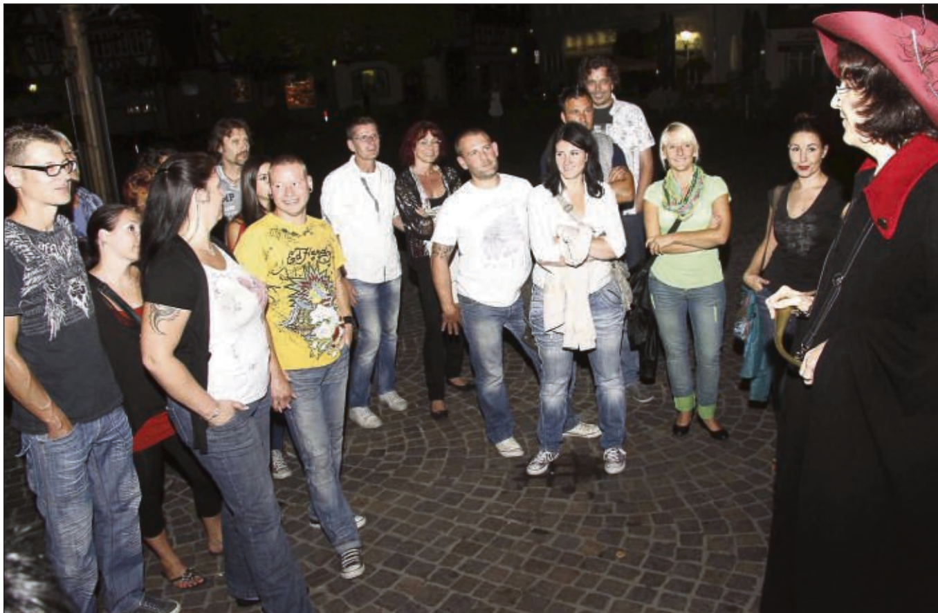
Riesig war das Interesse an der nächtlichen Führung, so dass die Gruppe geteilt werden musste. Zwei „Türmerinnen“ informierten über die „dunkle Seite“ von Seligenstadt, die Rechtsprechung im Mittelalter, die teils drakonischen Strafen, dunkle Ereignisse in der Stadtgeschichte und führten zu den relevanten Plätzen.