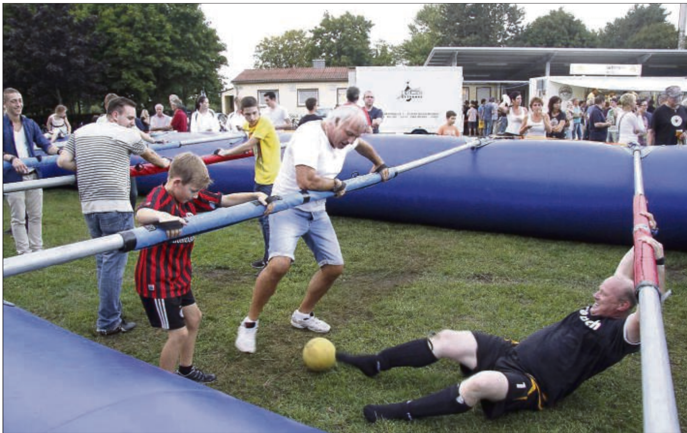
Auch ein Gaudi-Turnier war bei der Kerb in Klein-Welzheim angesagt. Fünf Mannschaften beteiligten sich am „Human-Table-Soccer-Turnier“ der TuS Klein-Welzheim. Nach spannenden Spielen siegte die Mannschaft vom Gesangsverein Liederkranz vor der KJG und dem Musikverein. Danach übernahm die Band „Urlaubsreif“ die musikalische Unterhaltung der Gäste. Ein kleiner Kerb-Vergnügungspark war die Attraktion für die Kinder.