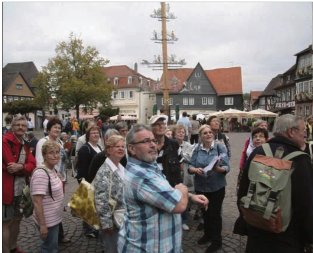
Und nun schauen sie mal auf das Einhardhaus. Informationen rund um die Einhardstadt gab es zuhauf bei den diversen angebotenen Stadtführungen während des Denkmaltages.