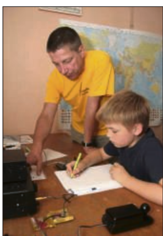
Amateurfunken informierten im Steinheimer Torturm über ihr Hobby und manch junger Gast durfte sich im Morsealphabet testen.

Hunderte Menschen beim „Tag des offenen Denkmals“