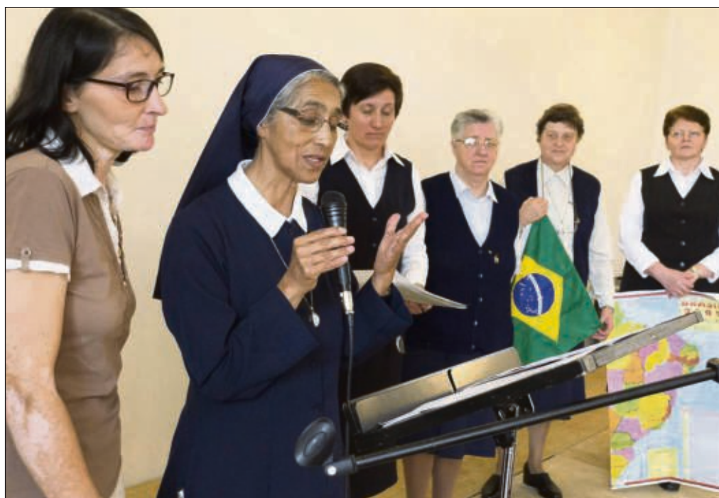
Begeistert berichteten die Ordensschwestern beim Patenschaftsfest von ihrer Arbeit vor Ort in Lateinamerika. Dolmetscher übersetzten die Reden.

Fest zum 25-jährigen Jubiläum der Patenschaftsaktion