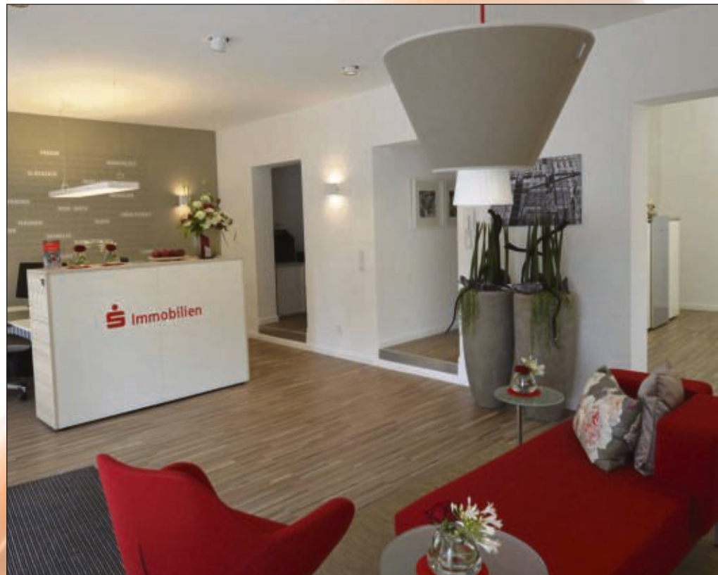
Der Empfangsbereich bei S-Immobilien im Steinweg 2 / Ecke Frankfurter Straße.