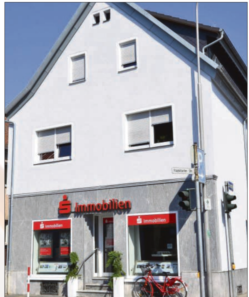
Treffpunkt Steinweg 2 an der Ecke zur Frankfurter Straße: S-Immobilien.