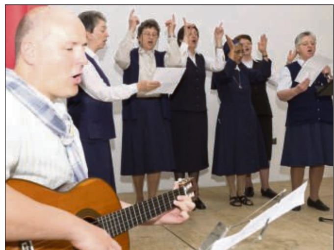
Froh gelaunte Ordensschwester beim Patenschaftsfest Seligenstadt-Lateinamerika. Mehr auf Seite 3.

Seligenstadt (beko) – Die Isartaler Hexen zu Gast in Seligenstadt, ein Familientag am Sonntag, dazu das Kuhschiss-Bingo, neue Abteilungen und neue Ideen bei der Sportvereinsung Seligenstadt, die am diesem Wochenende groß feiert. Mehr auf Seite 7.