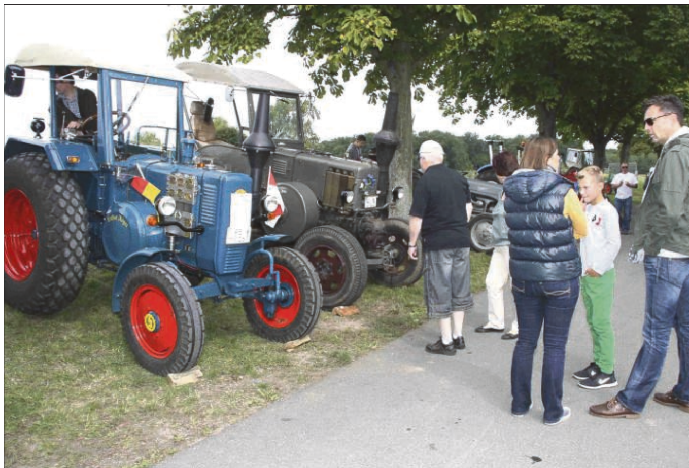
Auf der Festwiese begeisterte die Ausstellung der alten Traktoren. Vom gewaltigen Lanz bis zum Eigenbau-Einachs-Schlepper war alles vertreten.

Die Polizei in Seligenstadt ermittelt und nimmt Hinweise unter ☎ 06182 8930-0 entgegen.