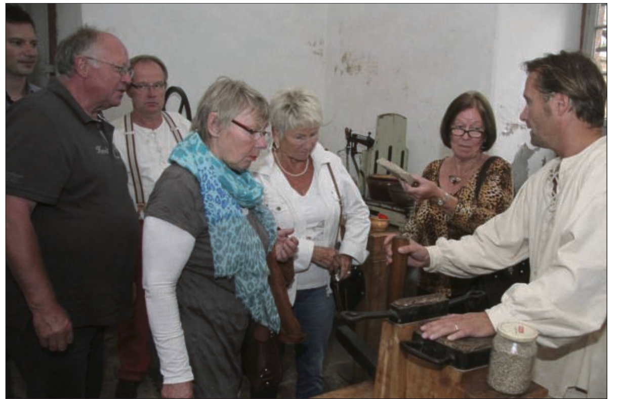
Aufmerksame Zuhörer fanden die Mitarbeiter des Förderkreises Historisches Seligenstadt in der Klostermühle, wo über die Mühlentechnik ebenso informiert wurde wie über die Keilpresse für Ölgewinnung.