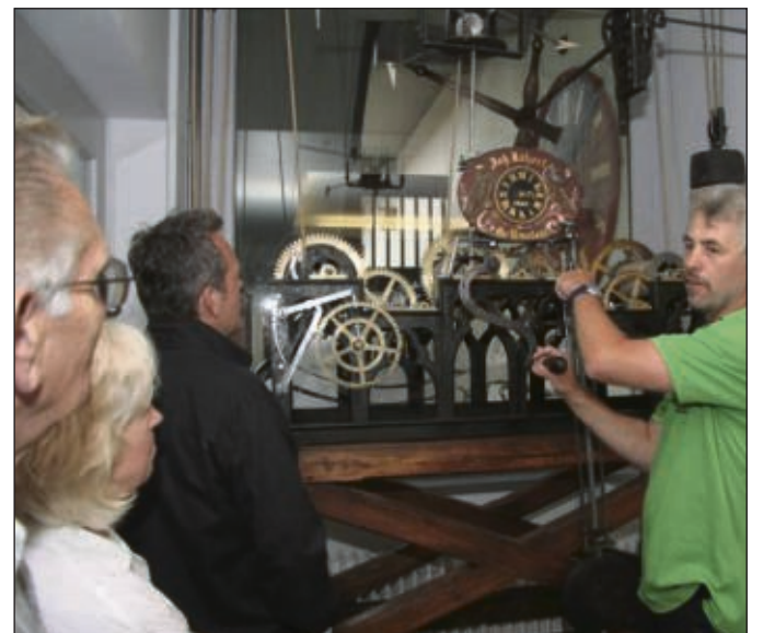
Die alte restaurierte Rathaus-Uhr im Rathaus-Innenhof fand immer wieder aufmerksame Zuschauer und Zuhörer.