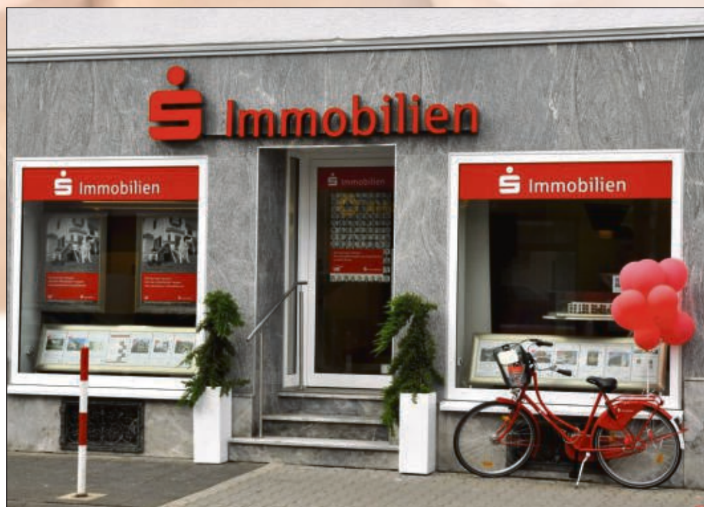
Der Eingangsbereich im Steinweg 2 in Seligenstadt.