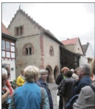
Auch das Romanische Haus stand im Blickpunkt.