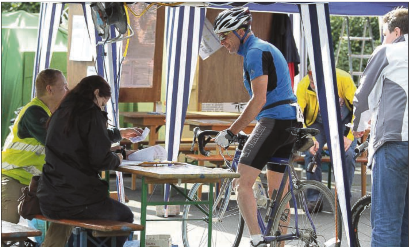
Am Kontrollpunkt in Klein-Krotzenburg an der Radsporthalle holten sich die Radfahrer ihren Stempel ab, um die gefahrenen Kilometer festzuhalten.

24Stunden-radeln-am-Main begeisterte / Polizei-Team kam auf Platz eins