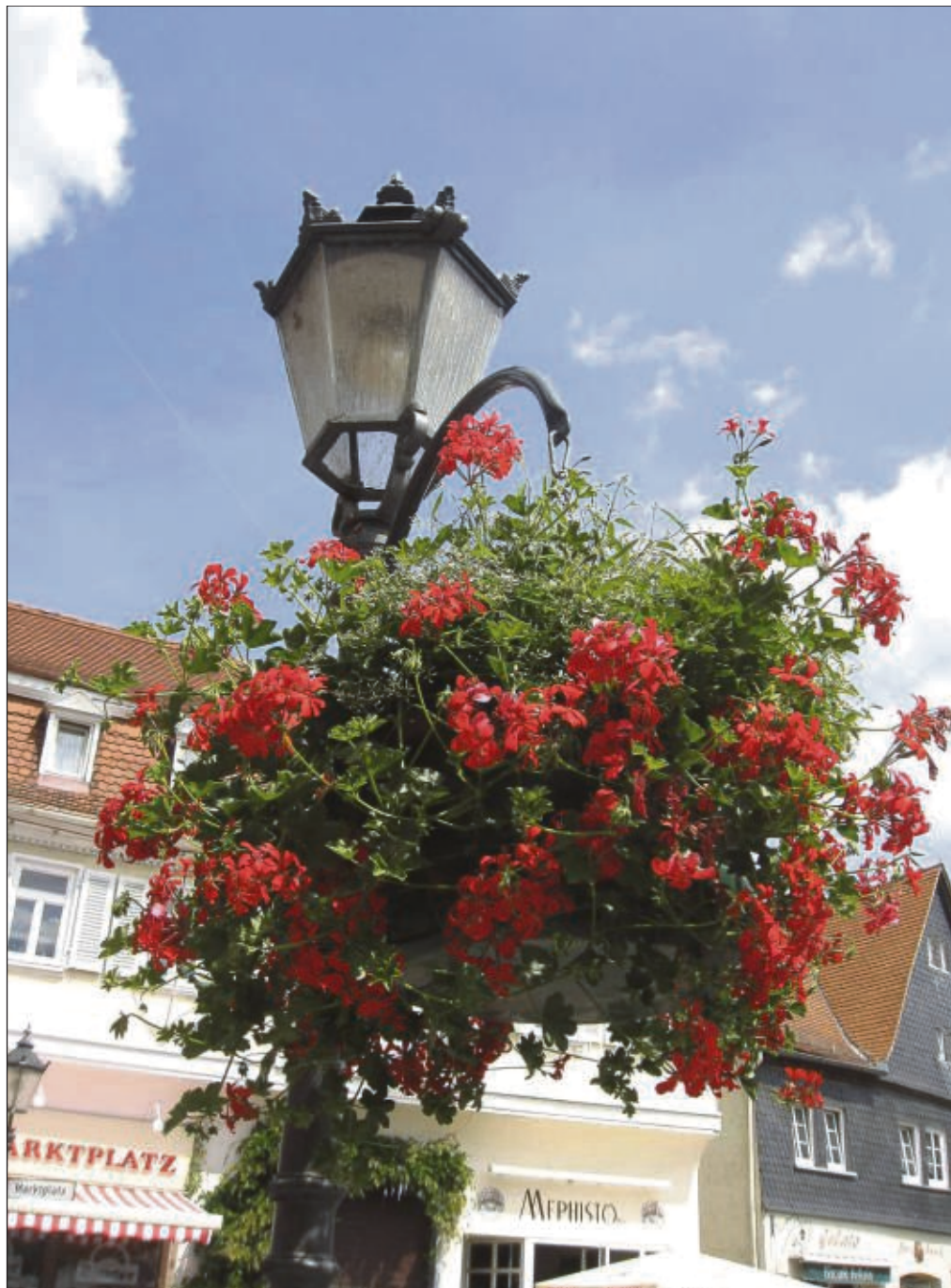
...und es gibt sie doch noch - trotz des bisher äußerst bescheidenen Sommers bleibt das Auge nun immer mehr am Blumenschmuck im Städtchen hängen. Der Heimatbund und viele Seligenstädter freuen sich, dass diese Farbtupfer jetzt immer mehr zur Geltung kommen. Und bald ist es soweit: im August wird die Blumenjury wieder ihren Rundgang durch Seligenstadt machen, um einen Preisrichter zu ermitteln.