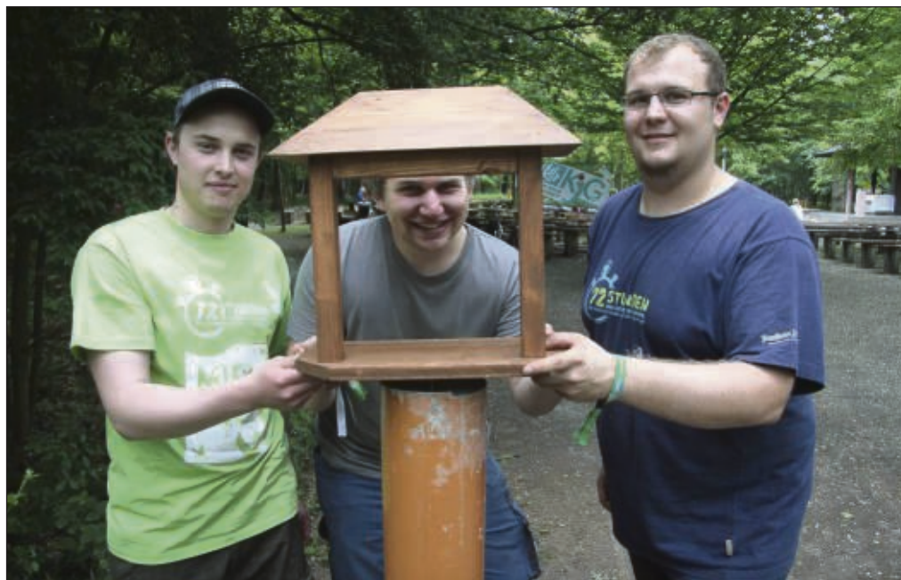
Noch hatten die jungen Leute während der 72-Stunden-Aktion Durchblick bei den neu gestalteten Kreuzwegstationen. Nun können die fertigen Werke begutachtet werden.

Bildstock am Kapellenweg in Klein-Krotzenburg mitzugehen. Die Pilger aus Seligenstadt und Umgebung treffen sich um 19 Uhr am Trinkborn in Froschhausen. Für die auswärtigen Pilger besteht an diesem Tag die Möglichkeit, den von Jugendlichen während der 72-Stunden-Aktion gestalteten Kreuzweg rund um die Kapelle in Augenschein zu nehmen. Die Idee hierzu hatte der Klein-Krotzenburger Pfarrer Thomas Weiß.