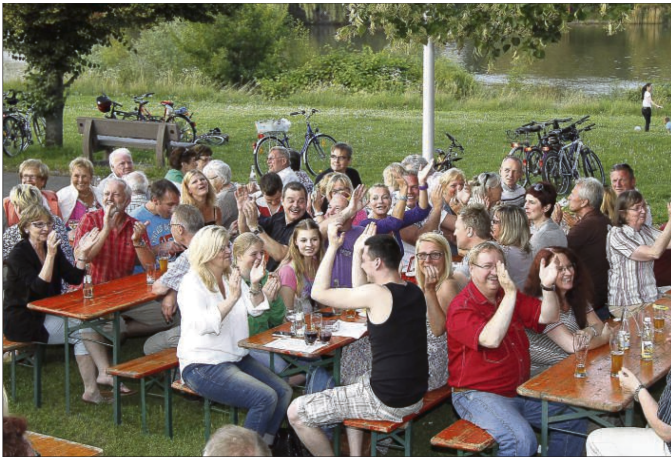
Zum Sommerfest hatte die Freiwillige Feuerwehr Mainflingen auf den Platz unterhalb der Kirche am Mainufer eingeladen. Am Samstag gab es eine Party mit den „Neuberger Party Buam“, Sonntag waren der Offenthaler Musikverein und „Spessart Echo“ aus Schollbrunn zu Gast. An beiden Festtagen gab's gegrillte Haspel, sonntags zum Mittagstisch neben vielem anderen zusätzlich „Fleischspieß mit Reis an Grillgemüse“.

Hainburg (red) – Die Radsportvereinigung Klein-Krotzenburg feiert am Sonntag, 21. Juli, im idyllischen Biergarten an der Radsporthalle (Uferstraße) ein stimmungsvolles Sommerfest. Gleich zu Beginn (10 Uhr) geht es mit einem zünftigen Frühschoppen in die Vollen. Der Frühschoppen wird musikalisch von der Stimmungskapelle „Musikcorps der TGS“ von 11 bis 14 Uhr kräftig angeheizt. Die Küche bietet zum Mittagstisch neben den üblichen Speisen wieder den Hackbraten an. Ab 13 Uhr gibt es aromatischen Kaffee und selbstgebackenen Kuchen.