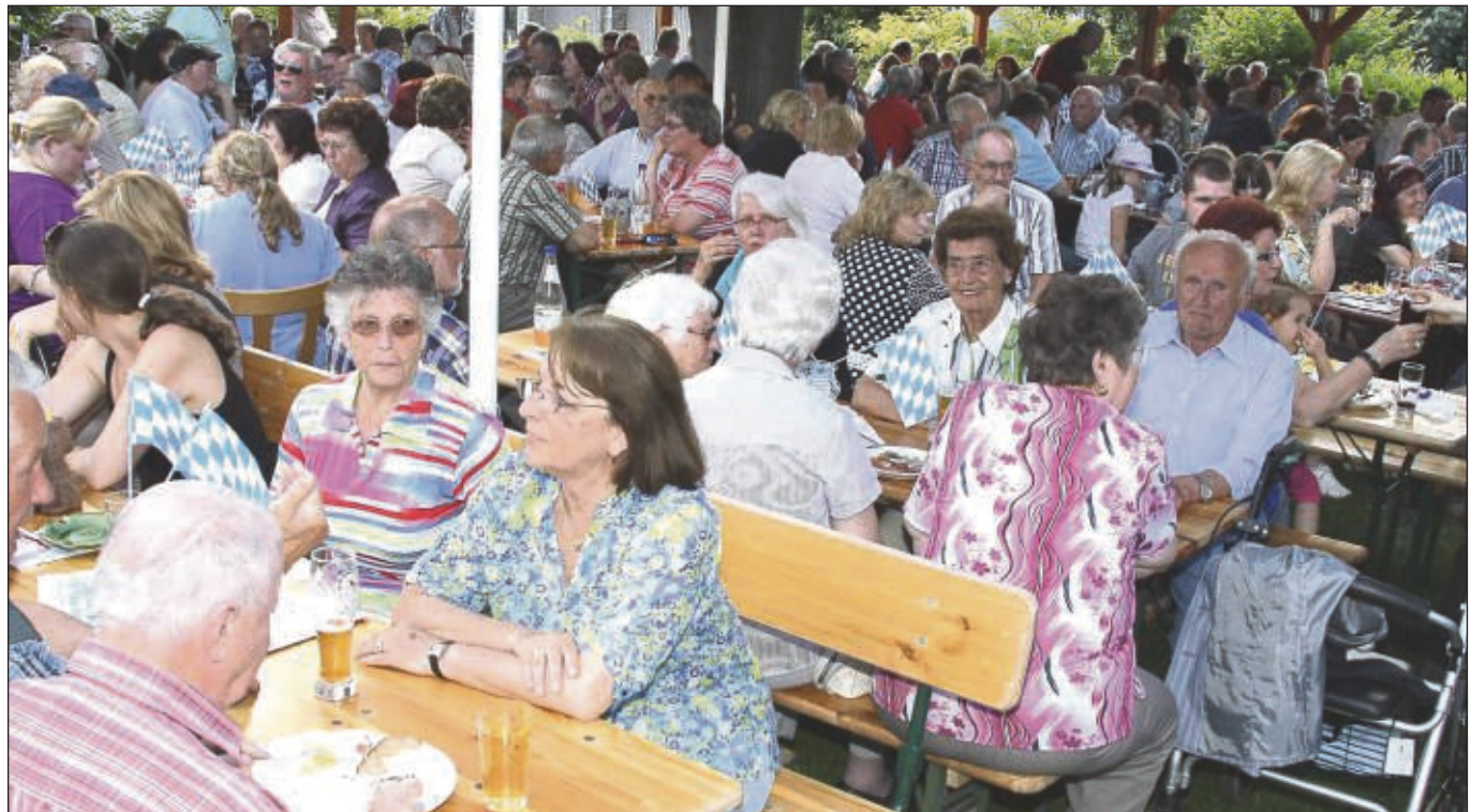
Überaus positiv waren die Stimmen zur bereits zum 19. Mal angebotenen kulinarischen Woche der Harmonie Froschhausen, bei der Spezialitäten aus 16 Bundesländern angesagt waren.

wurde es noch einmal laut mit der offiziell lautesten Band der Welt „Deep Purple“ u.a. mit „Smoke on the water“. Zum Abschluss gab es noch den Ohrwurm „Tage wie diese“ von den Toten Hosen. Unter Standing Ovations verabschiedete sich der Musikverein mit seinen Solisten von einem tollen Publikum. Am Ende wurden die Zuhörer noch mit weiteren Welthits wie den Melodien der „Rolling Stones“ oder dem Klassiker „Hey Jude“ von den „Beatles“ belohnt. Und der Begriff „Klein Woodstock“, wie Moderator Eric Winter das Festival-Feeling passend umschrieben hatte, wird an diesem Abend bestimmt nicht das letzte Mal gefallen sein.