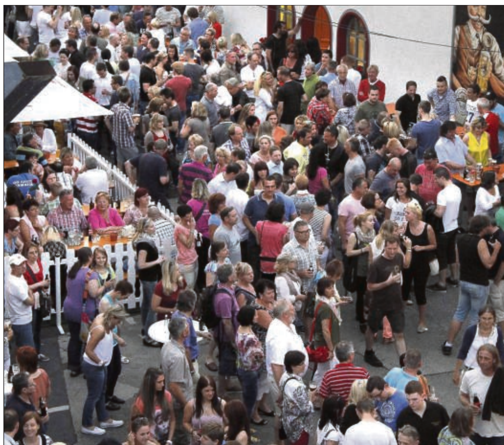
Überaus gut besucht war wieder das Hoffest bei Glaabsbräu mit viel Musik, bierigen Spielen und einem Quiz rund um die Glaabsbräu. Auch an den Brauereibesichtigungen nahmen viele Besucher teil und schauten dabei den Brauern über die Schulter.

Frühschoppen gab es typische Speisen im Biergarten und Innenhof - wie Haxe, Bierbratwürstchen und Obatzter, rundeten das Programm. Die musikalische Unterhaltung des Frühschoppens übernahm die Band „Die Blechpfeiler“ mit Musik die einfach Spaß und Stimmung brachte, hier war für jeden Geschmack etwas dabei. Das Highlight des Nachmittages war die Vorstellung des traditionellen Glaabsbräu-Festgespanns, das von vier weißen Percheron-Pferden gezogen wird. Ein Bild, das an frühere Zeiten erinnerte, als Glaabsbräu ihre Biere noch mit eigenen Pferden auslieferte. Bierige Spiele und ein Quiz rund um die Glaabsbräu rundeten das Fest ab. Für einen musikalischen Abschluss sorgte der Musikverein Kleinwelzheim der seine Rock Classics in Szene setzte.