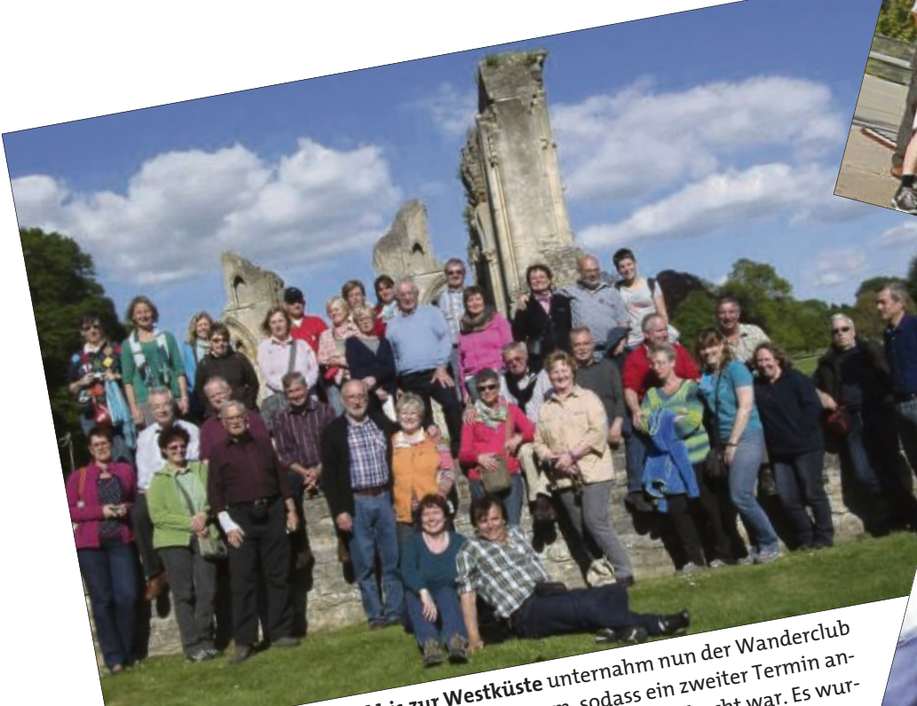
Eine Bustour durch England bis zur Westküste unternahm nun der Wanderclub Edelweiß Seligenstadt. Die Nachfrage war enorm, sodass ein zweiter Termin angesetzt wurde und der Bus mit 36 Teilnehmern wieder ausgebucht war. Es wurden 3256 Kilometer mit dem Bus zurückgelegt und insgesamt 44 Kilometer gewandert. Sehenswürdigkeiten waren unter anderem Stonehenge und die Abteiruine von Glastonbury.