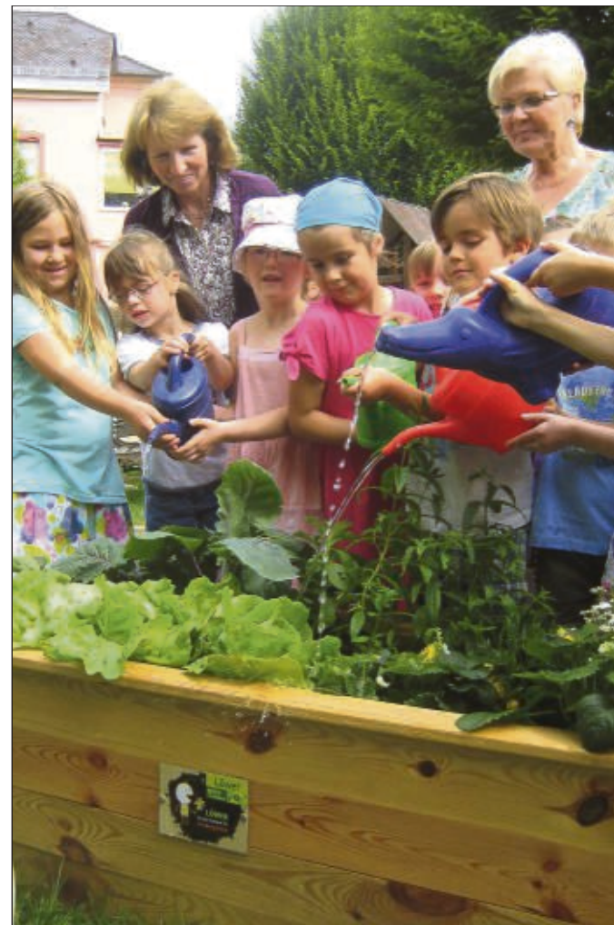
Die Kita St. Josefshaus Seligenstadt hat bei der Löwer-Aktion „Kinder-Gärten für Kindergärten“ mitgemacht. Dieser Tage haben die Kinder dann ihren ersten eigenen Salat aus dem Pflanzenkasten geerntet.

ihren Tee mit Süßkraut und schlemmen die Karotten und Erdbeeren und den Salat aus dem eigenen Anbau. Im Oktober wird an je einen Kindergarten pro Aktionsstandort zum 2. Mal der „Grünschnabel-Preis“ verliehen. Und das geht so: Die Kindergärten senden bis Ende Juli 2013 ihre schönsten „Kinder-Garten“-Schnapshots ein. Die Fotos werden anschließend in den Gärtnereien ausgehängt. Löwer Kunden haben dann die Qual der Wahl bei der Abstimmung für ihren Favoriten. Die feierliche Verleihung des „Grünschnabel-Preises“ durch die Firma Löwer bildet den Abschluss der Aktion.