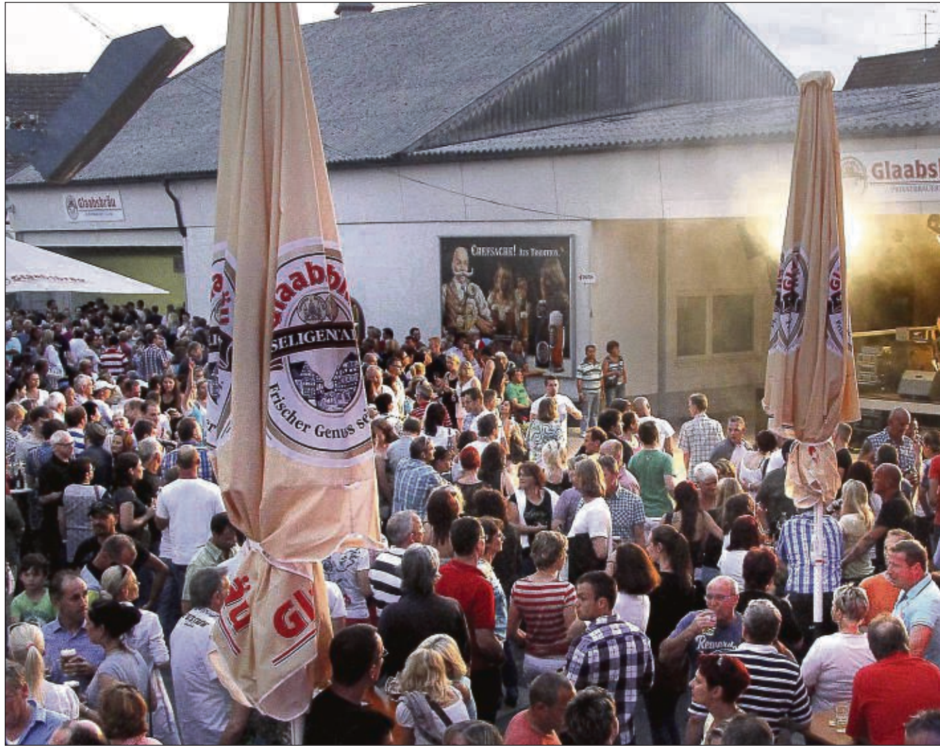
Hoffest war bei der Glaabsbräu in Seligenstadt und nicht nur während der musikalischen Aufführungen - wie hier von der Hanauer Culture Club Band - war der Hof brechend voll. Ausführlicher Bericht auf Seite 5.