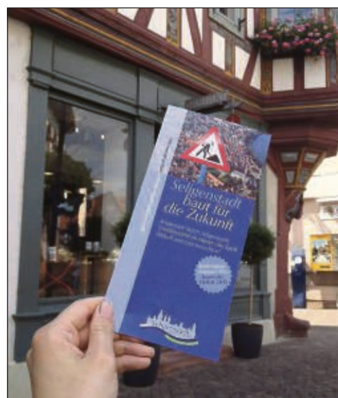
Den Flyer „Seligenstadt baut für die Zukunft“ gibt es ab Mitte Juli.

dieser Zeit ist sicherlich ratsam“, so die Rathaus-schefin abschließend. Die Flyer liegen ab Mitte Juli im Rathaus, in der Tourist-Info, im Bürgeramt, im Nachbarschaftshaus, in der Stadtbücherei sowie in den Verwaltungsstellen aus.