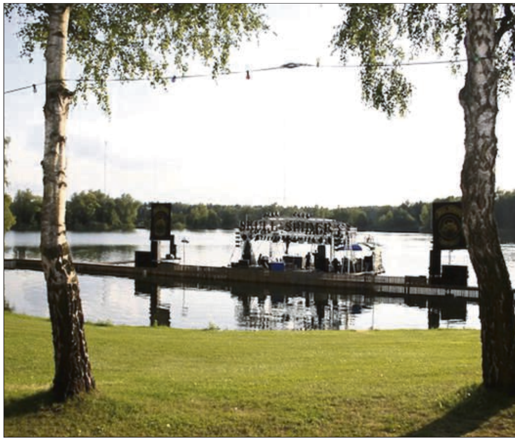
Mitten in den Vorbereitungen stecken die Verantwortlichen der Skull Spiders, um für Samstag deutschland's größte Beach-Party zu organisieren.