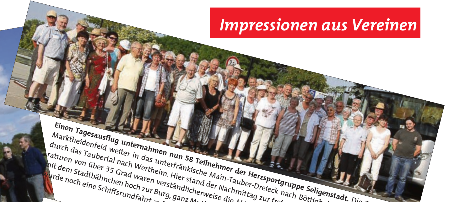
Einen Tagesausflug unternahm nun 58 Teilnehmer der Herzsportgruppe Seligenstadt. Die Fahrt ging über Marktheidenfeld weiter in das unterfränkische Main-Tauber-Dreieck nach Böttigheim. Danach ging es weiter durch das Taubertal nach Wertheim. Hier stand der Nachmittag zur freien Verfügung. Durch die hohen Temperaturen von über 35 Grad waren verständlicherweise die Aktivitäten weitgehend eingeschränkt. Einige fuhren mit dem Stadtbähnchen hoch zur Burg, ganz Mutige erklimmen sogar noch den Turm. Zum Abschluss des Tages wurde noch eine Schiffsrundfahrt auf dem Main gemacht.