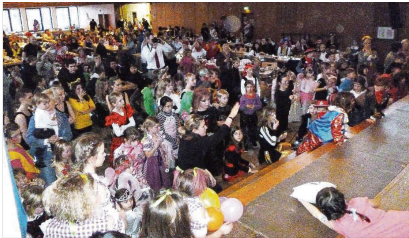
Auf dem gut besuchten Kindermaskenball der TSG Mainflingen konnten sich die Kinder austoben und hatten viel Spaß. Für das leibliche Wohl der Kinder war bestens gesorgt.

kleinen Gruppen gearbeitet, daher sind die Kurse für Anfänger und Fortgeschrittene geeignet. Dienstag nachmittags, Mittwoch abends und Donnerstag nachmittags. Es wird zeitgenössische Malerei in klassischen Maltechniken angeboten. Telefonische Anmeldung unter 06182 27251 bei Dozentin Edith Trüschler ● Der Vorstand der Unabhängigen Wählergemeinschaft lädt alle Mitglieder am 25. Februar um 20 Uhr zur Jahreshauptversammlung ins alte Rathaus Zellhausen ein. ● Der Hundesportverein Mainflingen lädt ein zu einem Impftermin für alle Vierbeiner am Mittwoch, 20. Februar, ab 18 Uhr. Dies gilt auch für Vierbeiner von Nichtmitgliedern ● Mail an die Redaktion: shb@stadtpost.de