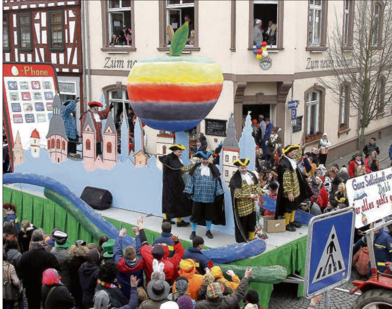
Maries Bunker-Schlumber organisierten zum Rosenmontagszug eine Stadtführung en miniature mit der Äppel-App auf Tour: „Ganz Sellistadt werd debb, fer alles gebt's e Äpp!“