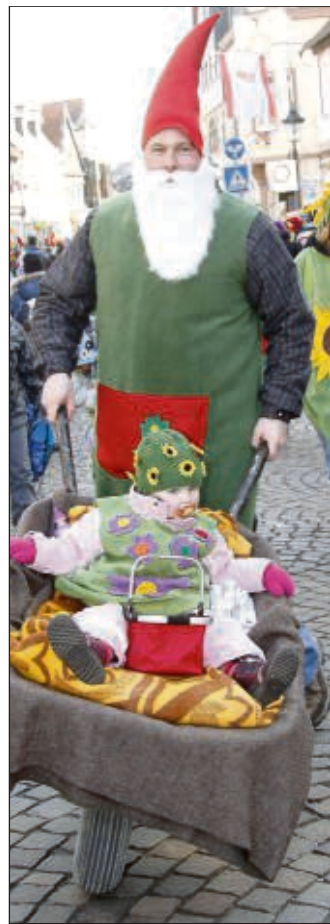
Klar, dass da auch große und kleine Zwerge aktiv waren...