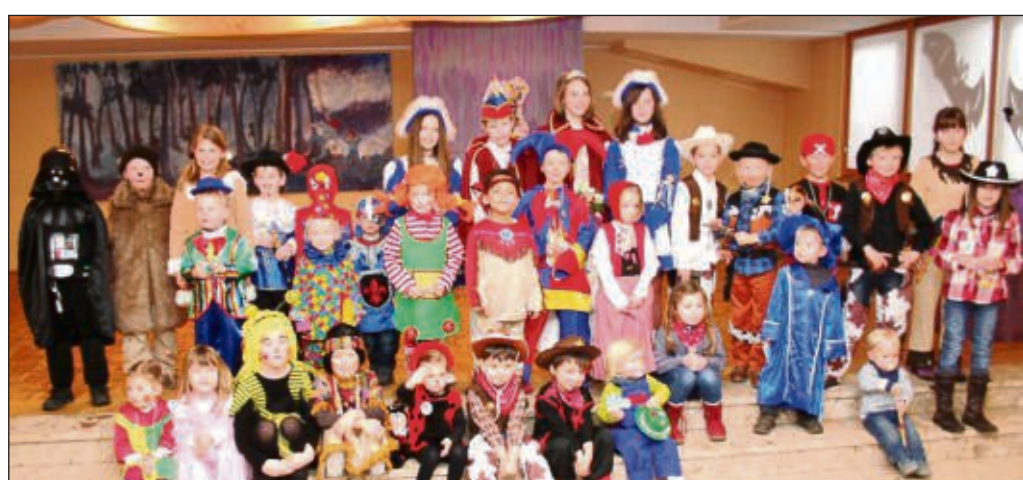
Einen Kleinkinderwortgottesdienst zum Thema „Heute schon gelacht“ feierten nun die Kleinsten der Pfarrei St. Nikolaus mit dem Klein-Krotzenburger Kinderprinzenpaar. Bunt kostümiert und fröhlich singend lobten sie Gott und beteten zu Jesus.