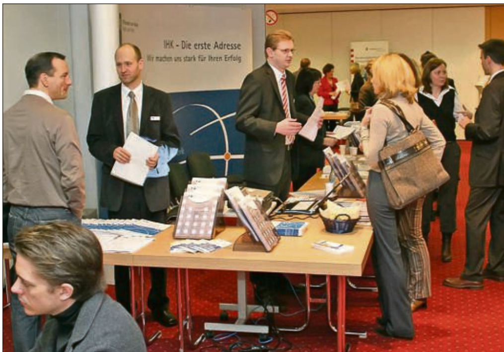
Ein Bild vom Gründertag 2012: Das Motto „Kurze Wege - viele Kontakte“ gilt auch für 2013.

Am Samstag, 16. Februar, ist es wieder soweit. Zum achten Mal veranstaltet die IHK Offenbach am Main den bekanntesten und bewährten Gründertag. An diesem Tag stehen alle an Gründung, Sicherung und Nachfolge Interessierten