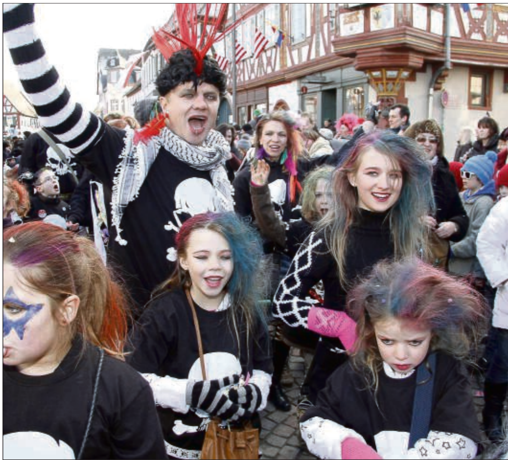
Sellestadt Helau! Fast 20 Zugnummern hatte der Kinderfastnachtzug in diesem Jahr in Seligstadt bei Sonnenschein und strahlend blauem Himmel.