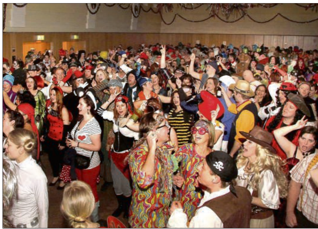
Ausverkauft war der traditionelle Heimatbund-Hexenball am Samstagabend im Riesensaal. Die Haus- und Partyband „Doctor Blond“ ließ es ordentlich krachen - sehr zum Vergnügen der Fastnachts-Fans.