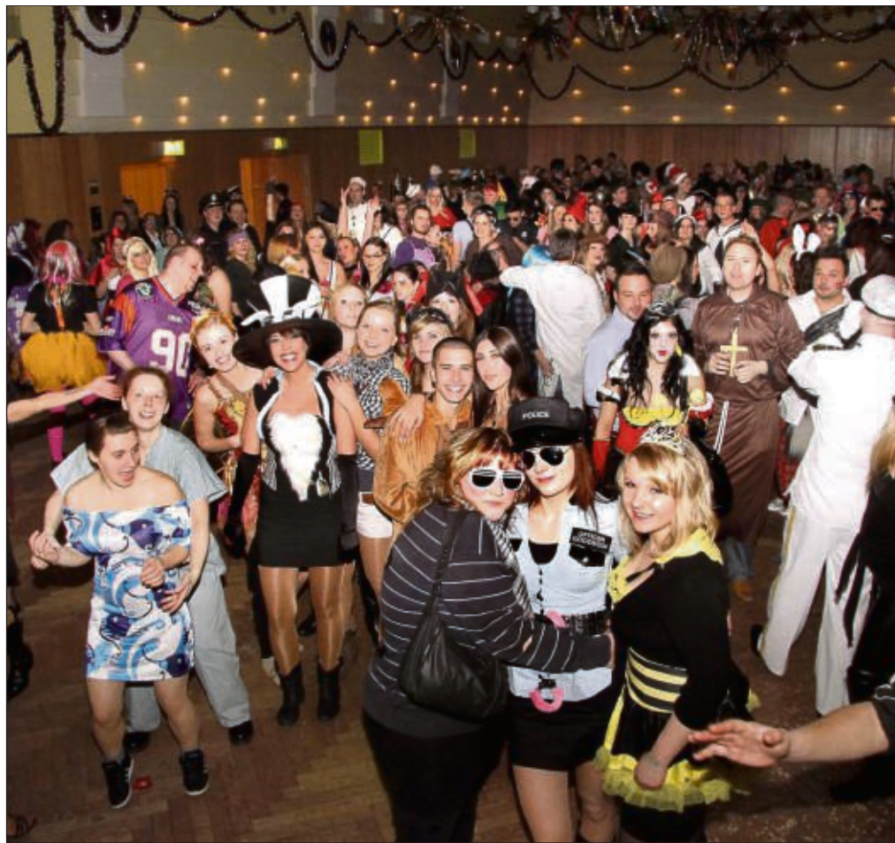
Schlumber-Party war am Sonntagabend im Riesen und die natürlich auch gut besucht bei bester Stimmung und DJ-Musik.

In diesem Sinne eine gute Vorbereitungszeit auf Ostern, wünscht Euer Turmmännchen.