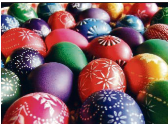
Bunt bemalte Eier und vieles mehr gibt es beim Ostereiermarkt im Landschaftsmuseum.