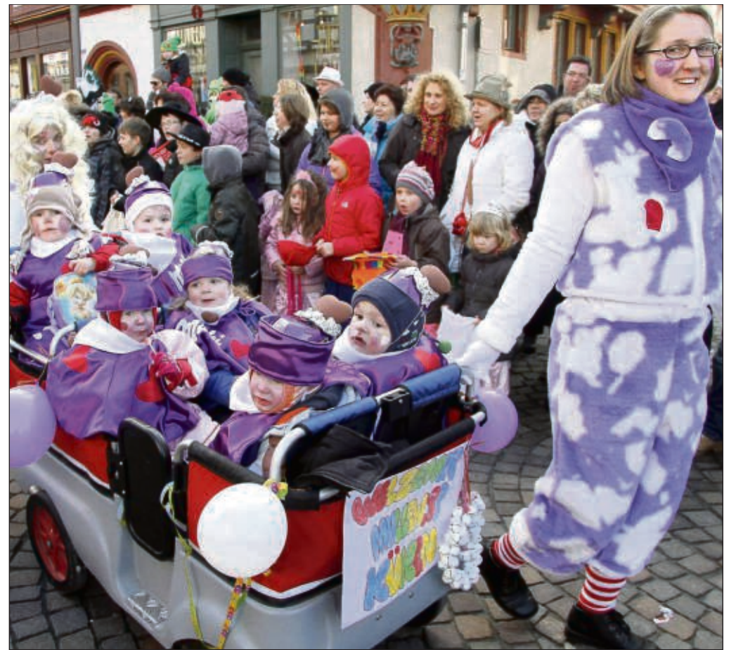
...und wer richtig Glück hatte, der wurde im Wagen kutschiert und konnte die Helau-Rufe Tausender am Straßenrand so richtig genießen.