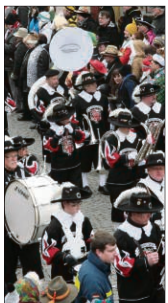
Hatten in den Fastnachtswochen volles Programm: Die Aktiven der Musikgesellschaft Eintracht Hainstadt.