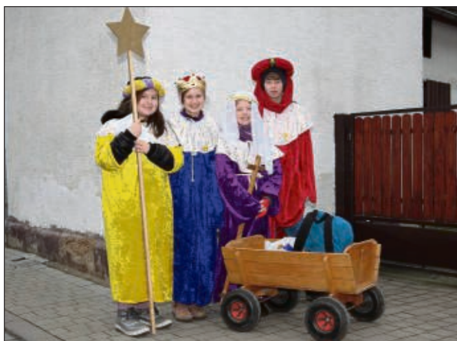
Die Sternsinger der Gemeinde Mainflingen ziehen von Haus zu Haus.