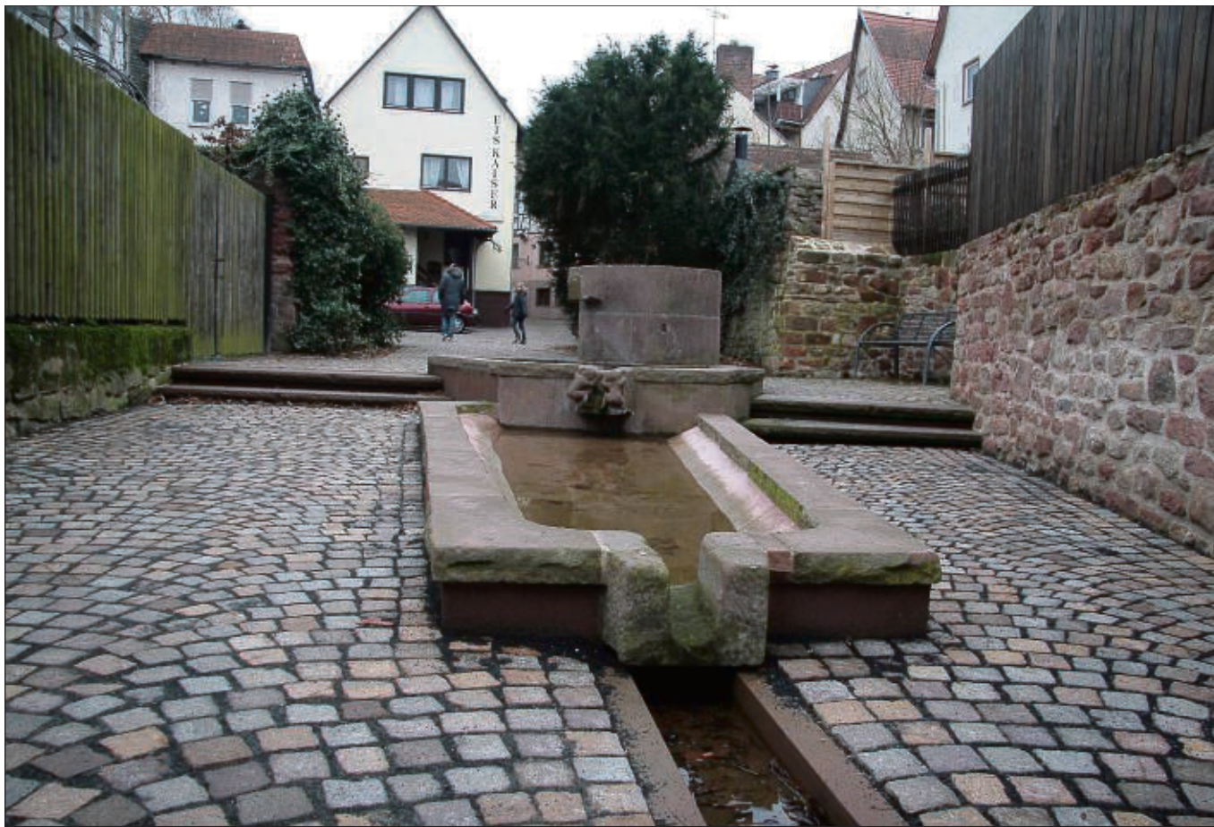
Der „Rote Brunnen“ steht neben einem Storch im Blickpunkt des neuen Heimatbund-Ordens, der in den kommenden Wochen an mehr als 300 Fastnächter verteilt wird.

Achten Sie bitte darauf, Texte, die für das Seligenstädter Heimatblatt bestimmt sind, auch an diese Adresse zu mailen.