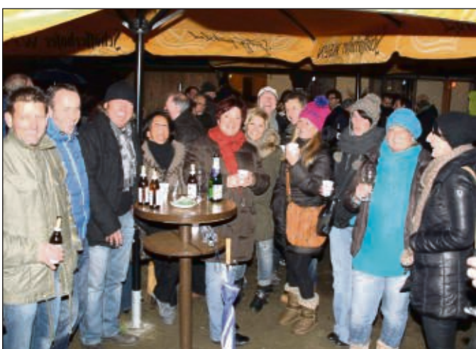
Winterfest war in Mainflingen beim ASV: Mit Calamares und Fischbrötchen, Stockbrot für die Kinder und warmen Getränken erfreuten sich die Teilnehmer an Heizöfen und am Lagerfeuer.

letzten Probe vor den Weihnachtsferien. Die Betreuerinnen servierten den Kindern Tee in echtem japanischem Geschirr und es gab eine kleine Einführung in die Kunst des Umgangs mit Essstäbchen. Chorproben sind ab 11. Januar jeden Freitag von 15.30 bis 16.30 Uhr im BürgerhausInfo-☎ 200287. ● Redaktionsschluss für Beiträge freitags, 10 Uhr.