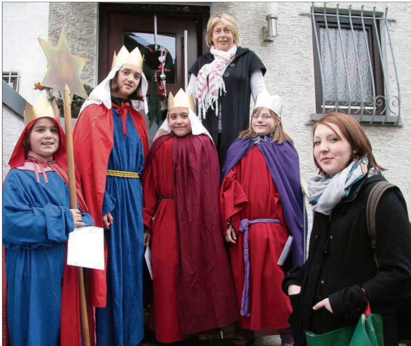
Auch in Klein-Krotzenburg waren die Sternsinger am Wochenende unterwegs. 54 Kinder besuchten in 13 Gruppen Häuser in der Gemeinde, brachten den Weihnachtssegens und sammelten für notleidende Kinder in Tansania. Motto der Aktion war diesmal „Segen bringen, Segen sein“. Über die Ergebnisse der Sternsingeraktionen werden wir noch berichten.

Fastnacht geboten und im Anschluss hieran beginnt eine große bunte Fastnachtsparty mit DJ Chris. Hier können alle gemeinsam mit dem neuen Prinzenpaar bis in die Nacht hinein feiern und tanzen. Alle Narren aus Hainstadt und den benachbarten Gemeinden sind hierzu eingeladen. Um die Stimmung dem Treiben anzupassen, wird um Kostümierung gebeten. Beginn des närrischen Treibens im Mövia-Saal des Vereinsheims an der Eisenbahnstraße ist um 19.01 Uhr, der Einlass erfolgt ab 18.31 Uhr. Es gibt noch einige Karten im Vorverkauf, jedoch sollte man sich beeilen, um sich ein Ticket zu sichern. Erhältlich sind diese bei Lotto am Dallas, Nails and Hands (Gudrun Speicher-Fischer), Sonnen-Apotheke und Sportsbistro in Hainstadt sowie bei allen Mitgliedern des GV Germania und dem Kleinen Rat.