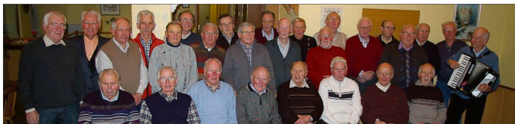
Eine muntere Truppe, die nicht nur singt, sondern sich auch sportlich engagiert, sind die Mitglieder beim Kolping-Ausgleichssport in Seligenstadt. Jeweils mittwochs von 17 bis 19 Uhr sind die Kolpinger auch in der Turnhalle der emmaschule aktiv.

dernden Botschaft ergelt die Einladung an alle sportlich Interessierte, sich einmal über den genauen Übungsablauf zu informieren. Übungsstunden sind jeweils mittwochs von 17 bis 19 Uhr bei Gymnastik und Volleyball in der Turnhalle der Emmaschule, Giselastraße.