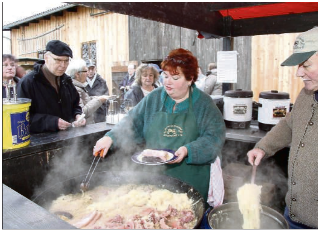
Schlachtfest war bei den Traktorenfreunden in Froschhausen unter dem Motto „Und wenn die Sau am Haken hängt, wird erst einer eingeschenkt“ mit Vortrag der „Reiterlichen Jagdhornbläser Maingau“ und natürlich deftigem Essen. Zum Angebot gehörten Schlachtplatten mit Brot und Kraut, Wellfleisch, Hausmacher Wurst, Fleischwurst, Bockbierwurst und Bierknacker.