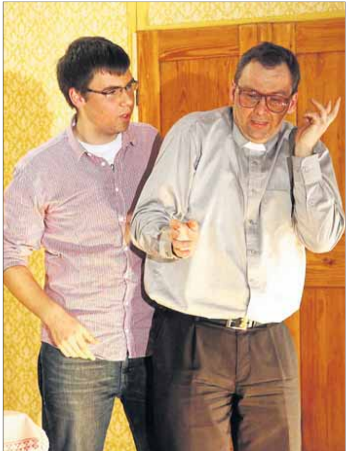
Mit der Kriminalkomödie „Hochwürden auf der Flucht“ konnte die Theatergruppe des Frohsinn Klein-Krotzenburg bereits bei der Premiere in Großostheim gute Kritiken einfahren. Am vergangenen Samstag wurde dieses Stück auch in Klein-Krotzenburg im Pfarrsaal an der Kirchstraße mit großem Erfolg aufgeführt.