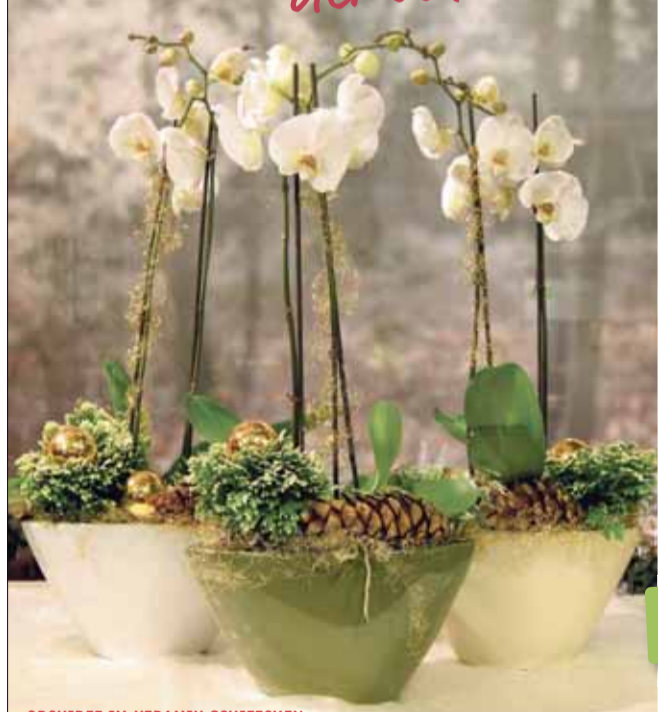
ORCHIDEE IM KERAMIK-SCHIFFCHEN komplett bepflanzt nur 24,99 €