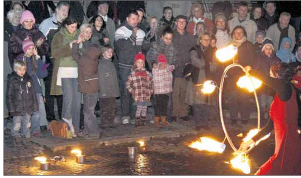
Mit einer temperamentvollen Feuer-Show wurden die Adventsmarkt-Tage eröffnet.