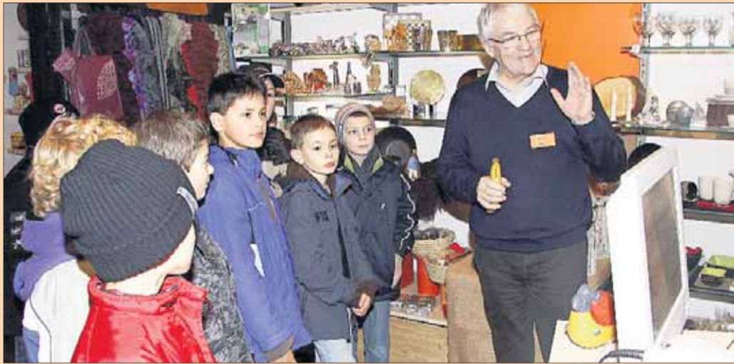
Im „Eine-Welt-Laden“ wurde die Herstellung von Bananenmilch vorgestellt.