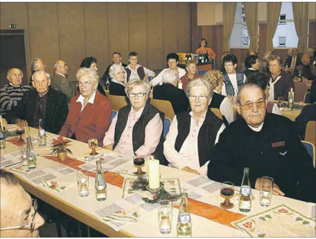
Eine stimmungsvolle Adventsfeier für alle Senioren richtete die Pfarrgemeinde St. Cyriakus Klein-Welzheim im Bürgerhaus-Saal aus. Das weihnachtliche Programm gestalteten die Vorschulkinder der Kindertagesstätte, der Kirchenchor und die Flötengruppe des Klein-Welzheimer Musikvereins.

Evangelische Kirchengemeinde lädt Kinder ab 5 Jahren ein: