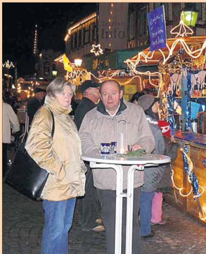
Tausendfacher Lichterglanz und der Duft nach Punsch, Glühwein, Süßem und Gebratenem prägt die adventliche Marktatmosphäre im Herzen der Einhardstadt.