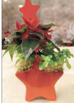
MINI-WEIHNACHTSSTERN mit Deko und Stern-Übertopf nur 5,99 €