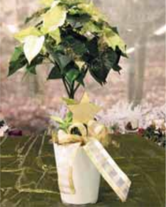
WEIHNACHTSSTERN-BÄUMCHEN ca. 50cm hoch mit Deko & Übertopf nur 9,99 €

Erinnern Sie sich? Als Kinder stellten wir am Nikolaus-Vorabend unsere Schuhe vor die Tür. Strahlende Kinderaugen freuten sich am nächsten Tag über die Geschenke, die der Nikolaus in die Schuhe gefüllt hat. Eigentlich ist dies ein schöner Brauch, unseren Mitmenschen mit solch kleinen Gesten große Freude in die Augen zu zaubern. Probieren Sie es doch mal aus! Bei Löwer finden Sie jetzt eine Vielzahl hübscher Kleinigkeiten, die einfach Freude bereiten. Schließlich möchten wir, dass Sie mit unseren Ideen ein Lächeln ernten und vielleicht sogar Herzen gewinnen. Ihr Löwer-Team.