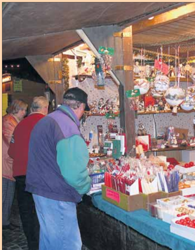
Bummeln und entdecken: Die beschauliche Budenstadt rund um den fachwerkgeschmückten Seligenstädter Marktplatz öffnet täglich am Nachmittag bis in den Abend hinein und offeriert ein ansprechendes Sortiment an weihnachtlichen Artikeln.