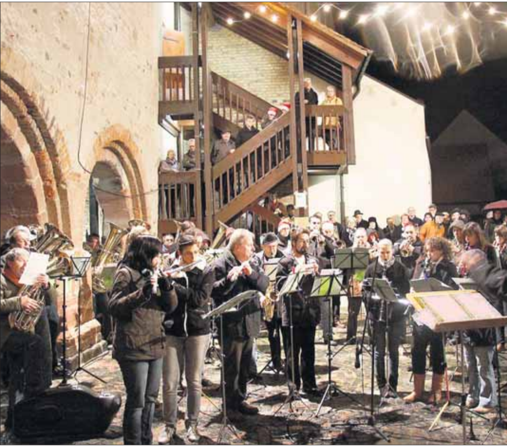
An den Sonntagen bis Weihnachten lädt der Heimatbund jeweils um 17 Uhr zu seinen beliebten Adventskonzerten in den stimmungsvoll beleuchteten Seligenstädter Rathaus-Innenhof ein. Einen gelungenen Auftakt gestaltete der Klein-Welzheimer Musikverein (Bild) mit seinem bunten Potpourri winterlicher und weihnachtlicher Melodien. Am kommenden Sonntag spielt das Musikcorps der TGS. Auch dazu werden zahlreiche Besucher erwartet, die sicherlich wieder in so manche Weihnachtslieder mit einstimmen werden.

Seligenstädter Adventsmarkt lockt Tausende in die Einhardstadt: