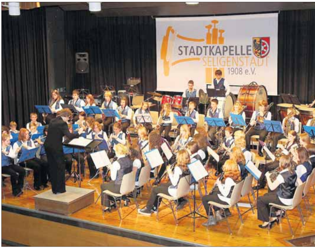
Begeisterungstürme folgten den exzellenten Darbietungen des Jugendblasorchesters der Stadtkapelle im ausverkauften Riesensaal.

Seligenstadt - Am 5. Juli wurde Dagmar B. Nonn-Adams von den Bürgern der Stadt Seligenstadt als Bürgermeisterin wiedergewählt. Die Amtseinführung erfolgt im Rahmen einer öffentlichen Sitzung der Stadtverordnetenversammlung am Montag, 14. Dezember, um 20 Uhr, im großen Saal des Riesens, Sackgasse 14.