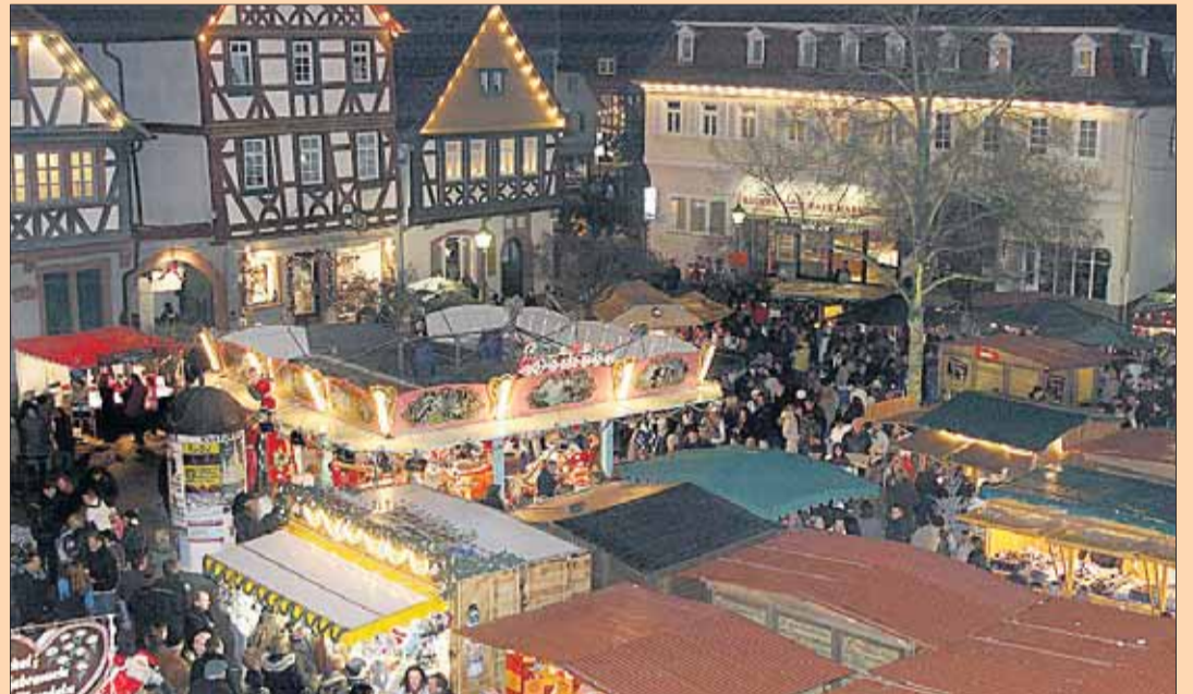
Mit einer Feuertanz-Show wird der Budenzauber an diesem Freitag eröffnet.

Adventsmarkt öffnet in Seligenstadt mit reichhaltigem Rahmenprogramm: