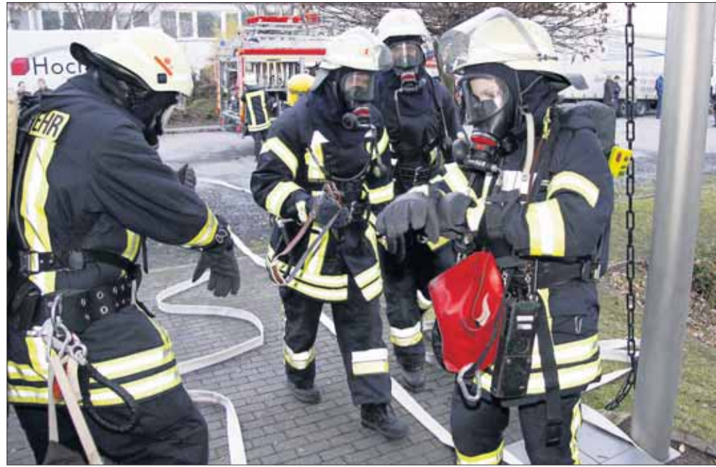
Aufgrund eines Defektes entstand ein Brand im Heizungsraum im Untergeschoss der Firma KM Blechbearbeitung. Die Froshausener Feuerwehr leitete sofort eine Personensuche und Rettung sowie damit einhergehend die Brandbekämpfung ein. Der frühzeitige Einsatz des Hochdrucklüfters verhinderte die weitere Rauchausbreitung in die oberen Geschosse und schaffte den Trupps im Innenangriff bessere Sicht- und Temperaturverhältnisse. Diesen Ernstfall nahm die schnelle Truppe am vergangenen Samstag als Abschlussübung an.