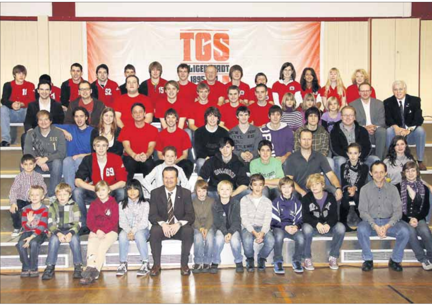
Die große Sportlerehrung der Turngesellschaft (TGS) ging erstmals in der Großsporthalle des Vereins über die Bühne. Unser Bild zeigt die zahlreichen Geehrten des größten hiesigen Vereins auf einen Blick.

Große Sportlerehrung bei der TGS Seligenstadt: