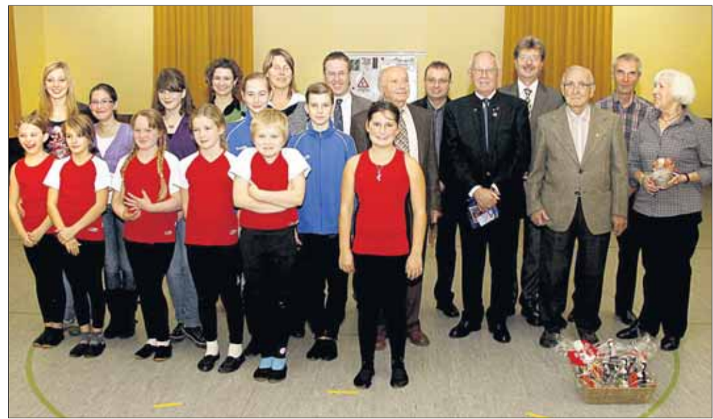
Diese Sportler des RFC Mövia Hainstadt und langjährige Mitglieder kamen beim Familiennachmittag mit Vorführungen zu besonderen Ehren.