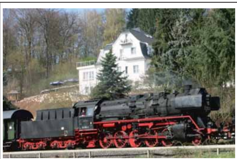
Historische Dampfzugschleife auf der Strecke der Kahlgrundbahn. Im Hintergrund das Restaurant Villa Hof Langenborn bei Schöllkrippen.

Schöllkrippen: Schon ab 5 Personen gilt der supergünstige Gruppentarif des RMV, mit dem man für 4,50 € pro Person mit der Kahlgrundbahn von Hanau Hauptbahnhof, nach Schöllkrippen und wieder zurück fahren kann! Neben einem „führerscheinunschädlichen“ Ausflug in den herbstlichen Kahlgrund, wartet das wunderschöne Naherholungsgebiet mit einer Vielzahl an touristischen Attraktionen. In historische Kostüme verkleidet, geleiten die Gästeführer des Heimat- und Geschichtsvereins Schöllkrippen, ihre staunenden Zuhörer, durch das historische Schöllkrippen anno 1906, bevor sie an der „alten Villa“ des Gründungsdirektors der Kahlgrundbahn, der heutigen Villa Hof Langenborn, zur Stärkung einkehren. Familie Kilgenstein, die heutigen Inhaber der stillvoll renovierten Villa mit eigener Hofmetzgerei und Bio-Landwirtschaft, legen größten Wert auf naturbelassene, regionale Rohstoffe. Einen Tagesausflug ist auch der Besuch des ehemaligen Kupferbergwerks „Wilhelmine“ in Sommerkahl wert, wo in längst vergangenen Zeiten, zum Teil mit bloßen Händen nach dem begehrten Erz gegraben wurde.