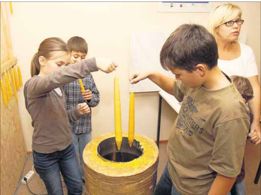
Noch bis Samstag 21. November , kann man derzeit Kerzen ziehen bei der evangelischen Freikirche in Seligenstadt. Täglich gibt es Gelegenheit von 13 bis 18 Uhr in den Räumen der Gemeinde im Klinggraben 1c. Fertige Kerzen kann man auch kaufen, entweder in der Kerzenwerkstatt oder auf dem Weihnachtsmarkt.