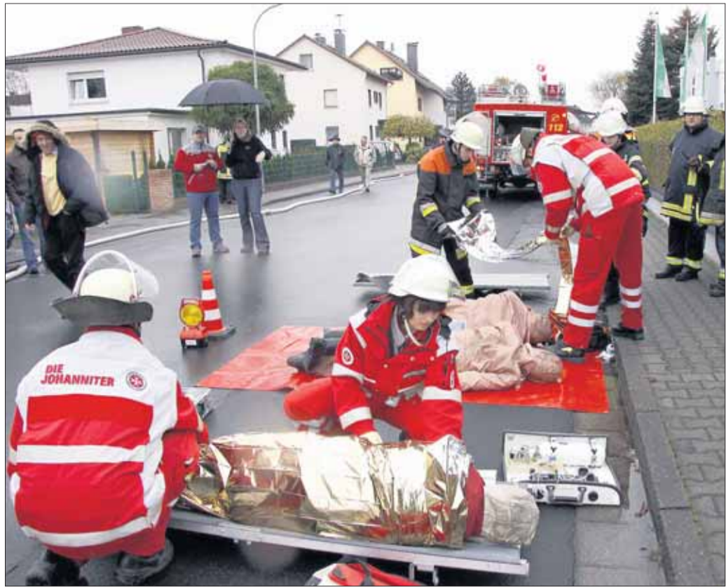
Geborgene Verletzte konnten an Ort und Stelle notärztlich versorgt werden.

Feuerwehren des Ostkreises probten mit rund 250 Aktiven den Erstfall: Verpuffung in einem Industriebetrieb