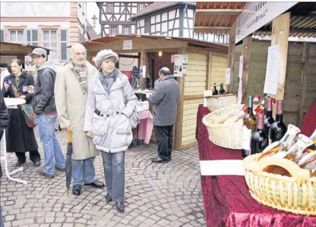
Einen „spätherbstlichen Shopping-Sonntag“, bei dem das Wetter mitspielte, veranstalteten der Gewerbeverein und die Stadtmarketing-GmbH in der Einhardstadt. Zudem gab es einen kleinen Klostermarkt auf dem Freihof.

Vorlage für ein Arrangement, in dem Melodien aus Star Wars oder Harry Potter zu hören sein werden. Mit „Dakota“ wird das Leben der Sioux-Indianer musikalisch umrissen. Als besonderer Höhepunkt darf sicher die Vertonung der Rocklegende Chicago gelten. Der Vorstand und der Musikausschuss laden die Bürger unserer Stadt und der Umgebung zu ihrem Konzert ein. Vorverkauf ist bei der Tourist-Info, bei Zabos Werkstatt und natürlich bei allen aktiven Musikern. Beginn ist um 19.30 Uhr, Saalöffnung ist bereits um 18.30 Uhr.