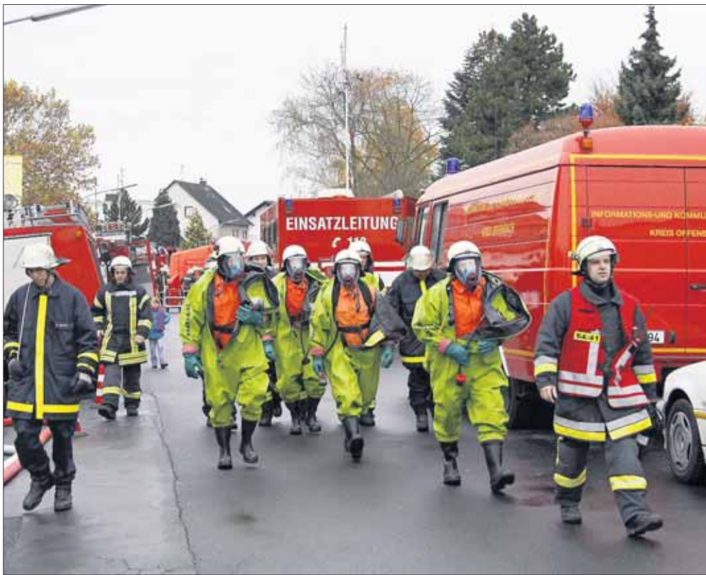
Blitzschnell erreichten die Einsatzkräfte in Schutzanzügen den tragischen Unfallort.

Fortsetzung von Seite 1: Vielleicht rührt der über- zeugende Gesamtein- druck, den die Jury gezo- gen hat, auch daher, dass das Projekt der Höhe- punkt einer bereits drei Jahre währenden Zusam- menarbeit darstellte ("jun- ge Töne 3"). Bereits seit 2006 war Stockhausen Gast in den Musikfreizeit- en und Konzerten beider Schulen, animierte die Kinder zur Improvisation und bezog sie damit erst- malig 2007 in seine Konz- erte ein. Im Sommer 2008 folgte das zweite ge- meinsame Konzert. Der Tag der Musik ist eine dieses Jahr ins Leben ge- rufene Initiative des Deut- schen Musikrates und dem Verein „Tag der Mu- sik“. Unter der Schirm- herrschaft von Bundes- präsident Horst Köhler soll er den verschiedens- ten Einrichtungen, von Kindergärten, Musikschu- len, Schulen bis zu Chö- ren, Orchestern und Mu- sikvereinen die Chance geben, die Vielfalt und Qua- lität des Musiklebens in Deutschland zu zeigen.