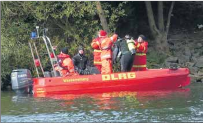
Im Dienst des Umwelt- und Gewässerschutzes.

Mainhausen - Die Ortsgruppen der DLRG Mainflingen, Seligenstadt und Rodgau übten den Erstfall am Main. Mit 4 Booten und fünf Einsatz- tauchern waren die Orts- gruppen mit rund 40 Ein- satzkräften vor Ort.