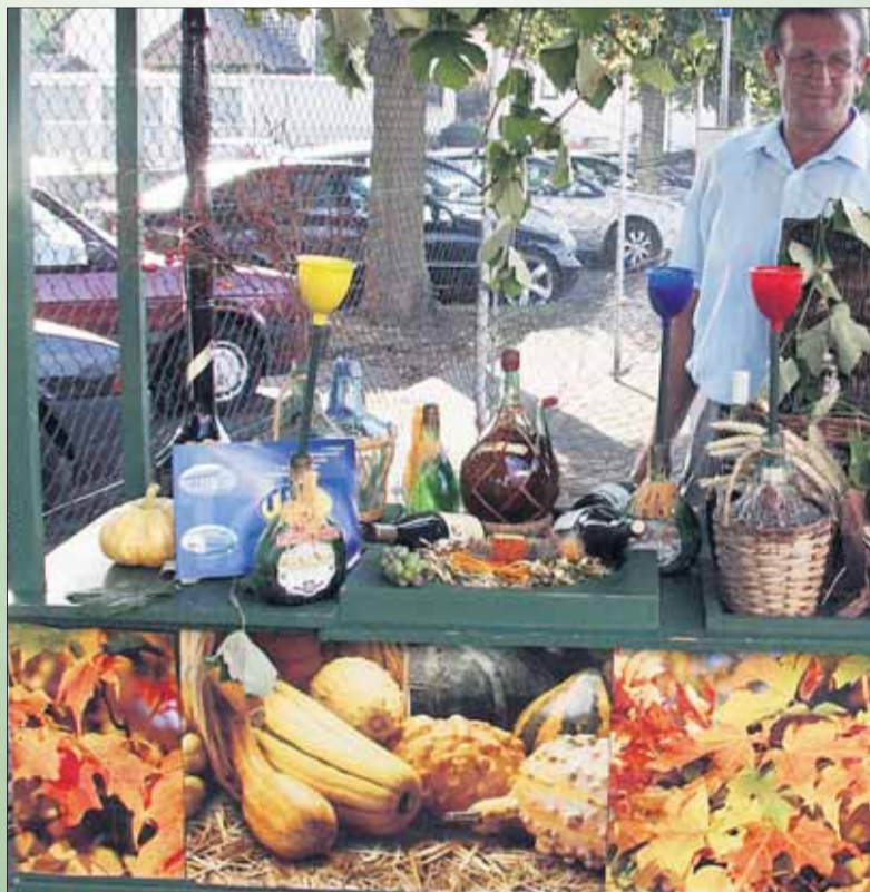
Qualität, die man schmeckt - und dann noch einen guten Wein. Das Angebot hierzulande ist allemal ausgezeichnet.