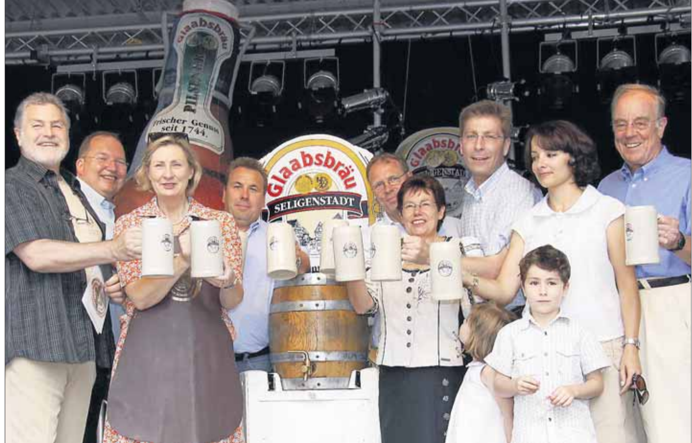
Bieranstich beim Glaabsbräu-Hoffest am Wochenende: Klar, dass da sämtliche Prominenz vertreten war und sich die Familie Glaab freute. beko/Foto: Hampe

Froschhausen - Der Vereinsring Froschhausen, die Dachorganisation aller 32 Vereine, Verbände und Organisationen im Stadtteil Froschhausen, kann in diesem Jahr seinen 30. Geburtstag feiern. Neben der Durchführung eines Rathausfestes am Sonntag, 6. September, und einer Ausstellung in den Räumlichkeiten des alten Rathaus, soll das Jubiläum mit einer akademischen Feier würdig gestaltet werden. Diese Feier findet am Sonntag, 20. September, um 10.30 Uhr im Bürgerhaus Froschhausen statt. Die Vereine und Verbände werden gebeten, in ihrer Delegiertenstärke an der Feierstunde teilzunehmen.