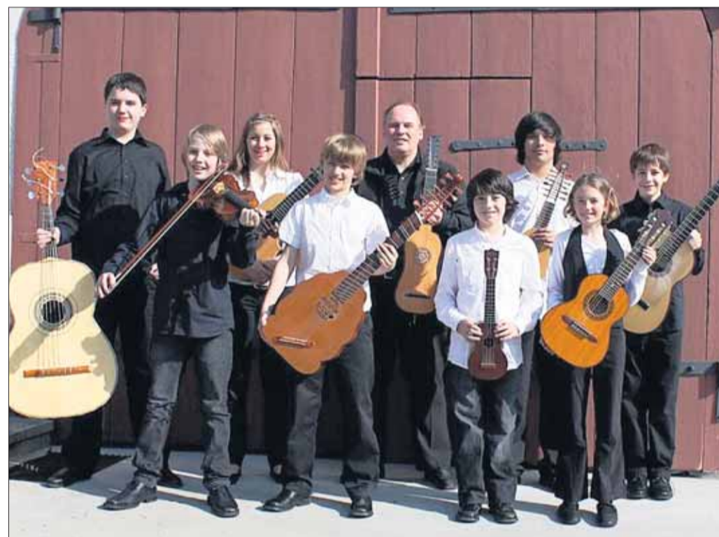
Das Schweizer Ensemble La Volta ist Anfang September zu Gast in Seligenstadt.

Ostkreis (red) - Am Samstag, 5. September, erreicht das Jubiläumsjahr der Musikschule Seligenstadt-Hainburg-Mainhausen einen weiteren Höhepunkt. Das bekannte Schweizer Musikschulensemble La Volta ist zu Gast in Seligenstadt und gibt um 18 Uhr in der evangelischen Kirche an der Aschaffener Straße 105 ein Konzert.