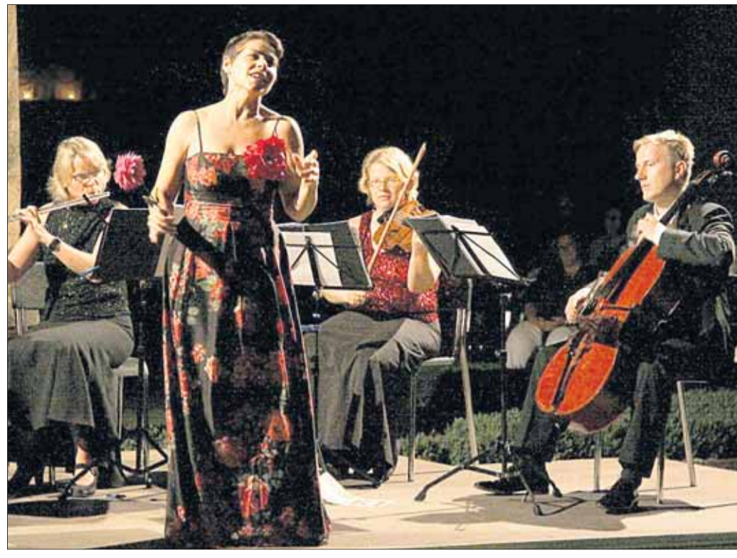
Für eine musikalische Sommernacht sorgte der Kulturring mit Musik im Kreuzgang.

Musik im Kreuzgang und die Sonne lugte hervor