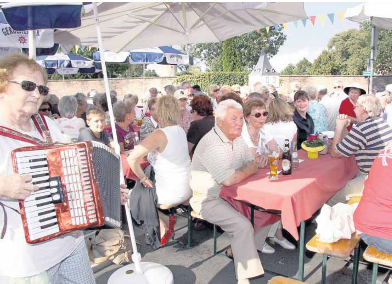
Zugunsten von „pro interplast“ fand am Samstag das Straßenfest am Obertor auf dem Parkplatz vor dem Anker statt und es gab auch Live-Musik.