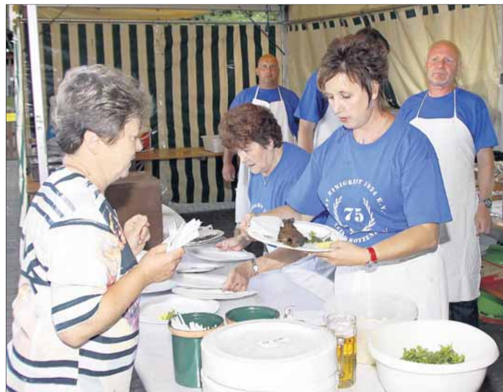
Zum Forellenessen hatte der Angelsportverein Einigkeit Klein-Krotzenburg an den See geladen und weil viele kamen, hatten die Helferinnen und Helfer auch viel zu tun.