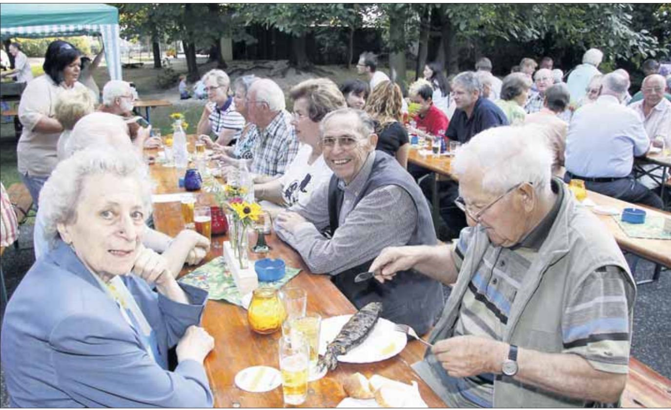
Ihr traditionelles Sommerfest feierten die Aquarienfrende Froschhausen am Wochenende am Maximilian-Kolbe-Haus. Gebackene Forellen durften da natürlich nicht fehlen.

weis und den evtl. schon vorhandenen Blutspenderpass mitzubringen. Alle Spender werden in gewohnt freundlicher Atmosphäre erwartet und für mitgebrachte Kinder ist während der Blutspende sogar eine Spielecke mit Betreuung eingerichtet. Vielleicht gelingt es, auch Verwandte, Freunde und Kollegen von der Wichtigkeit der Blutspende zu überzeugen und zu diesem Termin mitbringen. Wichtig für die eigene Gesundheit: zwischen zwei Blutspenden müssen 56 Tage vergangen sein.