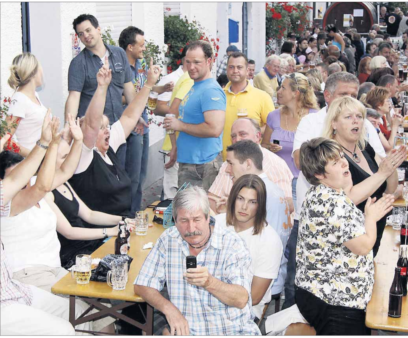
Sonnenschein, Non-Stop-Live-Musik und eine super Stimmung - das Hoffest der Seligenstädter Glaabsbräu am vergangenen Wochenende geriet einmal mehr zur Attraktion und das feierten die Besucher. beko