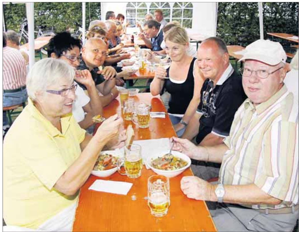
Der Hainstädter Kleingartenbauverein feierte sein Sommerfest mit dem „Tag der offenen Tür“. An allen 7 Festtagen gab es die berühmte Gartensuppe sowie leckeres vom Grill. Dazu fanden sich viele Gartenfreunde und benachbarte Vereine aus der gesamten Region ein.

B. Nonn-Adams, den Termin vorzumerken. Alle Teilnehmer nehmen am Vormittag an einer einstündigen Führung durch das Kloster Eberbach teil und haben noch die Möglichkeit, den Klostergarten zu besichtigen. Nach einem gemeinsamen Mittagessen steht der Nachmittag zu freien Verfügung, z.B. für einen Rundgang durch die historische Altstadt Eltville mit Kurfürstlicher Burg, Die Rückfahrt ist um 17 Uhr vorgesehen. Karten sind bei der Seniorenberatung, Zimmer 1, im Rathaus zu erwerben. Verkaufszeiten: Montag bis Mittwoch 14 Uhr bis 16 Uhr.