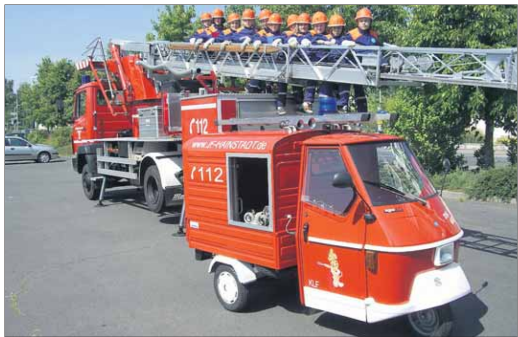
Dieses „KLF“ wurde mit tatkräftiger Unterstützung durch Hainburger Unternehmen in Eigenleistung erstellt und wird beim Sommerfest im Mittelpunkt stehen.

Hainstadt - Am kommenden Wochenende, 15. und 16. August, feiert die Freiwillige Feuerwehr Hainstadt wieder ihr traditionelles Sommerfest. Im Jahr 2009 begeht der Feuerwehrverein sein 120-jähriges Jubiläum, zu dem sie sich selbst beschenken. Im Juni wurde das neue Kinderlöschfahrzeug an die Jugendfeuerwehr übergeben. Dieses „KLF“ wurde mit tatkräftiger Unterstützung durch Hainburger Unternehmen in Eigenleistung erstellt. Auf Basis eines gebrauchten Piaggio APE Dreirads entstand ein kindgerechtes Feuerwehrfahrzeug. Dass das KLF kein Spielzeug sondern ein voll funktionsfähiges Einsatzfahrzeug ist, werden die Jugendlichen in einer Schauübung am Sonntagnachmittag beweisen. Das Bild zeigt das Kinderlöschfahrzeug mit der Drehleiter bei seiner ersten Bewährungsprobe, der Projektwoche mit Schülerinnen und Schülern der Johannes-Gutenberg-