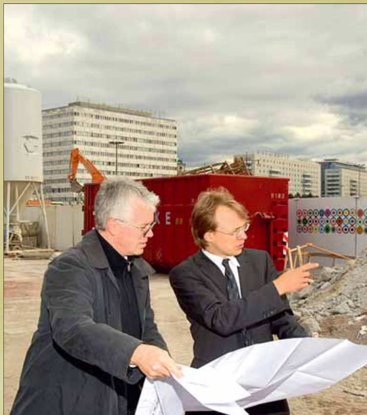
Ips/Cb. Außergerichtliche Tätigkeit – hier zu Architektenverträgen.

als nicht statthaft. Nach Vorgabe des Bundesverfassungsgerichts wurden hierfür 2008 vom Gesetzgeber Ausnahmen zugelassen, um besonderen Umständen in der Person des Auftraggebers Rechnung zu tragen, da dieser sonst Rechte zu verfolgen. Grundsätzlich ist Mandanten mitzuteilen, welche Gebühren voraussichtlich auf sie zukommen. Ein Mandat (Auftrag zur Vertretung) sollte deshalb nur erteilt werden, wenn Klarheit über die Kosten besteht. Üblicherweise wird bereits für die erste Rechtsberatung eine Gebühr fällig. Die Erkundigung nach Kosten mit fließendem Übergang zur Beratung in der Rechtssache selbst kann schon Kosten verursachen. Für die Erstberatung gilt gemäß RVG eine Höchstgrenze (190 Euro) zuzüglich nötiger Auslagen und Mehrwertsteuer. Erstberatung ist nur die wirklich erste Beratung ohne Folgeberatung.