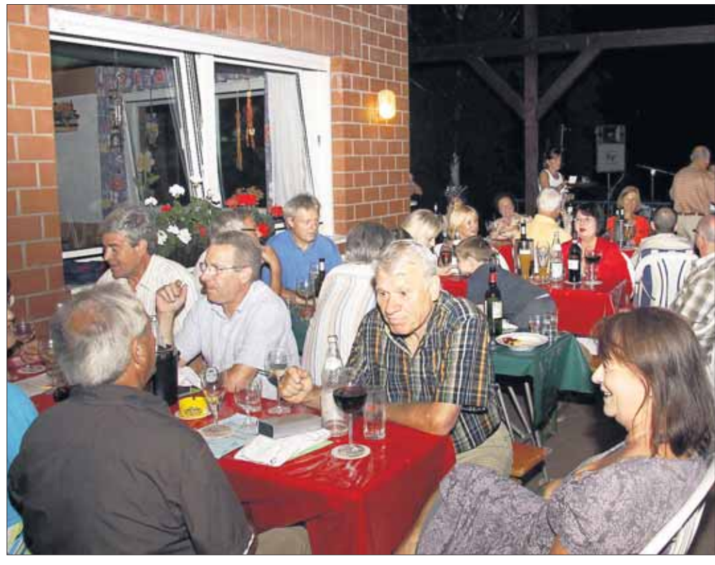
Der TC Hainstadt, bot eine italienische Nacht wie aus dem Bilderbuch: Fernando D. sorgte mit Live-Musik für die passende Untermalung. Im Rahmen der Veranstaltung wurden Mitglieder für 25- und 50-jährige Zugehörigkeit geehrt. Freilich fanden italienische Leckerbissen reissenden Absatz.

schoppen ein fröhliches Festtreiben ein mit Mittagessen und preiswerten Getränken bis zum Ausklang in den Abendstunden. Während all dieser Tage spielt nach altem Brauch der Kerbborsch ledig, trinkfest und arbeitsscheu eine tragende Rolle, dessen Vorstellung am Samstagabend wie jedes Jahr mit Spannung erwartet wird. Nach dem Motto „Die Sellistädter Kerb ist do, was sin die Leut' so froh“ wird er alle Gäste anfeuern, sich nach besten Kräften zu amüsieren und vom Alltag abzuschalten.