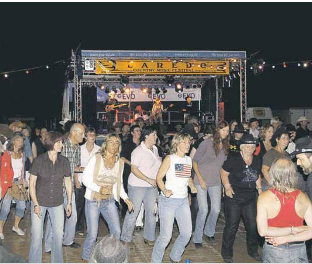
Bis zu 300 Line-Dancer auf einmal bewegten sich zu den Rhythmen der Bands, unter anderem der Formation „Buckles and Boots“ (oben). Einzig gültiges Zahlungsmittel auf dem Hainstädter Sportgelände war an den drei Tagen der „Laredo-Dollar“.