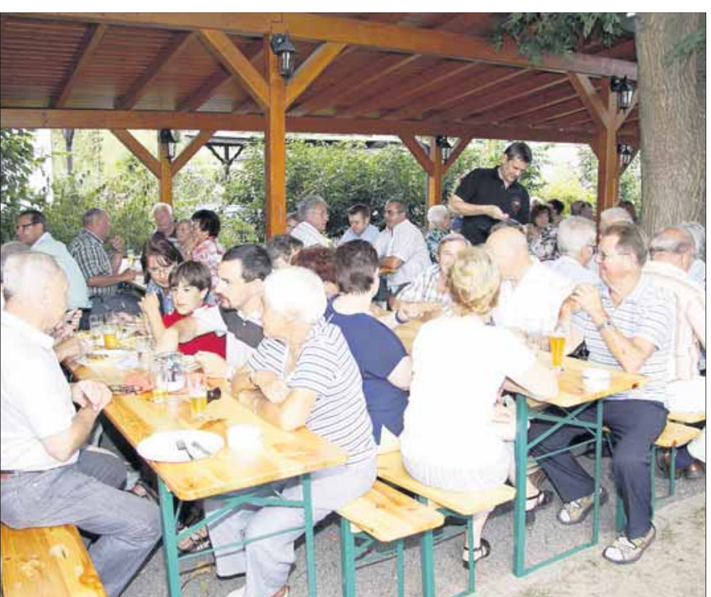
Kerbwochenende bei der Harmonie in Froschhausen: Zwei Tage lang feierte der Gesangverein zusammen mit Gästen im Biergarten. Am Montag standen Wellfleisch und Leiterchen sowie der traditionelle Blechkuchen am Nachmittag auf der Speisekarte.

Junior-Skater Seligenstadt - Am kommenden Sonntag, 23. August, erfolgt um 14 Uhr der Startschuss für die letzte „Junior-Tour“ in diesem Jahr. Eingeladen sind alle Kinder mit ihrer Begleitung. Start für die Junior-Tour ist am Getränke-Profi, Aschaffenburger Straße.