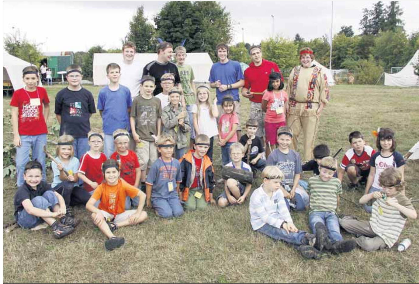
Im Ostkreis tummeln sich derzeit mehrere hundert Kinder bei den Ferienspielen. Bis zu 20 Betreuer hielten die Mädchen und Jungen in Seligenstadt auf Trab, wo in der ersten Woche 125 und in der zweiten Woche sogar 200 Kinder dabei sind. In der Einhardstadt lautet das Motto „Im Land der Indianer“. Entsprechend werden Indianerdörfer gebaut, Schmuck gebastelt, Tänze erlernt und Sport getrieben. Auch eine Übernachtung im Zelt steht für die jungen „Rothäute“ und ihre „Häuptlinge“ auf dem Programm.

Hochwassereinsatz in der Semper-Oper in Dresden und in New Orleans im Einsatz waren, werden einen 3m hohen Wasserfall in Richtung Main stürzen lassen. Ein Stromerzeuger, mit dessen Leistungsfähigkeit ein gesamter Straßenzug mit Energie versorgt werden kann, kommt zum Einsatz. Bitte umblättern.