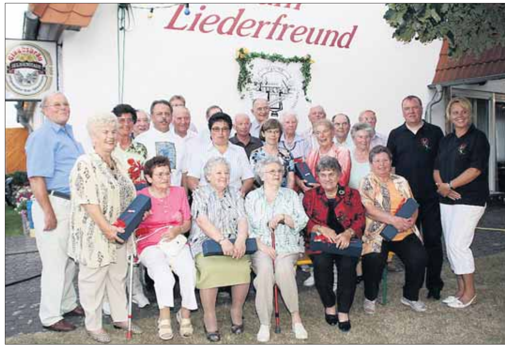
Dank gebührt diesen langjährigen Aktiven des GV Liederkreis.