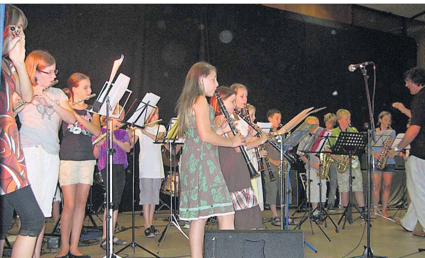
400 Besucher beim Sommerkonzert der Musikwerkstatt Mainhausen: Die über 80 teilnehmenden Schüler gestalten ein abwechslungsreiches Programm das von klassischen Vorträgen bis hin zur Pop- und Rockgeschichte dem Publikum die ganze Bandbreite der Schule wiedergab. Die Schüler aller Altersklassen haben sich sowohl in Einzelvorträgen, sowie in den Ensembles vor dem Auditorium ihre Nervosität nicht anmerken lassen. Ein herzliches Dankeschön an die Gemeinde Mainhausen, die das Bürgerhaus kostenfrei zur Verfügung stellte und der Technikfirma TEAM-Event-Service für die Beschallungs- und Lichtenanlage. Weitere Informationen zum Unterrichtsangebot der Schule erhalten Sie unter www.Musikwerkstatt-Mainhausen.de, oder in den Geschäftsstellen Mainhausen unter 897577 und in Froshhausen unter 7837