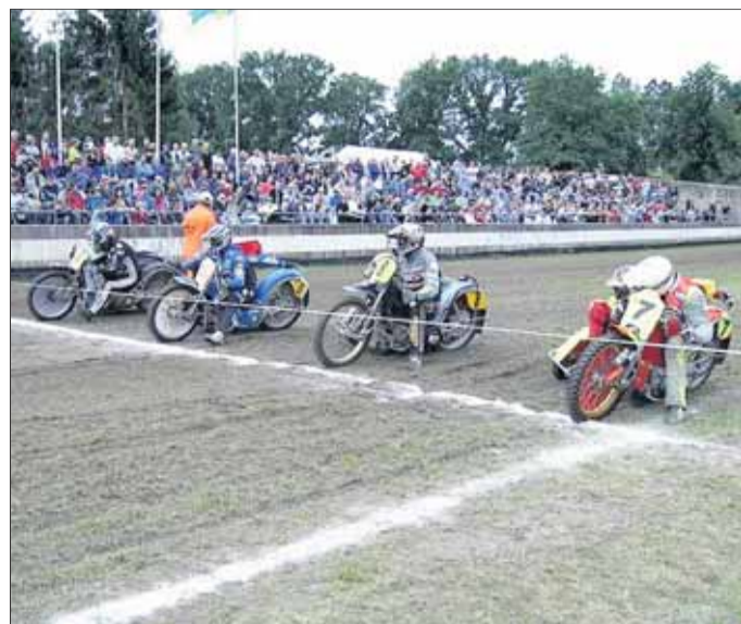
Rennsportfreunde freuen sich auf packende Duelle.

Klein-Krotzenburg - Auch in diesem Jahr wird sich am ersten Wochenende im September für die zahlreichen Motorsportfans der Weg nach Klein-Krotzenburg lohnen, denn auch bei der 49. Auflage der Klein-Krotzenburger Grasbahnrennen um den Goldenen Fasan des Maintals wird auf und an dem Grasbahnoval am Fasanengarten „volles Programm“ geboten. Das bedeutet, dass auch in diesem Jahr wieder ca. 70 Einzelstarter in sechs unterschiedlichen Klassen (nationale und internationale Solisten, nationale und internationale Gespanne sowie Schüler) in insgesamt 40 Einzelrennen um Punkte, Pokale und Siege kämpfen werden, wobei natürlich die Rennen der internationalen Solisten beim Kampf um den begehrten GOLDENEN FASAN DES MAINTALS im Mittelpunkt des Geschehens stehen.