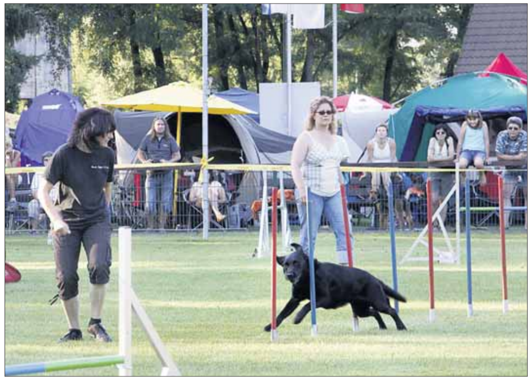
Mit mehr als 300 Teilnehmern war das Sommerfest der Mainflinger Hundesportler die größte Veranstaltung im Leistungsbereich des Hundesports in der gesamten Region. Ein Aufgebot an Hunden jeder Größe und Rasse, sowie unzählige sportliche Highlights machten die zwei Tage zum Erlebnis.

ten Teil nicht abgenommen wird, so dass der geplante Wirkungsgrad nicht 57 % erreicht, sondern bei 45 % bleiben wird. Ø Durch den Bau und den Betrieb des geplanten Blocks 6 werde ich in den Grundrechten auf Schutz meiner Gesundheit, meiner körperlichen Unversehrtheit und meines Eigentums verletzt. Ich fordere die Genehmigungsbehörde auf, diesen meinen Grundrechten Geltung zu verschaffen, mir eine lebenswerte Umwelt zu garantieren und diesen 6. Kraftwerksblock bei Staudinger nicht zu genehmigen. Weitere Einwendungen behalte ich mir vor. Im Übrigen nehme ich Bezug auf die Stellungnahmen der BI Stopp Staudinger, des BUND und der kommunalen Arbeitsgemeinschaft gegen Block 6 und schließe mich diesen inhaltlich an.“ Außerdem wurde ein Informationsblatt für persönliche Einwendungen erstellt, welches auch an den oben genannten Stellen ausliegt.