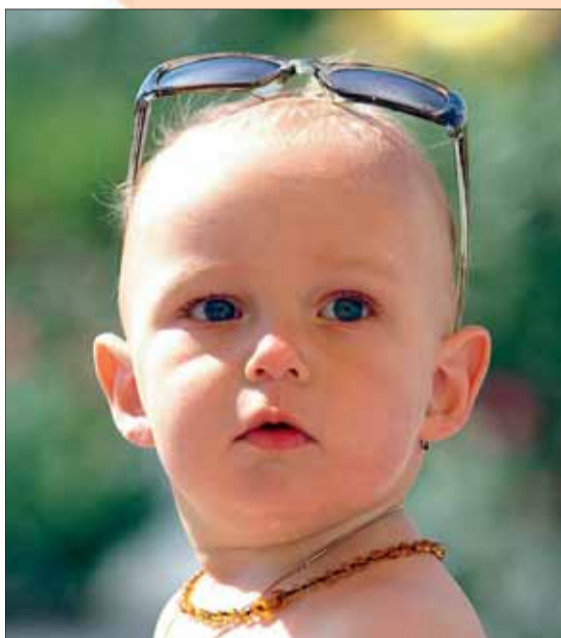
Ips/Du. Auch die jüngsten Urlauber haben schon ihre Ansprüche. Die gilt es bereits bei der Anfahrt zu berücksichtigen.

Ips/Du. Eltern, die mit ihrem Nachwuchs verreisen, können schon vor der Abfahrt dafür sorgen, dass die Reise entspannt verlaufen wird. Die wichtigsten Kleinigkeiten für unterwegs packen Eltern am besten in einen eigenen Rucksack und halten ihn griffbereit. Dazu zählen: Spiele für die Fahrt, das Kuscheltier des Kindes, ein Schlafkissen und eine Decke, ein Ersatzschnuller sowie feuchte Tücher. Wichtig ist es, den Tagesrhythmus des Kindes möglichst nicht zu stören. Kann es gut im Auto schlafen, fährt man am besten nachts oder am frühen Morgen los. Reisen macht hungrig. Deshalb brauchen Familien Proviant. Für unterwegs eignen sich kleingeschnittenes Obst und Rohkost.