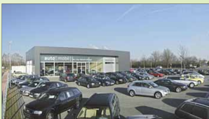
Marktführer in der Region: „auto:mobil“.