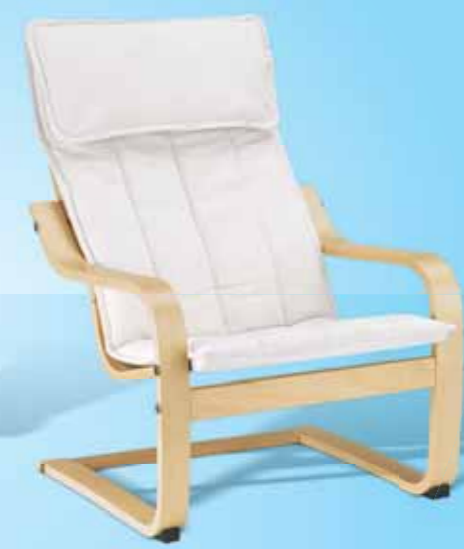
MINI POÄNG 14.99

HAJDEBY Rattansessel Für Kinder. Stapelbar. Rattan. Blau.