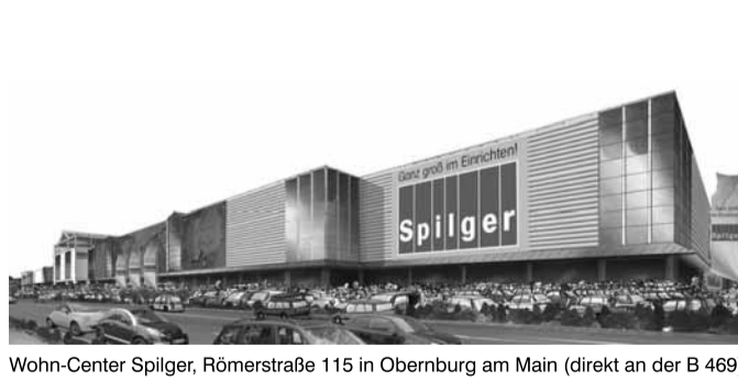
Wohn-Center Spilger, Römerstraße 115 in Obernburg am Main (direkt an der B 469)

bei der Matratzen- und Rahmen-Aktion 2:1 nochmals richtig Geld zu sparen - das heißt 2 kaufen, 1 bezahlen! (auf der Aktionsfläche im Erdgeschoss!) Viele triftige Gründe, den Endspurt im großen Markenmöbel-Renovierungsverkauf wegen Sortimentsbereinigung im Wohn-Center Spilger auf keinen Fall zu verpassen. Das Wohn-Center Spilger, Römerstraße 115 in Obernburg am Main, direkt an der B 469 ist wochentags von 10.00 bis 19.00 Uhr und samstags von 10.00 bis 18.00 Uhr geöffnet. „Nutzen Sie diese letzte Gelegenheit, alle Angebote sind auch in unserer Abteilung Junges Wohnen – Enjoy – gültig. Für das leibliche Wohl ist auch an den letzten Tagen des Renovierungsverkaufs gesorgt. In unserem Restaurant gibt's für unsere Kunden ein Schnitzel „Wiener Art“ mit Pommes frites für nur 2,50 Euro “, empfiehlt der Geschäftsführer abschließend (Gültig bis 8.8.09).