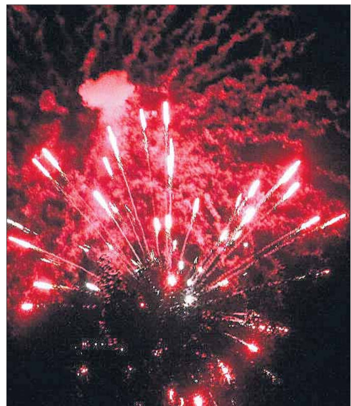
Höhepunkt war das brillante Feuerwerk in der Sommernacht!

tiven und Helfer hatte dafür gesorgt, dass zu dieser Zeit der Platz und die Straße davor schon so sauber und aufgeräumt war, als hätte es nie eine Beachparty gegeben. Die Akzeptanz der Veranstaltung in der Bevölkerung ist groß, denn ein verantwortungsvoller Umgang mit den gespendeten Erlösen wird ihnen schon immer von der Öffentlichkeit bescheinigt.