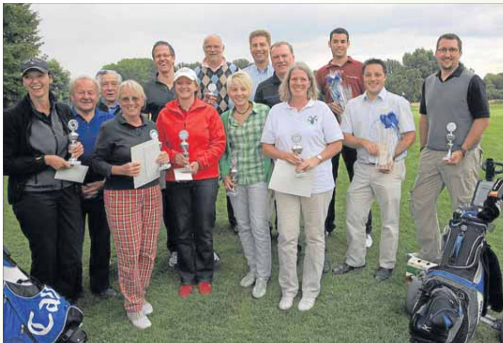
Stolze Sieger nahmen die Pokale des Golfclubs für ihre Leistungen entgegen.

Froschhausen - „Sieg ist heute mal nicht die Hauptsache. Die Teilnahme und damit das gegenseitige Kennenlernen von Vertretern aus den unterschiedlichsten Vereinen ist wichtiger. Dazu gehört auch Kurzweil und Vergnügen an diesem Spaßturnier“.