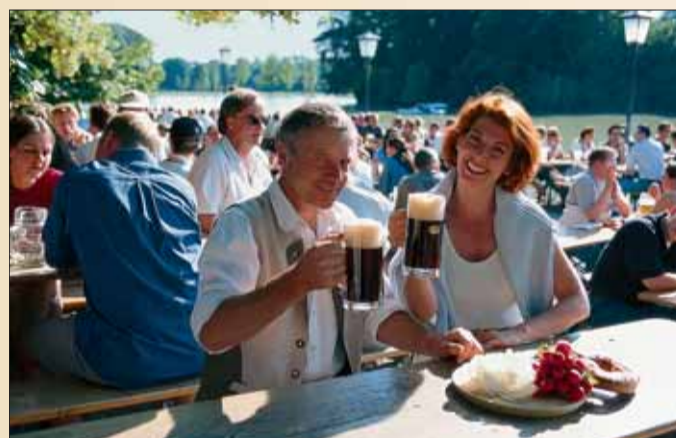
Gartenlokale sind bei Jung und Alt beliebt.

Für jeden Geschmack die richtige Biersorte