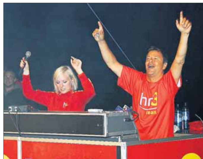
Die HR-3-Moderatoren trumpten mächtig auf!

aber im Vergleich zu den letzten Parties dieser Art, etwas kühleren Witterung, wagten sich nur die Mutigen, zum Tanzen, Planschen, Singen und Feiern mit roten HR-Bällen ins Wasser, hatten da aber genauso ihren Spaß, wie die große Mehrheit der Gäste, die das Feiern auf dem trockenen Strandbereich vor-