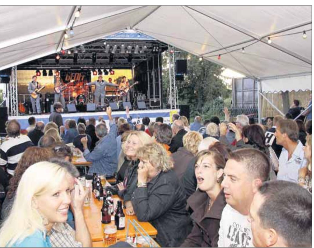
Mehr als 400 Gäste feierten begeistert das DRK-Sommernachtsfest in Hainstadt mit „Geoff and the Magic Tones“. Bereits zu Beginn füllte sich die Tanzfläche während Geoff als „Pilzkopf“ verkleidet die „Haare schön“ hatte. Das Tanzfieber grasierte bis zur letzten Zugabe unentwegt. Während der ersten Musik-Pause hatte das DRK in der Bar eine „Happy Hour“ die so gut ankam, dass sogar kurz die Hütchengläser gingen. Ein toller Abend bei trockenem Wetter in schöner Atmosphäre, wer da war, freut sich schon auf nächstes Jahr.