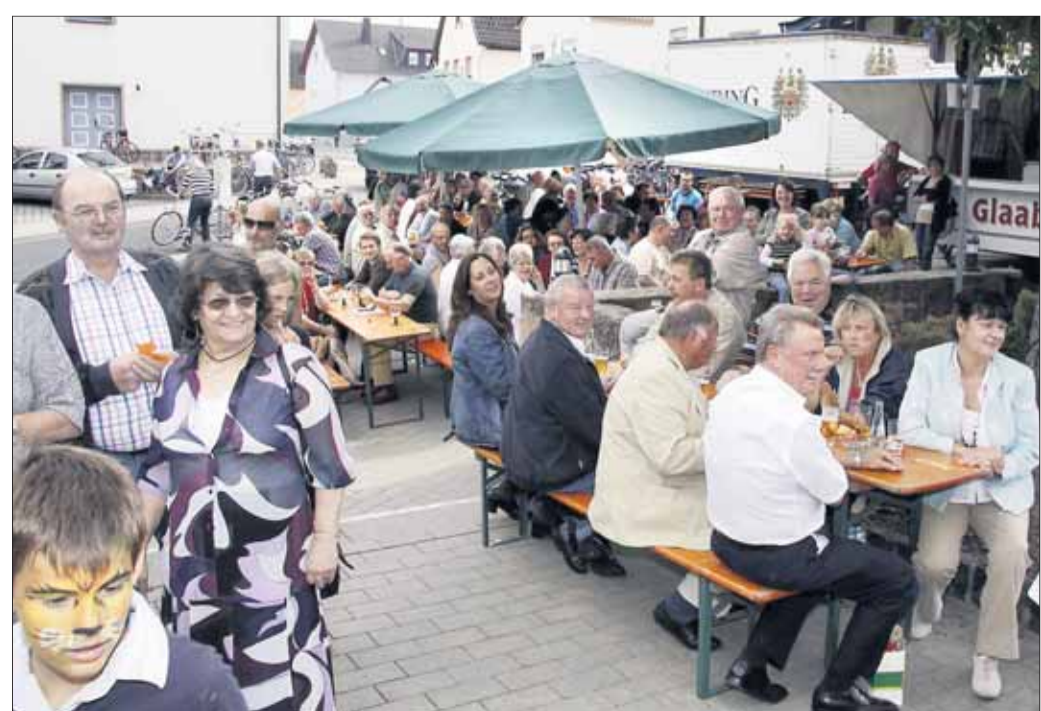
Sankt Kilianus in Mainflingen feierte sein Pfarrfest im Wetterglück: Nach dem Hochamt, das der Kirchenchor musikalisch begleitete, beteiligten sich viele Gemeindemitglieder an der Prozession durch die Straßen des Ortsteils. Danach wurde rund um's Pfarrheim ausgelassen gefeiert.

Mainflingen - Zufrieden zeigte sich die Polizei am Wochenende mit dem Verlauf der schon traditionellen Beach-Party in Mainflingen. Mit geschätzten 15.000 Besuchern war die Fete für den Veranstalter wieder ein ziemlicher Kraftakt, der aber in gewohnter Weise souverän gehandelt wurde. Allorts präsent Ordner sorgten während des ganzen Verlaufs für ein harmonisches Miteinander, so dass für die ebenfalls vor Ort anwesenden Ordnungshüter nichts Nennenswertes zu tun war. Lediglich viermal waren die Beamten in der Pflicht, einzuschreiten. Ein Party-Gast war betrunken im Auto nach Hause unterwegs und wurde aus dem Verkehr gezogen; einen weiteren traf das gleiche Schicksal, denn er hatte wohl außer dem Alkohol auch noch Kontakt mit Drogen gehabt. Nicht mit dem Wagen, aber mit kleineren Rauschgiftmengen zum Eigenverbrauch wurden zwei Festbesucher getroffen und entsprechend „betreut“.