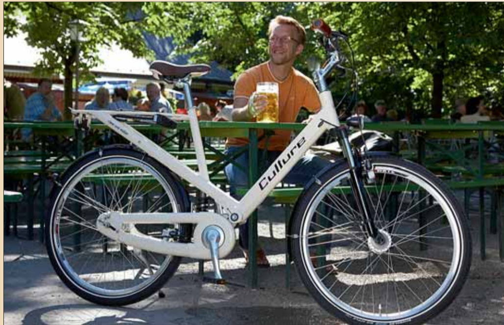
Per Rad in den nächsten Biergarten – eine hervorragende Kombination.

auch die Reflektoren und Lampen umfassen sollte, und der fröhlichen, pannenfreien Tour ins Grüne steht nichts mehr im Wege.