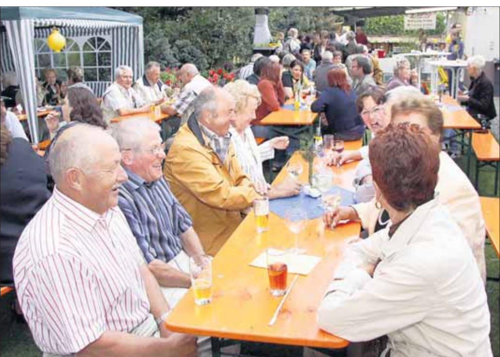
Mit seinem „Lichterfest“ geht der katholische Musikverein Zellhausen neue Wege in der Gestaltung seines Sommerfestes. Erstmals wurde das Fest, nicht wie üblich vor dem Pfarrheim auf dem Platz „Unter den Linden“ gefeiert, sondern hinter dem Pfarrheim im Pfarrgarten. Durch besondere Lichteffekte wurde ein angenehmes und schönes Ambiente für die Festbesucher geboten.

Mit 106 „Sachen“ in der „60er Zone“ unterwegs: