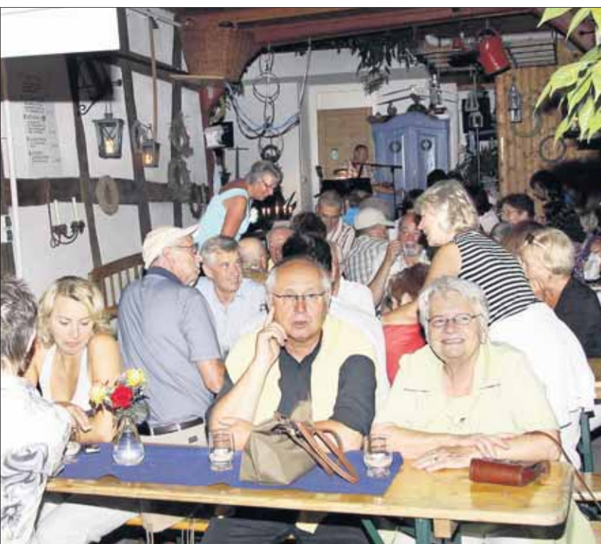
In den Höfen und Scheunen fanden sich begeisterte Gäste ein, die die Gelegenheit nutzten, um auch einmal „hinter die Kulissen“ der Altstadt zu schauen.