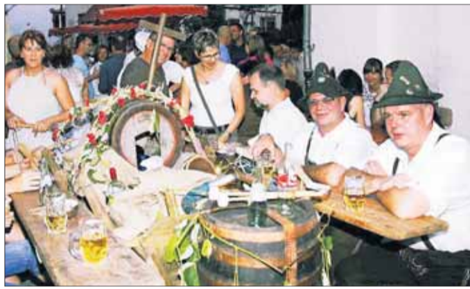
Eine „ganz eigene Zunft“ bilden die Jagdhornbläser.

Seligenstadt - Zahlreiche Besucher kamen am Wochenende in die Stadt und erlebten an beiden Tagen eine abwechslungsreiche Reise durch das gesellige Leben der Seligenstädter Zünfte. Der Heimatbund und die teilnehmenden Vereine und Gruppen knüpften mit dem Fest an bekannte Veranstaltungen wie „Unsere Stadt feiert“ anlässlich der Geleitsfeste und dem „Altstadtfest“ an. An 18 Zunftständen wurde Köstliches und Defti-