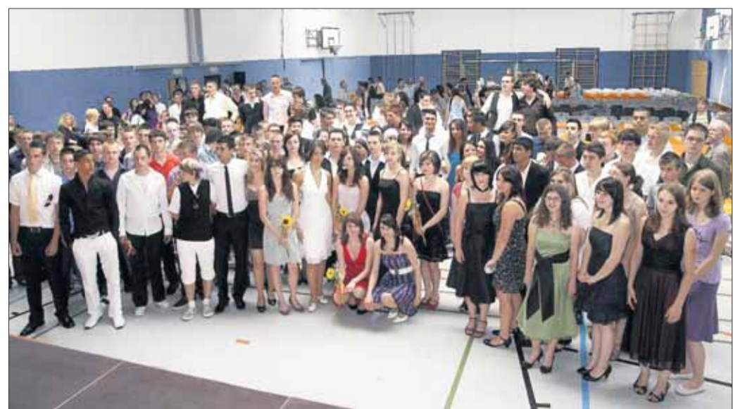
Ihre Abschluss-Zeugnisse nahmen diese Schüler der Merianschule entgegen.