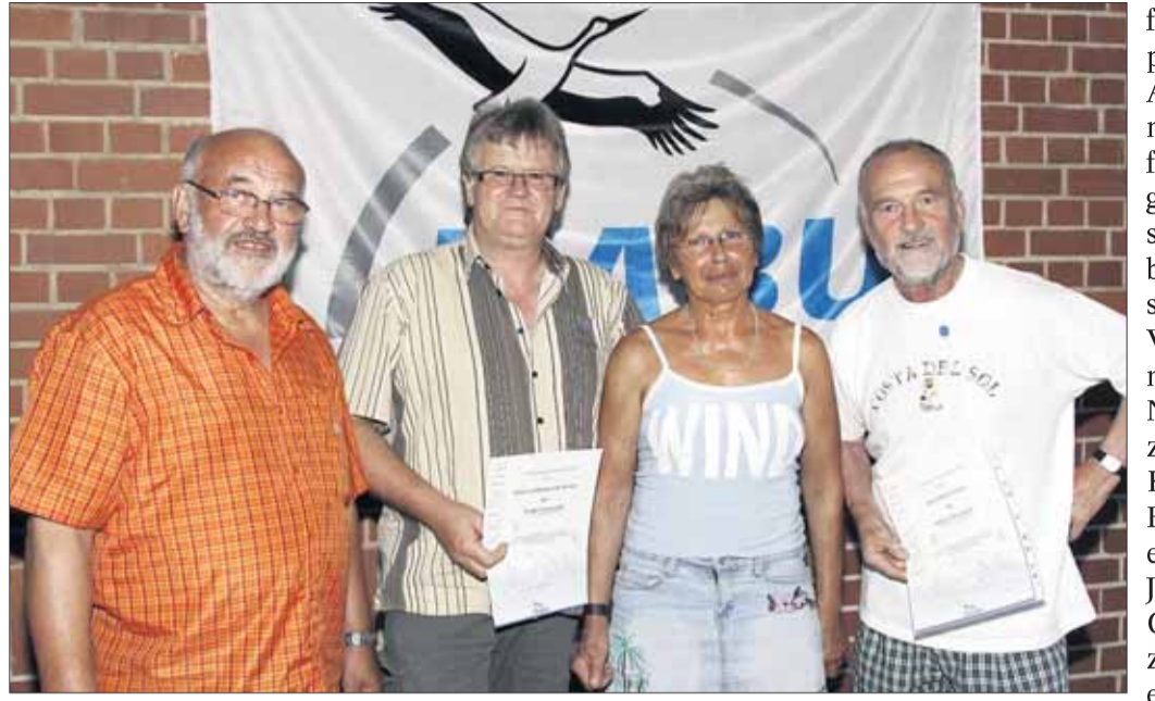
Über die Würdigung ihrer langjährigen Arbeit freuten sich die NABU-Jubilare.