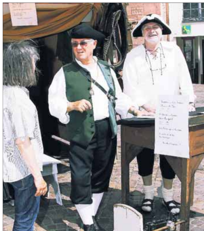
Bekannte Persönlichkeiten auch beim „Fest der Zünfte“ in verantwortungsvoller Stellung.