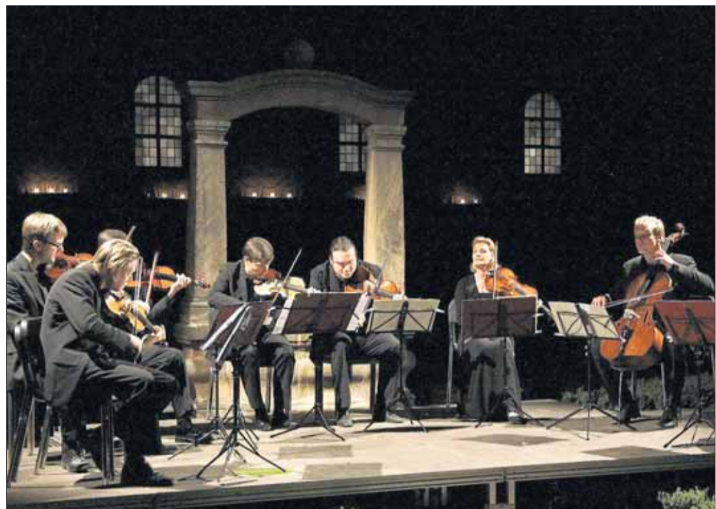
Das Henschel-Quartett bot erstklassige Klagerlebnisse im historischen Kreuzgang.