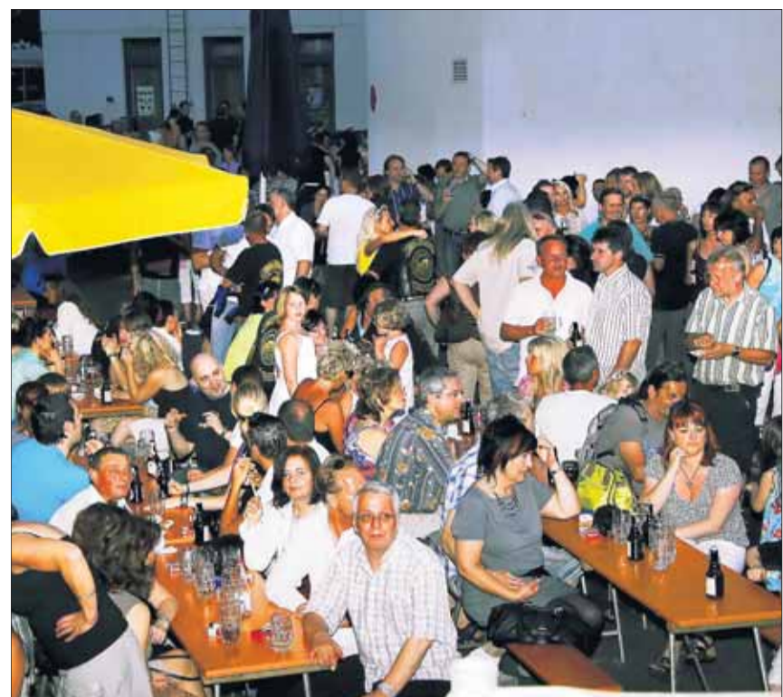
Die „Blauen“ (Sportvereinigung) sorgten im Brauereihof für flotte Bewirtung und gaben außer Bier auch reichlich Musik aus.