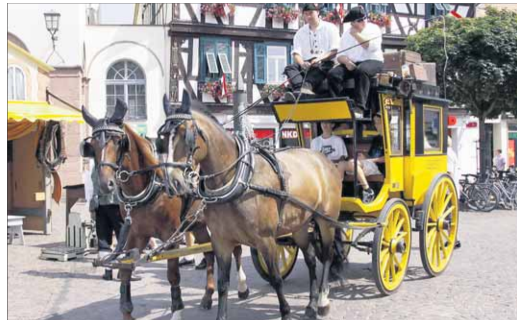
Stilvolle Stadtrundfahrten in dieser historischen Postkutsche aus dem Heimatbund-Fundus gehörten zu den stark nachgefragten Attraktionen beim „Fest der Zünfte“.

hell“ der Privatbrauerei Glaab lockten viele Genießer in die Einhardstadt. Untermalt wurde das Ganze an vielen Stellen von Live Musik, die bis spät in den Abend zur Unterhaltung der Besucher beitrug. Die Seligenstädter Jagdhornbläser hatten sich eigens eine fahrbare Festgarnitur auf einem Leiterwägelchen gewerkelt und zogen unterstützt mit Trommel und Pauke von Hof zu Hof und ließen ihre Jagdhörner erklingen. Die Fanfarenbläser der TGS waren an vielen Stellen in der Stadt mit ihrem klangvollen Auftritt zu hören. Auf dem Marktplatz standen zwei Kutschen für Fahrten zur Verfügung, eine offene Reisegesellschaftskutsche mit Stadtführung. ● Seite 2