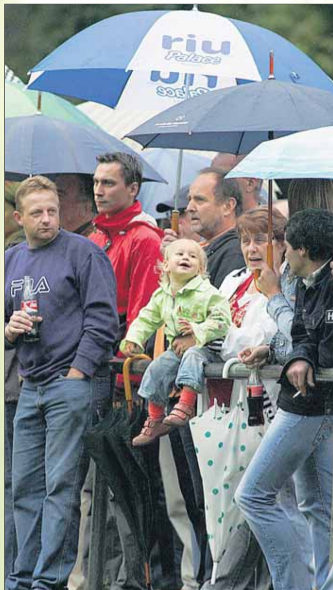
Bei Wind und Wetter: Die Zuschauer halten dem Mainpokal seit 36 Jahren die Treue.

Versicherung, Finanzierung, Kapitalanlage, Bausparen, Immobilien