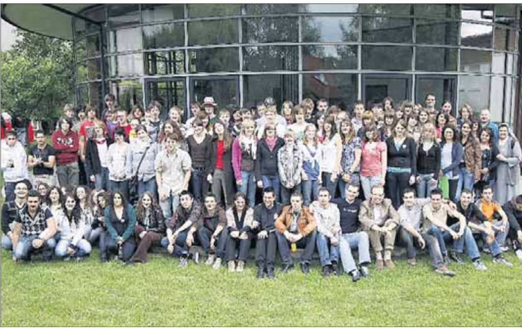
Rund 130 Jugendliche und Erwachsene nahmen am Weltjugendtag in St. Marien teil.

Selgenstadt - Sydney, Seligenstadt, Madrid - die Aufzählung dieser Orte mag zunächst überraschen, und doch stehen sie für eine gemeinsame Idee: Jugendliche verschiedener Nationalitäten treffen zusammen, um ihren Glauben und ihre Hoffnung,