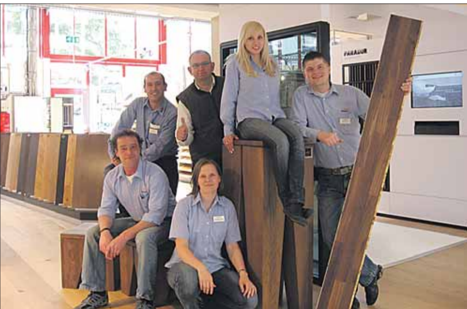
Das Kompetenzteam heißt seine Kunden mit tollen Eröffnungsrabatten bis zu 48% und einer beeindruckenden Fußbodenausstellung herzlich willkommen.

HolzLand Becker Albrecht-Dürer-Straße 25 (direkt an der B 448) 63179 Obertshausen Telefon 0 61 04 / 95 04-0 www.holzlandbecker.de