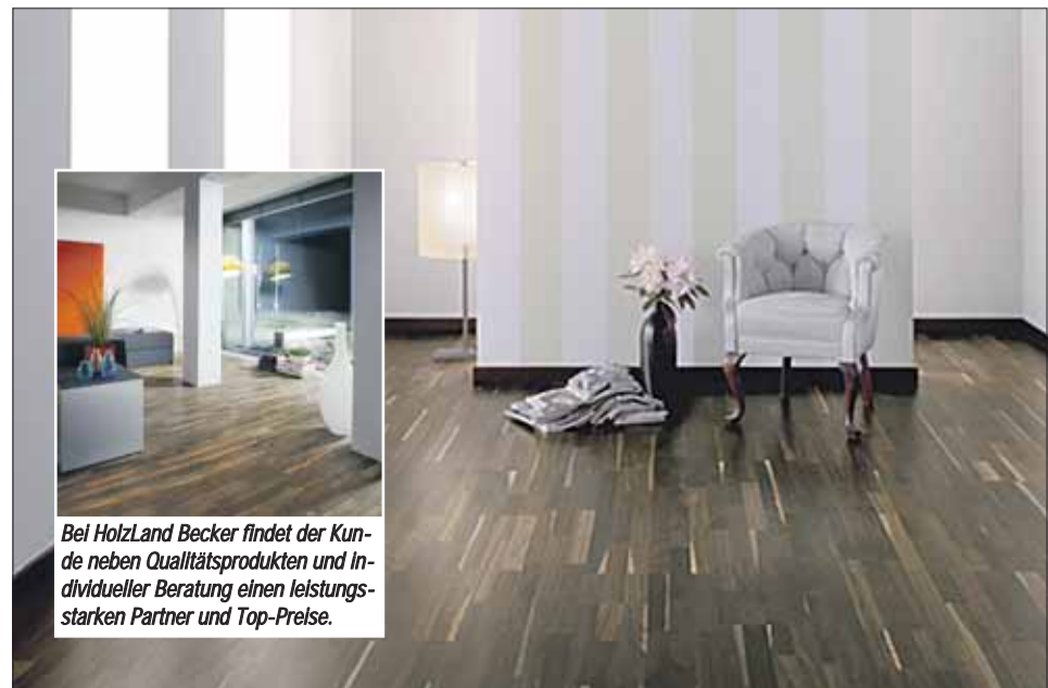
Bei HolzLand Becker findet der Kunde neben Qualitätsprodukten und individueller Beratung einen leistungsstarken Partner und Top-Preise.

Internationale Messe-Neuheiten, attraktive Verbesserungen und die neuesten Trends untermauern HolzLand Becker als führenden Anbieter rund um das Thema Fußboden im Großraum Frankfurt.