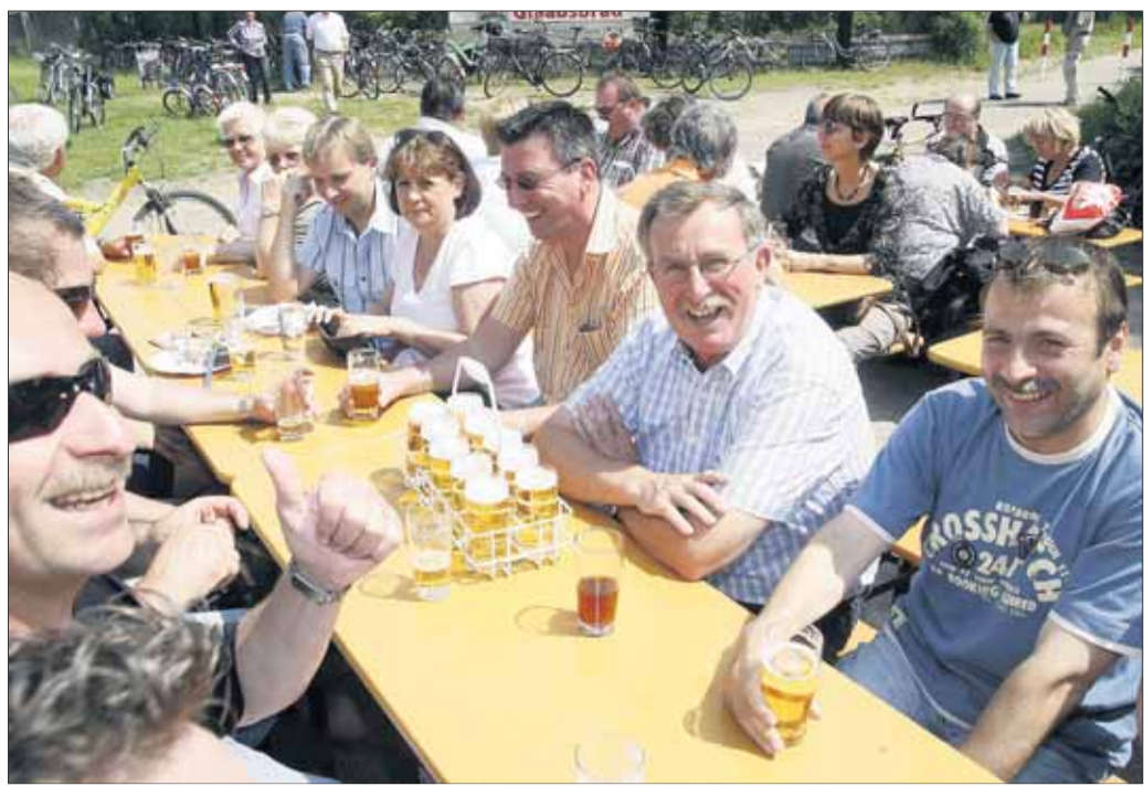
Am Vatertag hat das Schlachtfest beim MSC Klein-Krotzenburg gute Tradition. Kaiserwetter begleitete das ausgelassene Festgeschehen am Fasanengarten und so gesellten sich nicht nur Vereinsmitglieder, sondern auch viele Ausflügler zu den Motorsportlern.

Klein-Krotzenburg - Das DRK Ortsvereinigung veranstaltet nach zwei Jahren Zwangspause (Witterung und Personalnotstand) am Pfingstmontag, 1. Juni, 2009 sein traditionelles Familienfest auf dem Schillerplatz in Klein-Krotzenburg. Das Fest beginnt ab 10 Uhr mit dem Frühschoppen, Mittagessen mit Steak, Erbsensuppe und Würstchen und zum Nachmittag Kaffee und selbstgebackenen Kuchen der Mitglieder. Das DRK hofft, dass viele Hainburger Mitbürger und Repräsentanten mit ihren Besuchen die Verbundenheit mit der Hilfsorganisation bekunden.