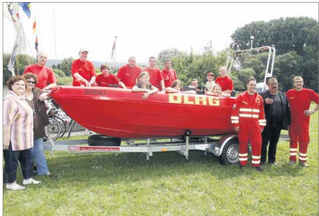
„Bernd“ heißt das neue Einsatzboot der Mainflinger DLRG.