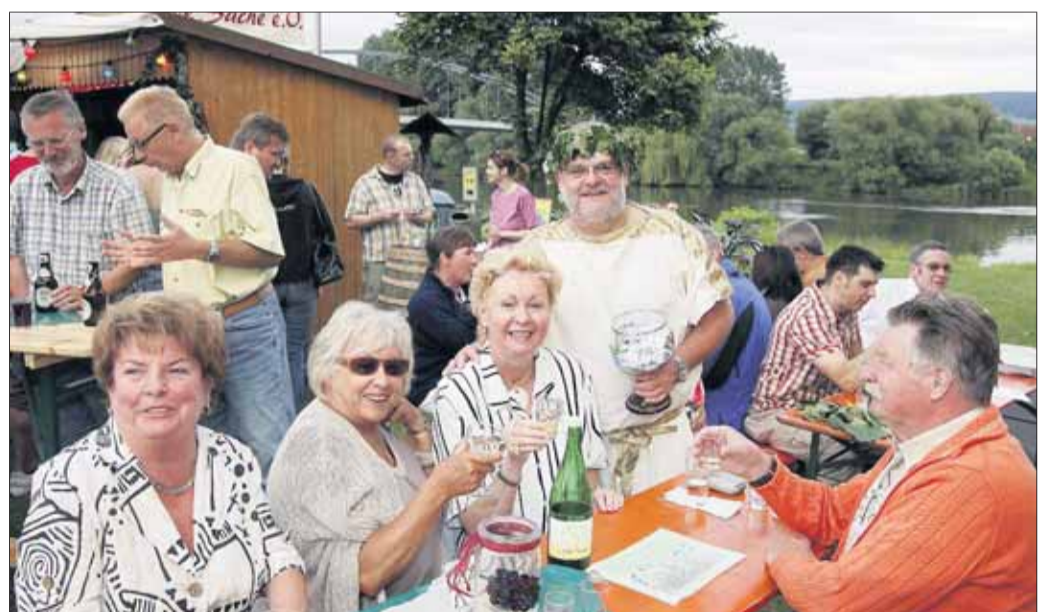
Ein gefeierter Erfolg wurde wieder „Wein am Main“ des Gude Sache e. V. Weingott Bacchus wachte über Weine und Weinselige und brachte puren Sonnenschein ans Mainflinger Mainufer.

markt.de Der Marktplatz für Deutschland.